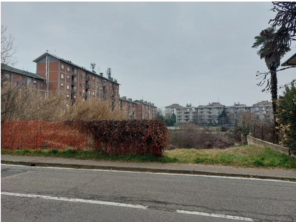
FOTO 2 – Foto da via Galimberti delle particelle 581-817-818 “LOTTO 3”