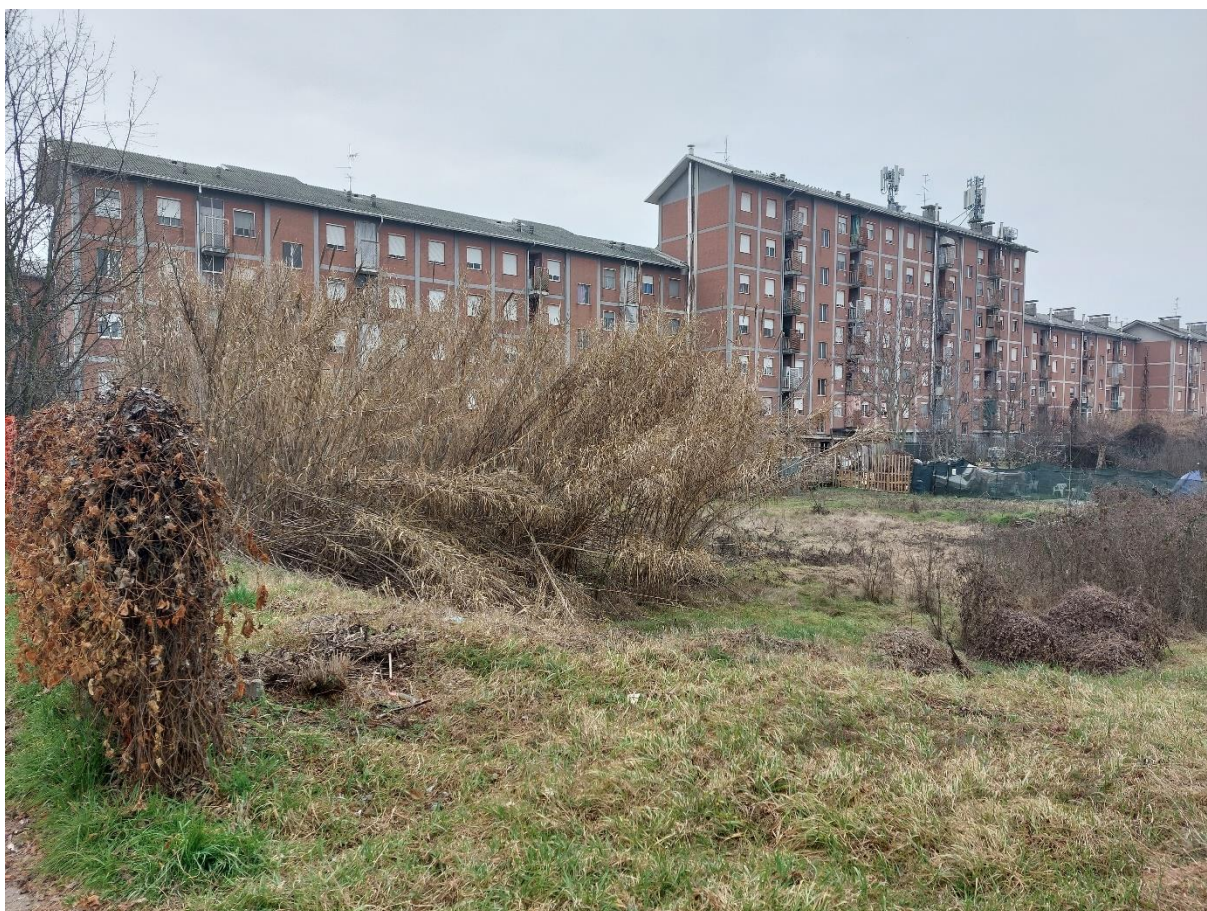
FOTO 4 – Foto da via Galimberti delle particelle 581-817-818 “ LOTTO 3 ”