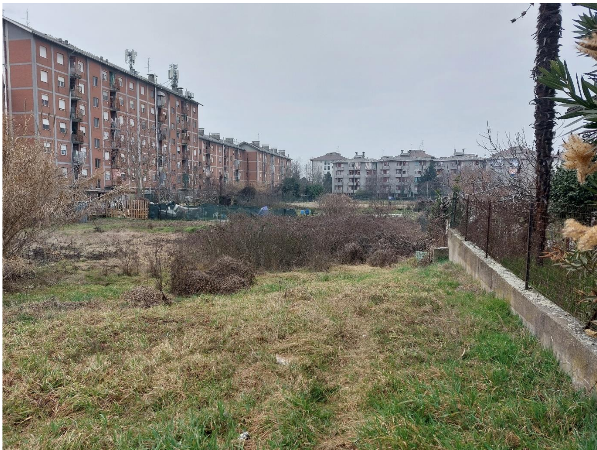
FOTO 3 – Foto da via Galimberti delle particelle 581-817-818 “ LOTTO 3 ”