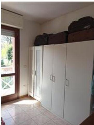
La camera da letto, con infissi in legno e vetrocamera