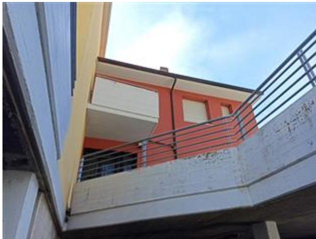
Uno dei due balconi, dalla corsia di accesso alle autorimesse (PSI)