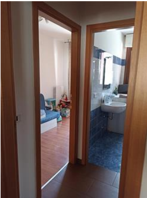
Il disimpegno della zona notte