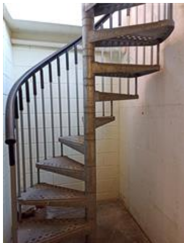
La scala a chiocciola esterna ed esclusiva, verso l'autorimessa (al PS1)

La scala a chiocciola esterna ed esclusiva, verso l'autorimessa Il piccolo scoperto di ingresso (al PT), con pavimento in gres