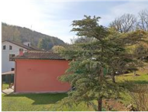
La vista dal balcone posto sul retro