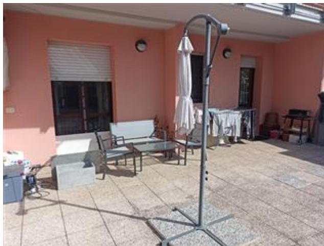
Lo scoperto, sul retro dell'edificio, rifinito con intonaco e tinteggiatura, e con pavimento in lastre