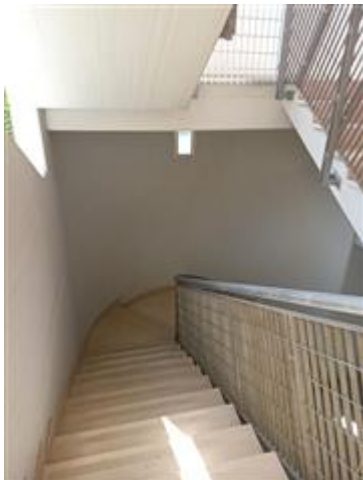
La scala condominiale aperta, verso gli accessori (al PSI)