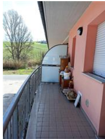
Uno dei due balconi, sul fronte principale, con pavimento in gres