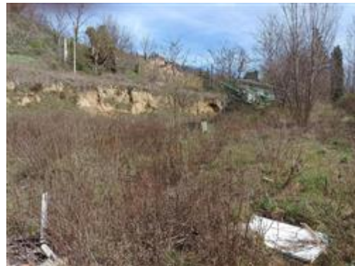
I terreni (Part. 663 e Part. 699): sullo sfondo, una gru in attesa di rimozione