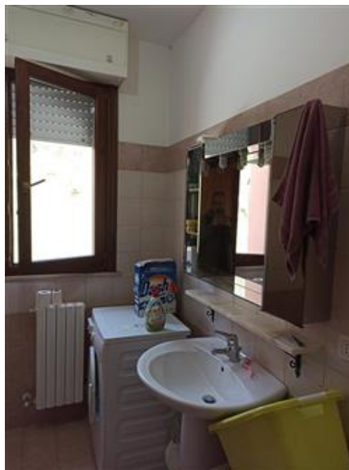
Il bagno, con infissi in legno e vetrocamera