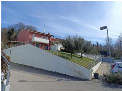
Il complesso, suddiviso in più unità immobiliari (10

L'intero edificio sviluppa 3 piani, 2 piani fuori terra, 1 piano interrato. Immobile costruito nel 2007.