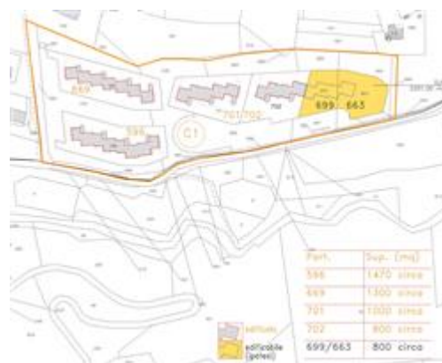
I terreni (campitura gialla) all'interno della zona CI, con ipotesi di edificabilità