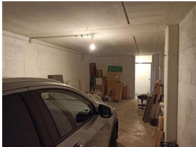
L'autorimessa (sub. 7), con finiture elementari