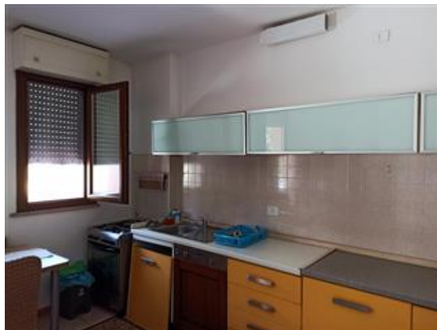
L'angolo cottura, nello stesso vano con ingresso, soggiorno e pranzo; rivestimenti in ceramica economica