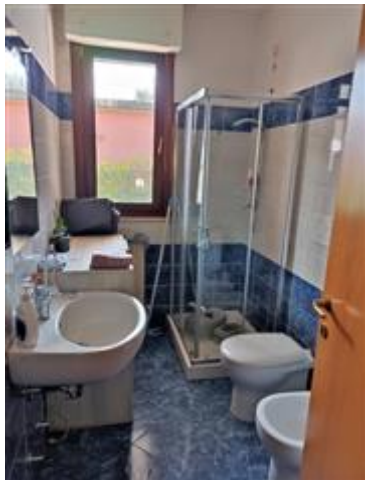
Il bagno, con rivestimenti in ceramica