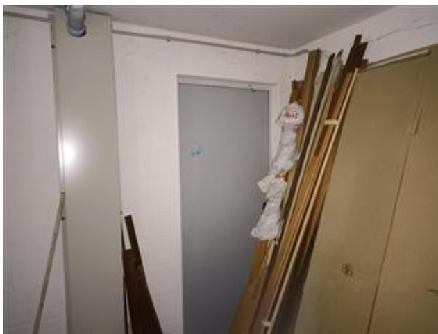
La cantina (sub. 5) comunicante con l'autorimessa (sub. 15), con finiture elementari