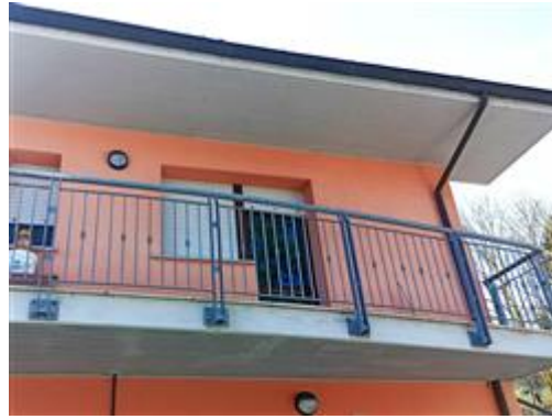
Uno dei due balconi, sul fronte principale, rifinito con intonaco e tinteggiatura