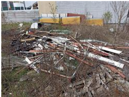
I terreni (Part. 699): materiale edile accumulato impropriamente