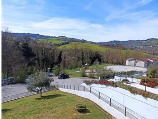
Il parcheggio e il panorama antistanti