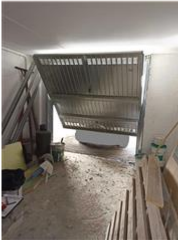
L'autorimessa (sub. 15), con finiture elementari