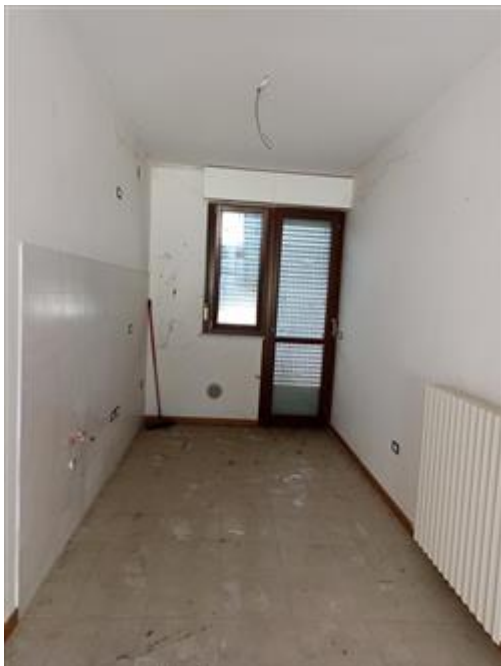
L'ampio angolo cottura; pavimento in piastrelle di un solo tipo per tutti gli ambienti (escluso il bagno)

SITUAZIONE LOCATIVA: Canone d'affitto (potenziale, minimo - da OMI, 2° sem. 2023) = €/mese 509,30.