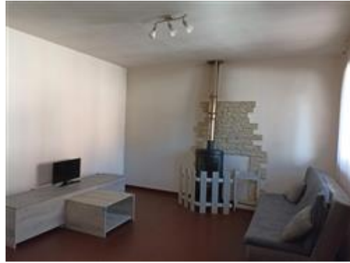
L'ambiente unico che comprende ingresso, soggiorno, pranzo e angolo cottura (stufa esclusa dal lotto)