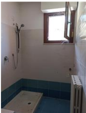
L'ampio bagno, con rivestimenti in ceramica