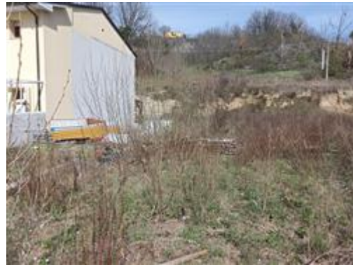
I terreni (Part. 699)