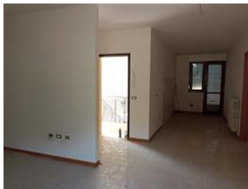
La zona giorno dell'appartamento (sub. 5)