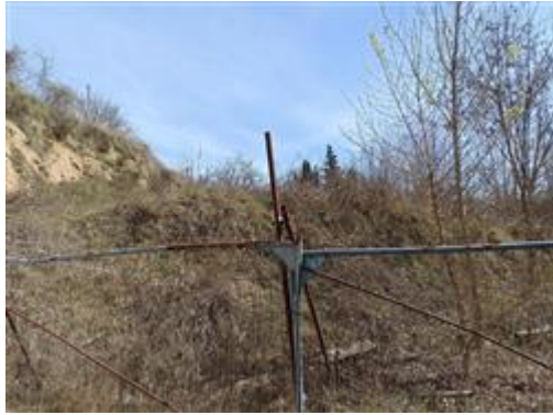
I terreni (Part. 663 sullo sfondo, e Part. 699)