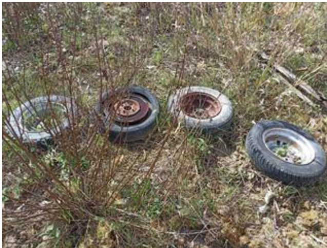
I terreni (Part. 663 e Part. 699): materiale accumulato impropriamente