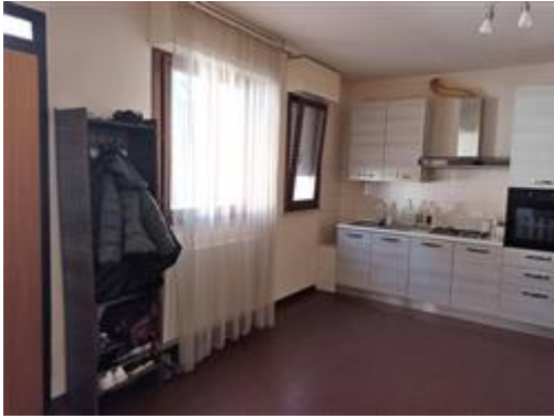
L'ambiente unico che comprende ingresso, soggiorno, pranzo e angolo cottura