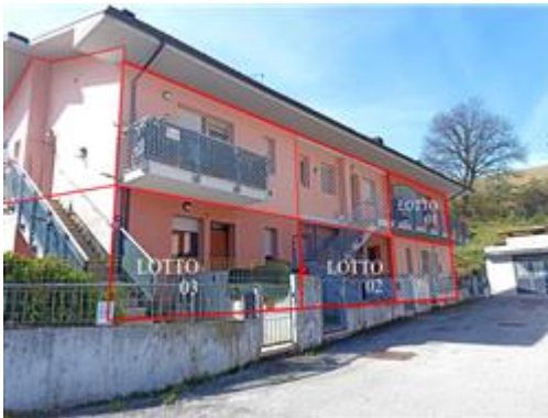
L'edificio principale, suddiviso in più unità immobiliari (6 appartamenti)

L'intero edificio sviluppa 3 piani, 2 piani fuori terra, 1 piano interrato. Immobile costruito nel 2004.