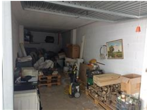
L'autorimessa (sub. 6), al piano sottostrada, con finiture elementari