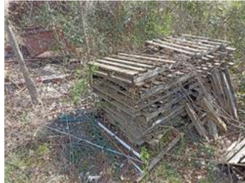
I terreni (Part. 663 e Part. 699): materiale edile in attesa di rimozione