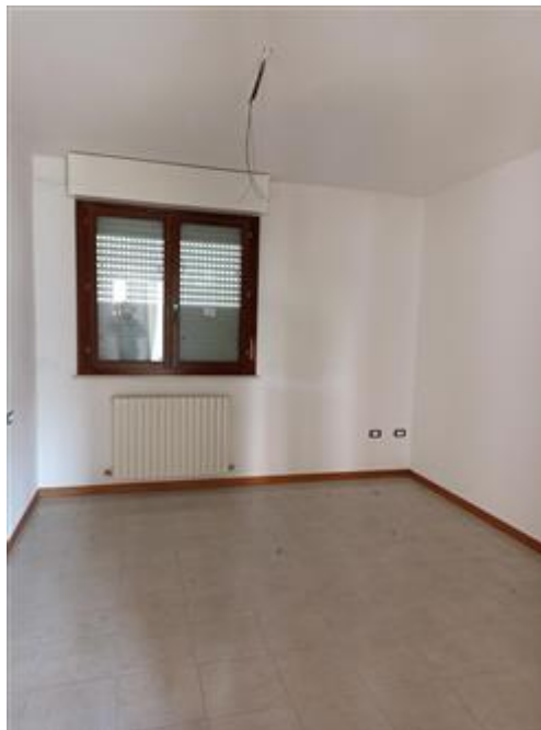
Una delle tre camere da letto, con infissi in legno e vetrocamera