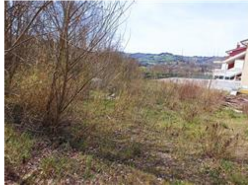
I terreni (Part. 699)