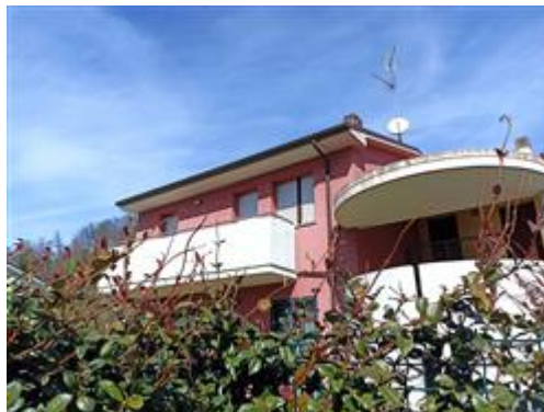
L'appartamento, al piano primo (sub. 15); finiture esterne con