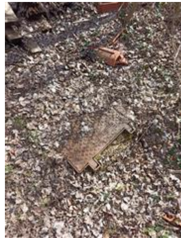
I terreni (Part. 663 e Part. 699): pozzetto di ispezione per gli impianti già realizzati