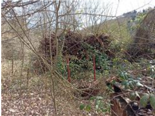
I terreni (Part. 699): materiale edile in attesa di rimozione

Accessibilità (da via pubblica): verso via S. Tommaso la distanza minima è di circa 10 ml. Il terreno si trova in posizione sopraelevata di alcuni metri rispetto a detta strada; trattandosi di un bene da trasformare, il dato è solo indicativo.