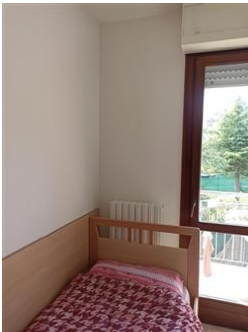
Un vano della zona notte, con infissi in legno e vetrocamera