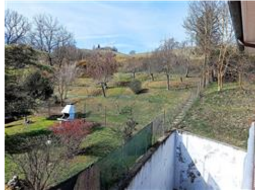
La vista dal balcone posto sul retro