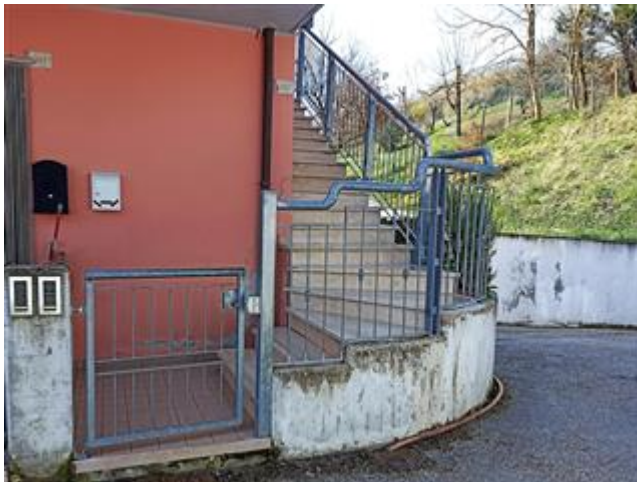
L'accesso a piano terra, con scala esterna fino al piano primo