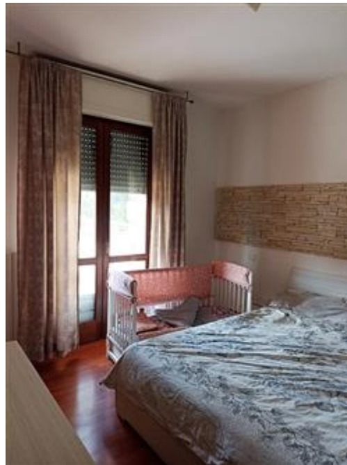
Una delle due camere da letto, con infissi in legno e vetrocamera, e parquet