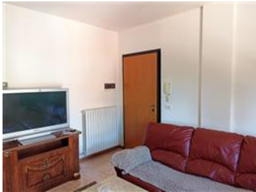
L'ingresso, con portoncino blindato, sul vano soggiorno-pranzo