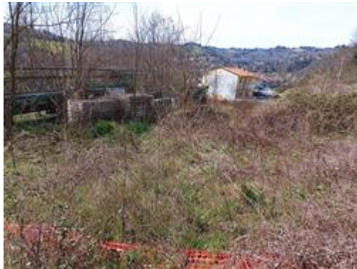
I terreni (Part. 663 in primo piano, e Part. 699)