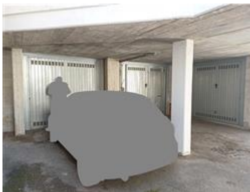
L'autorimessa (sub. 15)