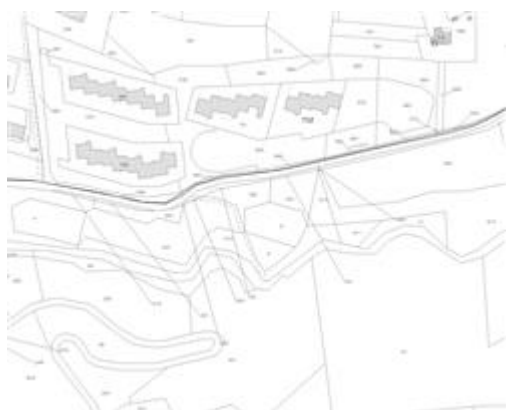
Estratto di mappa (F. 76)