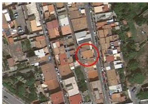
Quartiere in cui ricade l'immobile