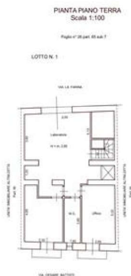
Planimetria Piano Terra