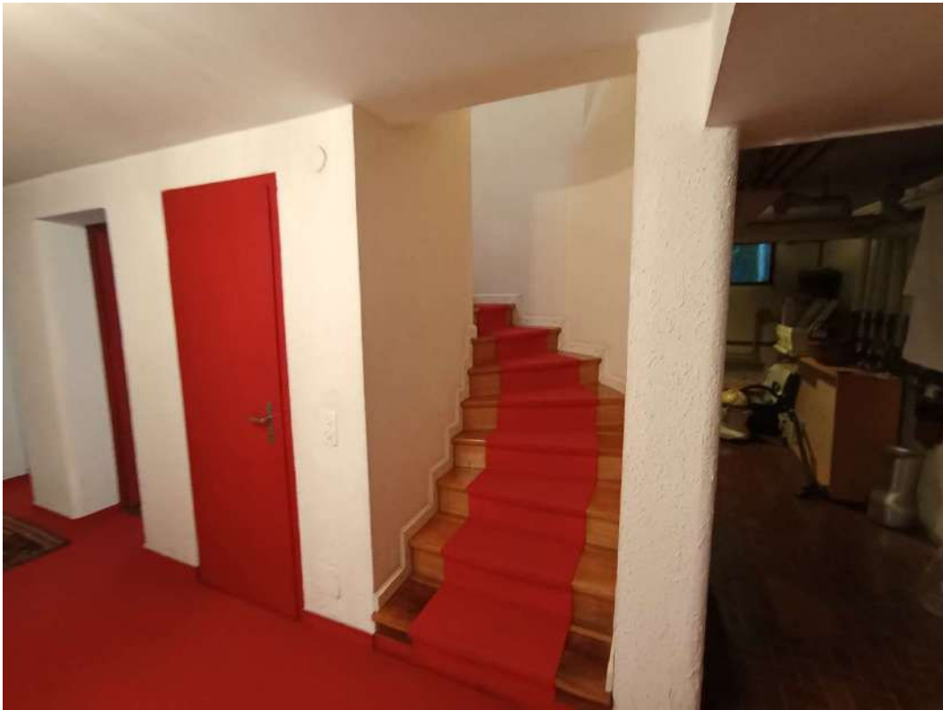
LOCALE STUDIO AL PIANO SEMINTERRATO