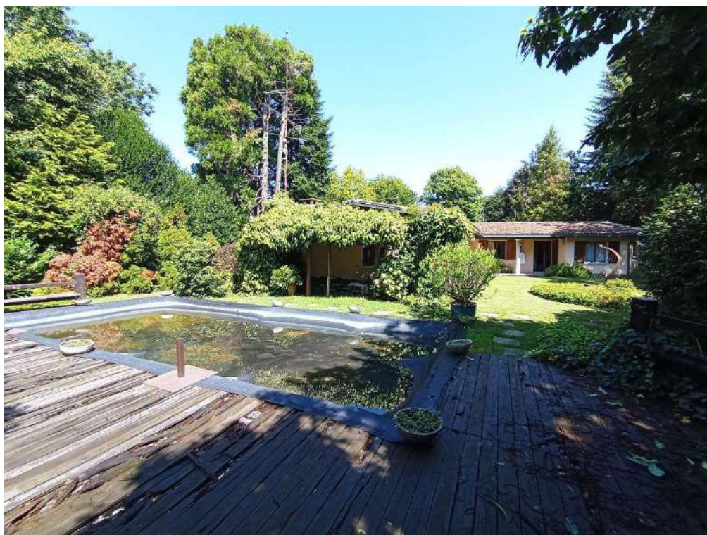
GIARDINO AREA INGRESSO