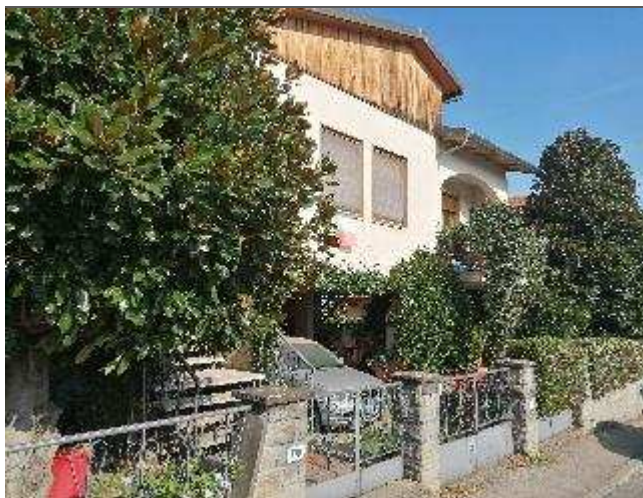
foto n.1 - esterno