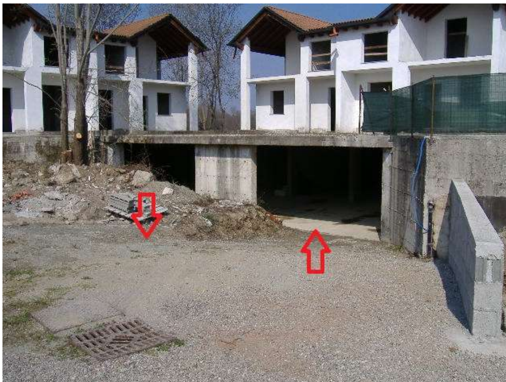
Accesso alle autorimesse