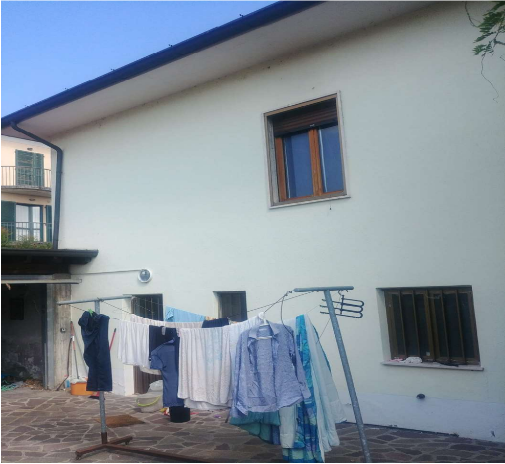
- Vista da sud - 3