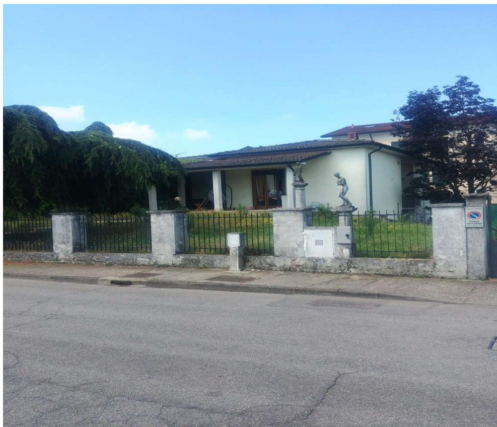
- Vista da nord - est dalla via Luigi Einaudi – 1