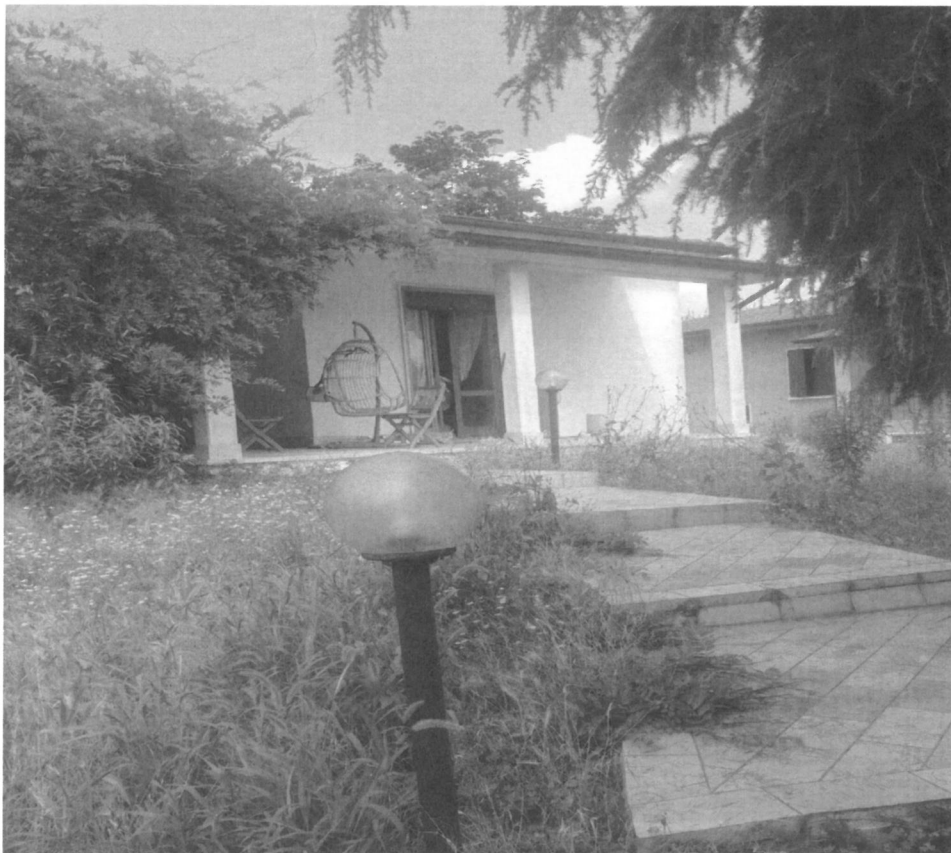
- Vista portico d'ingresso - 18