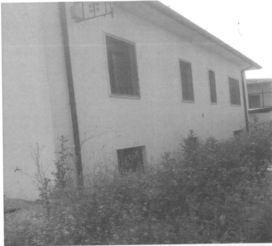
- Vista da ovest - 5