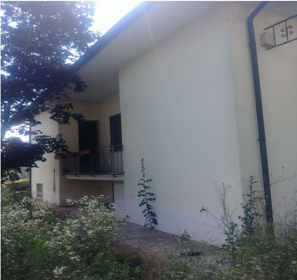
- Vista da nord - 4