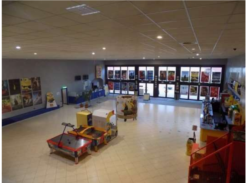
biglietteria, ingresso, camminamenti, alcune delle 9 sale cinematografiche, ect.