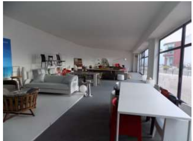
vista d'assieme ristorante pizzeria