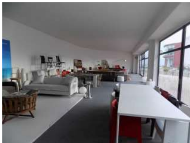
vista d'assieme ristorante pizzeria