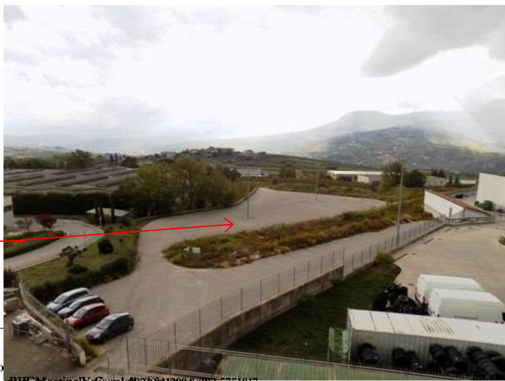
vista d'assieme porzione di area esterna destinata a parcheggio ed a verde