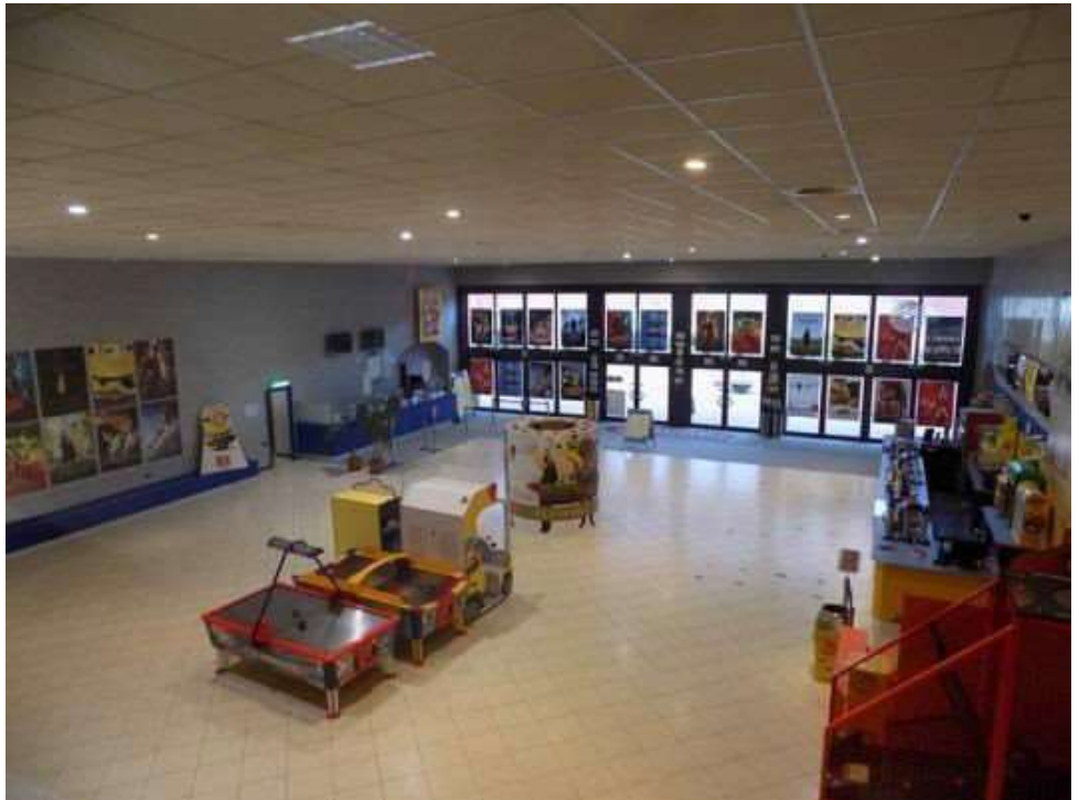
biglietteria, ingresso, camminamenti, alcune delle 9 sale cinematografiche, ect.