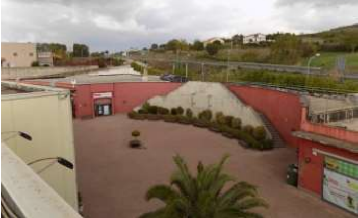
vista d'assieme locale commerciale, pizzeria e scala per accedere al parcheggio in copertura