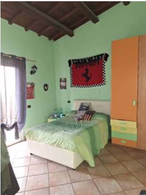
CAMERA 2 P.T.