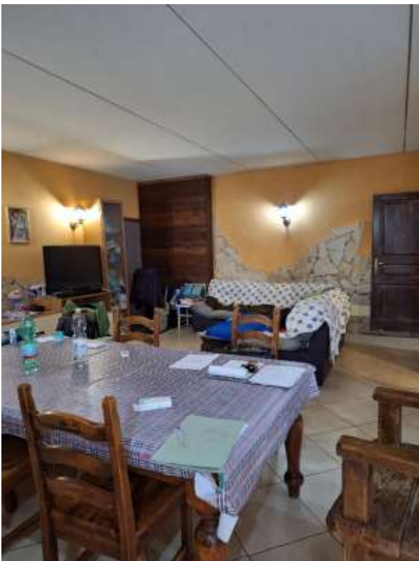
SOGGIORNO 2 P.INT.