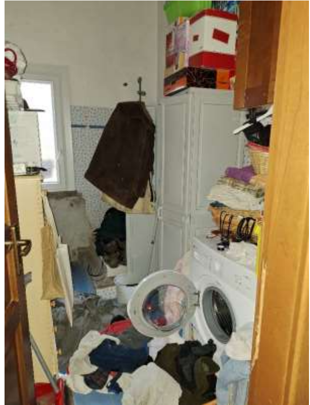
BAGNO 1 P.T.