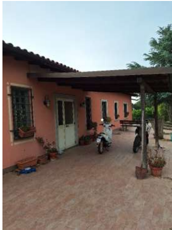
AREA ESTERNA P.T.