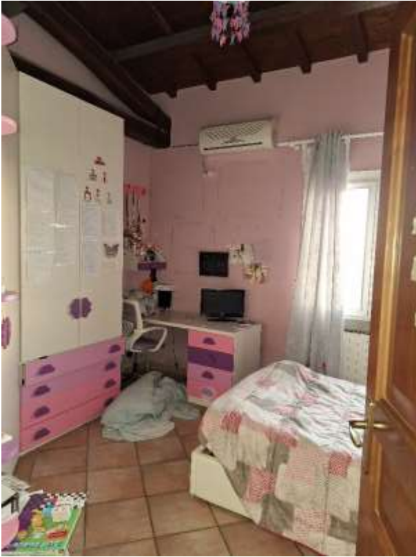
CAMERA 3 P.T.