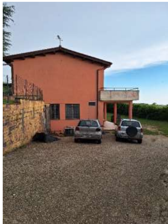
AREA ESTERNA P.INT.