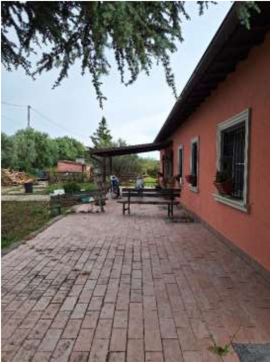
AREA ESTERNA P.T.