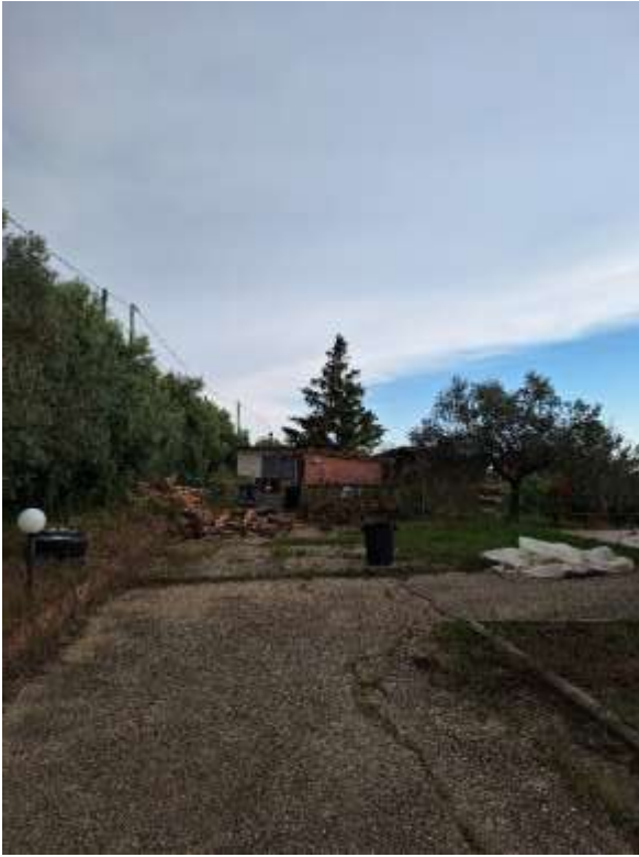
AREA ESTERNA P.T.