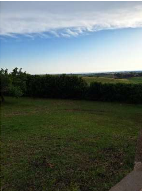
AREA GIARDINATA ESTERNA