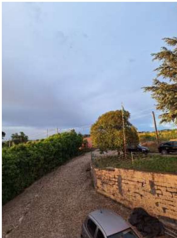
RAMPA ACCESSO P.INT.