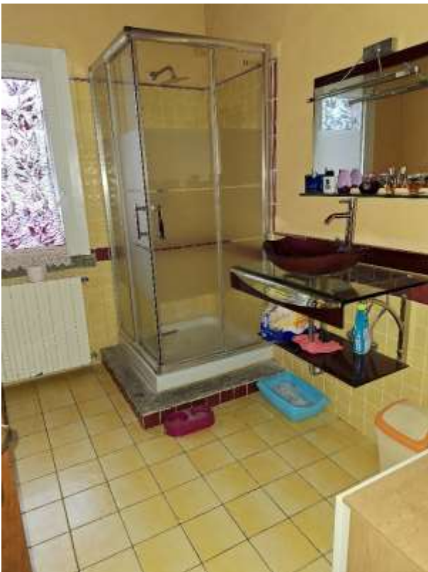
BAGNO 2 P.T.