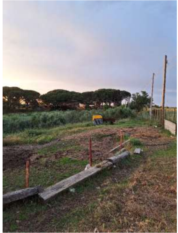
AREA ESTERNA P.T.