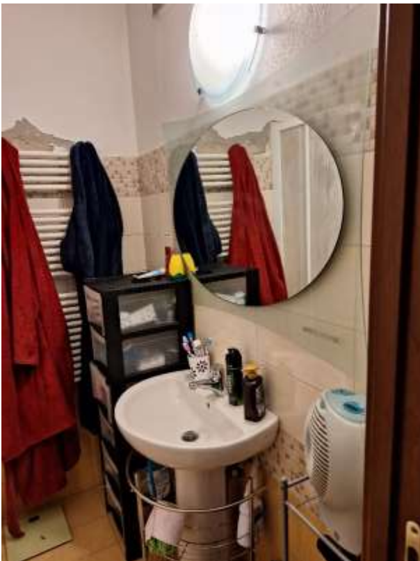
BAGNO 2 P.INT.