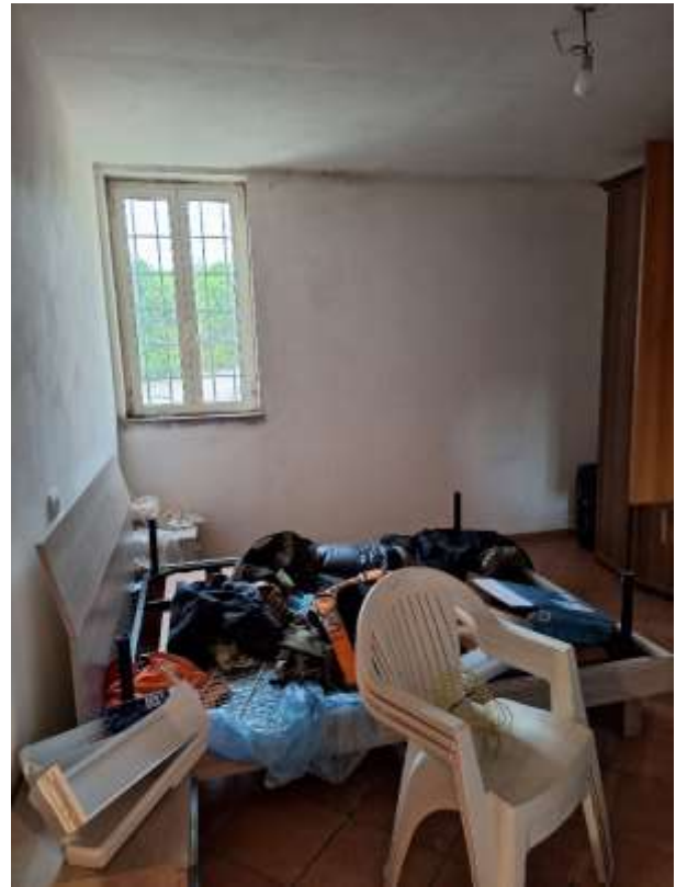
CAMERA 2 P.INT.