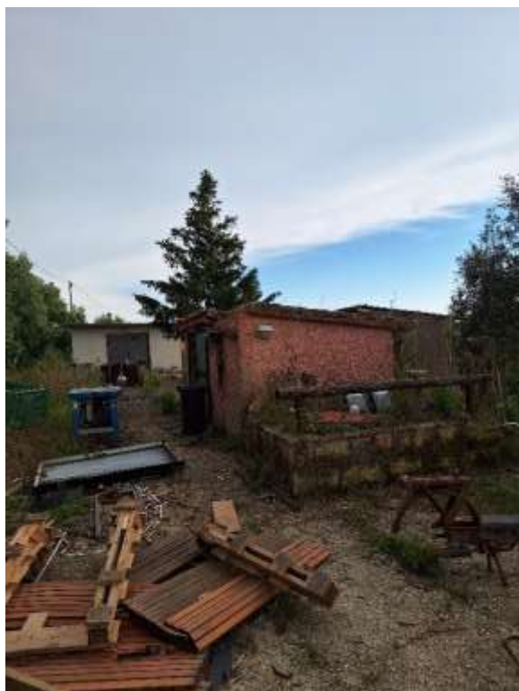
VOLUMI TECNICI P.T.