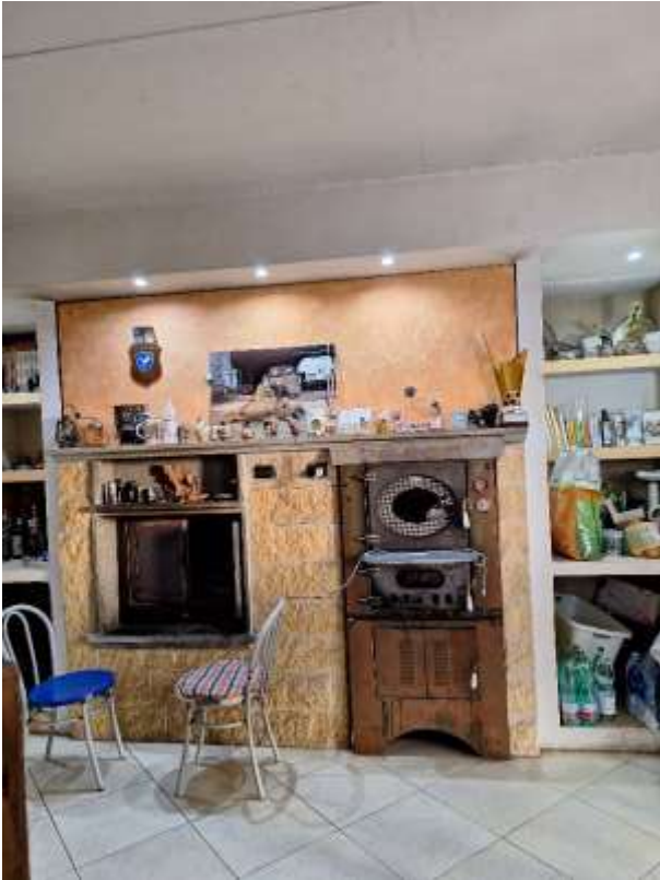
SOGGIORNO 2 P.INT.