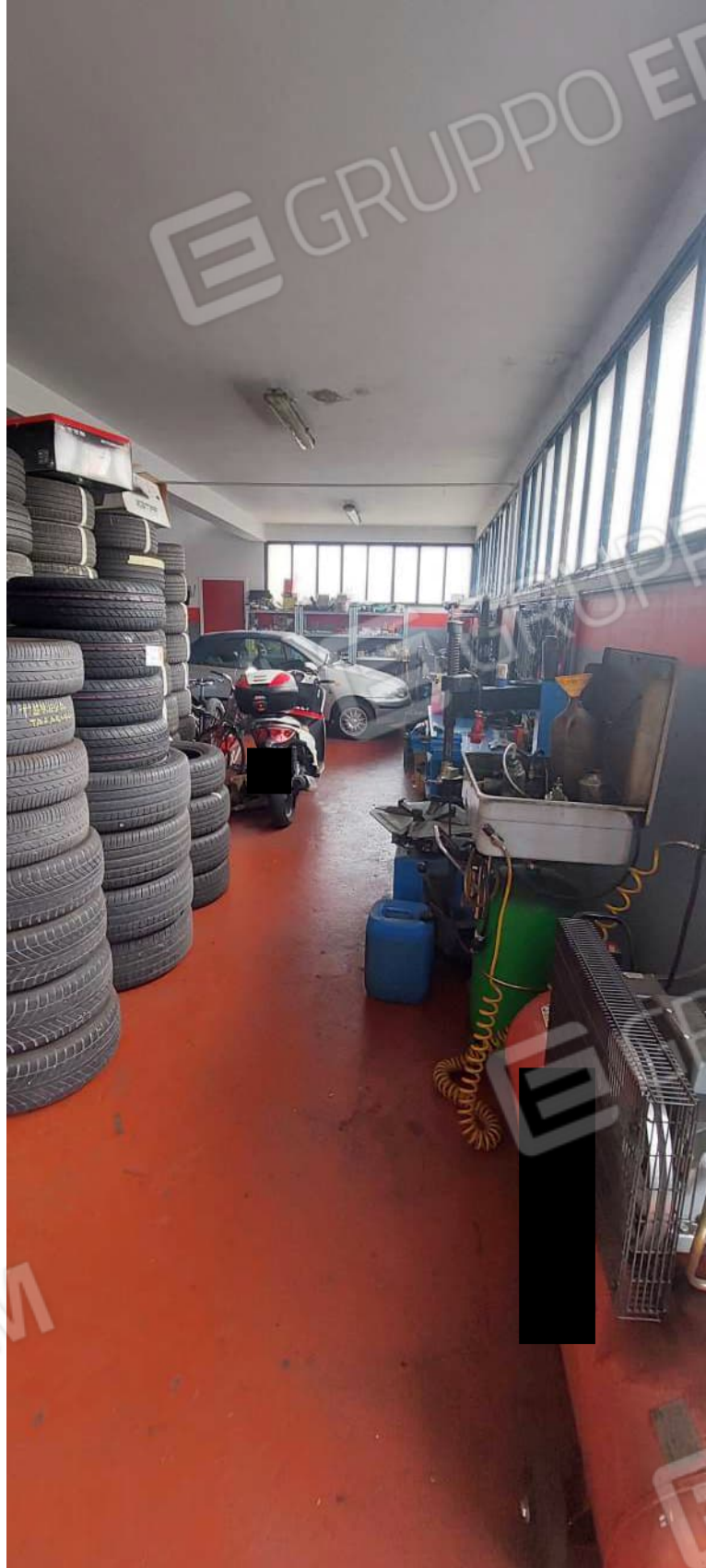
Laboratorio lato Sud