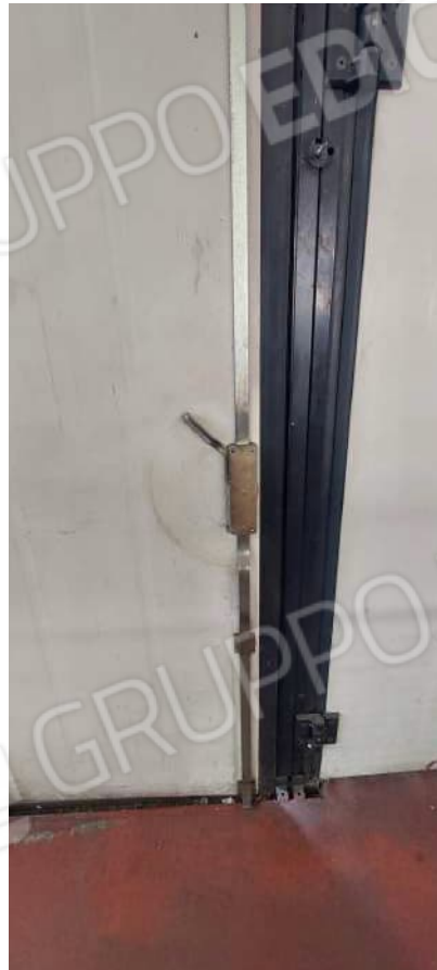
Particolare dei portoni a libro