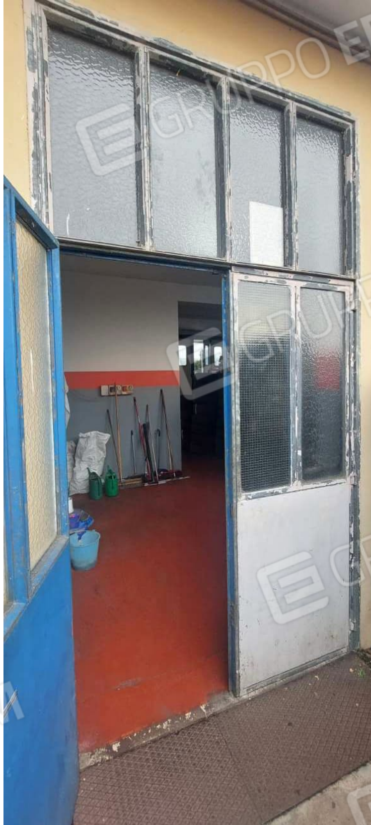
Portone lato Sud