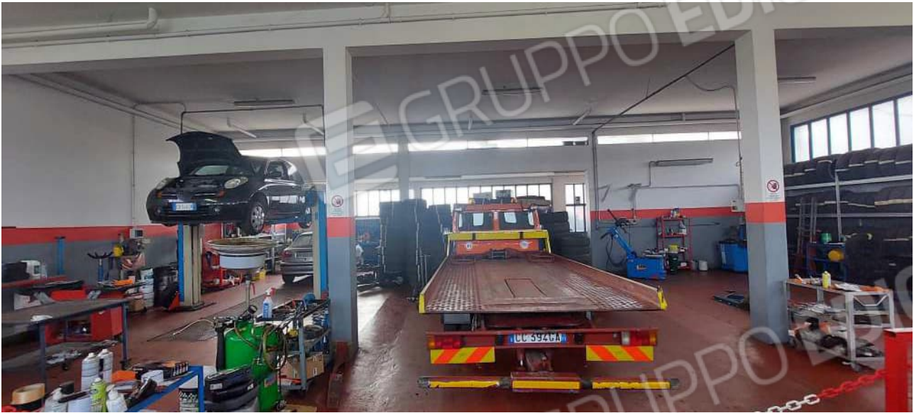
Interno Laboratorio / Officina meccanica