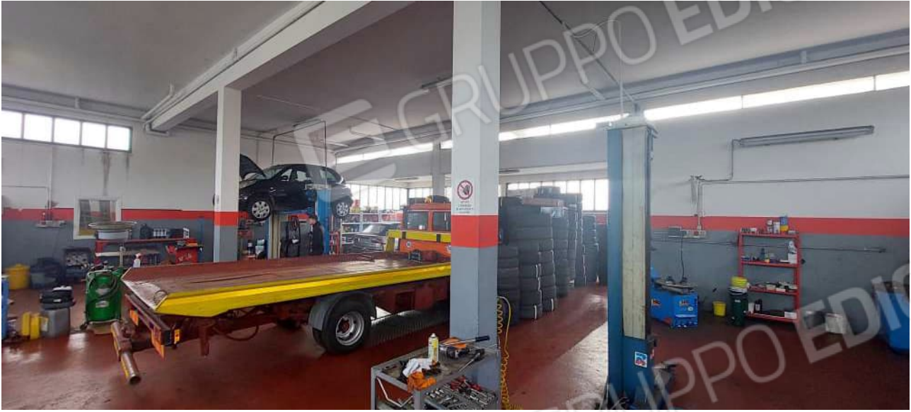
Interno Laboratorio / Officina meccanica