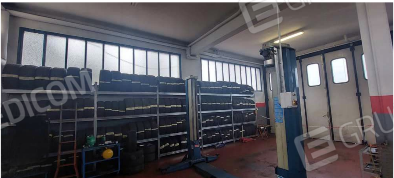
Interno Laboratorio / Officina meccanica