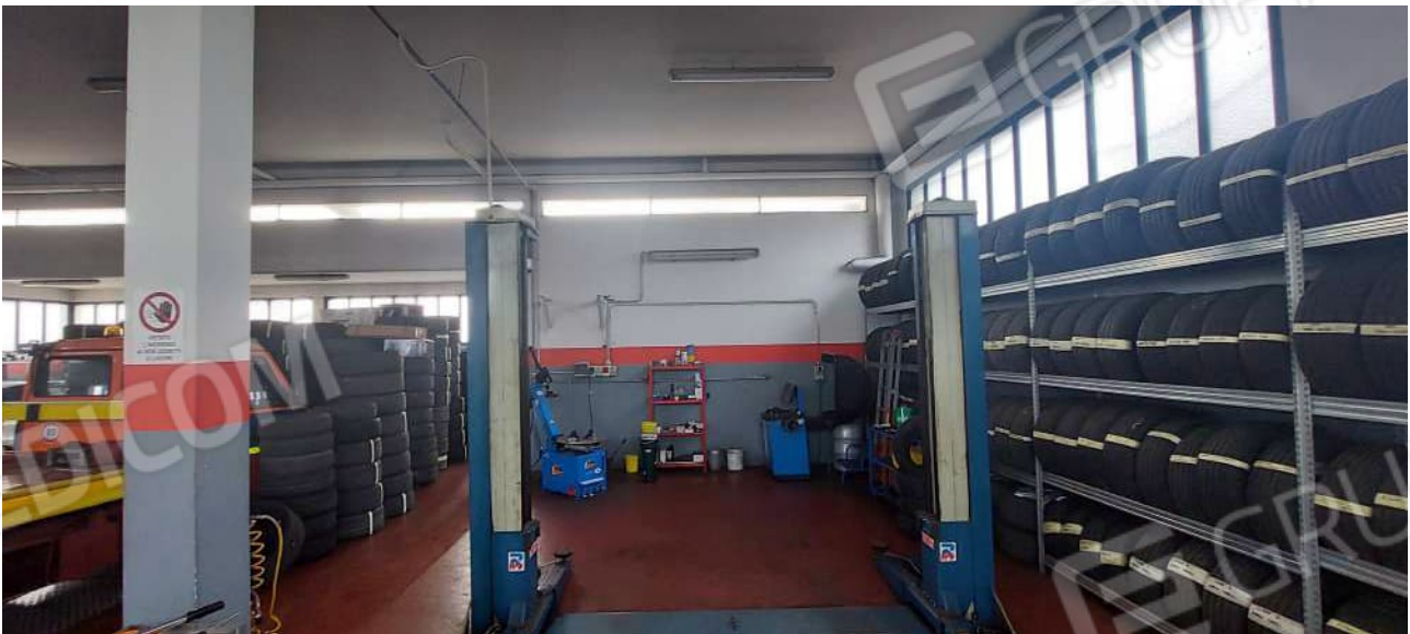
Interno Laboratorio / Officina meccanica