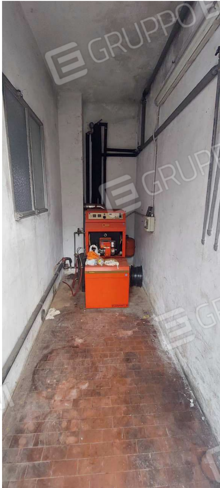
Vano caldaia al piano terra