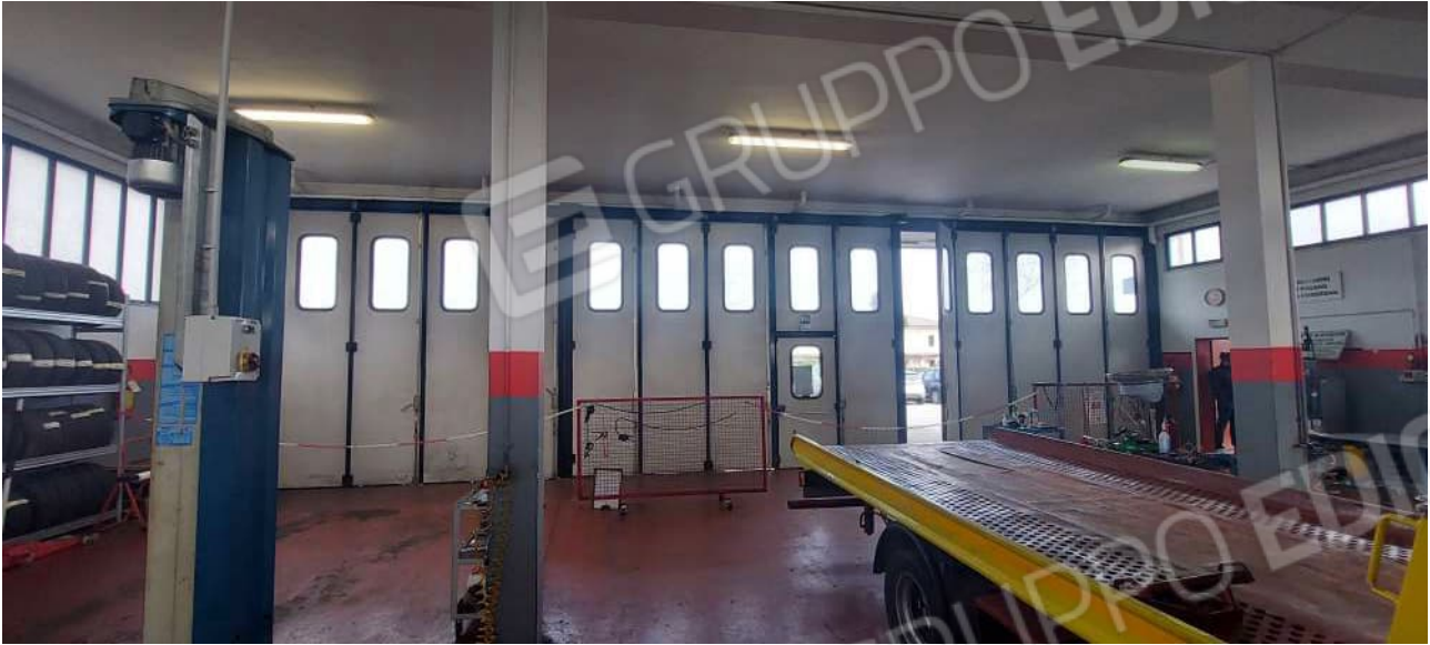
Interno Laboratorio / Officina meccanica