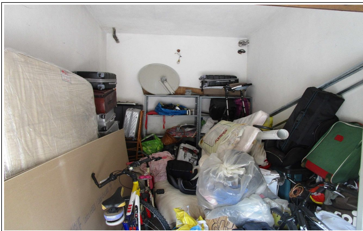
Fotogramma 2 – Particolare interno garage – tubi e impianto elettrico.