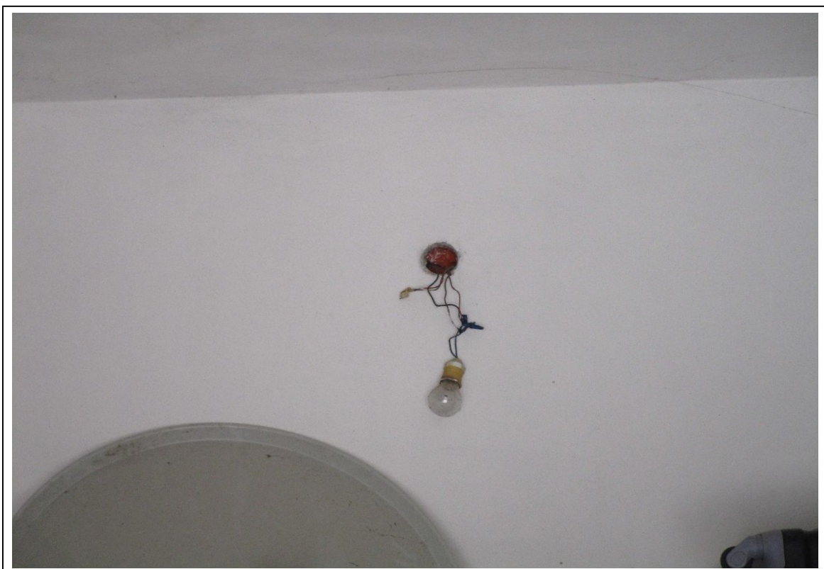
Fotogramma 2 – Particolare interno garage – impianto elettrico.