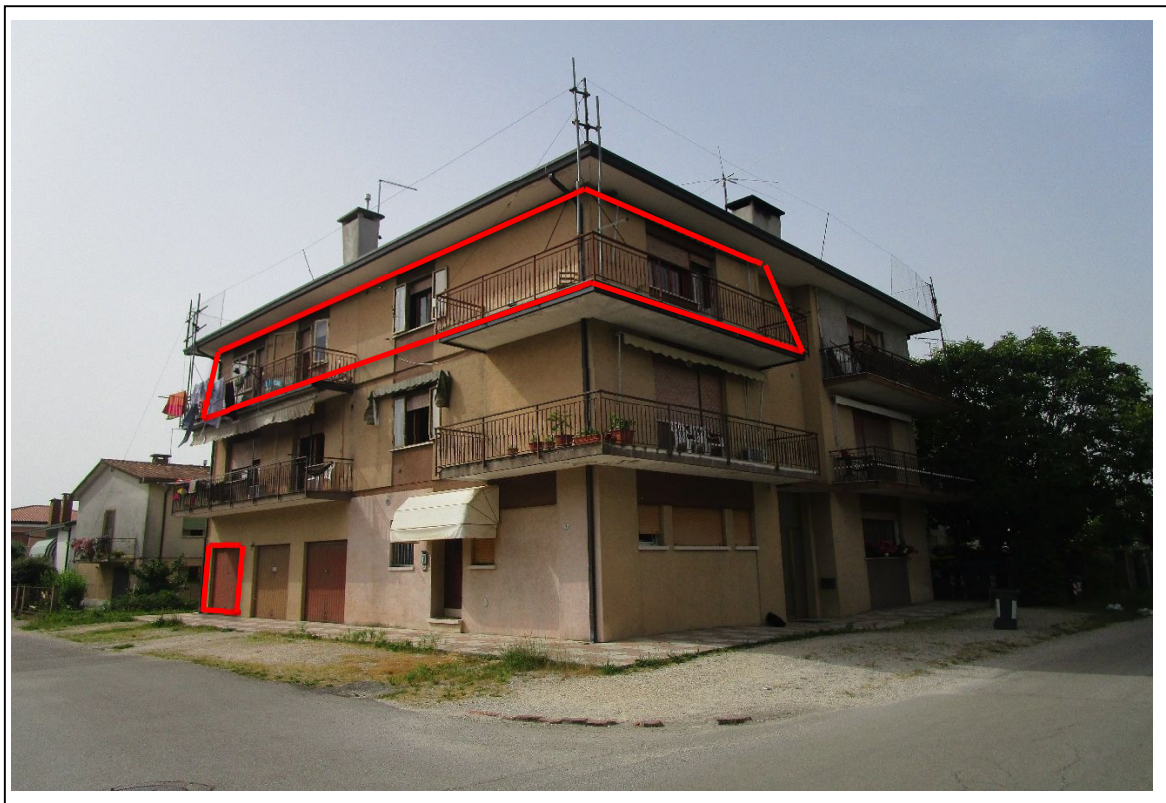
Fotogramma 1 – Prospetti dell'edificio.