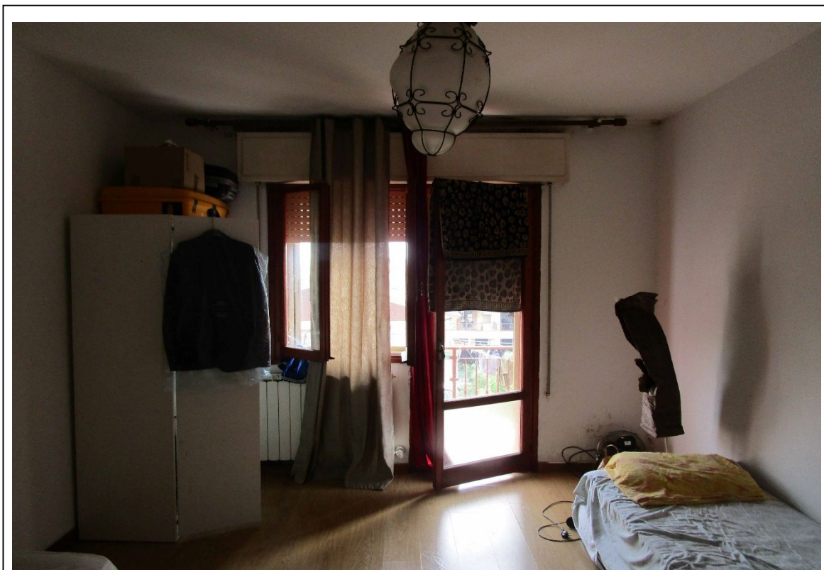
Fotogramma 8 – camera.