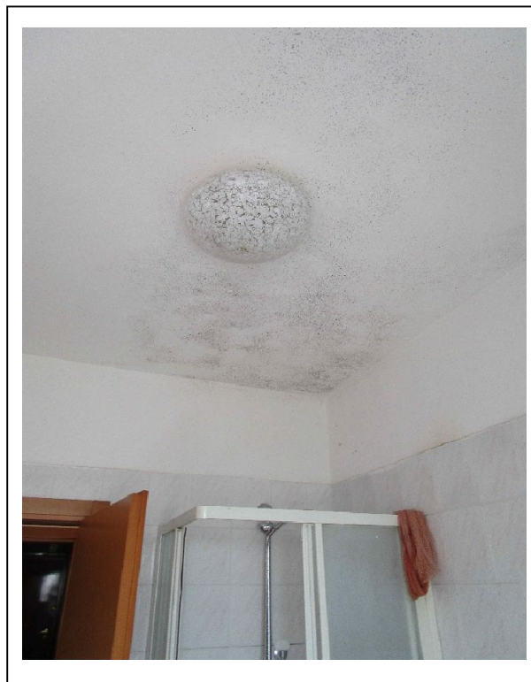
Fotogramma 11 – umidità/muffe.