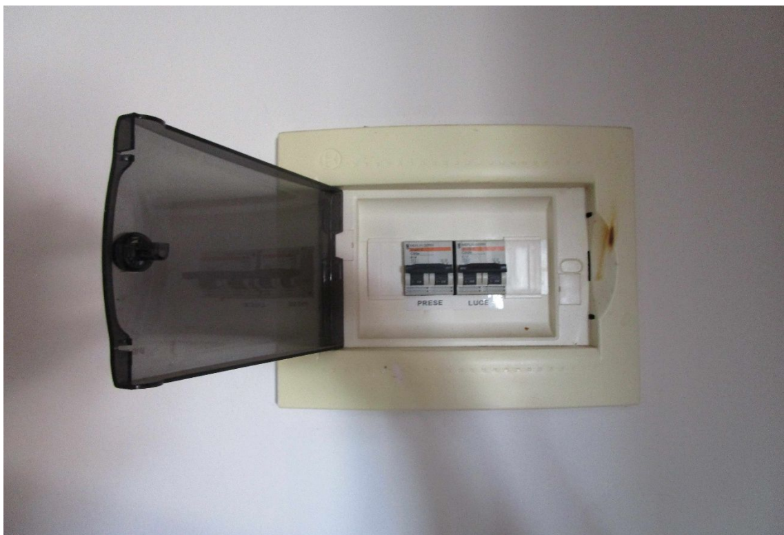
Fotogramma 9 – impianto.