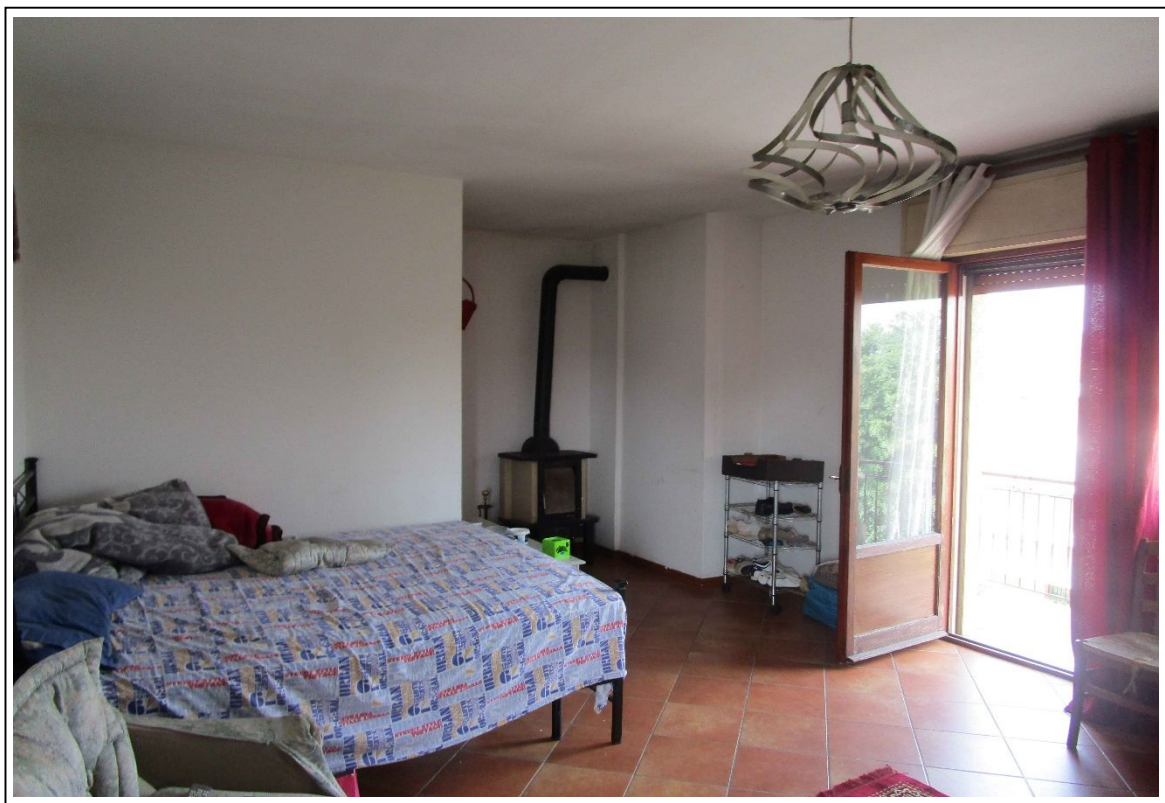
Fotogramma 6 – stanza – soggiorno.