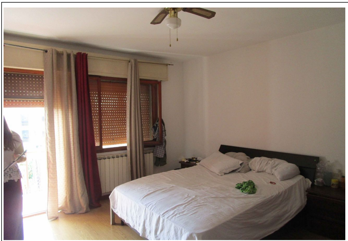
Fotogramma 7 – camera.