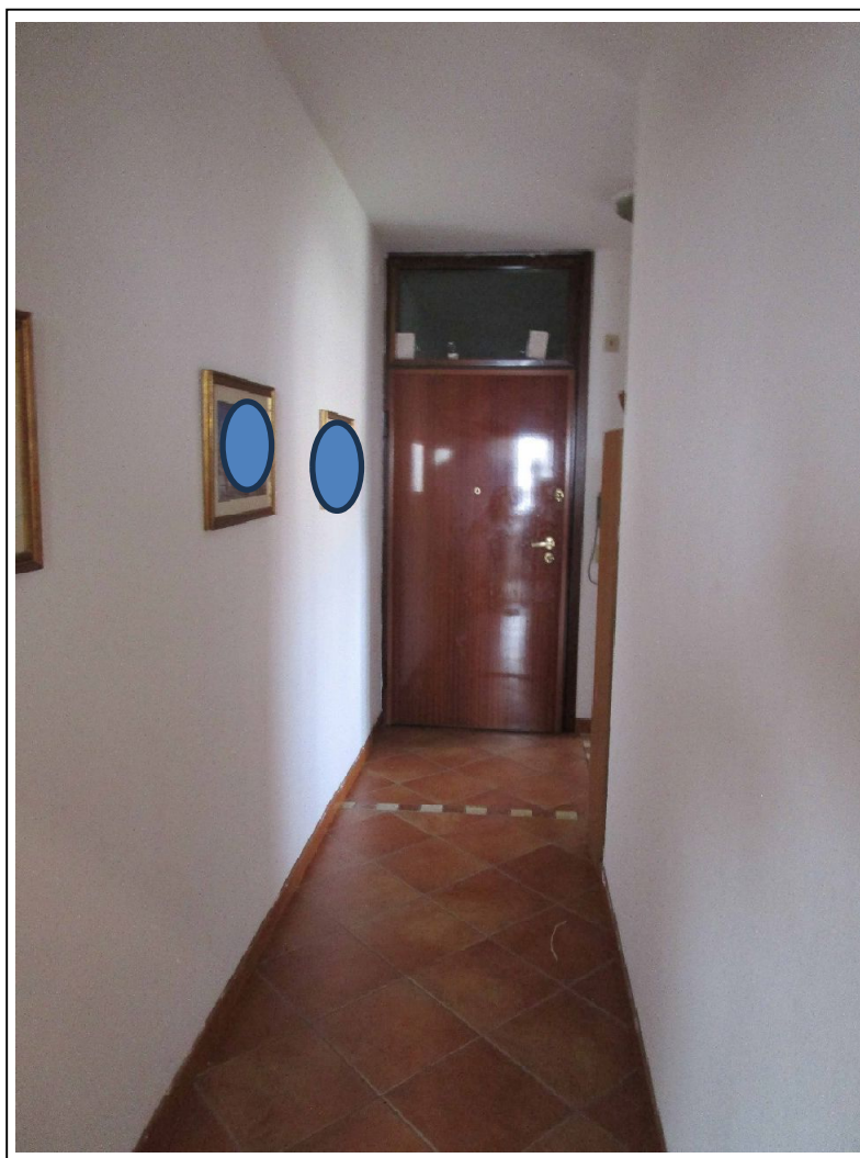
Fotogramma 4 – Particolare ingresso abitazione.