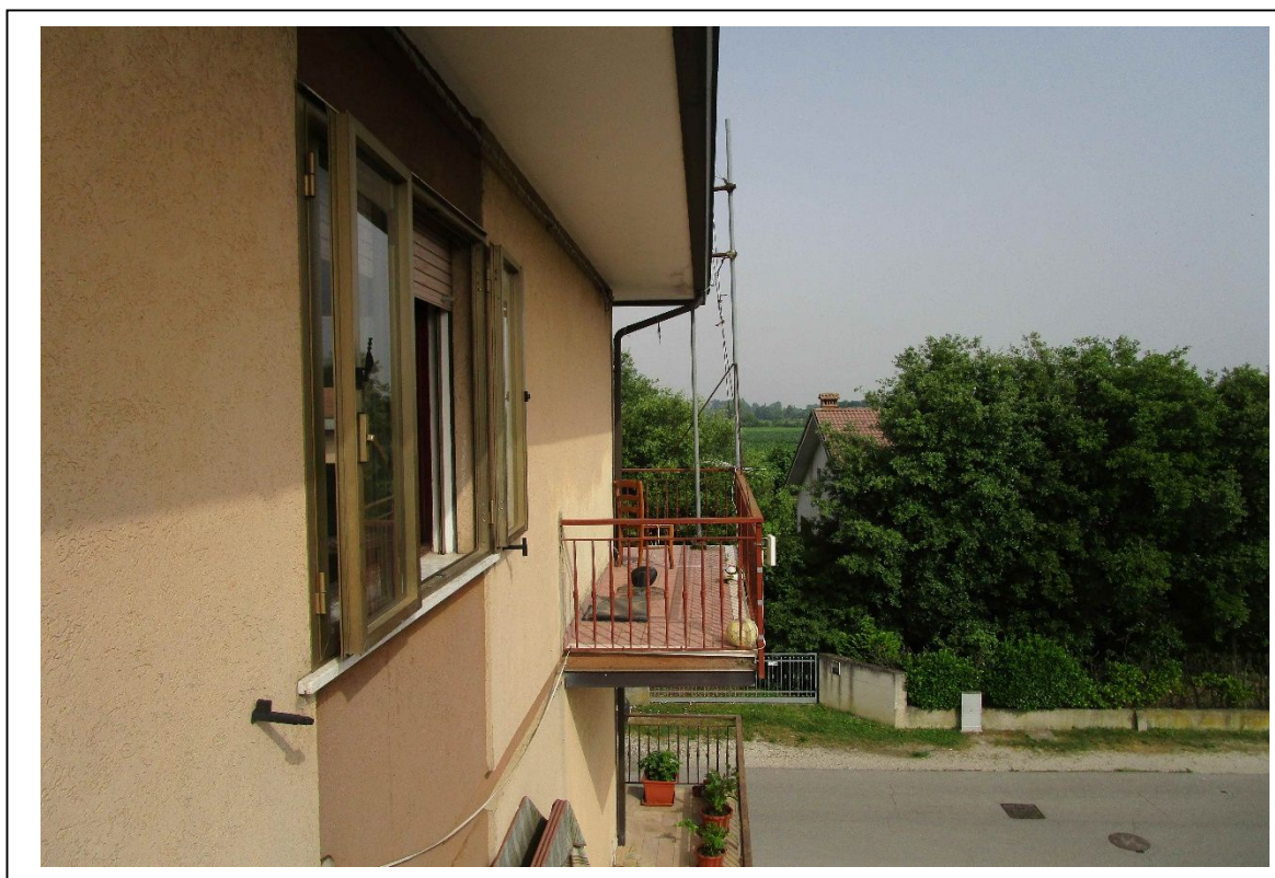
Fotogramma 12 – Particolare esterno.