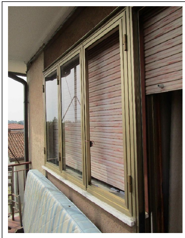
Fotogramma 13 – stato delle finestre – rotture.