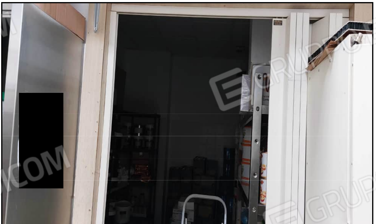
Foto 10 Vista ingresso ripostiglio