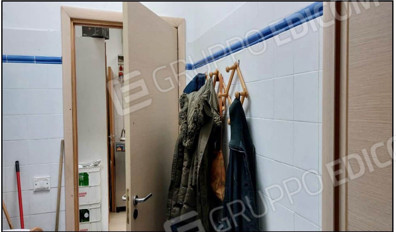
Foto 7. Vista interna spogliatoio