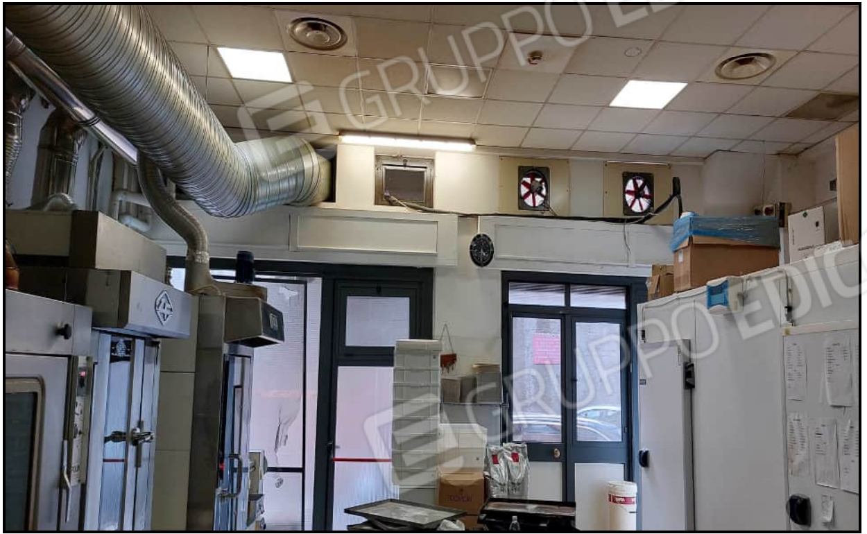
Foto 3. Vista dall'interno del locale dei due infissi