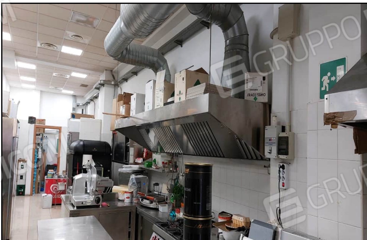
Foto 6. Vista piano cottura e cappe aspiranti