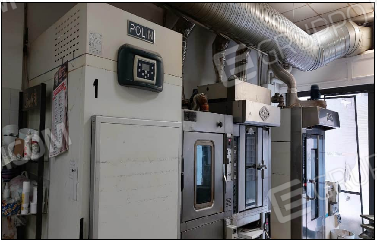
Foto 4. Vista frigoriferi e impiantistica del locale