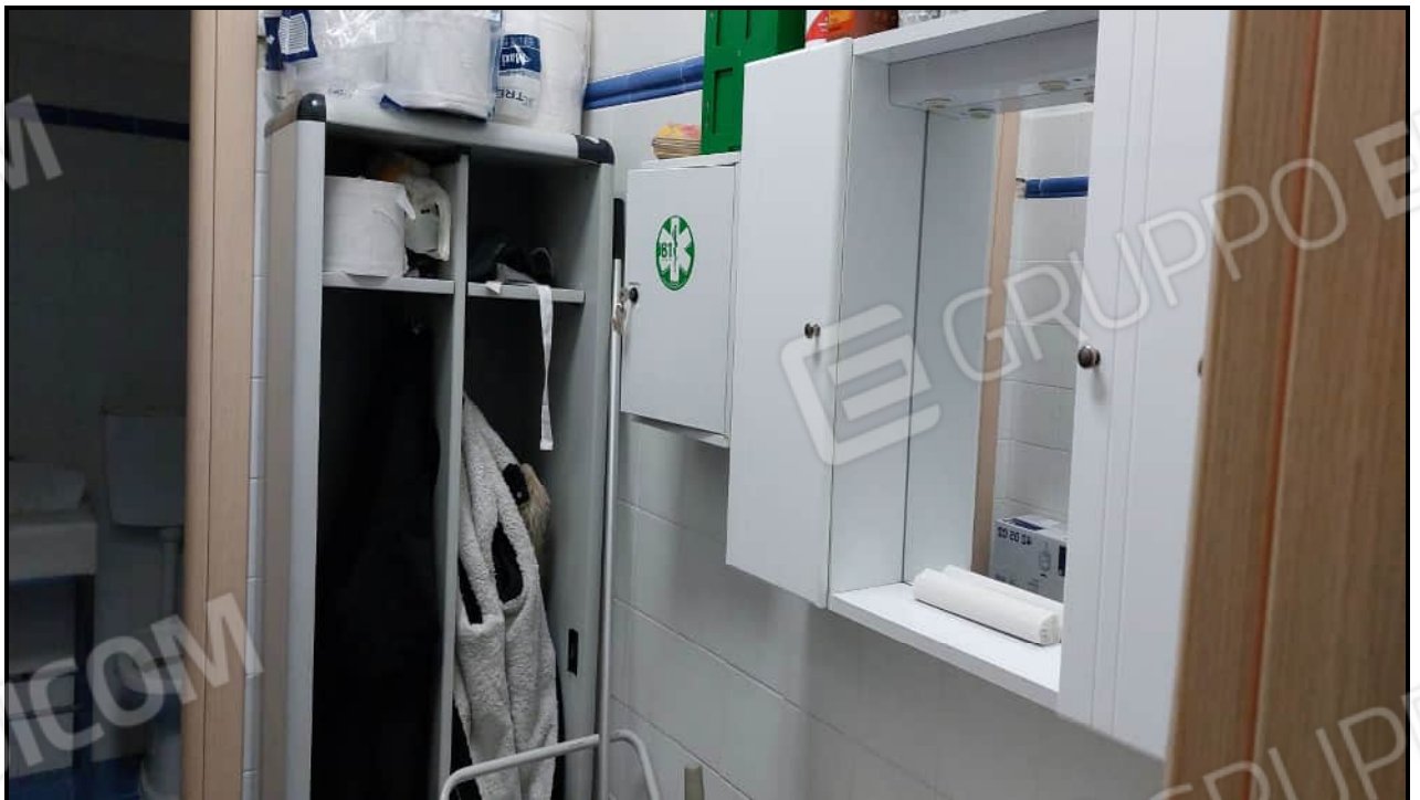
Foto 8. Altro spogliatoio con bagno sullo sfondo