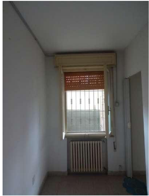
Camera con divisorio in pannellatura legno