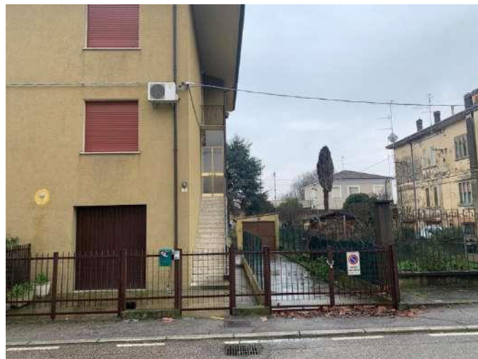
Ingresso pedonale e carroia da via Sabotino 2