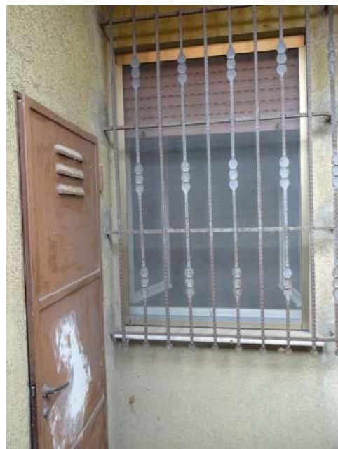
centrale termica nel sootoscala