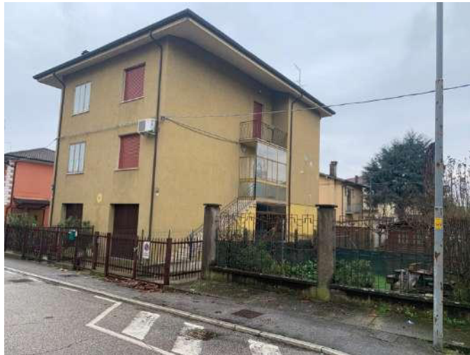
Facciata ad ovest