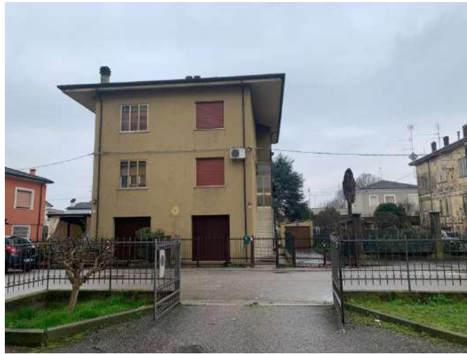
Facciata a nord