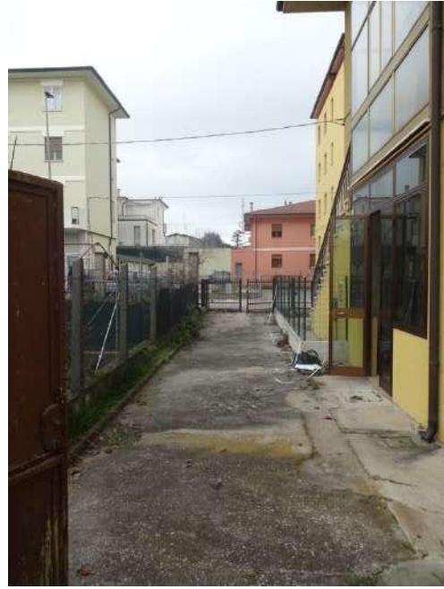
Area esterna ad ovest