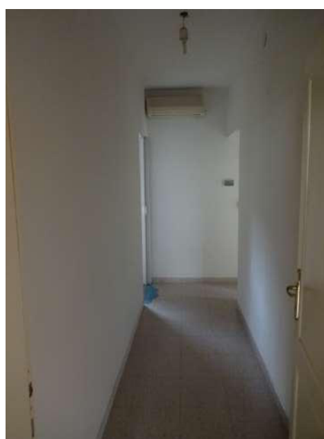
corridoio con divisorio in legno