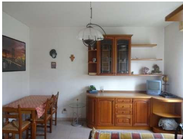
Soggiorno con angolo cattura