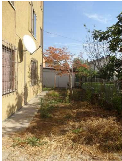
cortile esterno sul retro