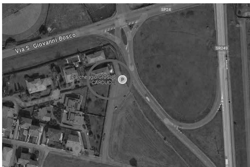
estratto di Google Maps

Quota di 1/1 della piena proprietà in regime di separazione dei beni