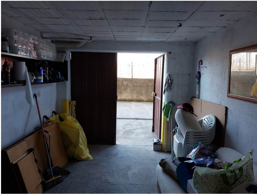
FOTO 13 - GARAGE