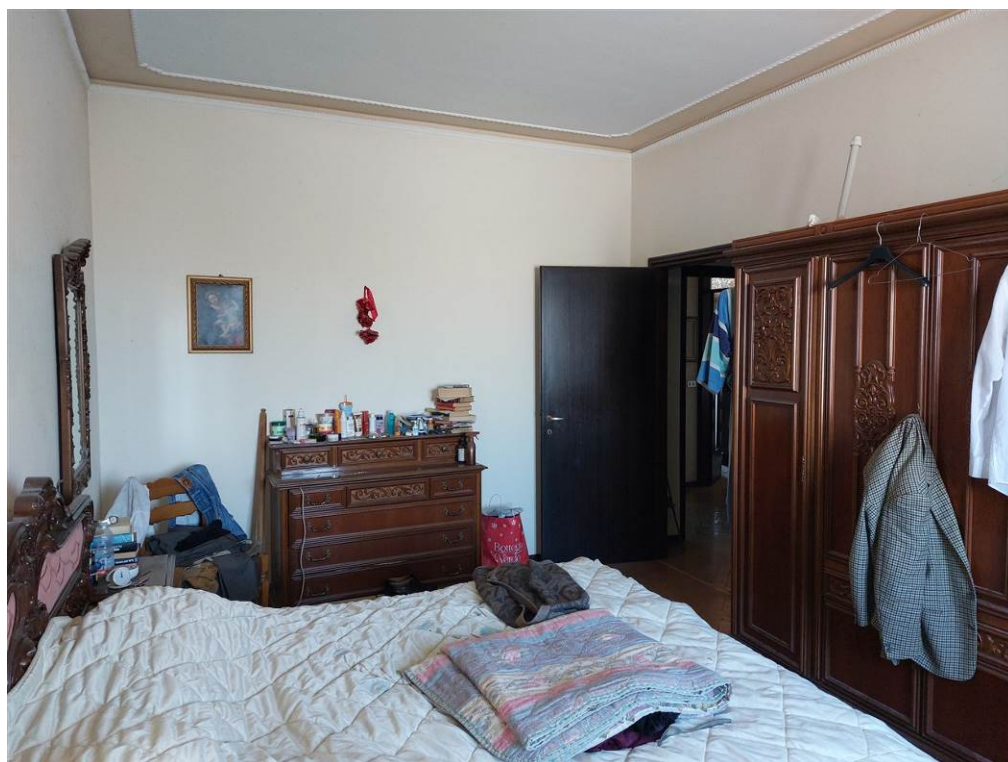
FOTO 10 - LETTO N.1