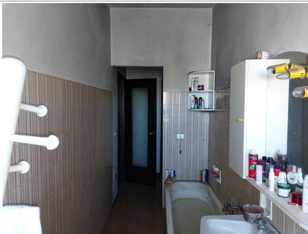
FOTO 9 - BAGNO