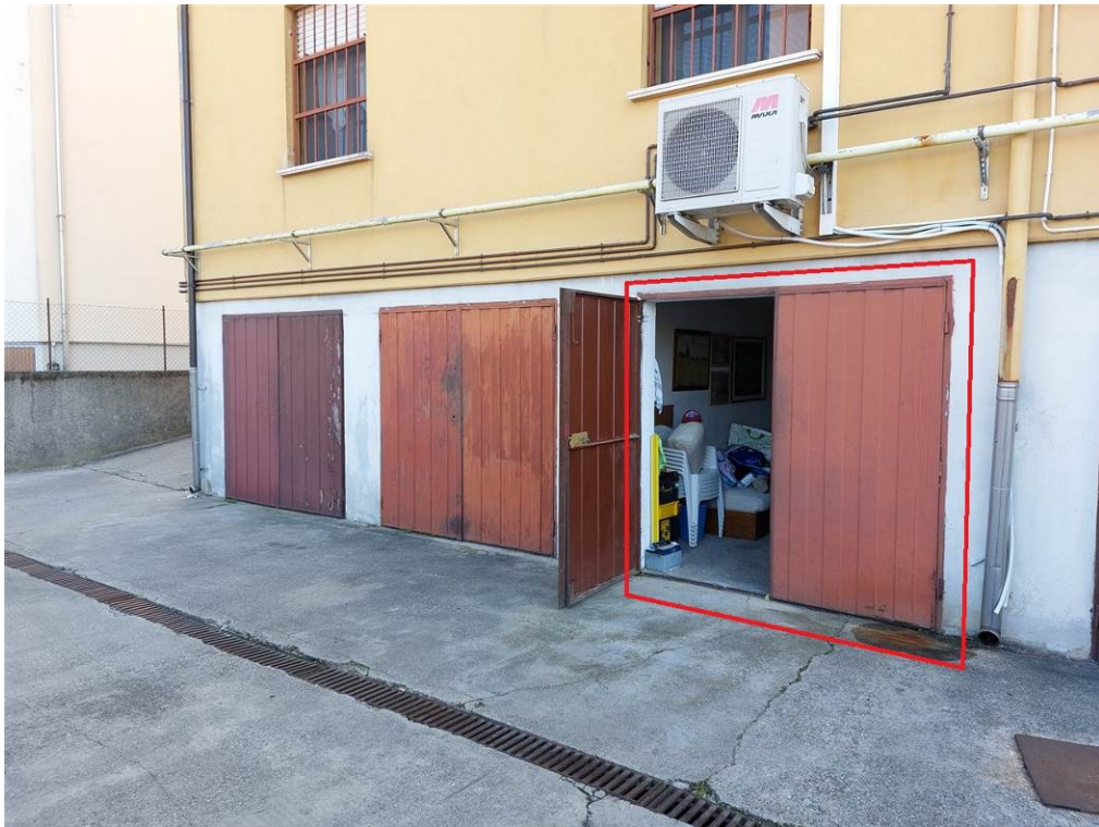
FOTO 14 - ESTERNO GARAGE