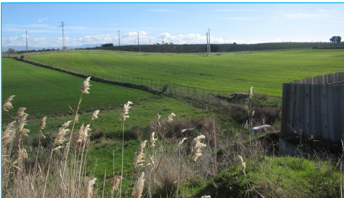
Foto 2 - Mappali 422 e 372 (vista dallo spigolo dell'Azienda Mibelli)

Dall'esame dell'estratto di mappa sopra esposto (allegato 2 della relazione del C.T.U.), sono rappresentati i Mappali 372 e 422 del Foglio 3, colorati di giallo, ai quali il C.T.U. ha attribuito il valore di €. 1.500,00 ed €. 268.000,00, rispettivamente, alla data del 6 marzo 2014. Nella sua relazione il C.T.U. ha dichiarato che il Mappale 422 risultava arato e seminato allegando la foto fattane all'epoca e che di seguito si riporta: