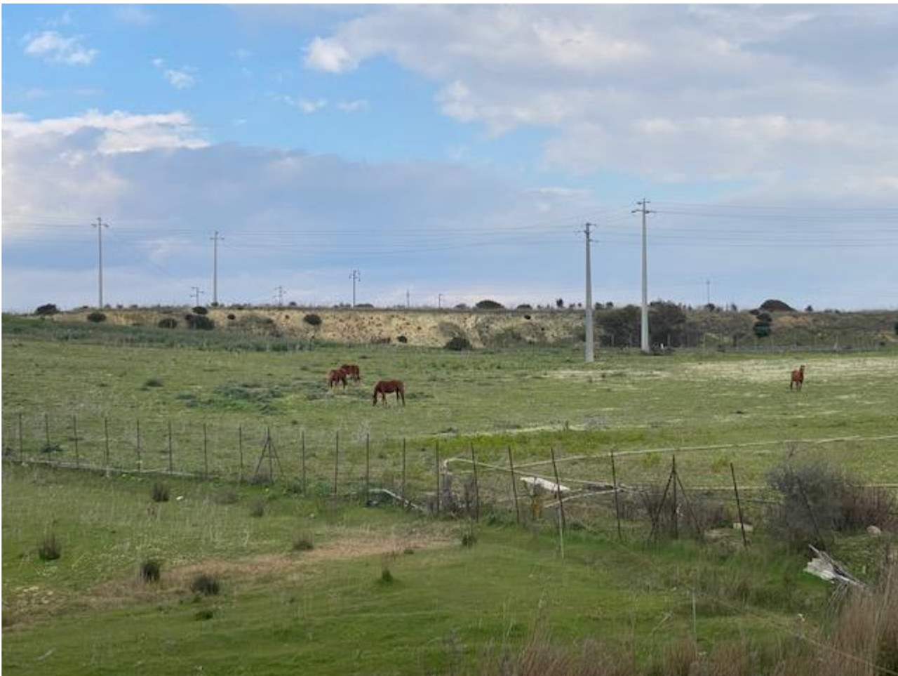
Foto dei Mappali 422 e 372 visti dallo spigolo della confinante Azienda Mibelli