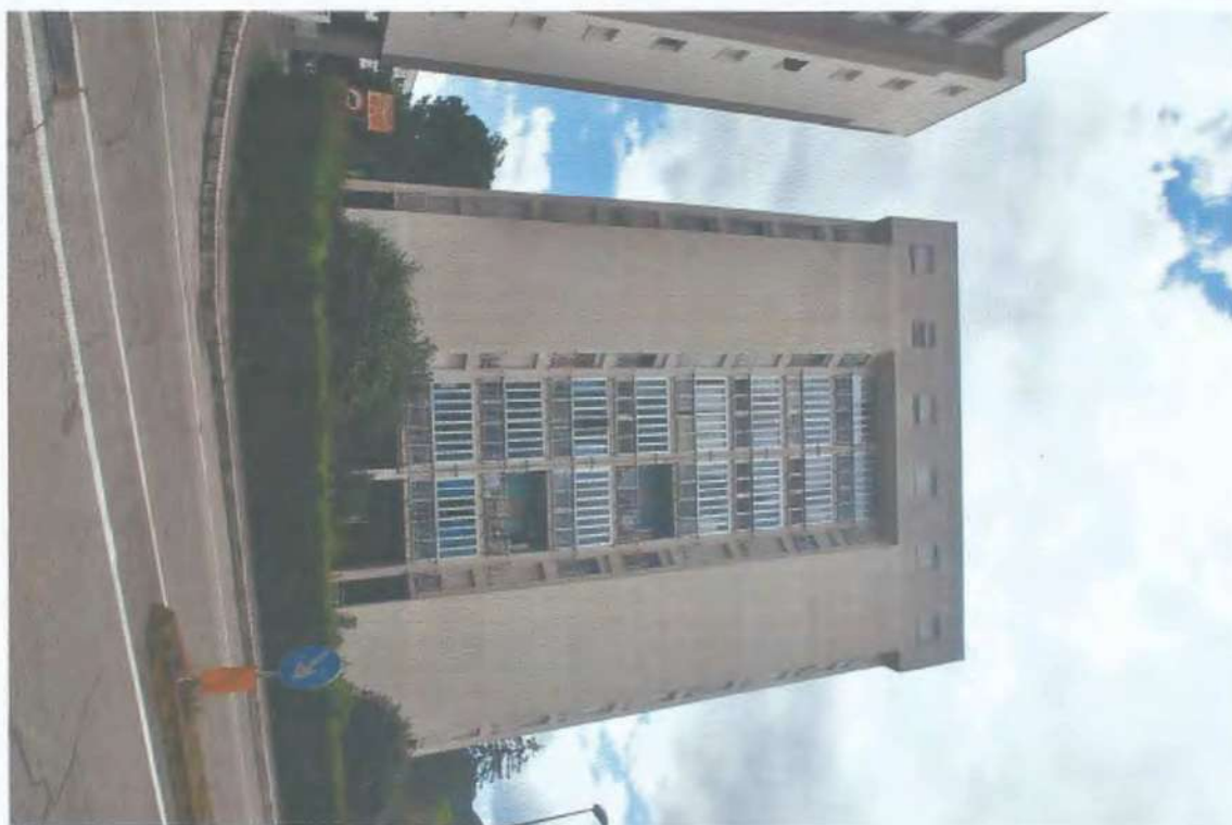
01) Vista facciata ovest del fabbricato torre C2; 02) Vista facciata sud del fabbricato torre C2;