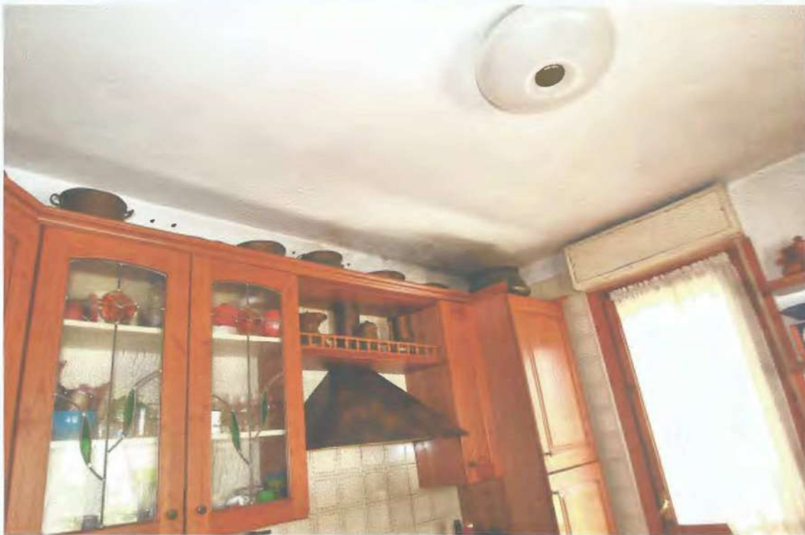
07) Vista infiltrazione all'angolo nord-est del soffitto della cucina; 08) Vista cucina;