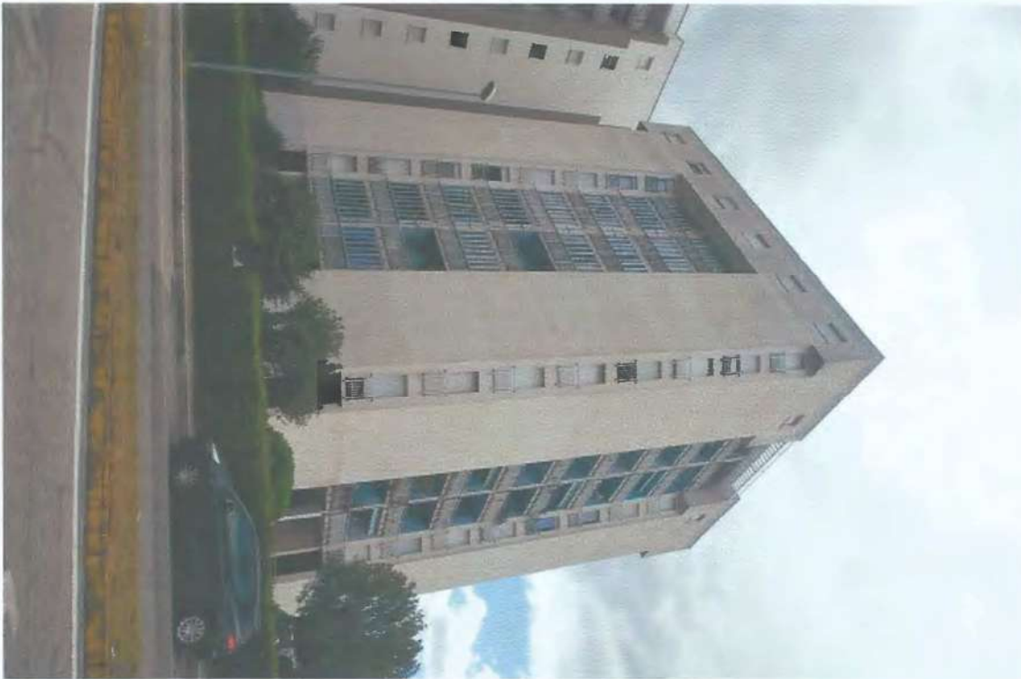
03) Vista d'angolo del fabbricato torre C2; 04) Vista soggiorno;