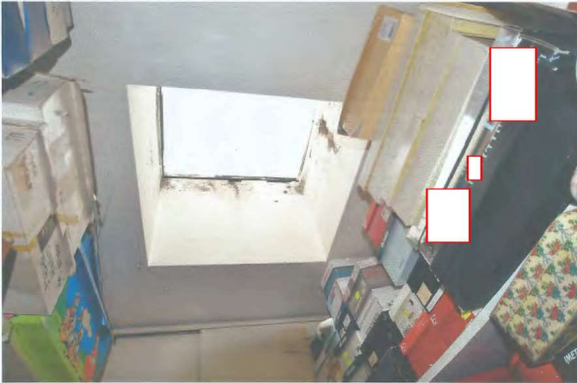
09) Vista infiltrazione al perimetro del lucernario del ripostiglio; 10) Vista tinello;