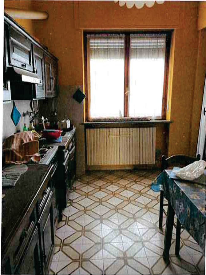
particolari interni alloggio