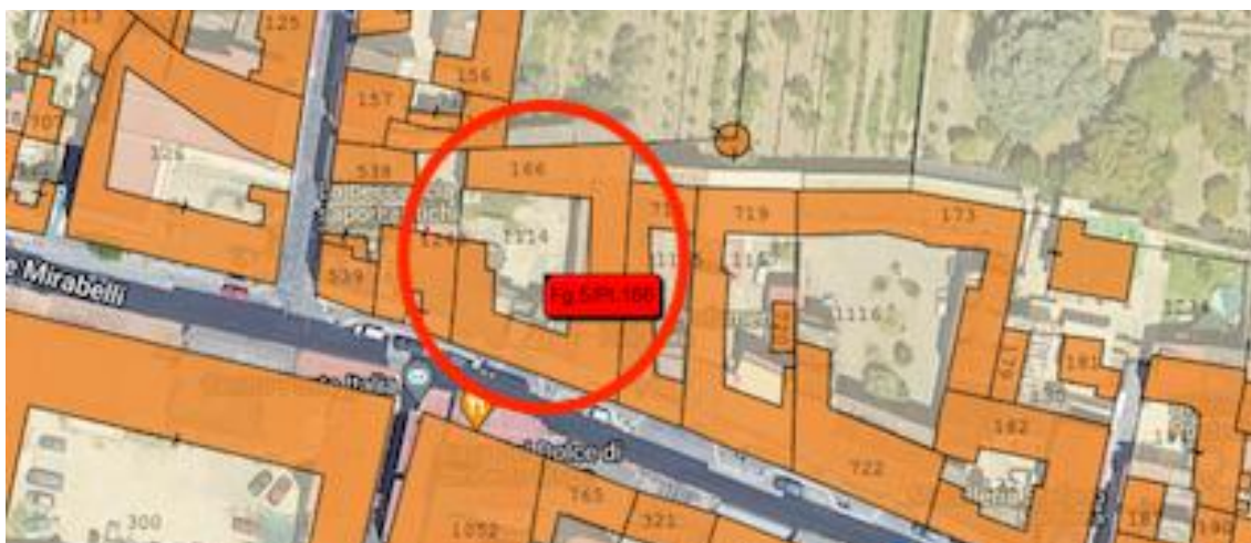
Foto n. 1 - SOVRAPPOSIZIONE VAX - ORTOFOTO

La sovrapposizione tra estratto di mappa ed ortofoto, individua correttamente il cespite pignorato.