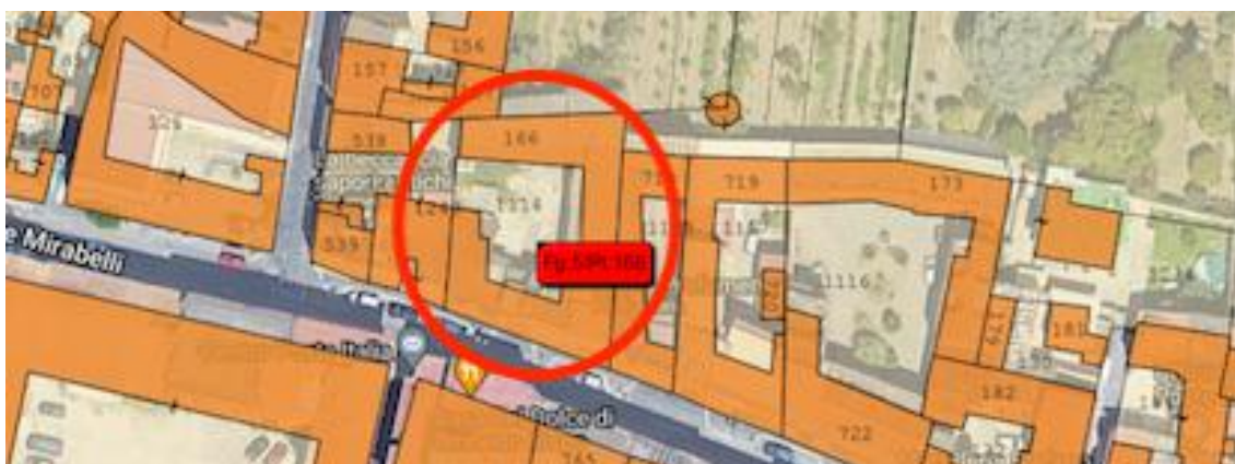
Foto n. 1 - SOVRAPPOSIZIONE VAX - ORTOFOTO

La sovrapposizione tra estratto di mappa ed ortofoto, individua correttamente il cespite pignorato.