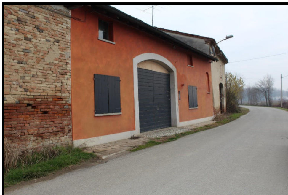
Figura 4 - FACCIATA SU VIA PRATI