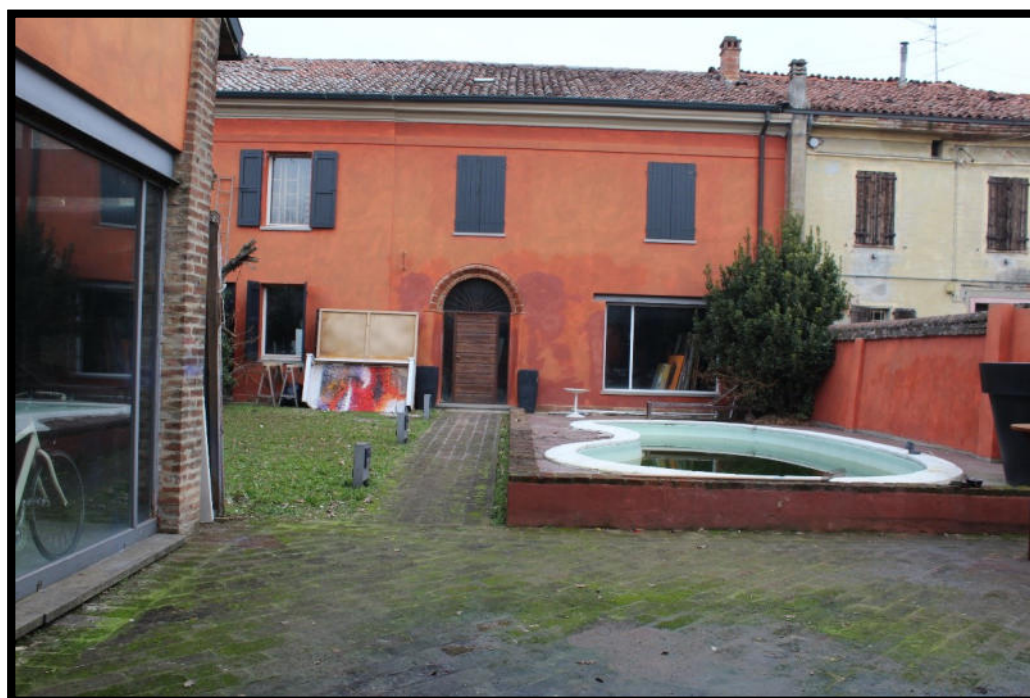
Figura 6 – FACCIATA INTERNA