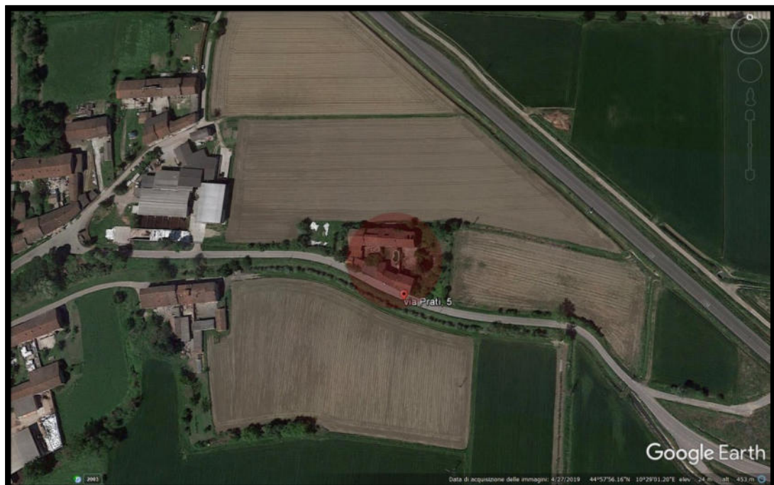
Figura 2 - ORTOFOTO-B