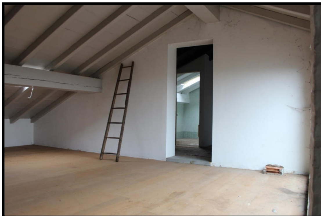
Figura 16 - SOPPALCO SUB.1