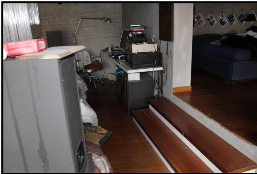
Figura 9 – ZONA GIORNO SUB.2

Tel. 0372 744318 – tania.lena@archiworldpec.it