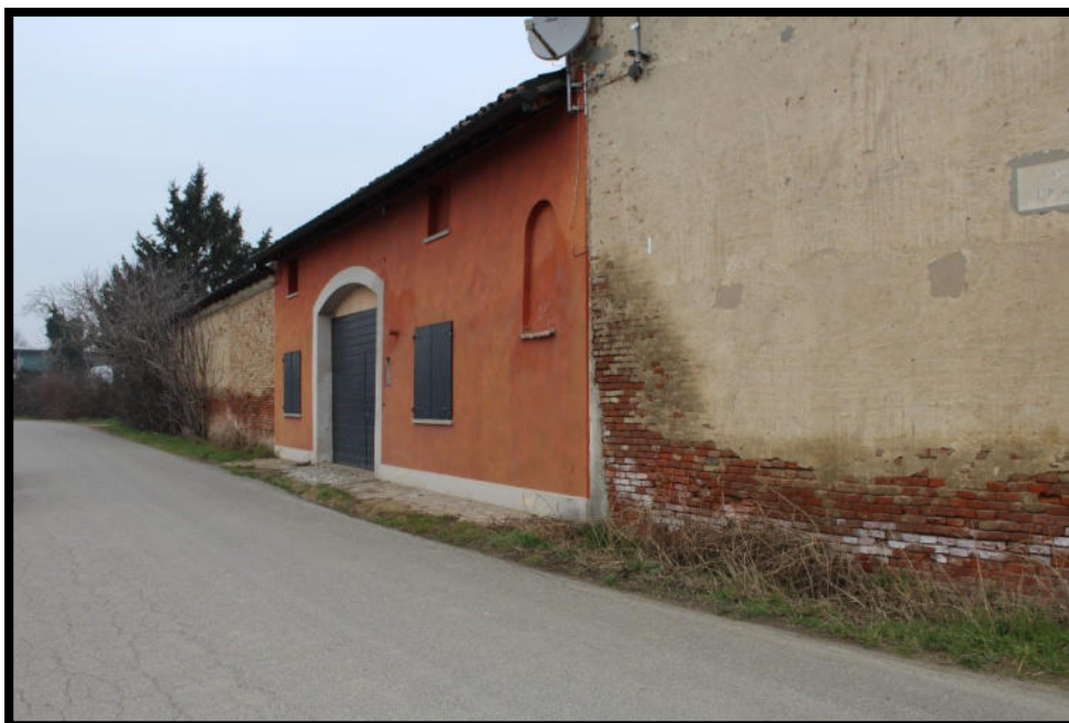
Figura 3 - FACCIATA SU VIA PRATI