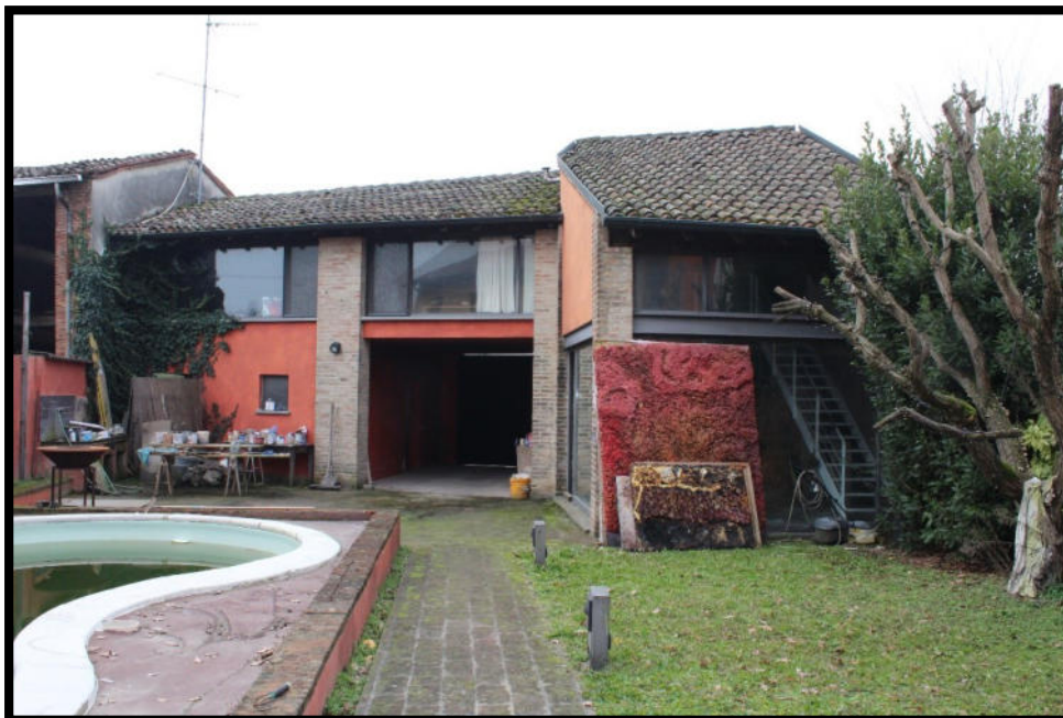
Figura 5 - FACCIATA INTERNA

Tel. 0372 744318 – tania.lena@archiworldpec.it