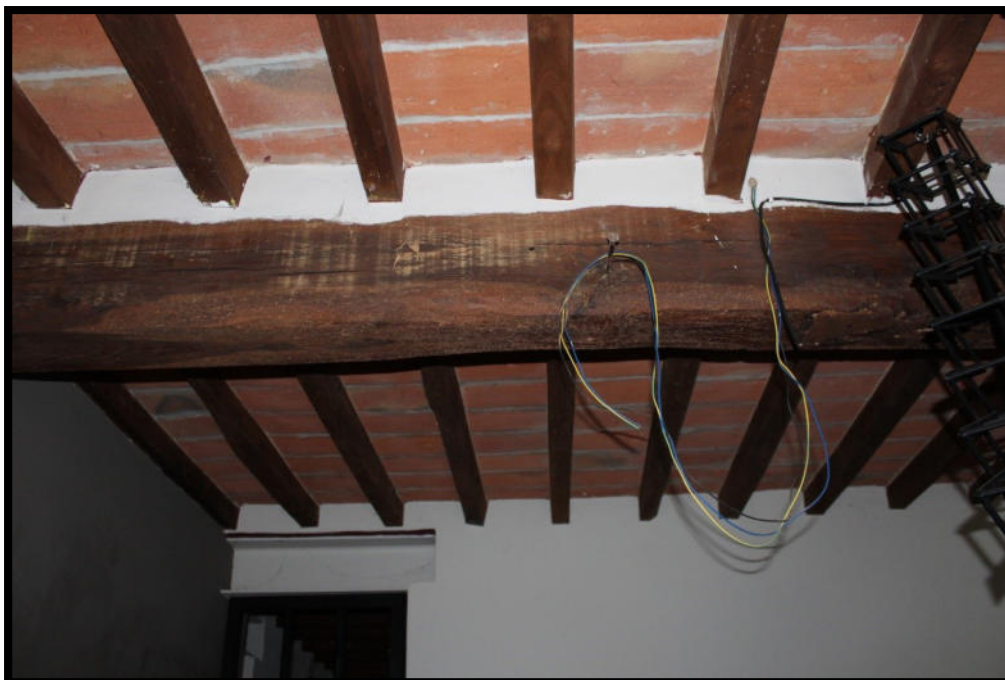
Figura 13 – PARTICOLARE SOFFITTO SUB.1

Tel. 0372 744318 – tania.lena@archiworldpec.it