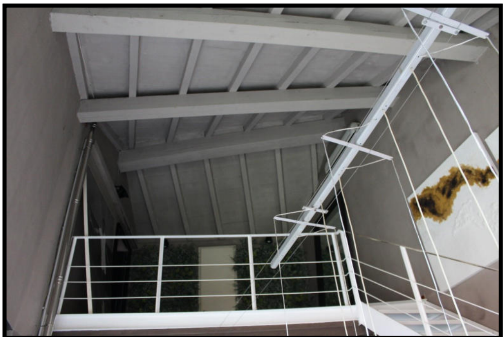
Figura 8 – SOPPALCO SUB.2