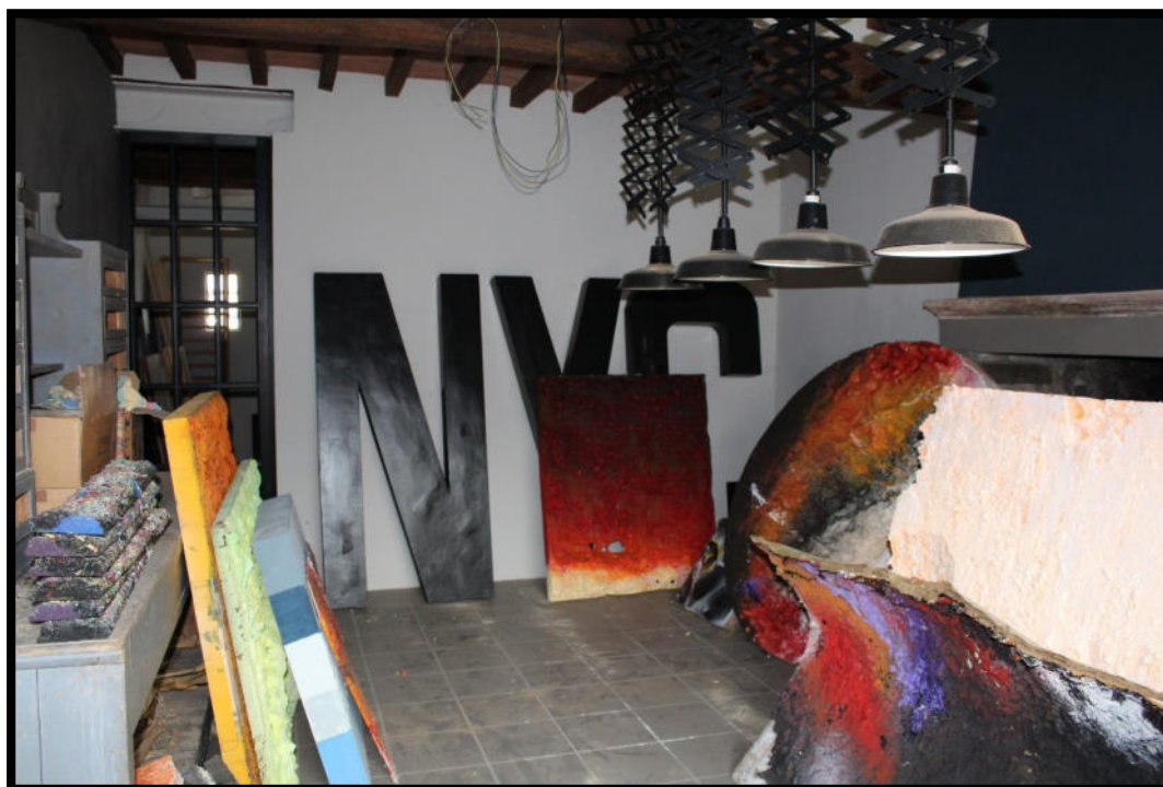
Figura 12 – PIANO TERRA SUB.1