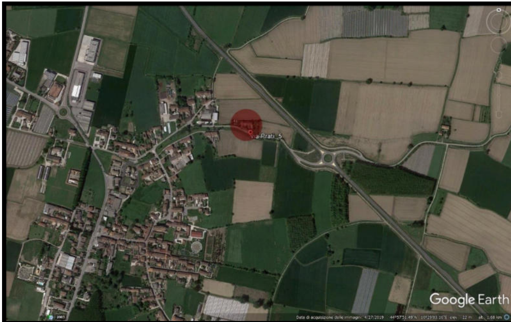
Figura 1 - ORTOFOTO-A