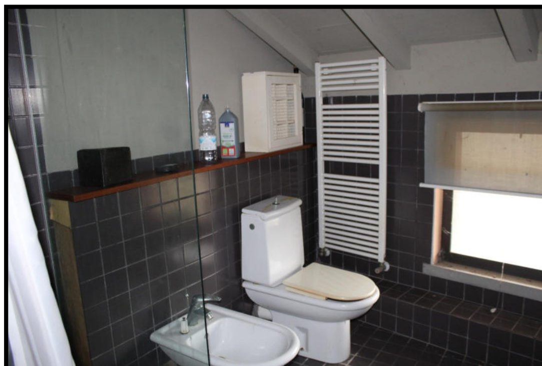
Figura 10 – BAGNO SUB.2