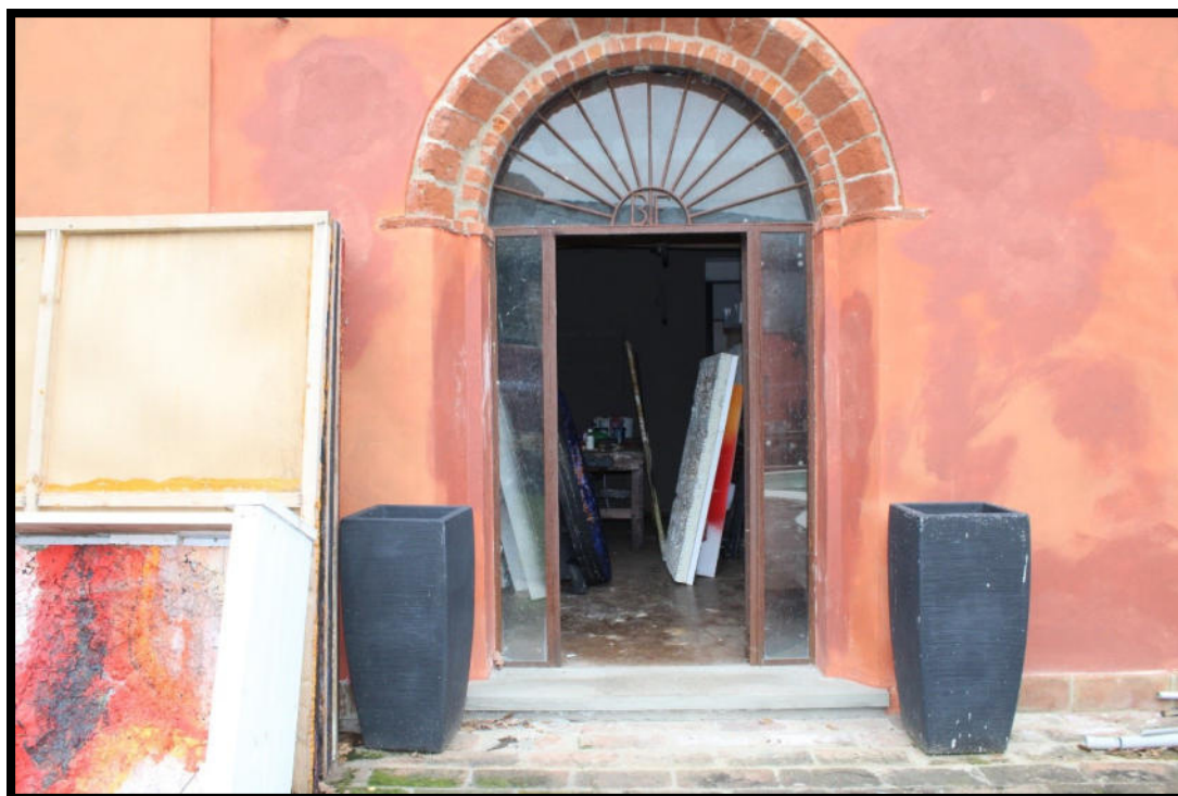
Figura 11 – INGRESSO SUB.1

Tel. 0372 744318 – tania.lena@archiworldpec.it