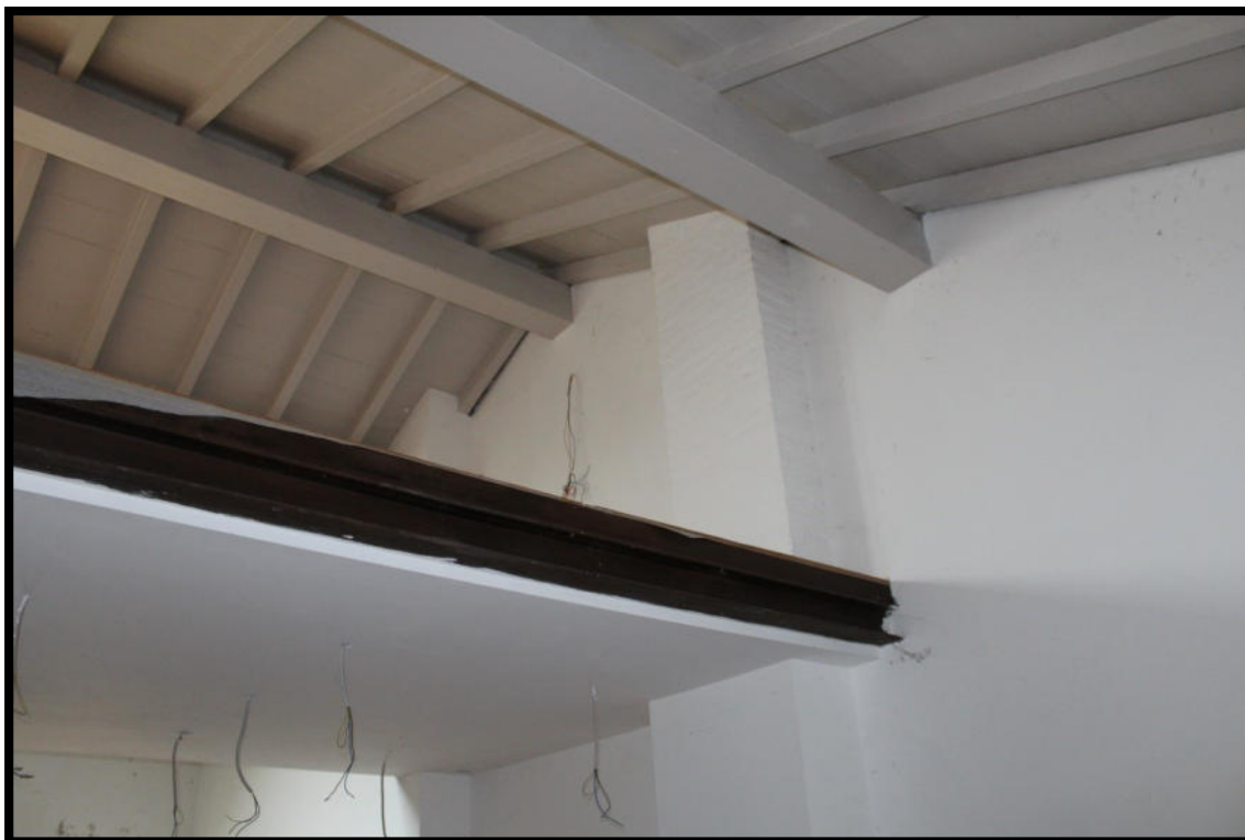
Figura 15 – SOPPALCO SUB.1

Tel. 0372 744318 – tania.lena@archiworldpec.it