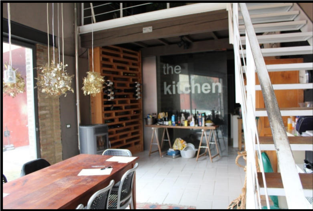
Figura 7 – CUCINA SUB.2

Tel. 0372 744318 – tania.lena@archiworldpec.it