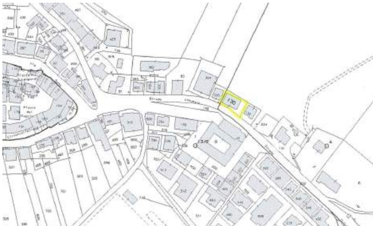
Figura n°9 – Estratto di mappa catastale della zona 3

Si riporta di seguito la mappa catastale con l'individuazione della particella in questione: