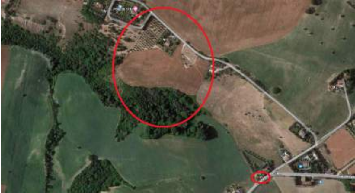
Figura n°1 – Inquadramento territoriale ZONA 1

Il terreno agricolo confina a nord con contrada Lame e nei restanti lati con terreni agricoli di altre proprietà private, mentre la fascia di rispetto stradale confina a sud con la Strada Provinciale n.9, ad est e a nord con lotto edificato di altra proprietà privata e ad ovest con il terreno agricolo di altra proprietà privata.