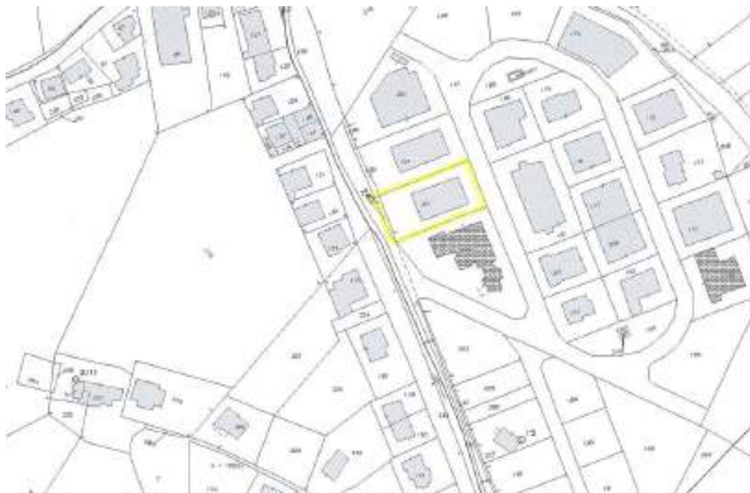
Figura n°6 – Estratto di mappa catastale della zona 2

Si riporta di seguito la mappa catastale con l'individuazione della particella in questione: