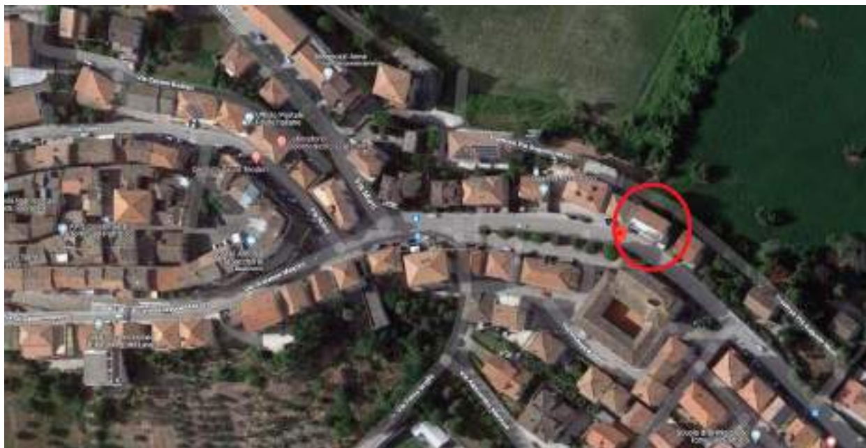
Figura n°7 – Inquadramento territoriale ZONA 3

La terza zona riguarda i beni immobili appartenenti ad un intero edificio sito nel Comune di Torre San Patrizio in viale della Repubblica ai civici n.27,29,31,33, composto da tre negozi, un magazzino e due abitazioni, collocato nella parte est della cittadina e nei pressi del centro abitato e della scuola materna, ad una distanza in linea d'aria di circa 300m dal centro storico.