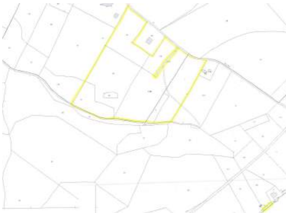
Figura n°3 – Estratto di mappa catastale della zona 1