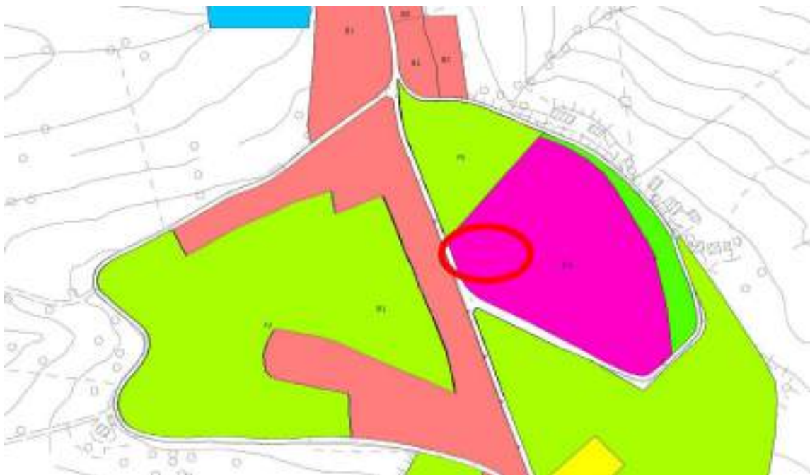
Figura 5 – Estratto P.R.G. della zona 2

Di seguito si riporta l'individuazione dell'edificio all'interno della zona urbanistica di appartenenza.