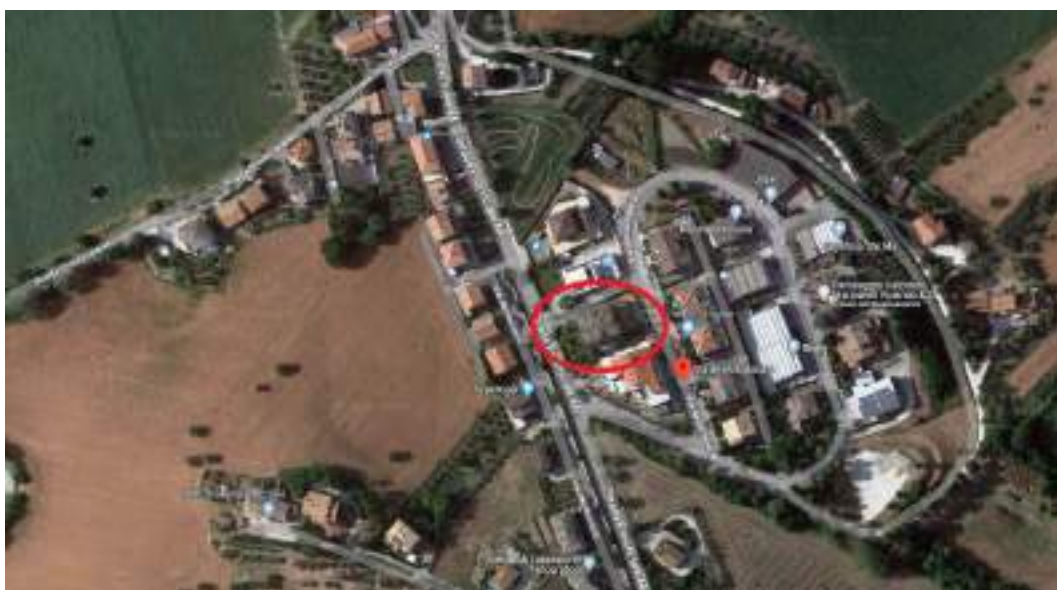
Figura n°4 – Inquadramento territoriale ZONA 2

L’edificio è situato nella periferia sud-ovest della cittadina, all’interno della zona artigianale, e si trova ad una distanza in linea d’aria di circa 1km dal centro storico.