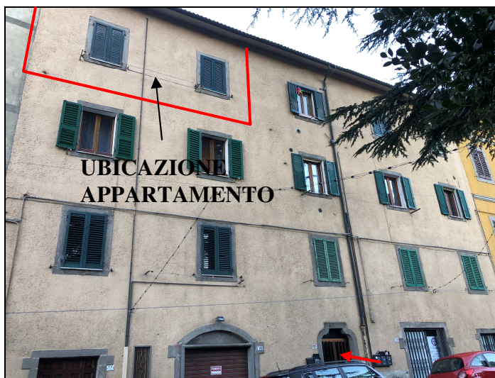
Appartamento in Via Mentana

Consulenza CTU GEOM. SABRINA GUERRINI VIA FIUME N.10 - 53023 CAMPIGLIA D'ORCIA (SI) P.I. 00871270526 e-mail sabrina.guerrini@geopec.it