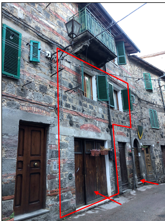
Appartamento in Via Pinelli