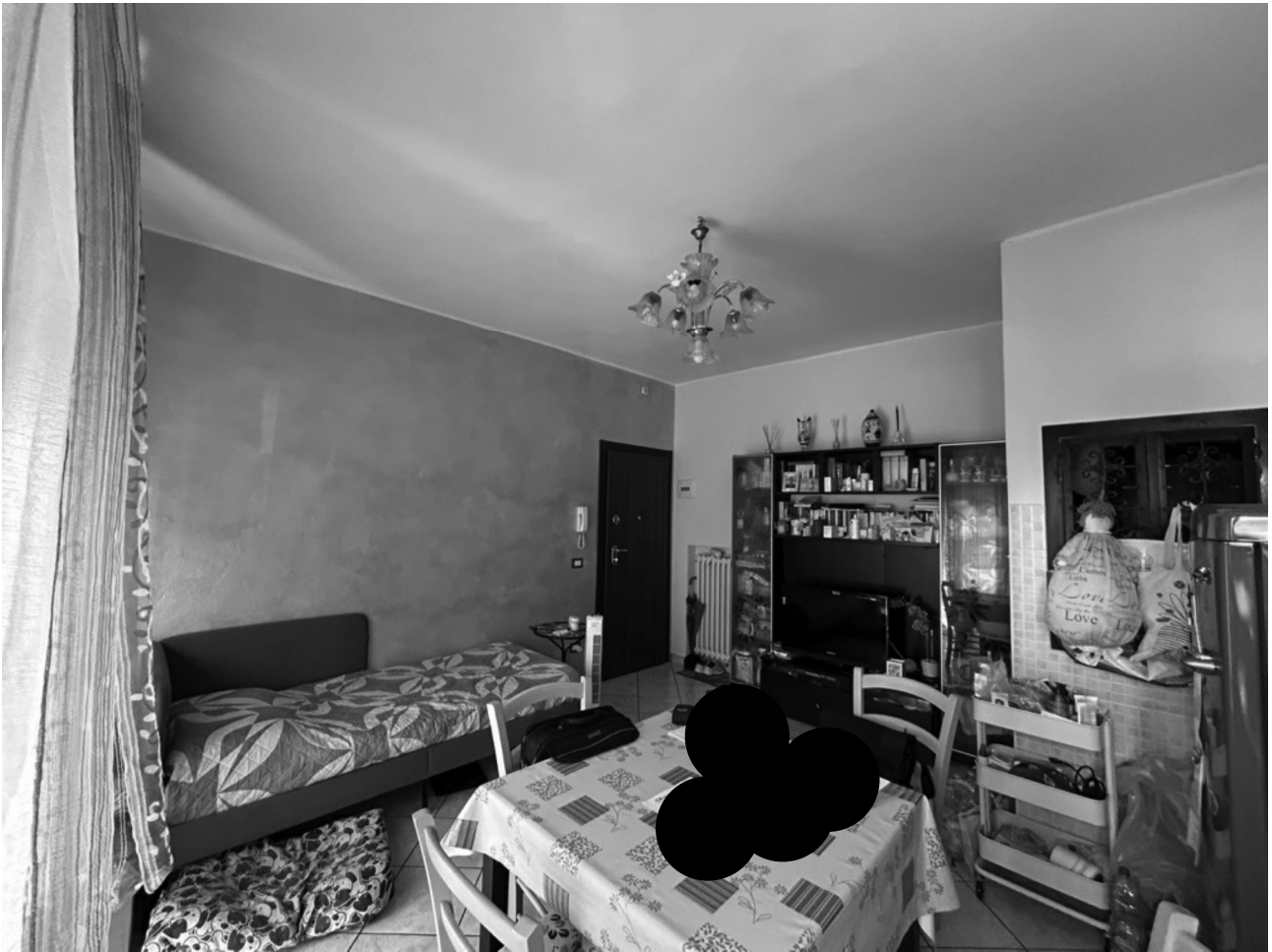
INGRESSO - SOGGIORNO/CUCINA