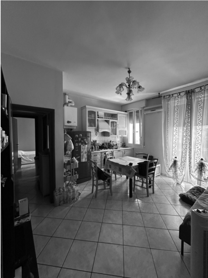
INGRESSO - SOGGIORNO/CUCINA