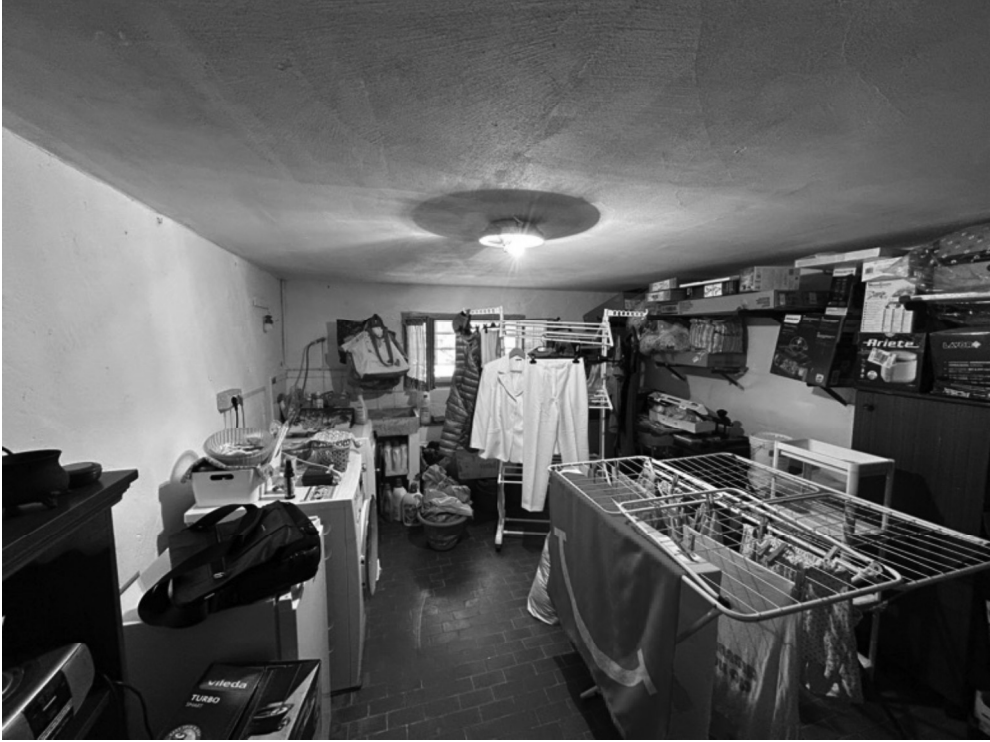
CANTINA - PIANO TERRA