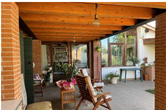
Vista del portico