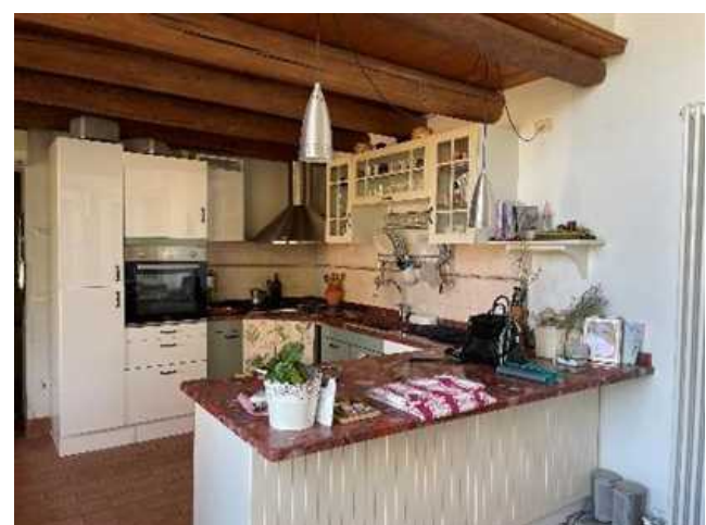
Vista della cucina - pranzo