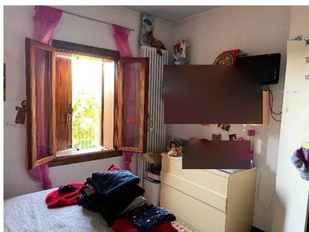
Vista della camera