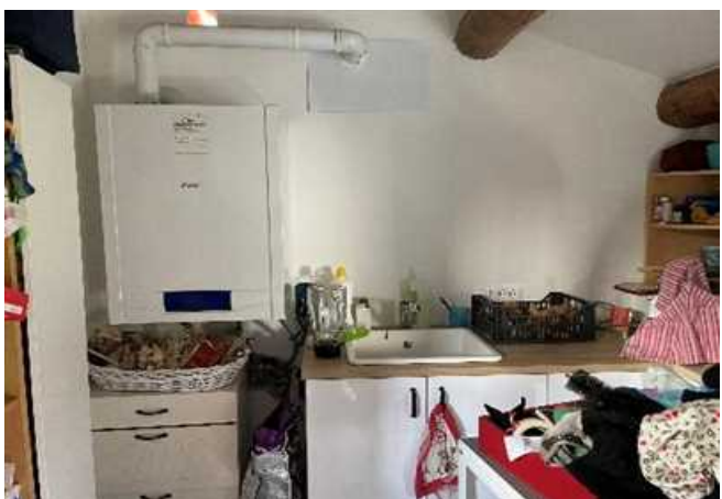
Vista del locale ripostiglio/lavanderia