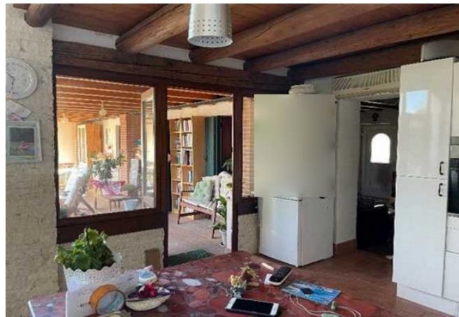
Vista della cucina - pranzo