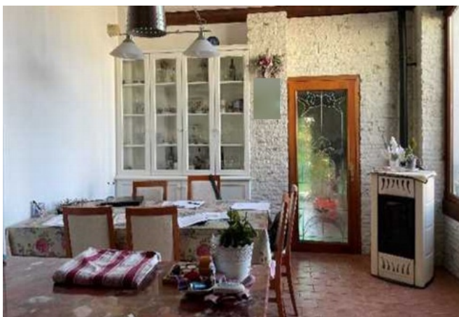
Vista della cucina – pranzo