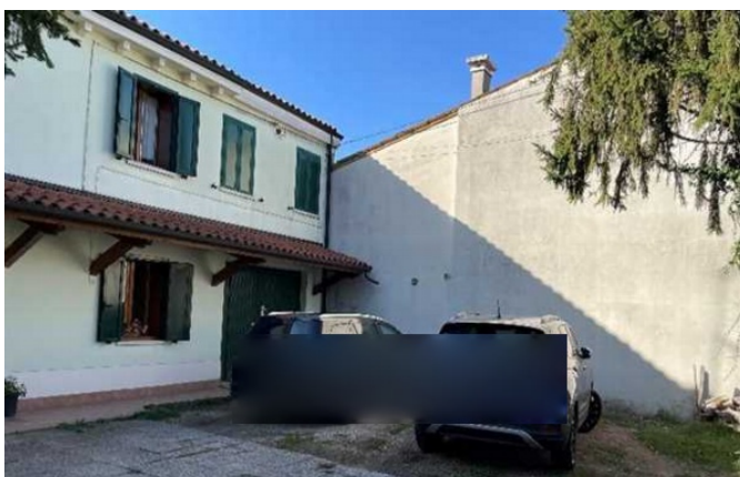
Vista del giardino situato a Nord