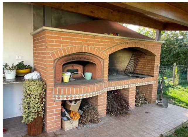
Vista del forno a legna