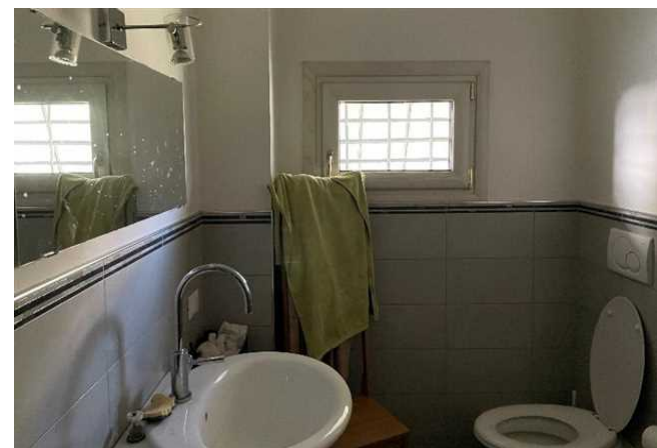
Vista del bagno del PT