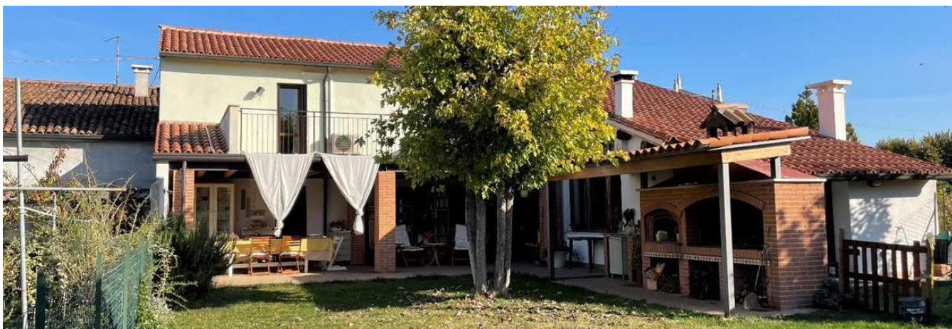
Vista dal giardino situato a Sud