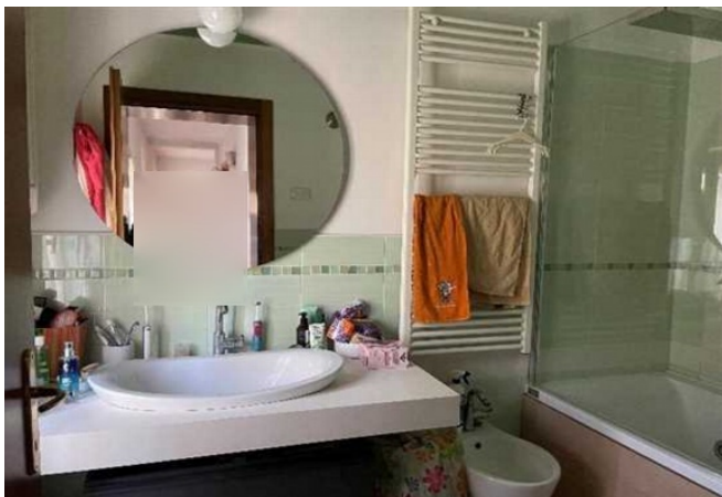
Vista bagno del piano primo

Proc. n. 271/2022 RGE – Rapporto di valutazione Giudice Dr. ssa Maria Antonietta ROSATO Custode IVG VI Perito Arch. Marco VIANELLO