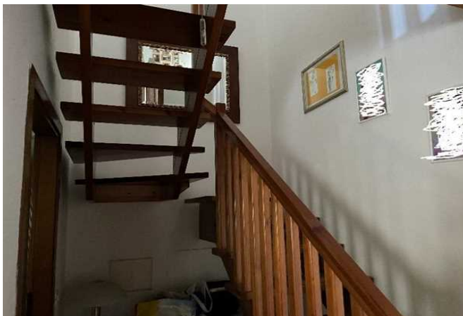
Vista della scala interna in legno