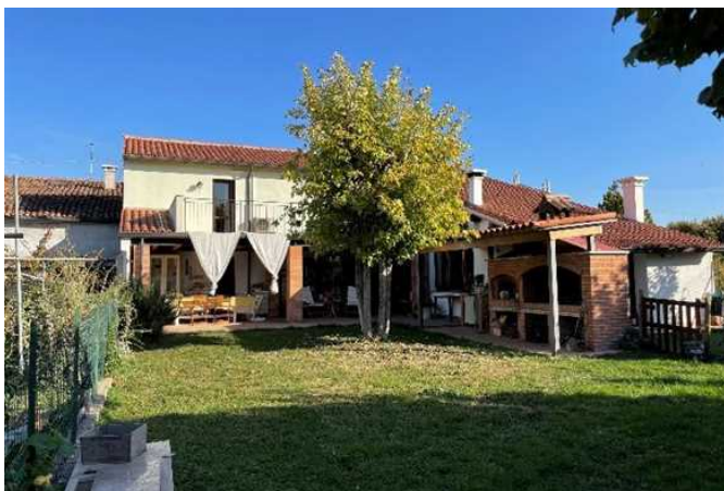
Vista del fabbricato da Sud