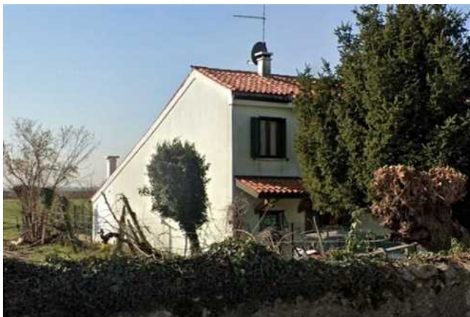
Vista del fabbricato da Nord-Est