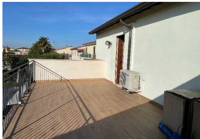
Vista della terrazza