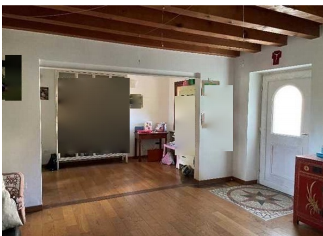
Vista dell'ingresso – soggiorno