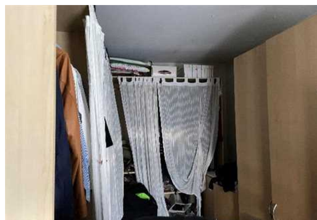
Vista del guardaroba