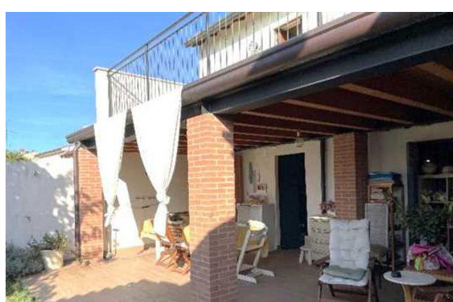
Vista del portico/terrazza