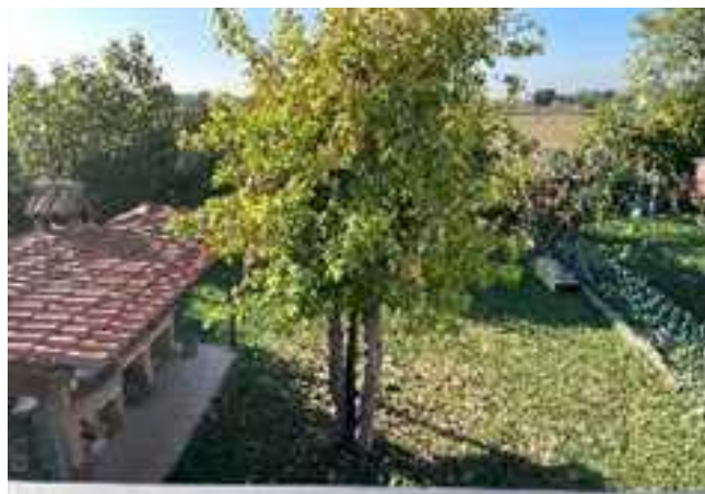
Vista del giardino esterno situato a sud