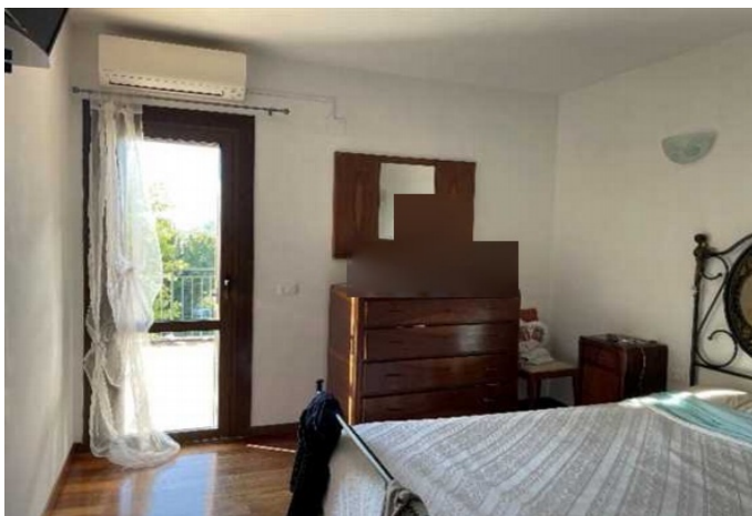
Vista del locale camera matrimoniale

Proc. n. 271/2022 RGE – Rapporto di valutazione Giudice Dr. ssa Maria Antonietta ROSATO Custode IVG VI Perito Arch. Marco VIANELLO