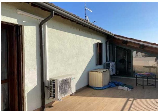
Vista della terrazza