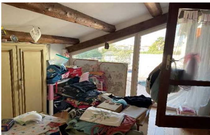
Vista del ripostiglio del piano primo