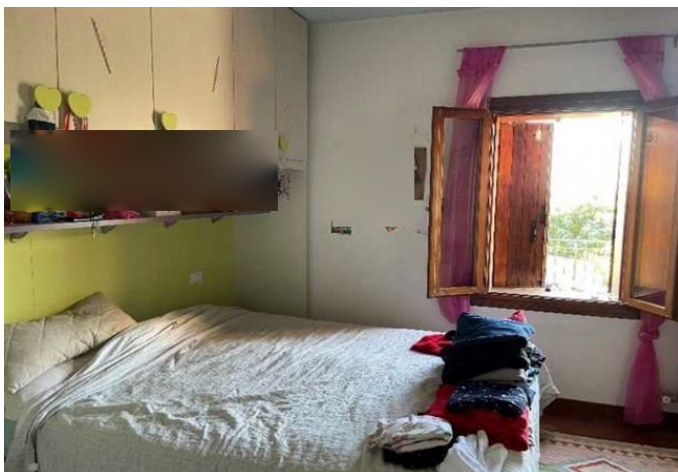
Vista della camera