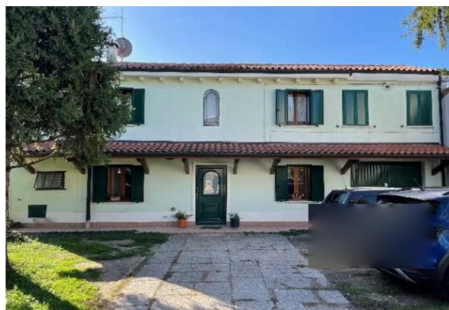
Vista del fabbricato da Nord