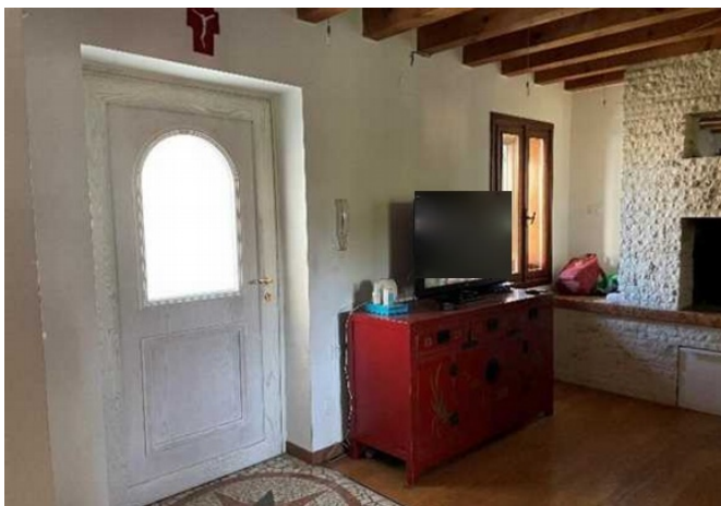
Vista dell'ingresso – soggiorno