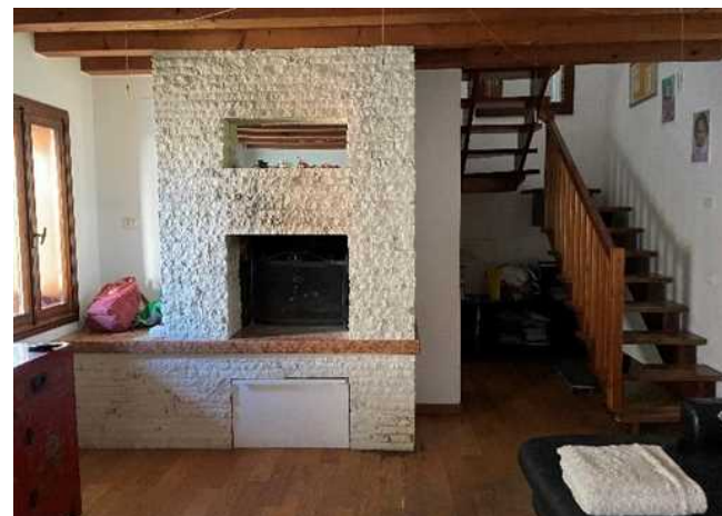
Vista del soggiorno