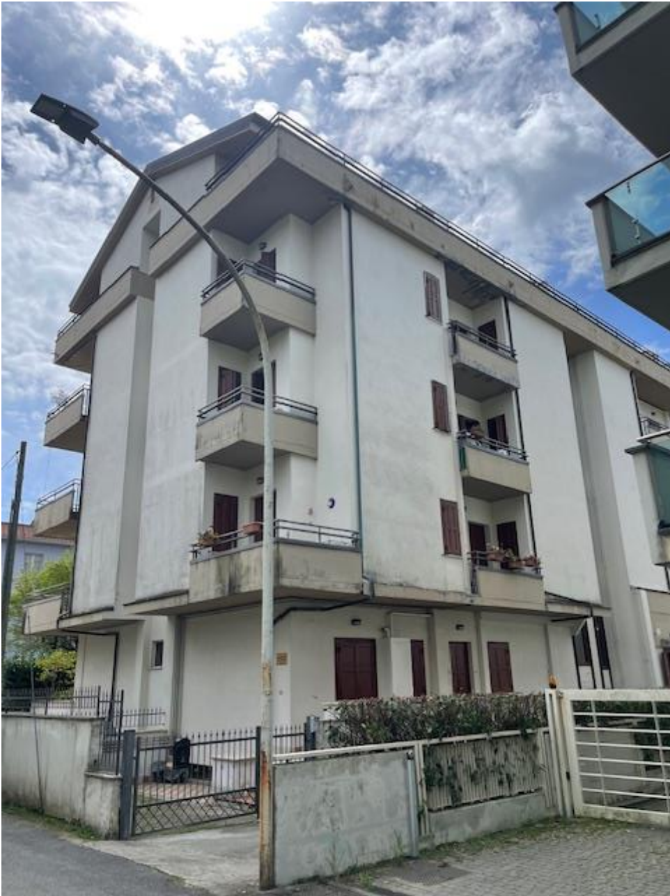
Vista dell'intero fabbricato