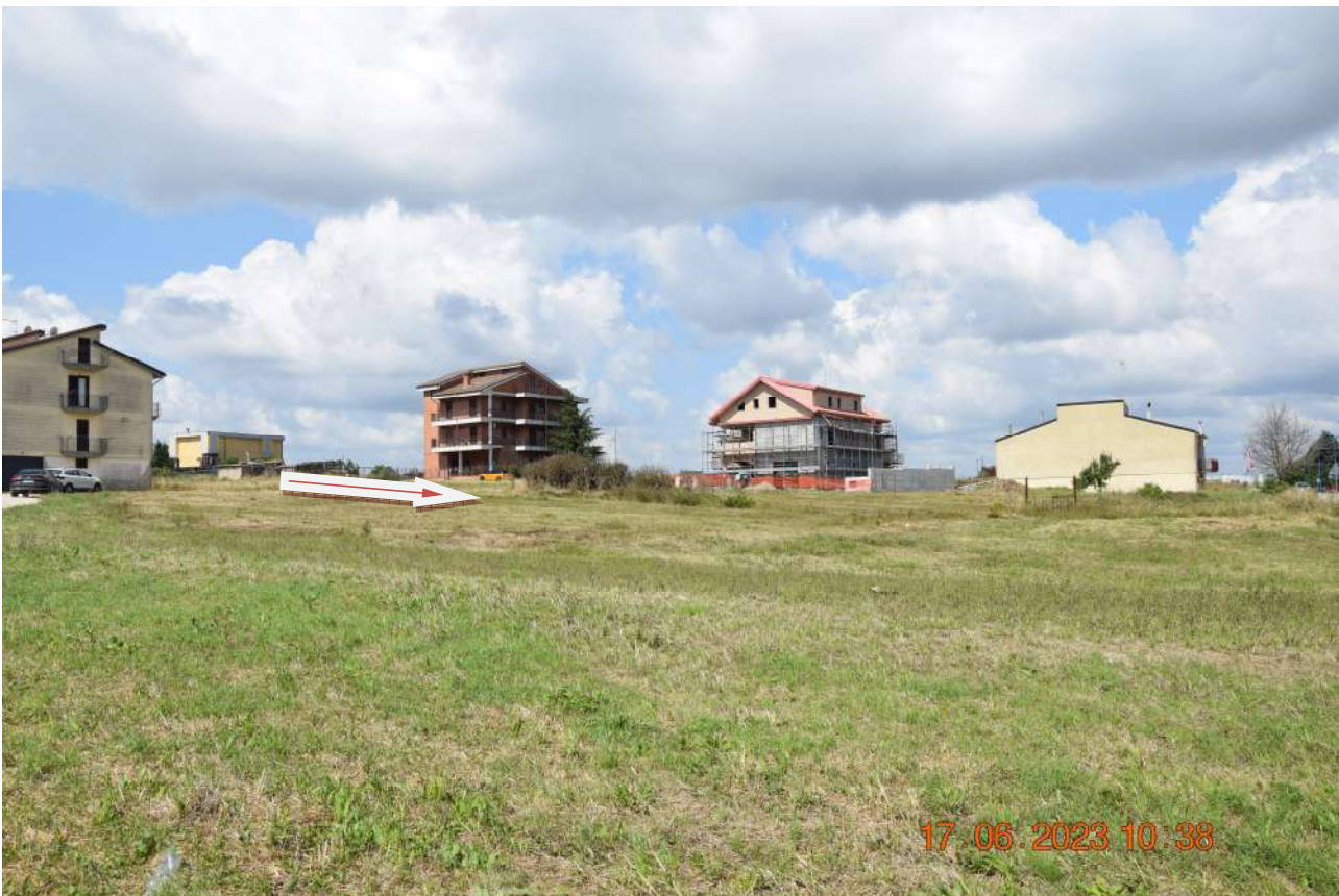
RIPRESA FOTOGRAFICA DELL'AREA - VISTA 1