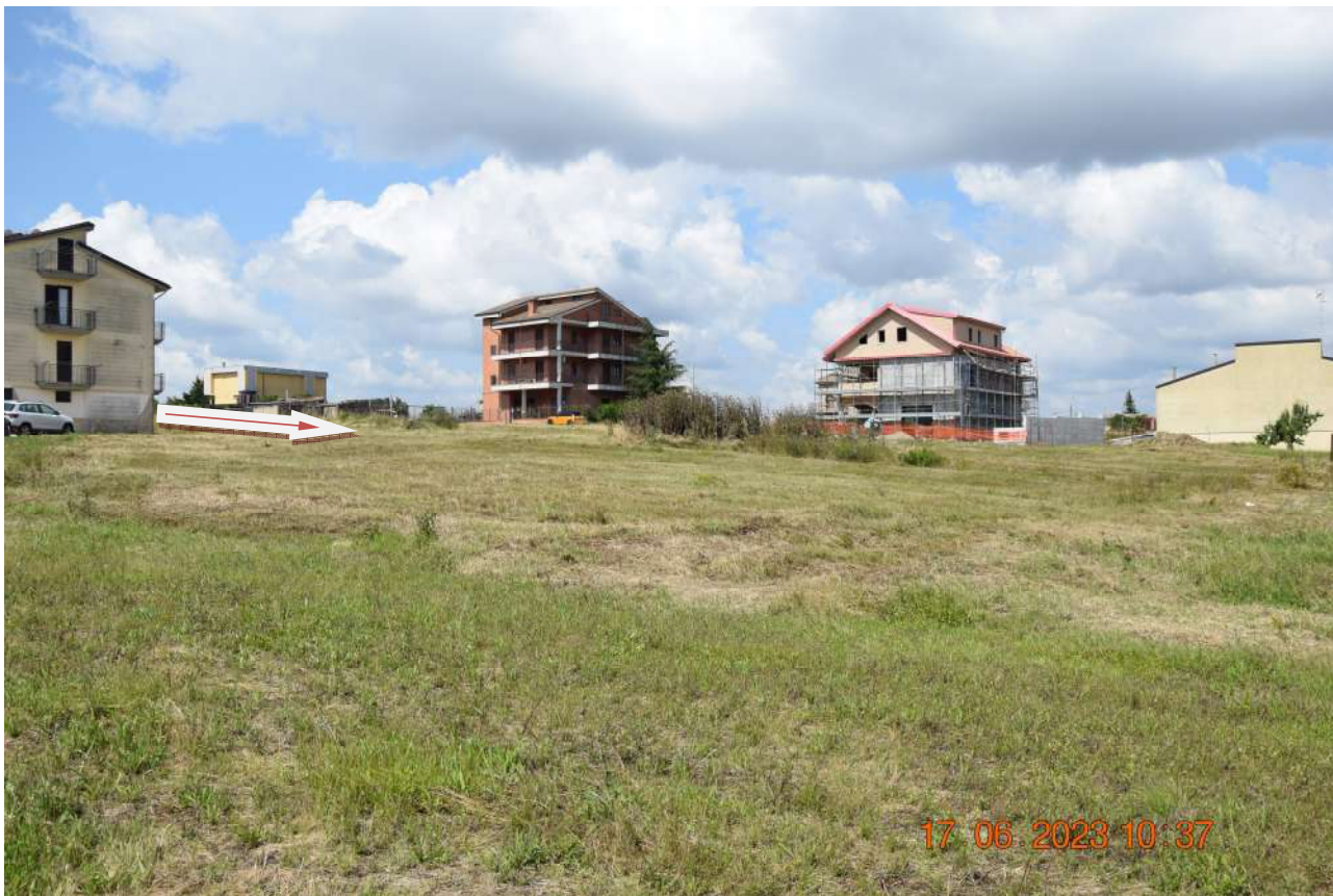
RIPRESA FOTOGRAFICA DELL'AREA – VISTA 4