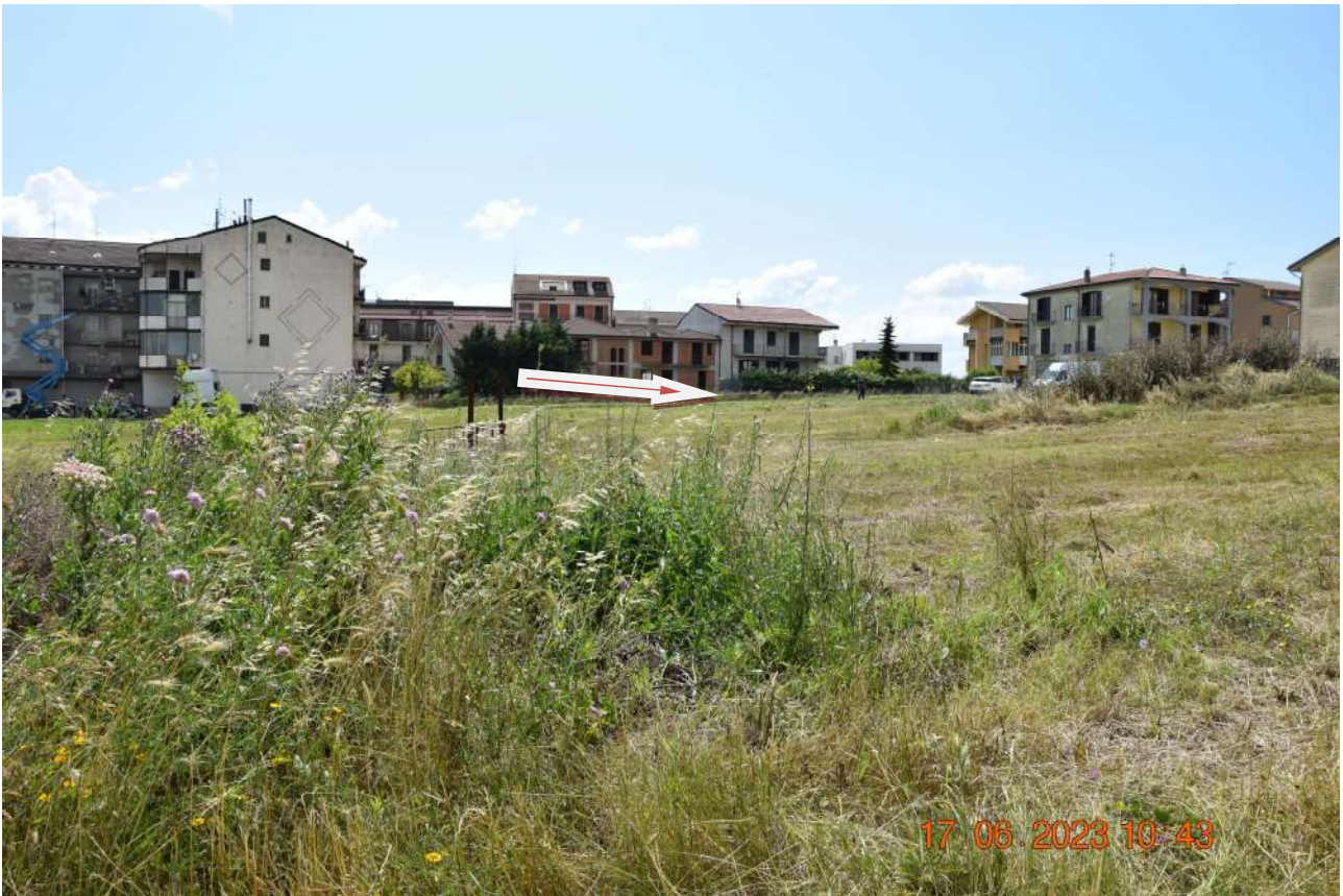
RIPRESA FOTOGRAFICA DELL'AREA – VISTA 3