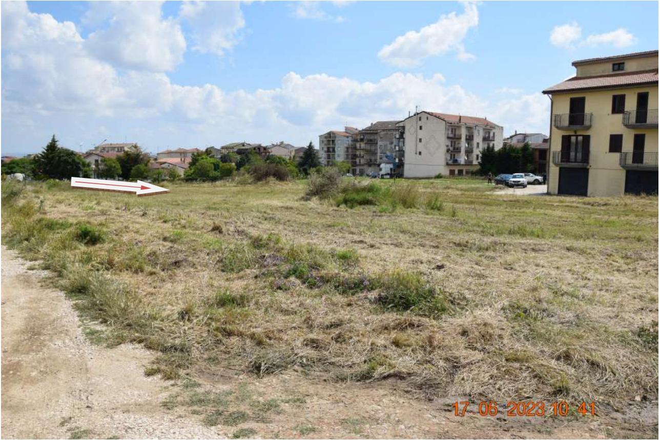
RIPRESA FOTOGRAFICA DELL'AREA – VISTA 2