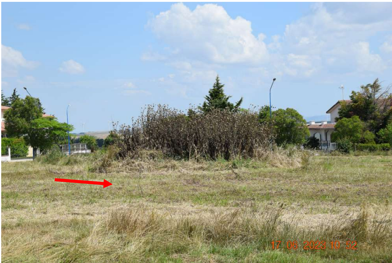
RIPRESA FOTOGRAFICA DELL'AREA – VISTA 5