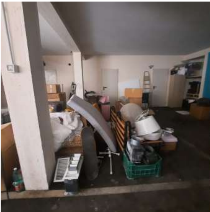
POSTO AUTO SUB. 11