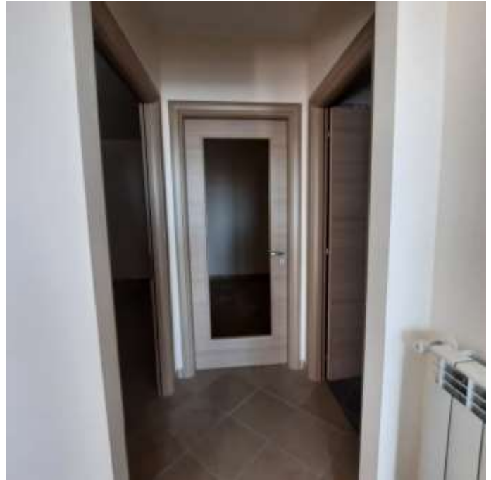
APPARTAMENTO SUB. 2