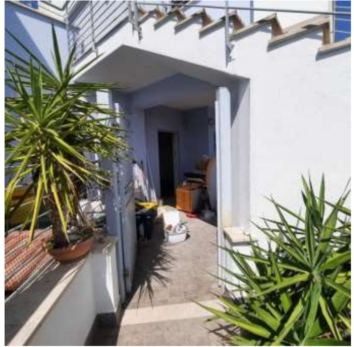
ACCESSO E CORTE ESTERNA SUB. 2