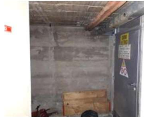
Cabina elettrica PS2