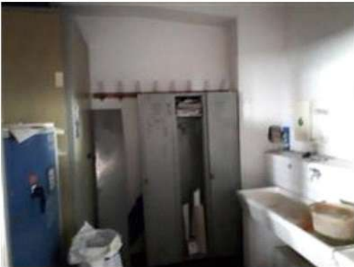
Bagno del laboratorio PS2