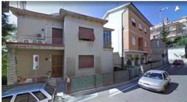
Inquadratura dell'ingresso all'abitazione sub. 1 in Via Angeli n° 22