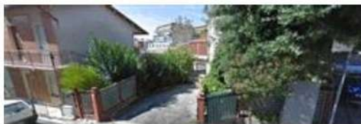
Ingresso alla corte PS1 e al laboratorio sub. 2 in Via Tirso