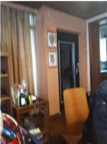
Ascensore sul soggiorno PT