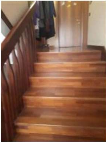
Scala collegamento PT-I