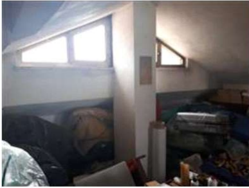
Soffitta allo stato grezzo P2