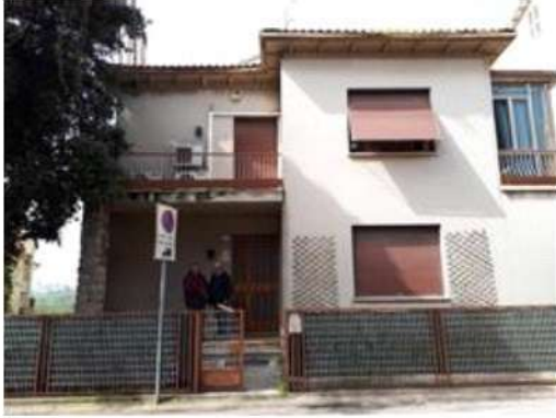
Ingresso abitazione sub. 1 in Via Angeli n° 22