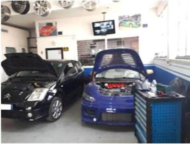
Porzione di PSI affittato alla ditta Fast and Furious