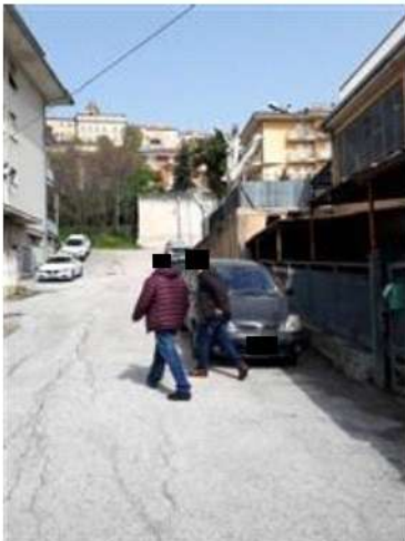
Strada di accesso al PS2 laboratorio sub. 2 e recinzione