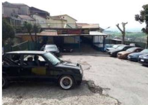
Parcheggio della part. 404 ed accesso alla porzione di laboratorio sub. 2 affittata