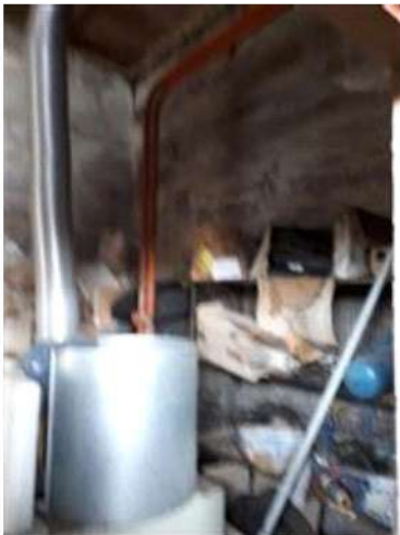
Centrale termica allo stato grezzo PS2