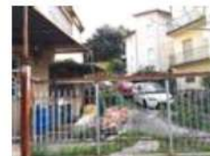
Cancello d'accesso del laboratorio PS2 sub. 2