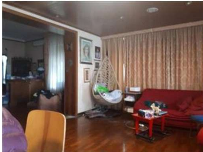
Soggiorno all'interno della veranda chiusa mediante condono PT