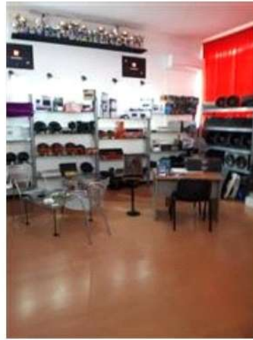
Porzione di PSI affittato alla ditta Fast and Furious