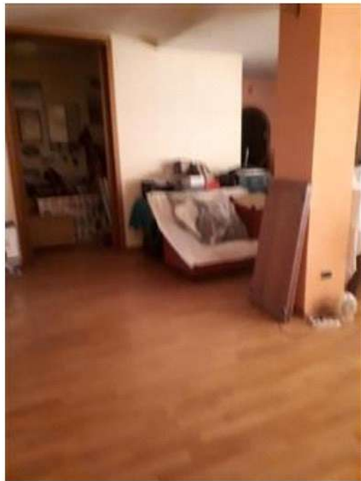
Porzione di PSI collegata all'abitazione