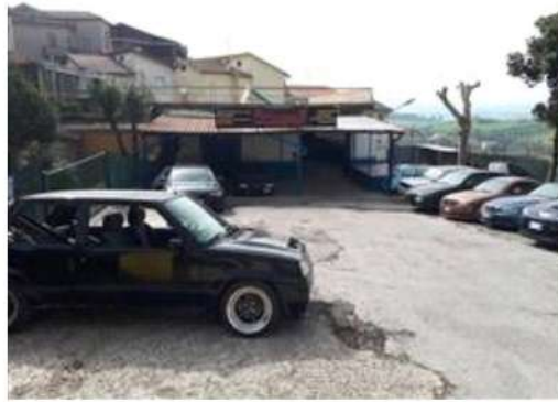
Parcheggio della part. 404 ed accesso alla porzione di laboratorio sub. 2 affittata