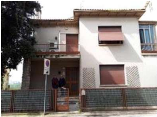
Ingresso abitazione sub. 1 in Via Angeli n° 22