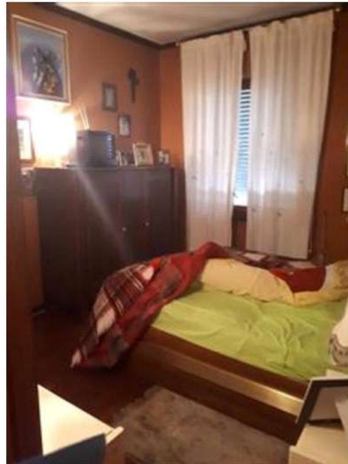
Camera da letto P1