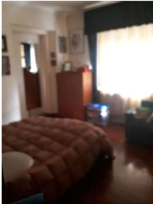
Camera da letto P1