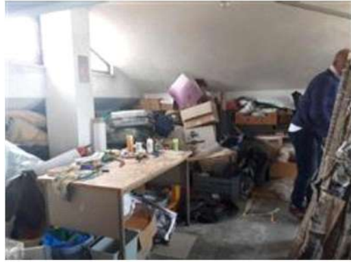
Soffitta allo stato grezzo P2