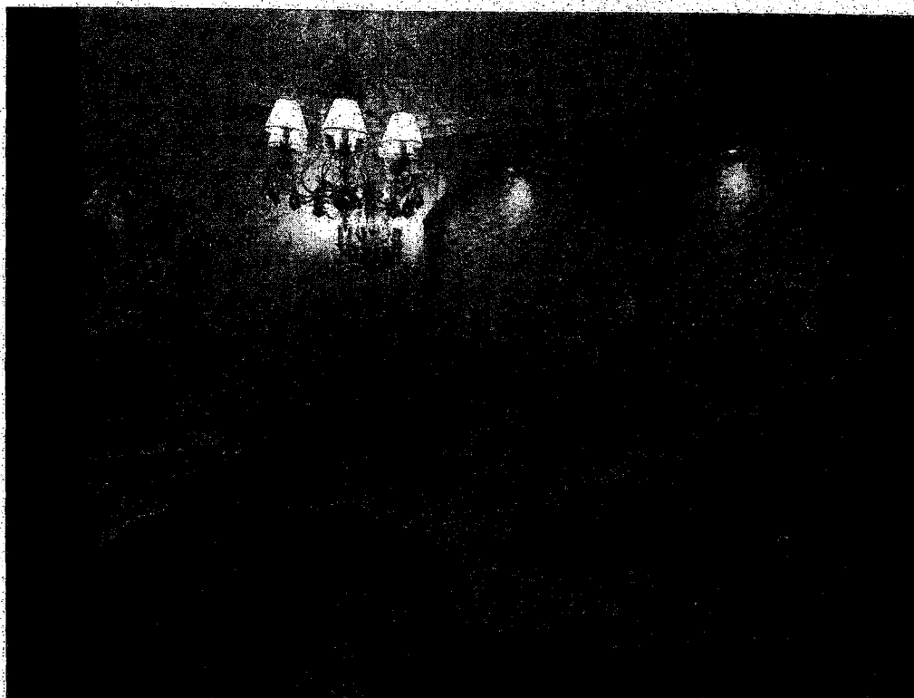
Foto n° 6 - Unità immobiliare al primo piano del fabbricato sito in Gela nella via Bacetilide n.16. In Catasto al foglio 187 part.IIa 386 sub 5; Disimpegno con scala di accesso al 2° piano.