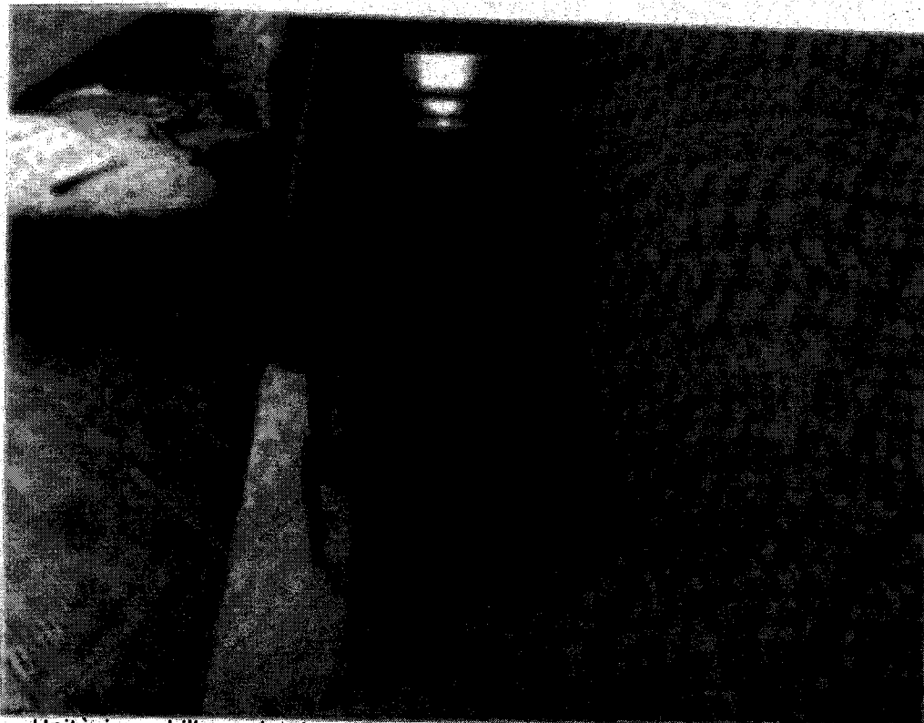
Foto n° 5 - Unità immobiliare al primo piano del fabbricato sito in Gela nella via Bacetilide n.16. In Catasto al foglio 187 part.IIa 386 sub 5; Vano scala.