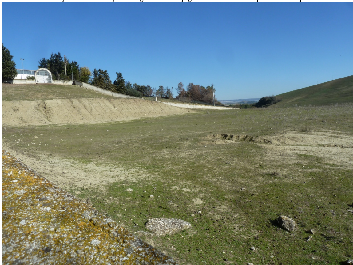
FOTO 7 – Ampia veduta di parte delle superfici delle p.lle 364-14-15-16 e 18 recintate e destinate ad ovile esterno.