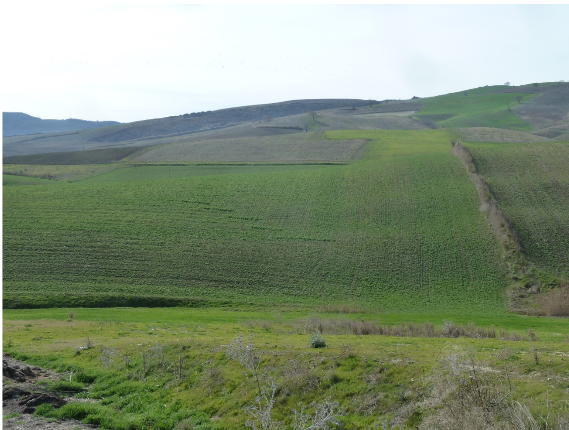
FOTO 6 – Veduta panoramica di parte degli immobili pignorati su aree di impluvio e di dipluvio.