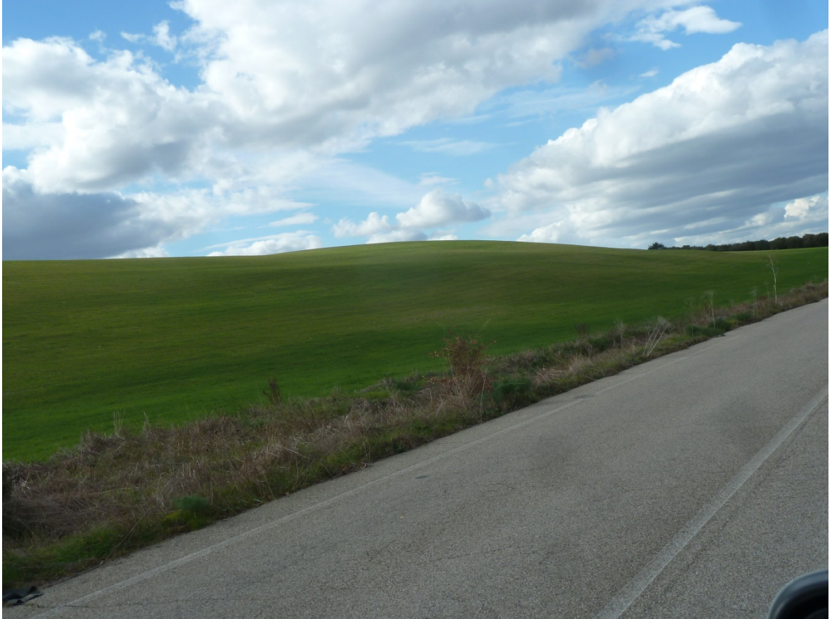
FOTO 4 – Veduta prospettica del fondo di proprietà della ditta debitrice costituita dalle p.lle 3 del fg 4, e le p.lle 170-179-177-176-172 del fg 1.

Andando ulteriormente avanti, sempre in sinistra di chi guida, si distendono le p.lle 3 del fg 4, e le p.lle 170-179-177-176-172 del fg 1 del Comune censuario di Miglionico.