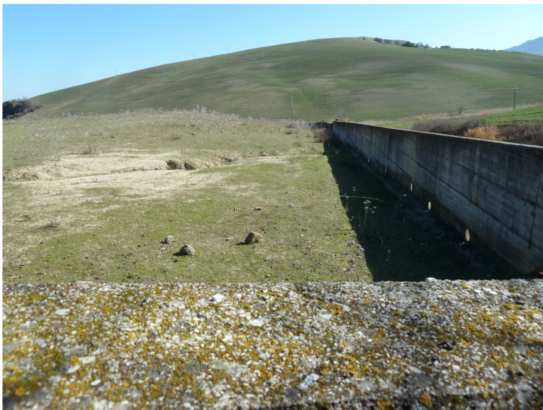
FOTO 8 – Ampia veduta di parte delle superfici delle p.lle 364-14-15-16 e 18 recintate e destinate ad ovile esterno.