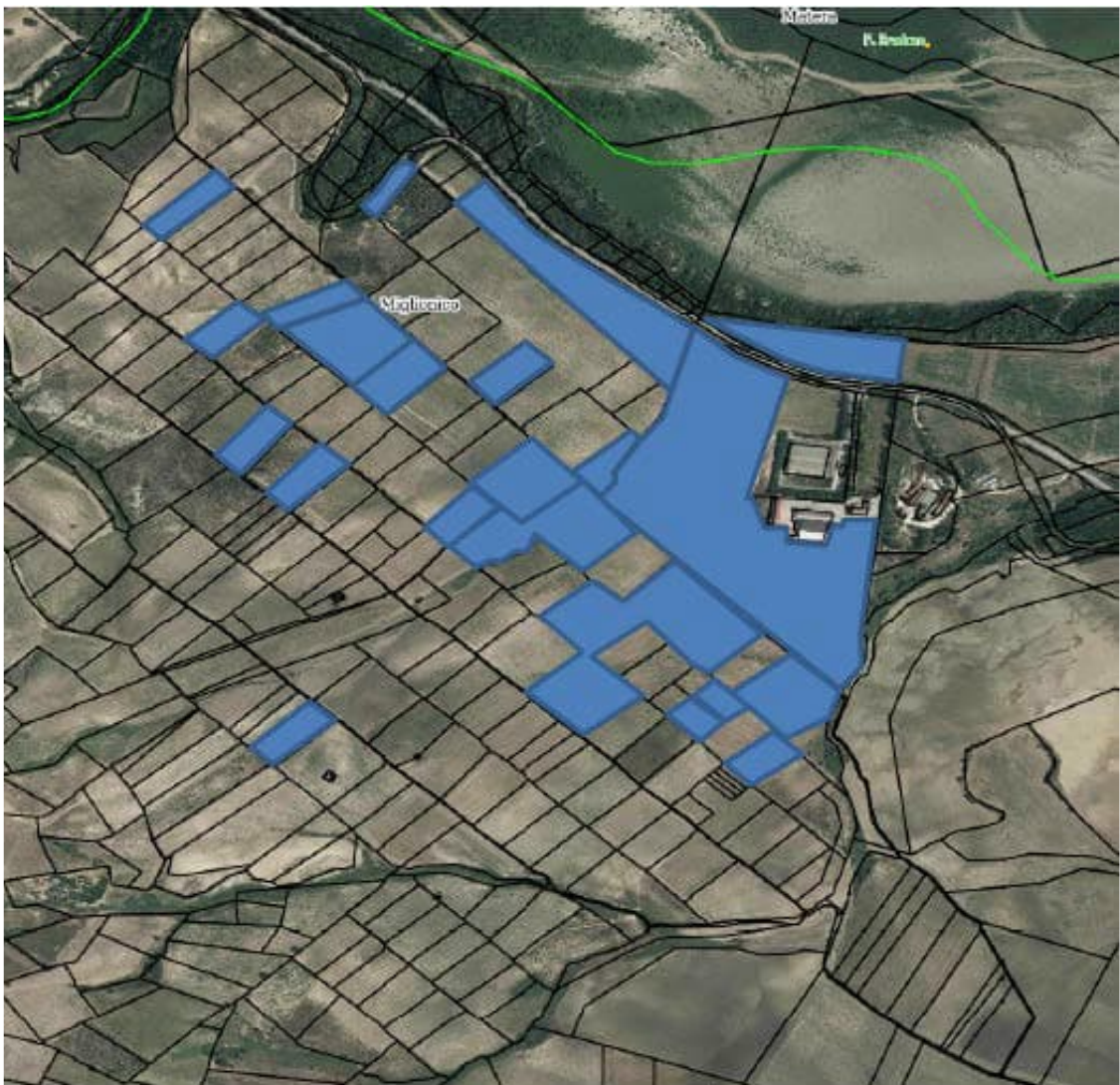
Foto aerea che identifica graficamente in blu tutti gli immobili de [redacted] oggetto di valutazione come riportati nella tabella che precede e che possono essere venduti comprensive delle p.lle che, nella rinnovazione del pignoramento, o sono state riportate con superfici o in difetto o in eccesso rispetto ai dati catastali di riferimento

Nella presente relazione lo scrivente valuterà i predetti immobili con la loro superficie catastale attuale rimettendosi alle decisioni dell'autorità giudiziaria a doverli comprendere tra quelli da includere nell'ordinanza di vendita o meno.