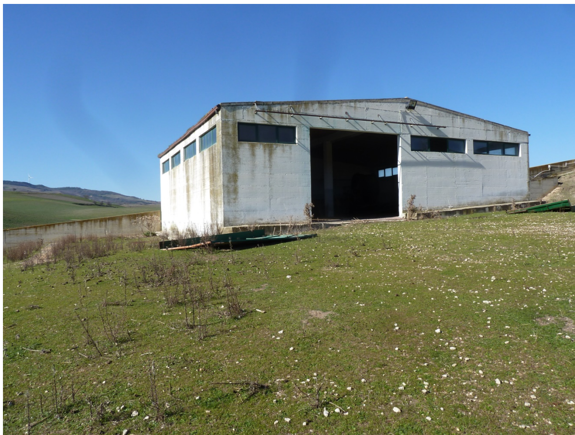
FOTO 10 – Visione dello stesso corpo di fabbrica della foto 9 identificato nel catasto fabbricati come p.lla 361 sub 1 del fg 4. Non è in regola con gli strumenti urbanistici

Sia l'edificio identificato nel catasto fabbricati nel fg. 4 p.lla 361 sub 1 che il recinto che perimetra l'ovile non sono in regola con gli strumenti urbanistici in vigore. Il bene non è condonabile ai sensi della legge 47/85 e successive modificazioni ed integrazioni ma è sanabile. Per quantificare gli oneri da versare per la sanatoria dell'abuso edilizio è necessario produrre documenti ed elaborati grafici che prevedono costi le cui somme non è stato possibile anticiparle dallo scrivente.