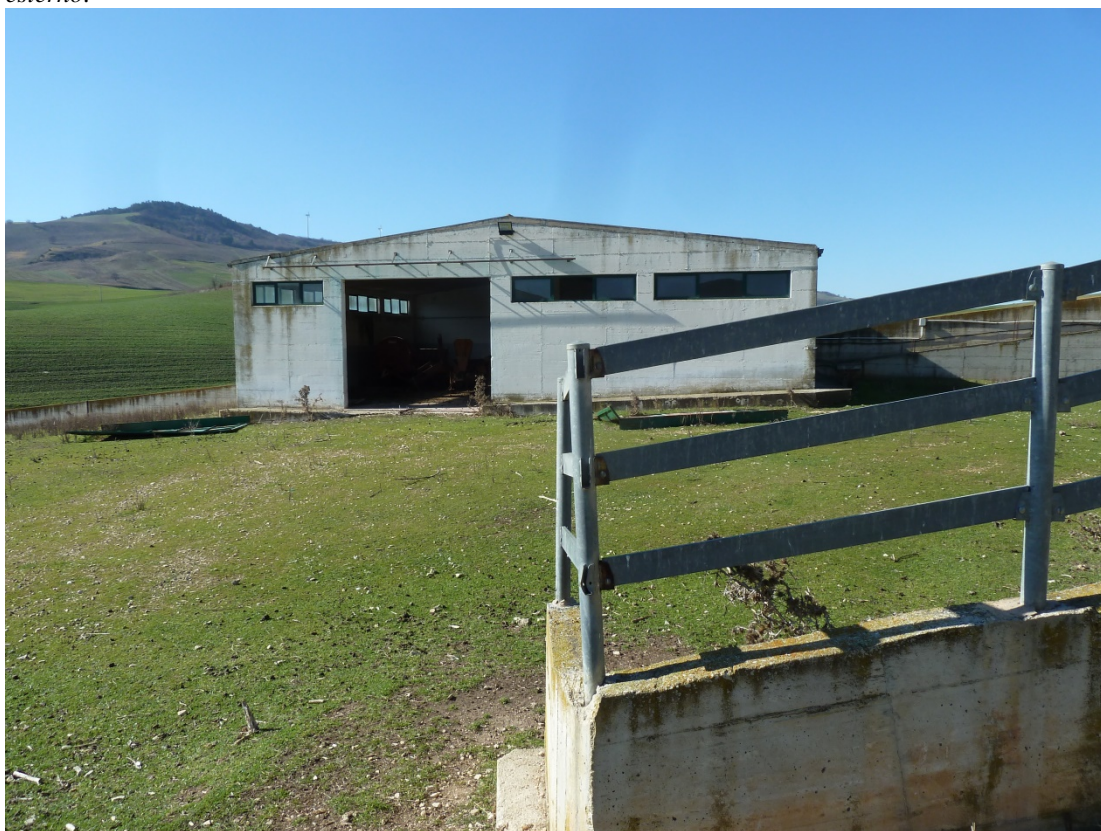
FOTO 9 – edificio identificato in catasto fabbricati come p.lla 361 sub 1 del fg 4. Non è in regola con gli strumenti urbanistici