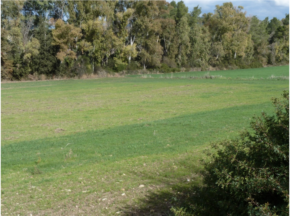
FOTO 1 – Veduta panoramica della p.lla 239 fg 4 del Comune di Miglionico