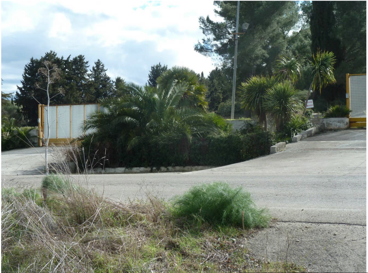
FOTO 3 – Sulla sinistra il cancello di accesso del centro aziendale de [REDACTED] srl, mentre sulla destra, un piccolo scorcio del cancello di ingresso alla p.lla 323 del fg 4 di altra proprietà

In consecuzione al cancello di accesso del centro aziendale de [REDACTED] [REDACTED] vi è un ulteriore cancello di ingresso alla p.lla 323 del fg. 4, di altra proprietà.