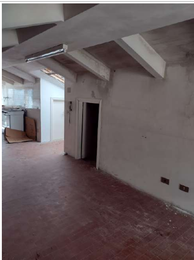
Sottotetto praticabile sub 1