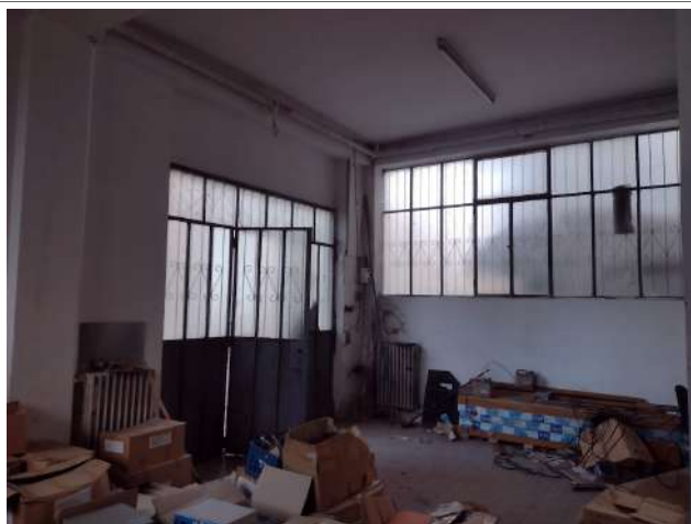
Interno sub 3