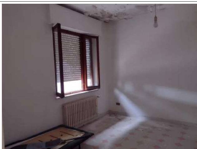
Part. Interno vani infiltrazione acqua da copertura