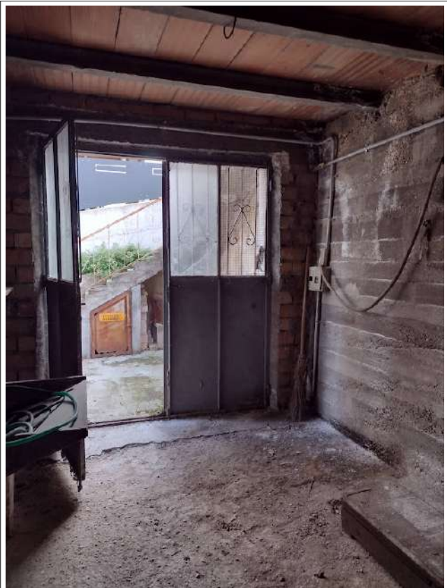
Interno sub 2