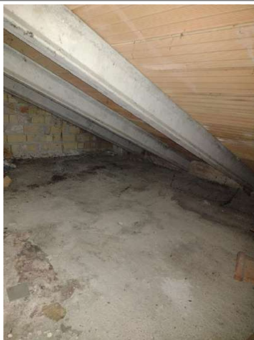
Vista soffitta non praticabile loc tecnico