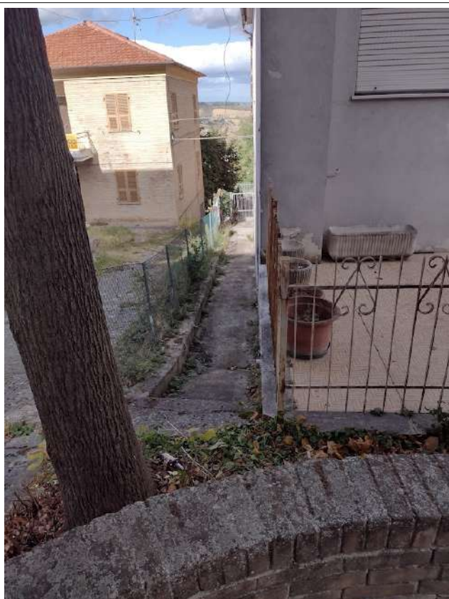
Particolare confine ovest