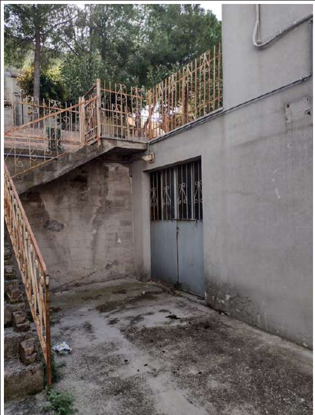
Particolare ingresso sub 2 su corte comune est