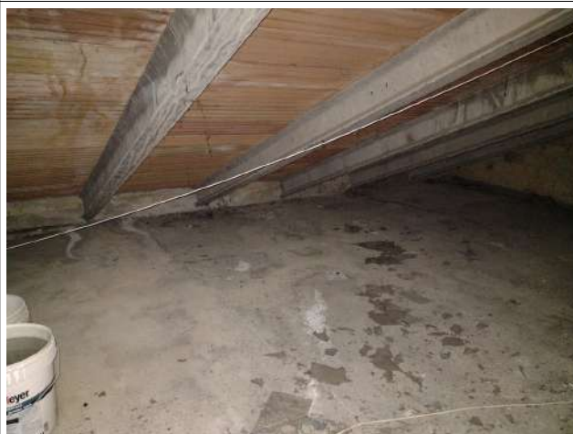
Vista soffitta non praticabile loc. tecnico