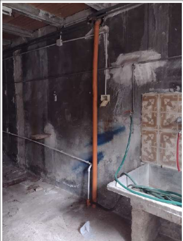
Part. Interno sub 2