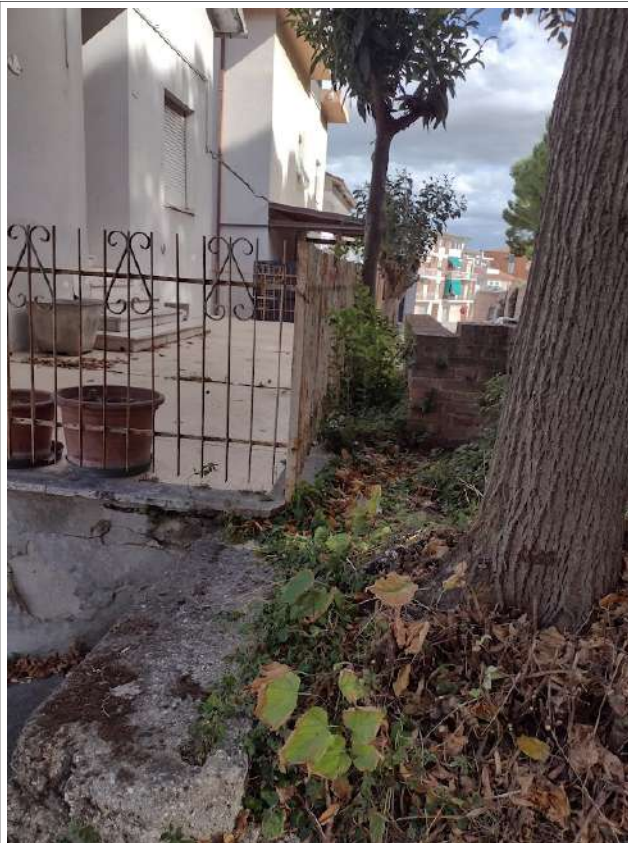
Particolare vista corteo cintata , via Umbria