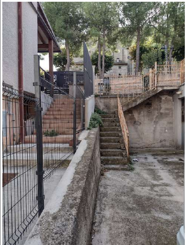
Particolare raccordo corte esterna est con livello via Umbria