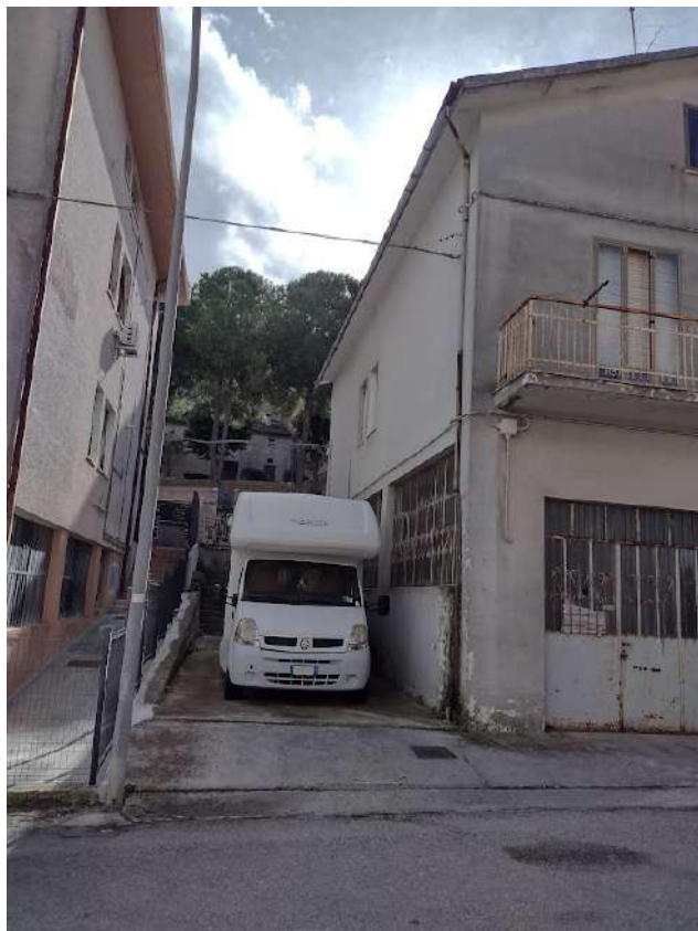
Corte esterna est