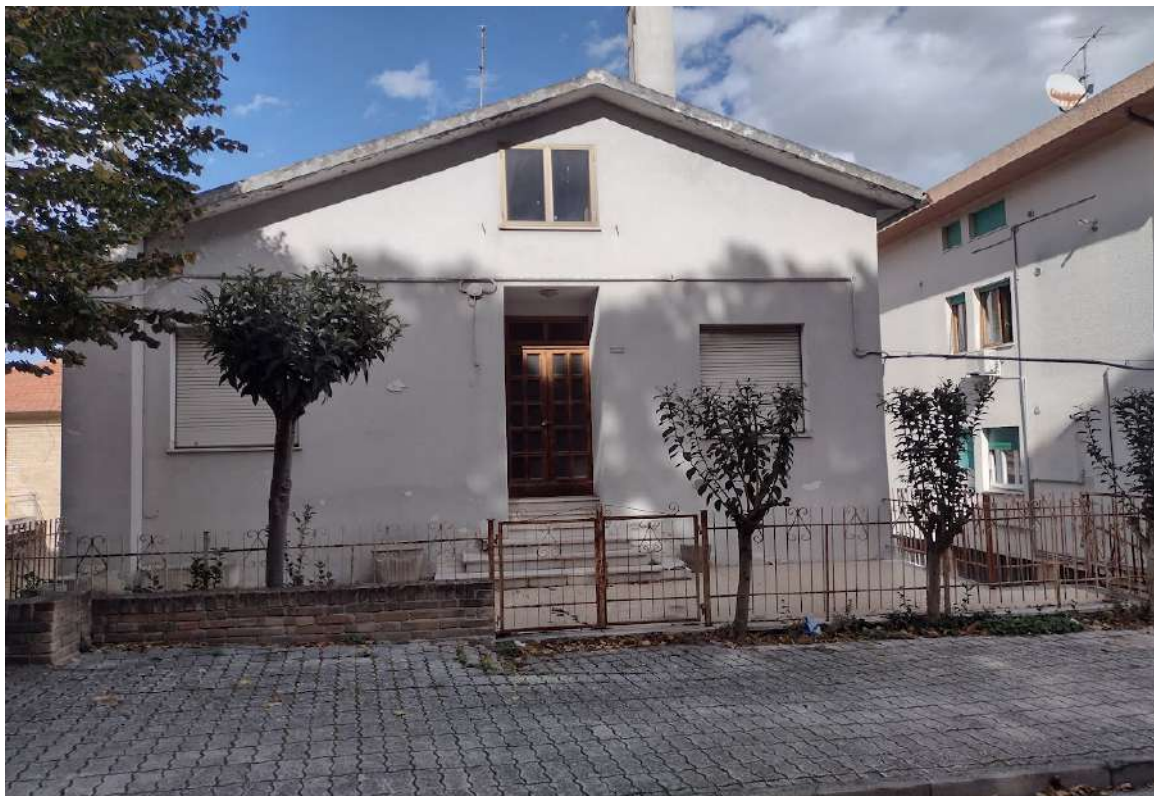
Prospetto sud via Umbria