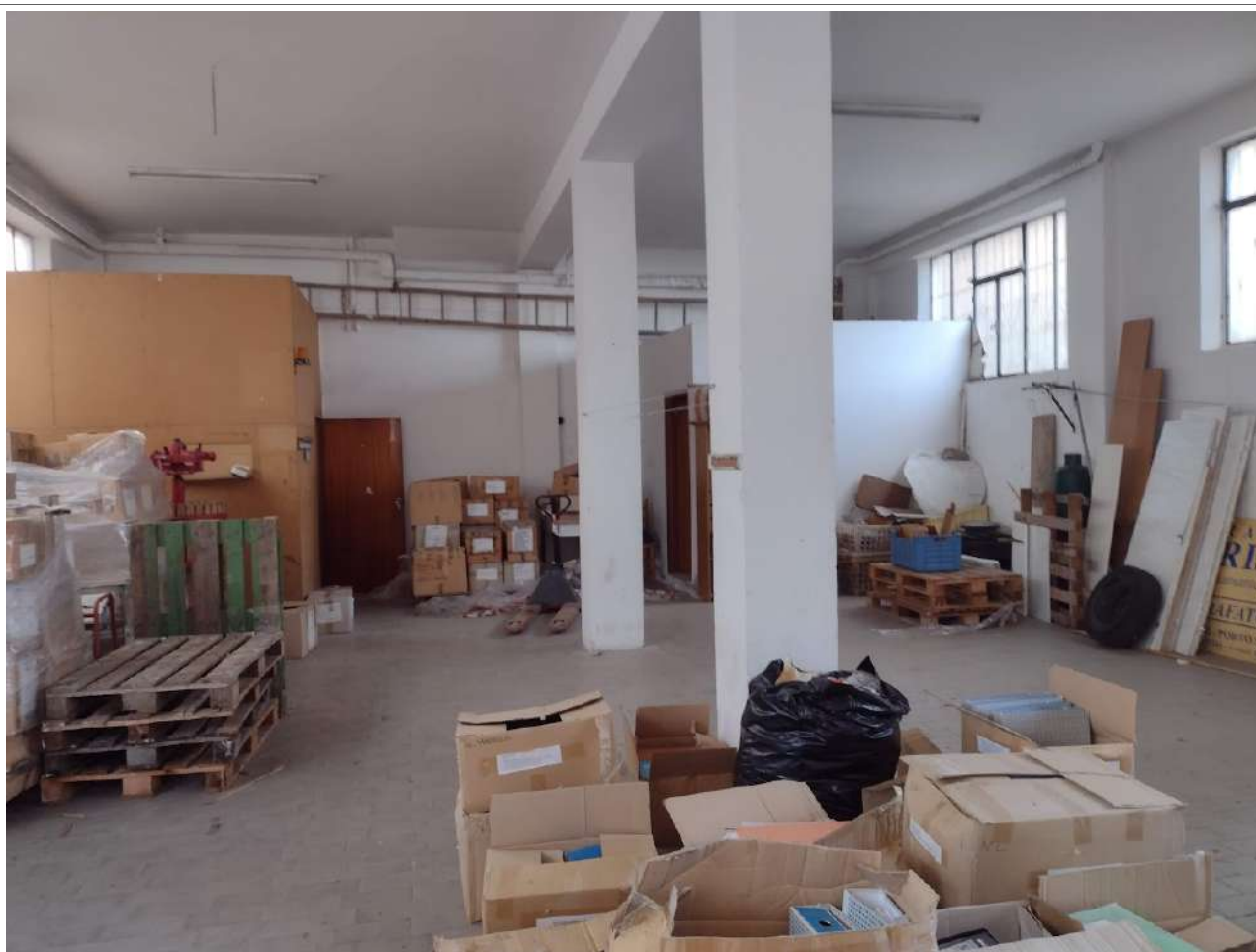
Interno sub 3