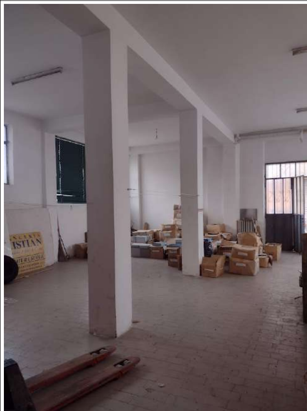
Interno vano accessorio