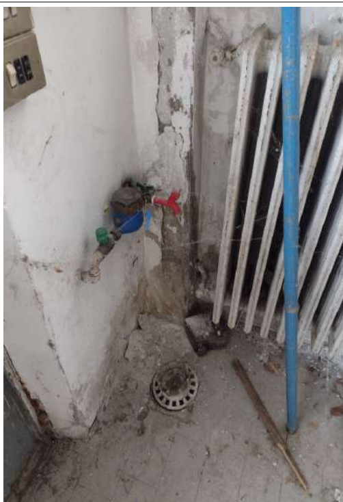
Contatore acqua interno sub 3