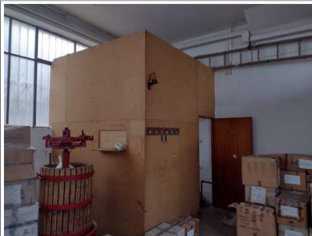
Interno sub 3