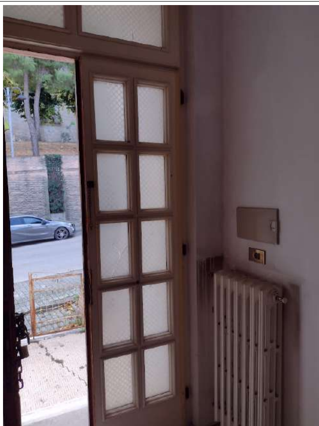
Part. Portone ingresso sub 1