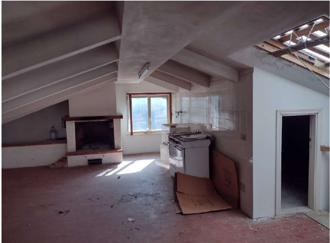
Locale sottotetto praticabile