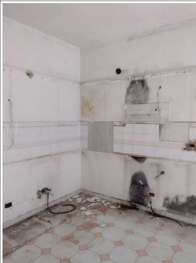
Part. Cucina sub 1