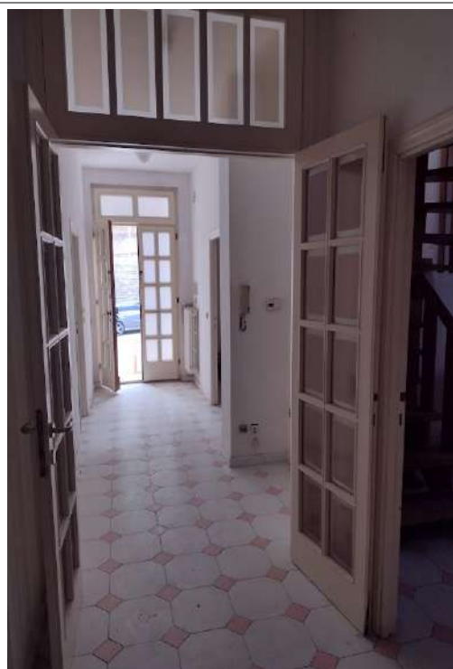
Vista interno corridoio