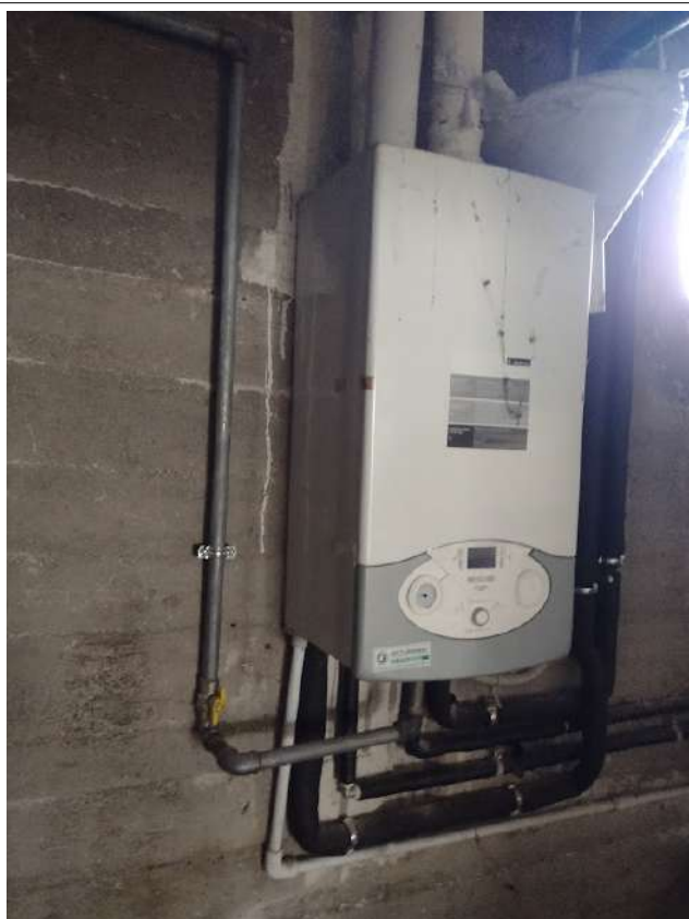
Caldaia sub 1 interna loc tecnico seminterrato