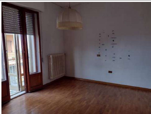
Interno sub 1 p.terra