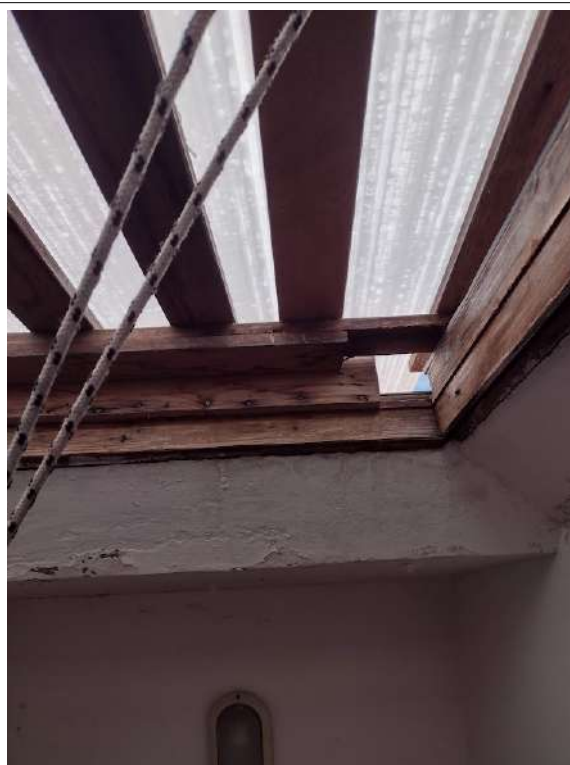
Vano Lucernaio a soffitto ill. scala