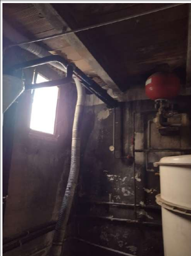
Interno loc tecnico sub 1