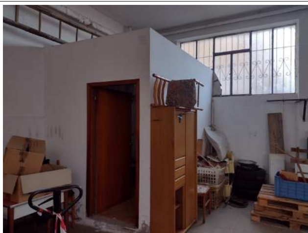
Interno sub 3 vista wc