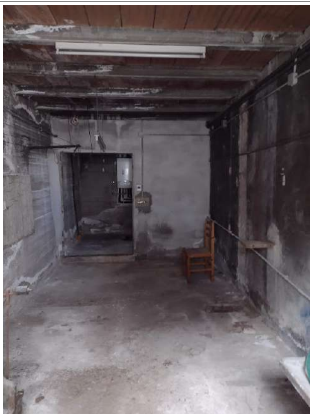
Interno sub 2 vista verso loc tecnico sub 1