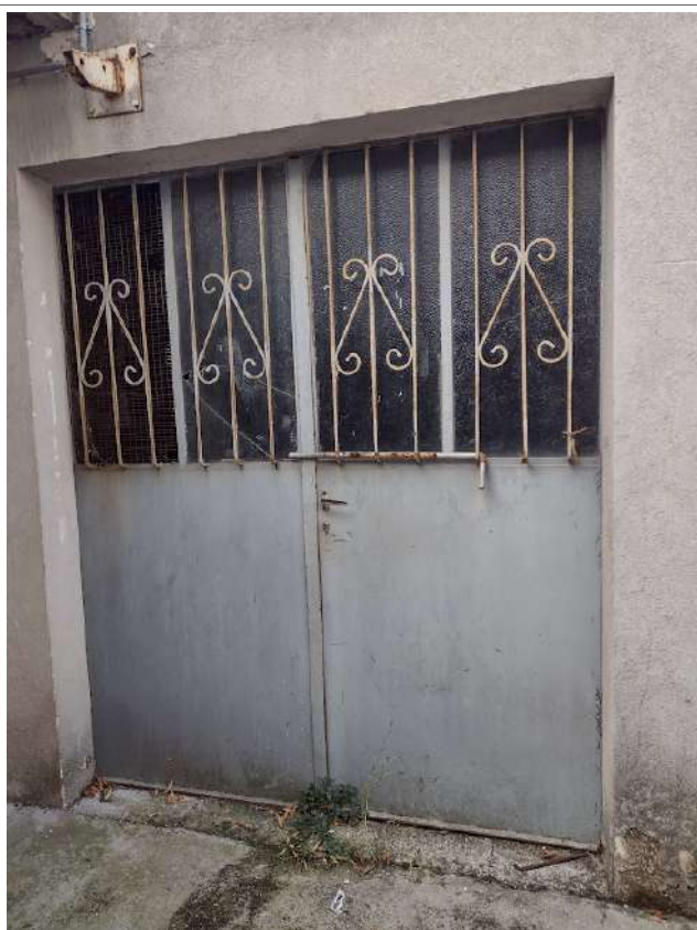
Part. Portone in ferro sub 2