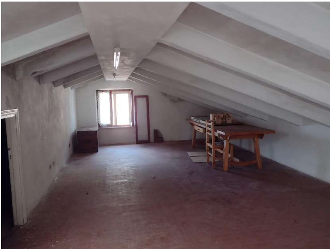
Locale sottotetto praticabile