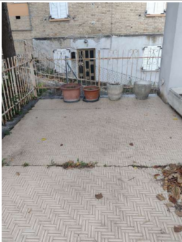
Terrazzo copertura sub 2 e loc tecnico sub 1