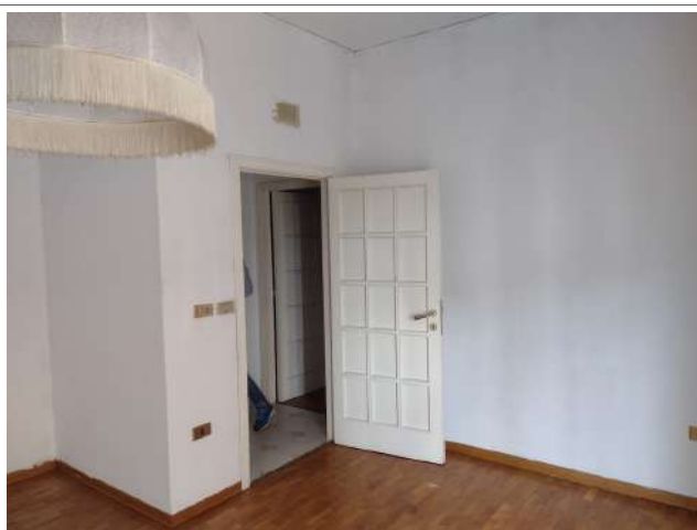
Interno camera sub 1