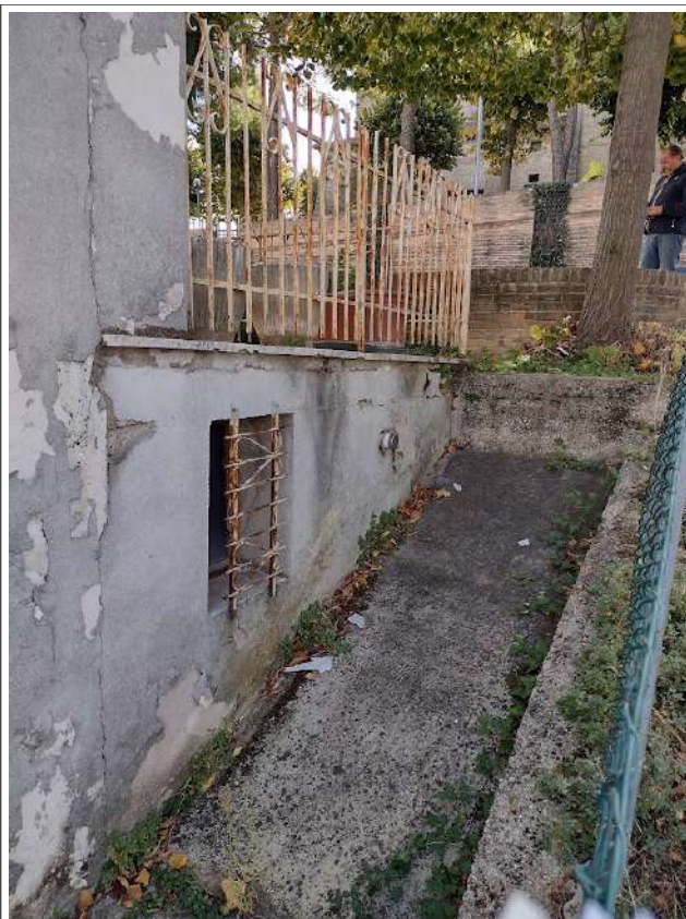
Part. Coret esterna ovest caldaia sub 1