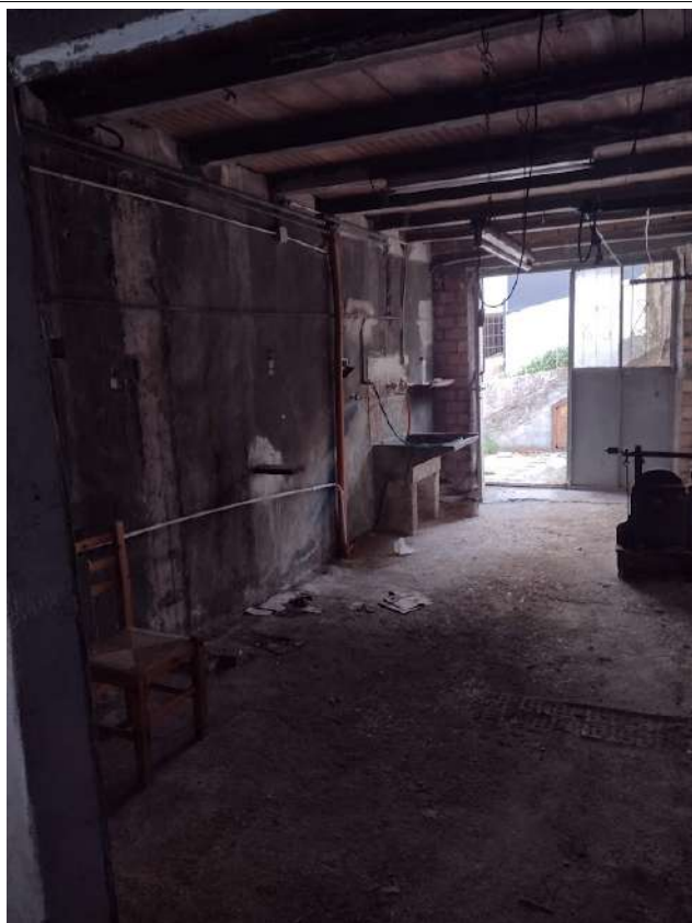
Interno sub 2