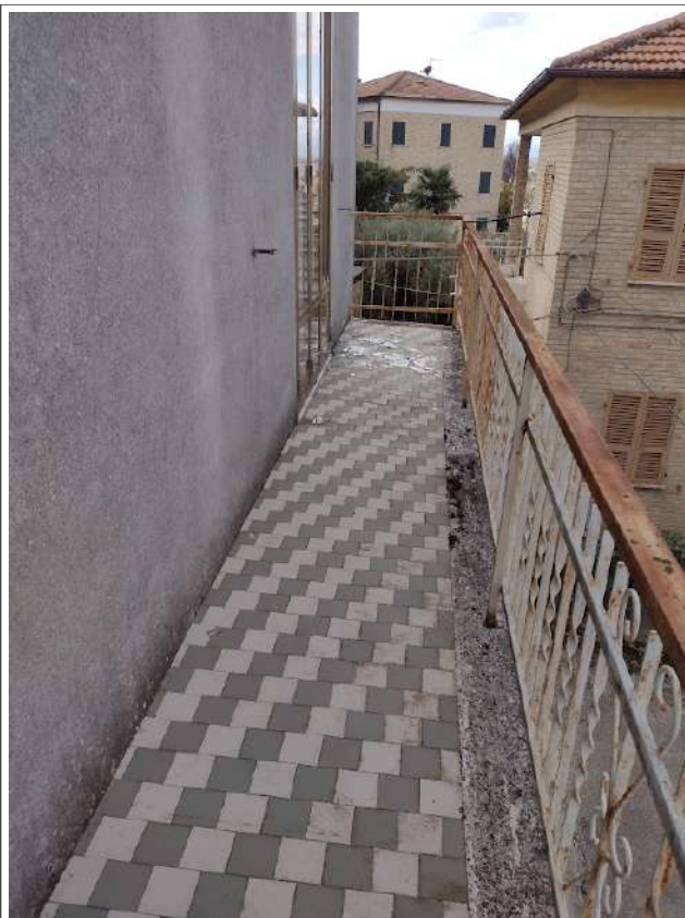
Balcone sub 1 in aggetto su via Carlo alberto