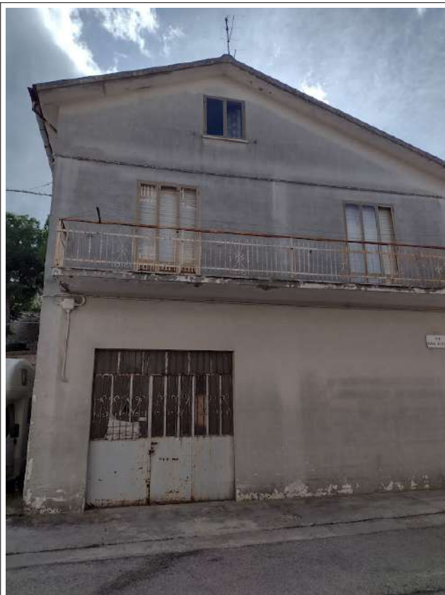
Prospetto nord via Carlo Alberto