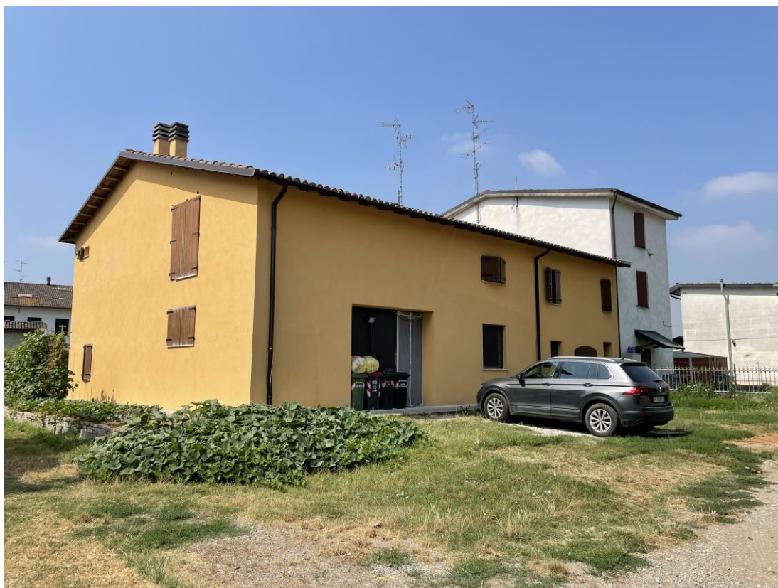
Foto 1 – Vista esterna del fabbricato residenziale – Prosetti Nord – Est