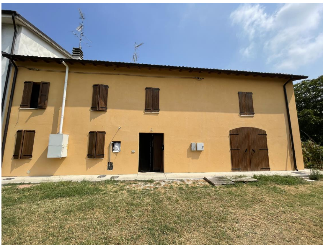
Foto 2 – Vista esterna del fabbricato residenziale – Prospetto Sud