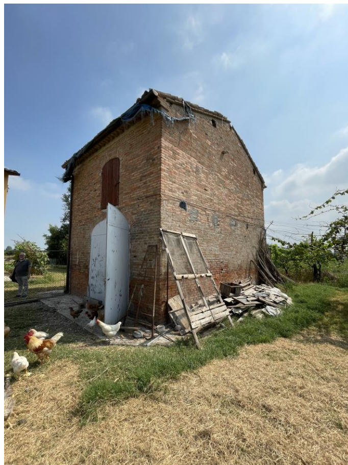
Foto 4 – Vista esterna del fabbricato a deposito – Prospetti Sud Ovest