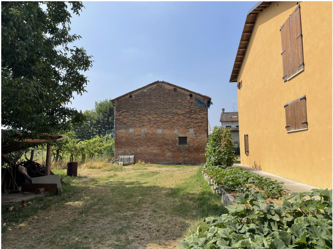
Foto 3 – Vista esterna del fabbricato a deposito – Prospetto Nord