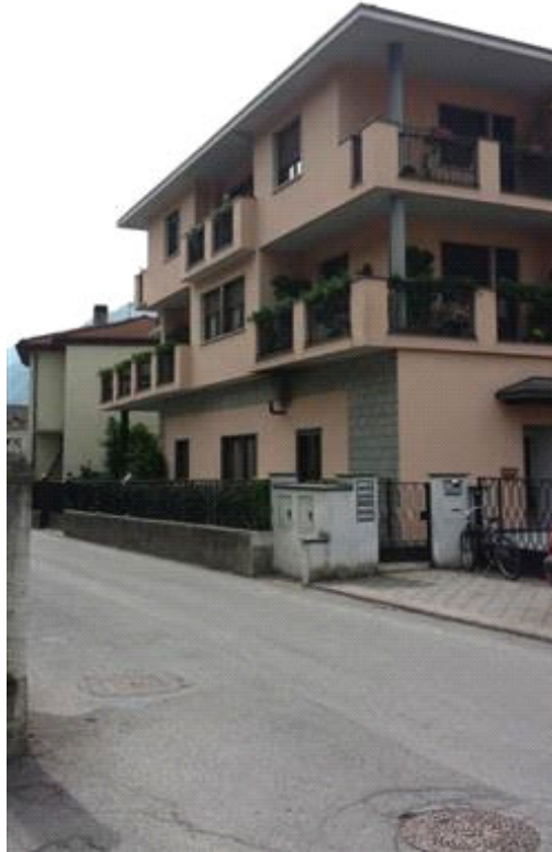
Vista da Porta Milanese

L'intero edificio sviluppa quattro piani, tre piani fuori terra, un piano interrato. Immobile costruito nel 1960 ristrutturato nel 2015.