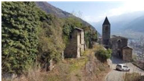
Vista chiesa di S. Perpetua

I beni sono ubicati in zona fuori dal centro abitato in un'area agricola, le zone limitrofe si trovano in un'area agricola. Il traffico nella zona è limitato (zona traffico limitato), i parcheggi sono inesistenti. Sono inoltre presenti, le seguenti attrazioni storico paesaggistiche: Chiesa di Santa Perpetua antico xenodochio percorso pedonale storico.