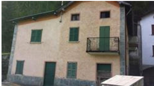
vista su strada

Pavimenti dei locali in piastrelle, pareti intonacate a civile e tinteggiate, pareti bagno in piastrelle, bagno completo di sanitari; impianto elettrico sottotraccia, impianto idro sanitario, impianto di riscaldamento con stufe a legna.