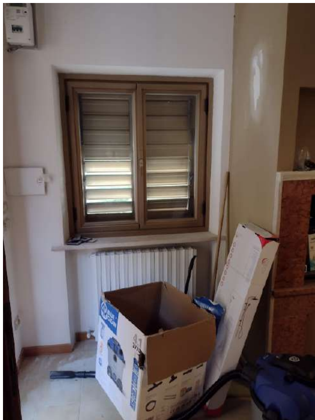
INTERNO CUCINA PRANZO