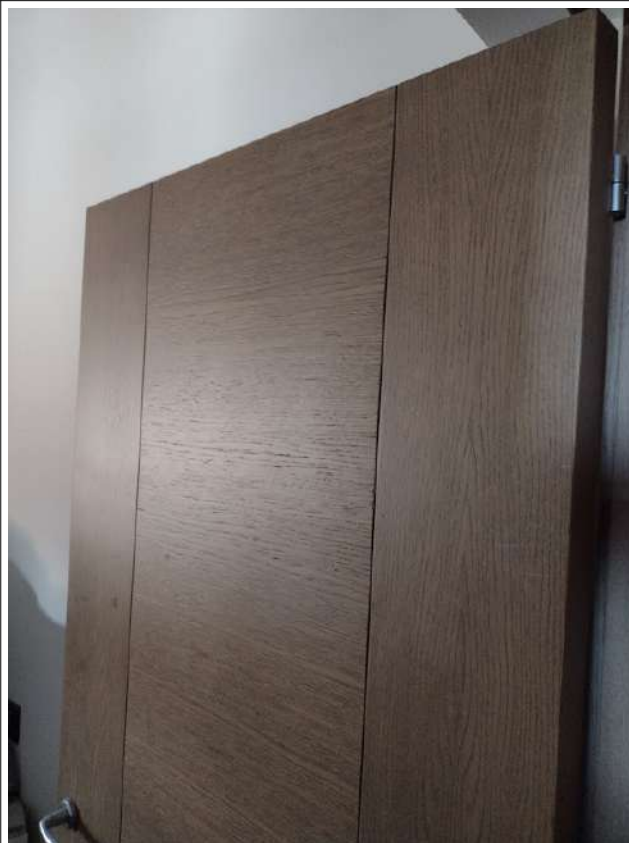
PART. PORTE INTERNE