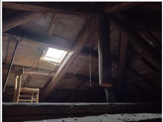
Soffitta loc tecnico