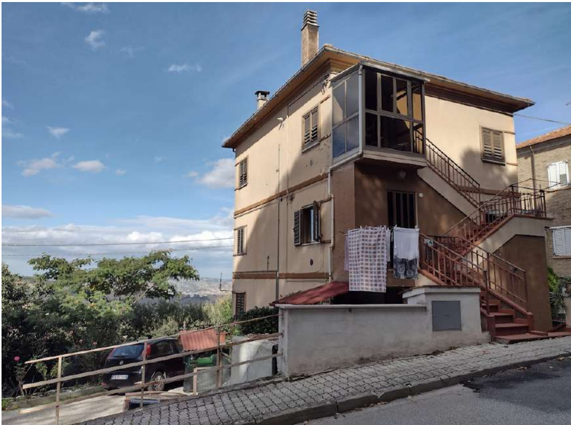
PART. PROSPETTO VISTA SUD SUD/OVEST