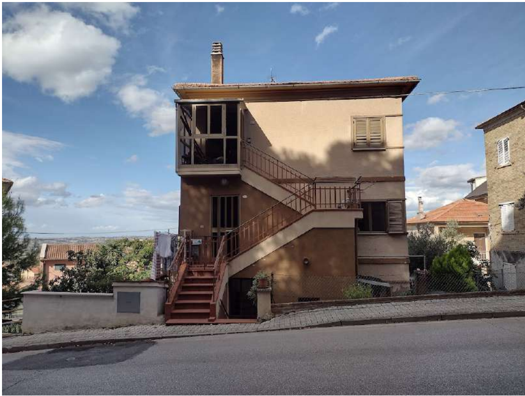
PART. PROSPETTO FRONTE SUD