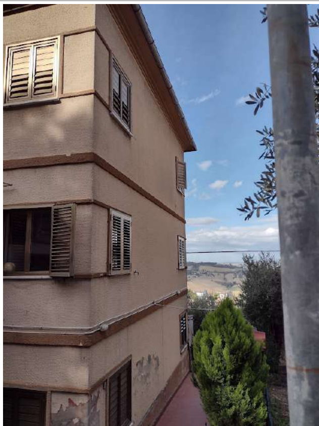
PROSPETTO NORD EST