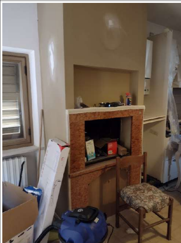
INTERNO CUCINA PRANZO