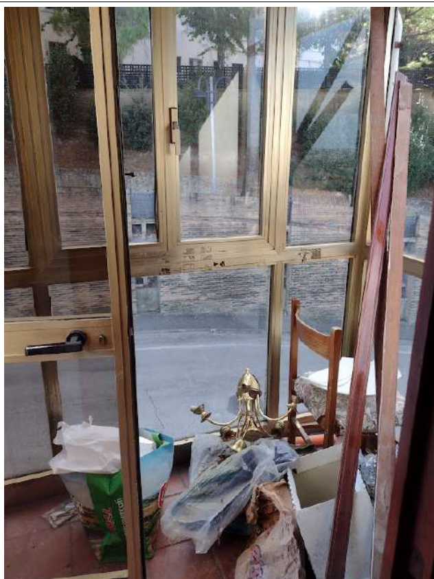
PART. TAMPONATURA PIANEROTTOLO SCALA