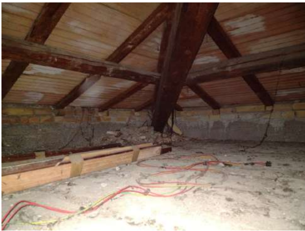
Soffitta non praticabile loc. tecnico