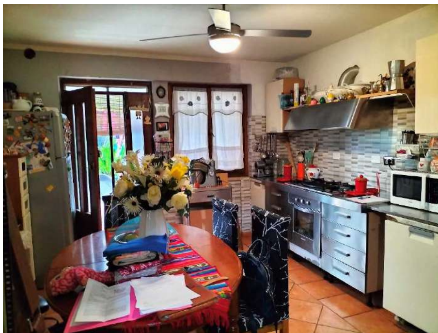
CUCINA - SOGGIORNO REALIZZATA NELL'INGRESSO