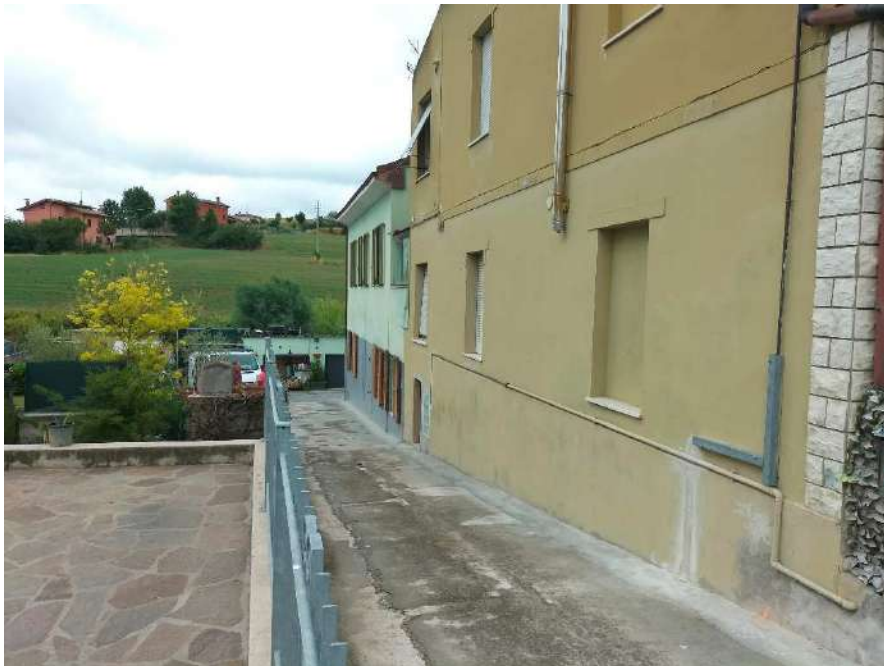
VIALE COMUNE DA VIA CARRATE