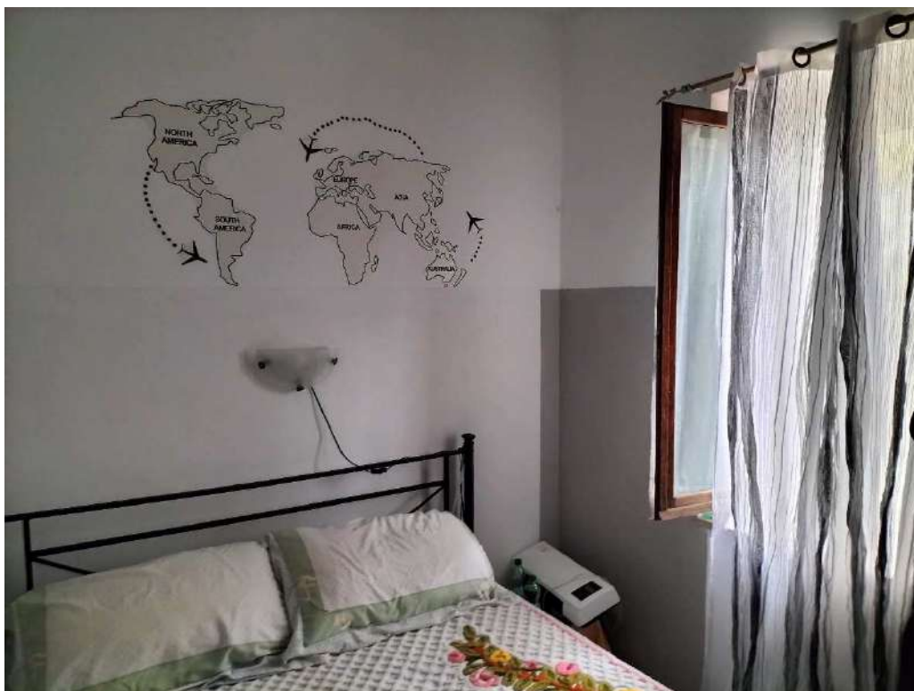
CAMERA REALIZZATA NEL SOGGIORNO CUCINA