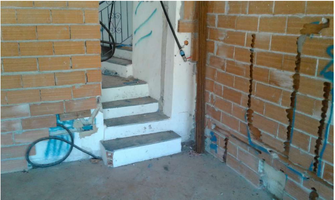
interni del Corpo A di Perizia