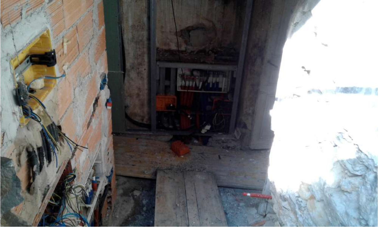
interni del Corpo A di Perizia