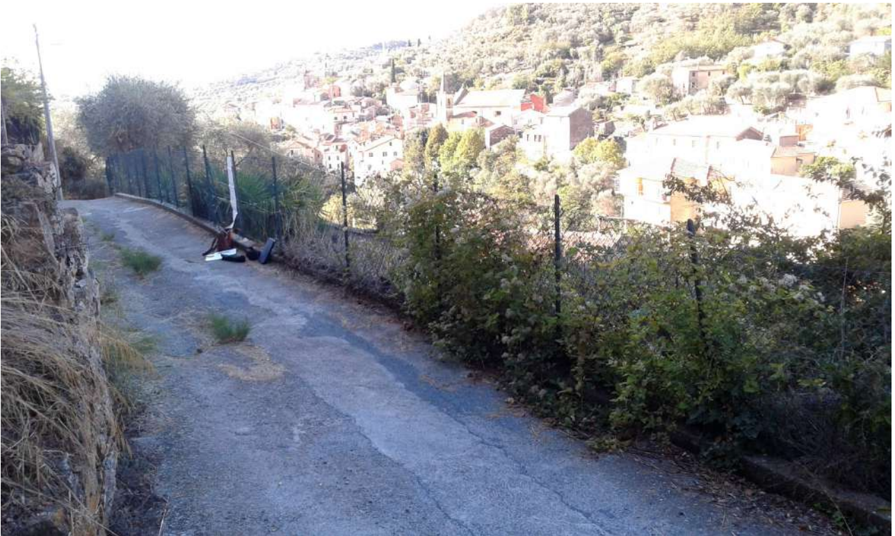
Via Regina Elena