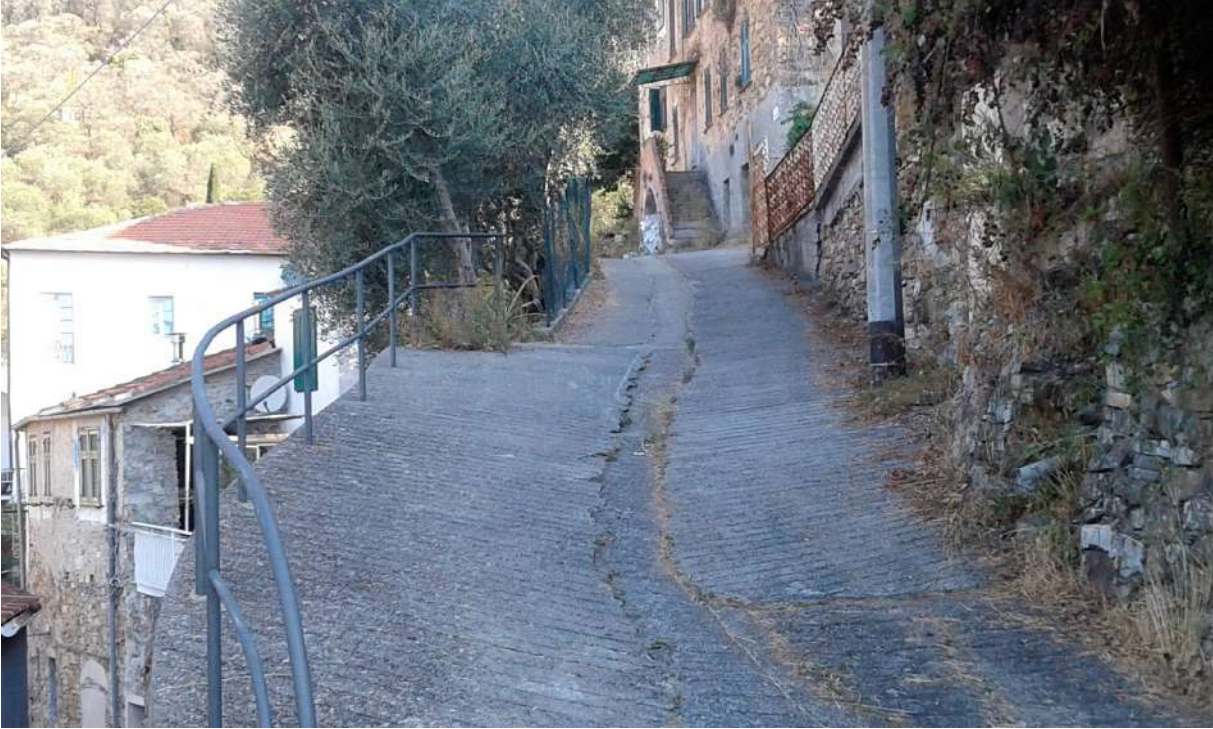
Via Regina Elena