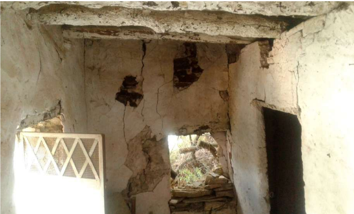
interni del piano terra del Corpo C di Perizia