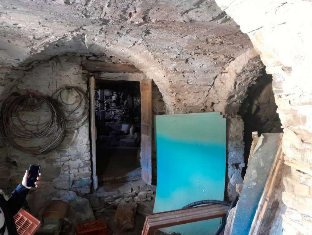
interni del Corpo A di Perizia – piano terreno catastale - magazzino