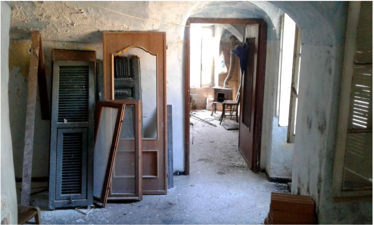
interni immobili del Corpo A di Perizia