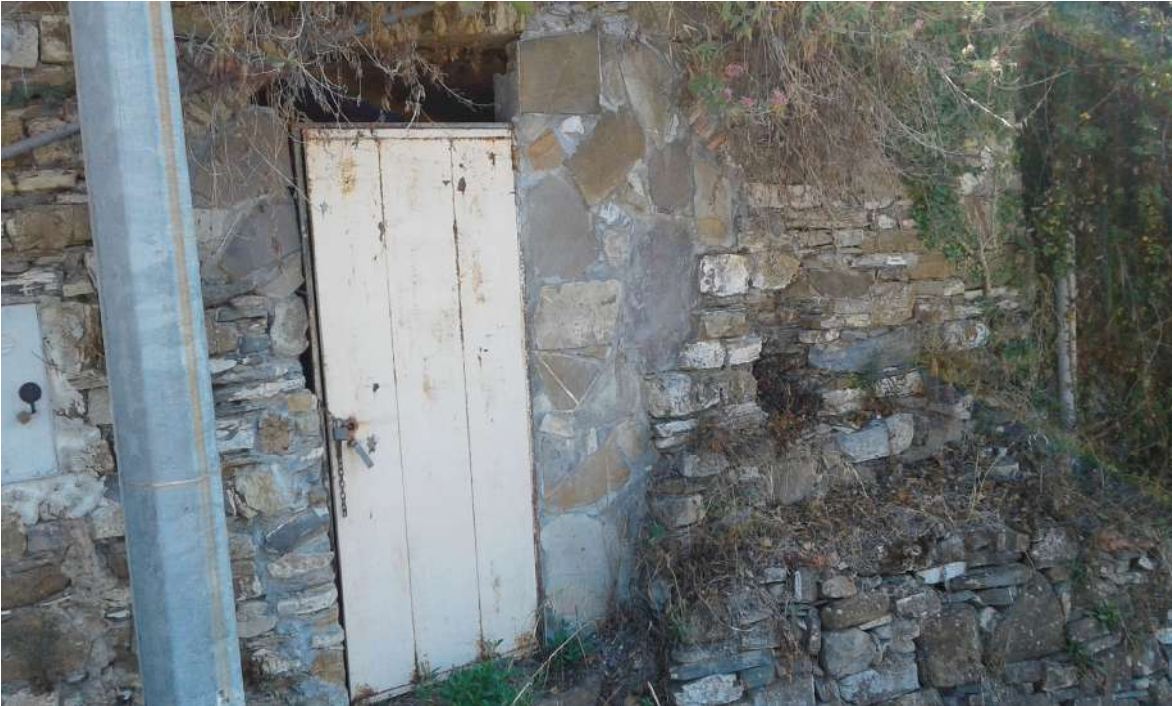
magazzino in fregio alla Via Regina Elena – Corpo D di Perizia