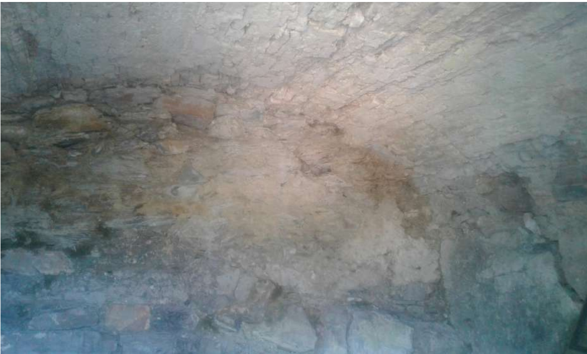
magazzino in fregio alla Via Regina Elena – Corpo D di Perizia