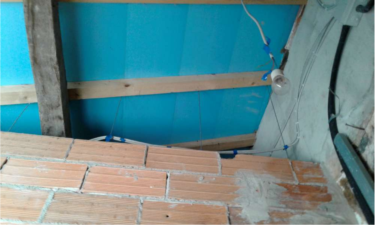
interni del Corpo A di Perizia