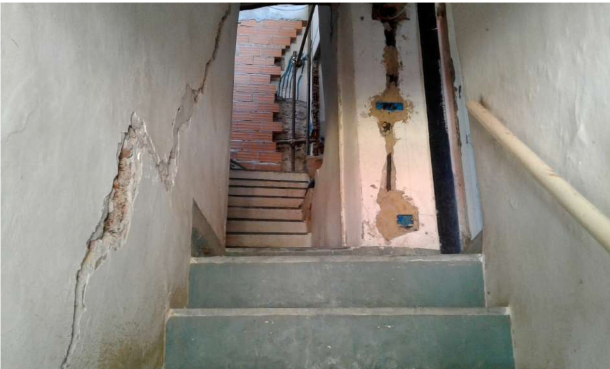
interni del Corpo A di Perizia