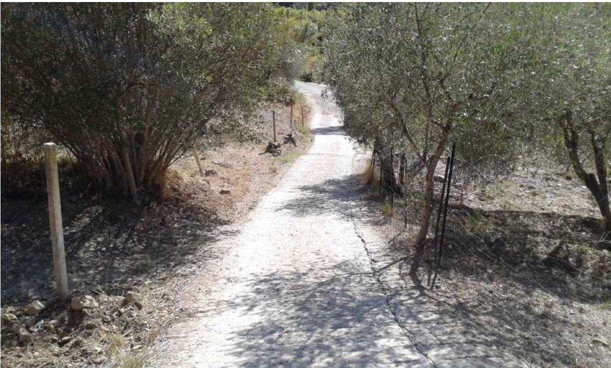
via Cian Disei , Strada carrabile a fondo cementato e naturale largh. min 2,10 ml circa.