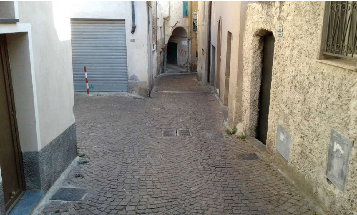
strada Via Vittorio Emanuele II – fraz. Moltedo