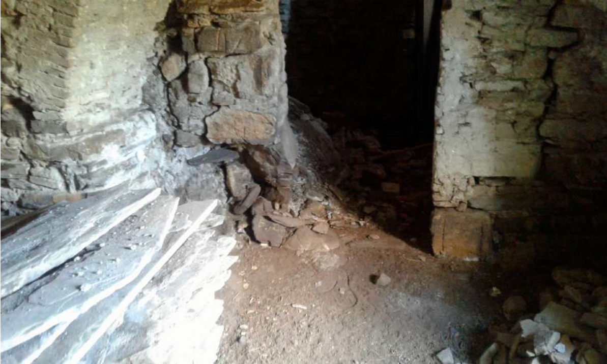
interni del piano seminterrato magazzino – Corpo C di perizia