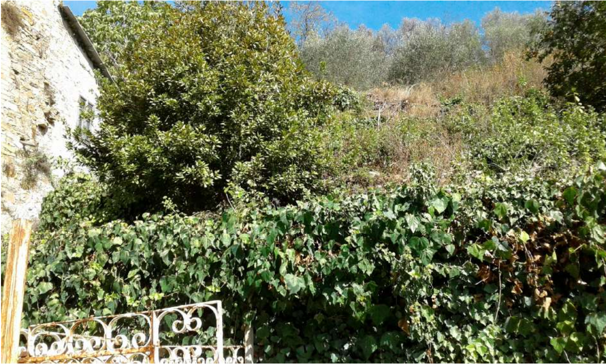
Terreni adiacenti il fabbricato padronale, costituenti il Corpo B di perizia;