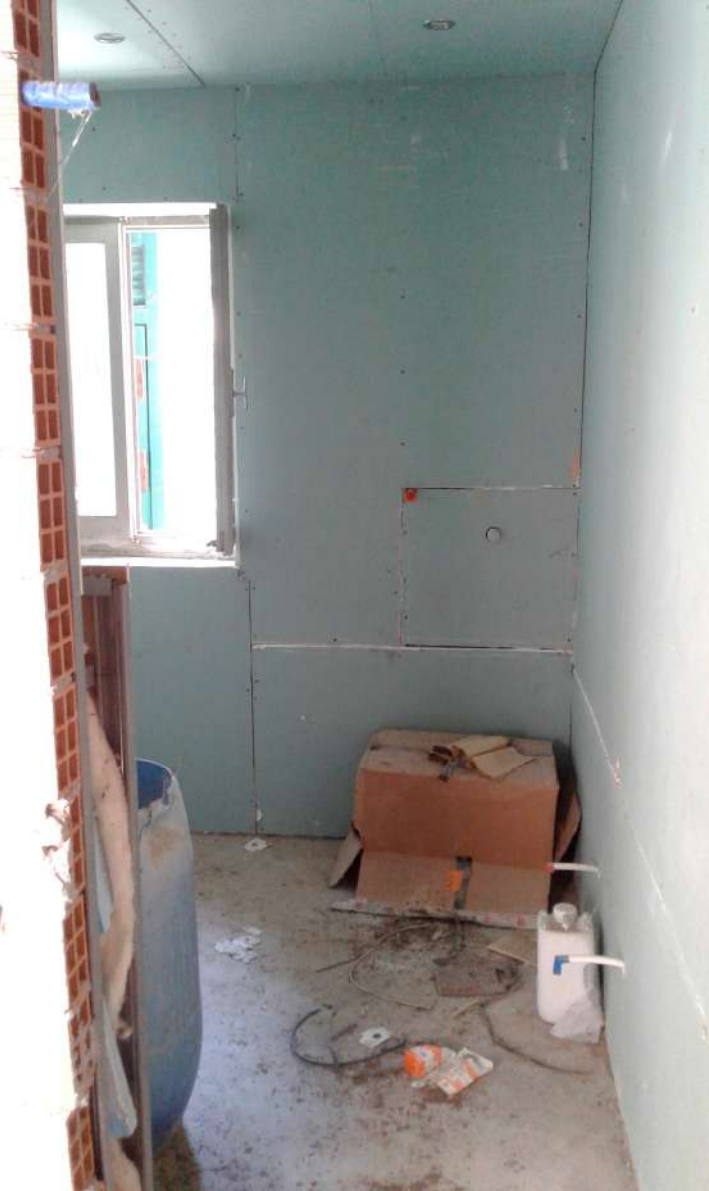
interni del Corpo A di Perizia