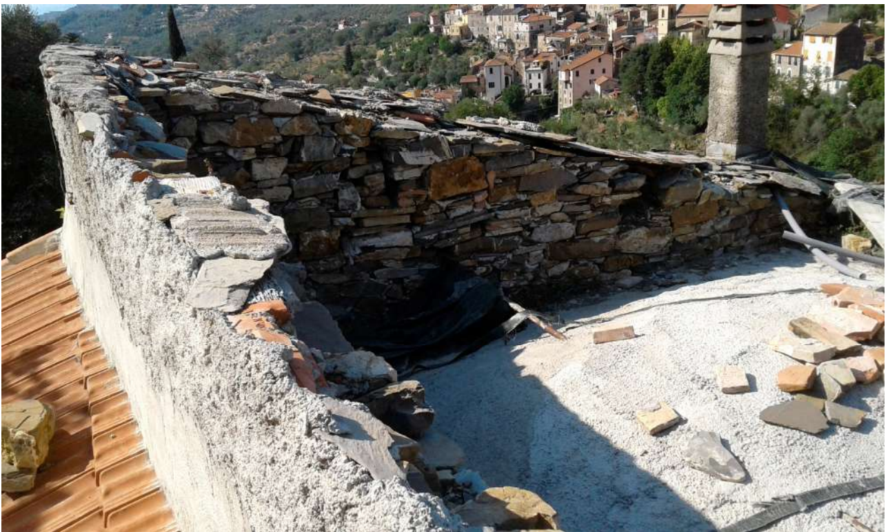
copertura del Corpo A di Perizia