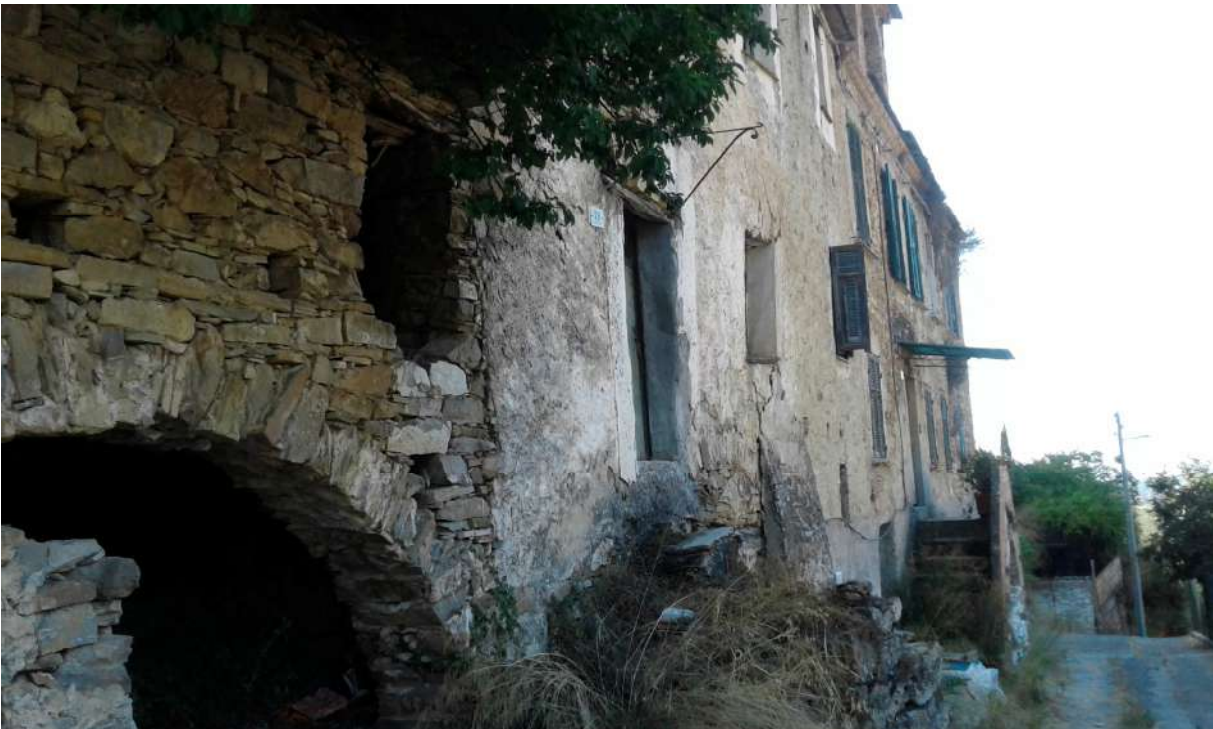
Prospetto su via Regina Elena