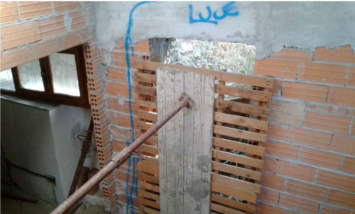
interni del Corpo A di Perizia