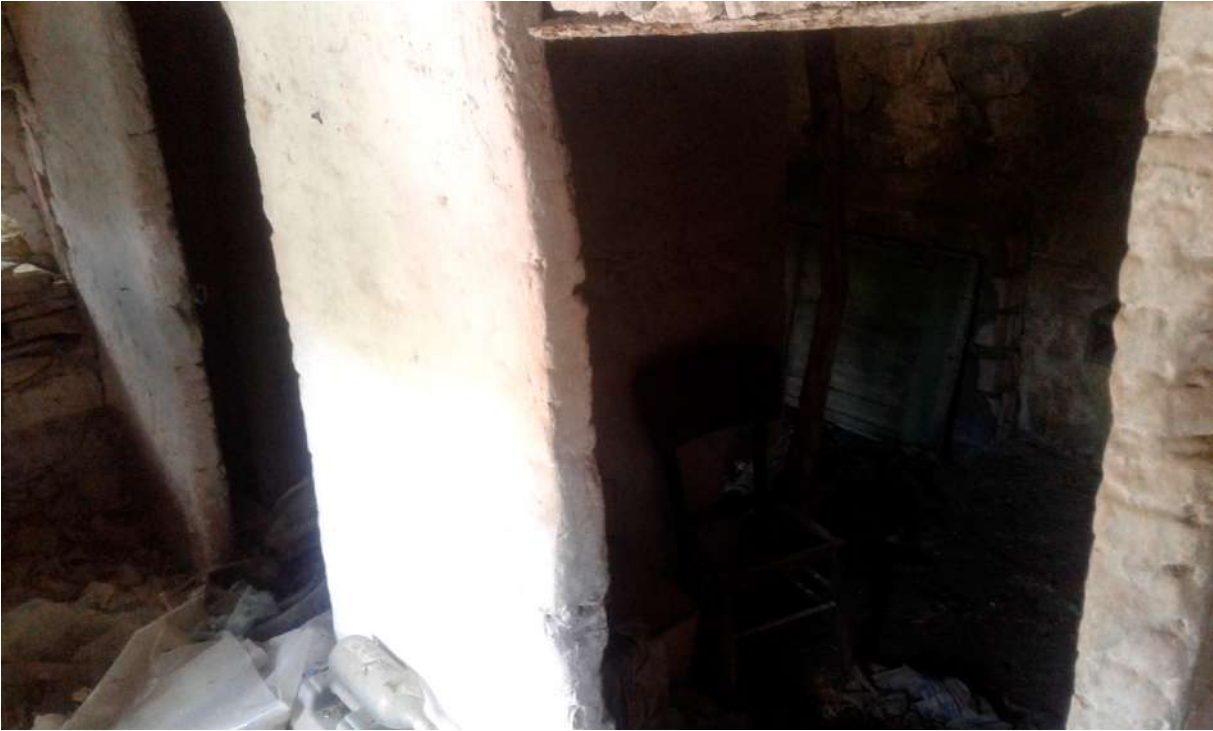
interni del piano seminterrato del Corpo C di Perizia