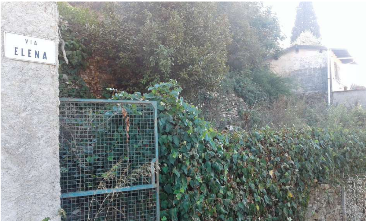
Terreni adiacenti il fabbricato padronale, costituenti il Corpo B di perizia;