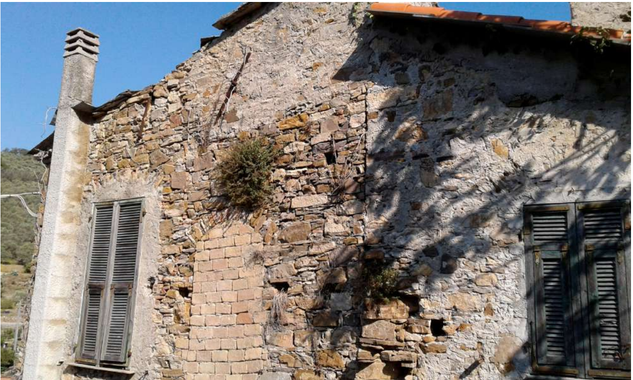
esterni del Corpo A di Perizia