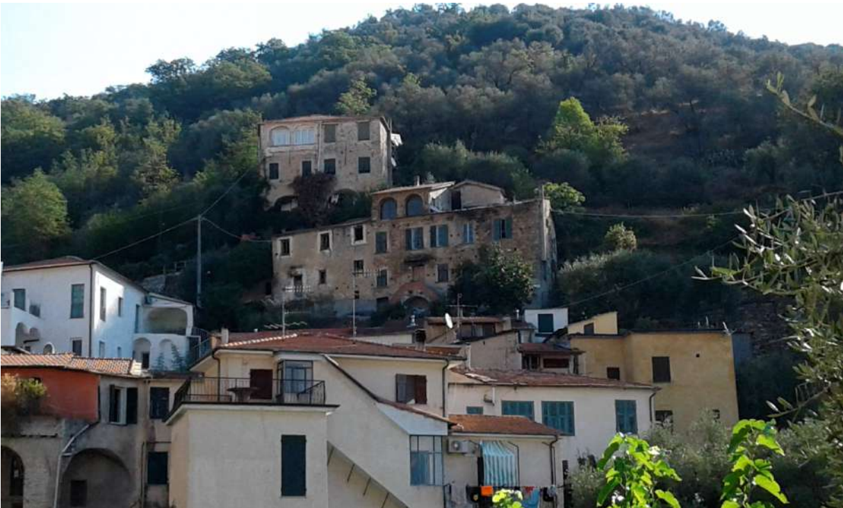
Vista di insieme del fabbricato