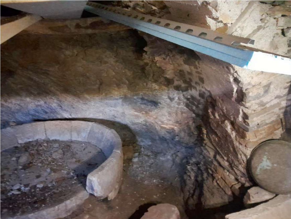
interni del Corpo A di Perizia piano terra catastale magazzino (seminterrato)