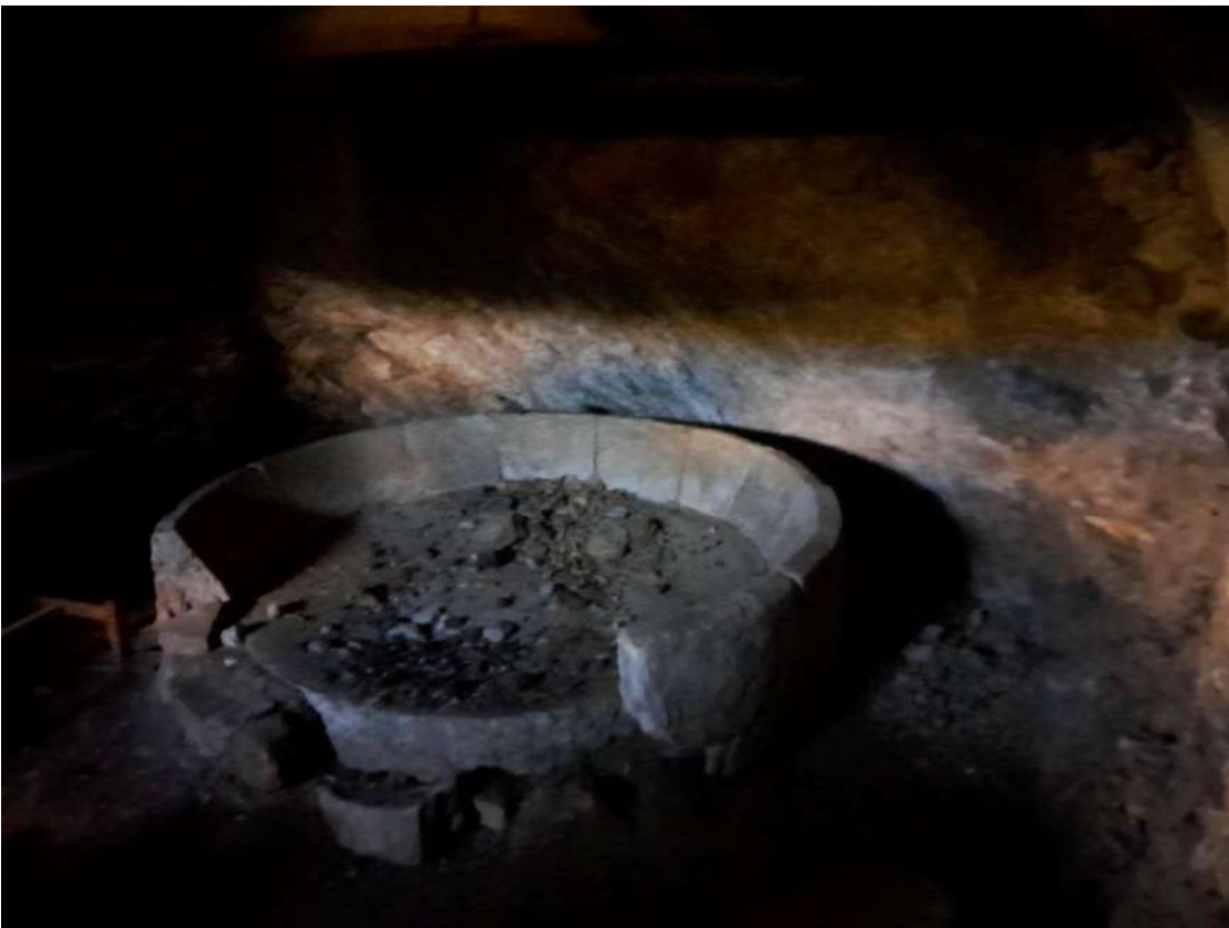
interni del Corpo A di Perizia piano terra catastale