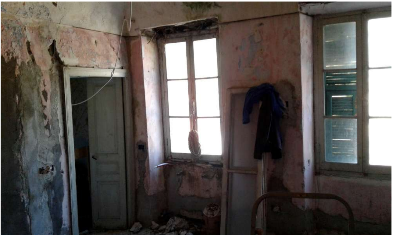
interni del Corpo A di Perizia