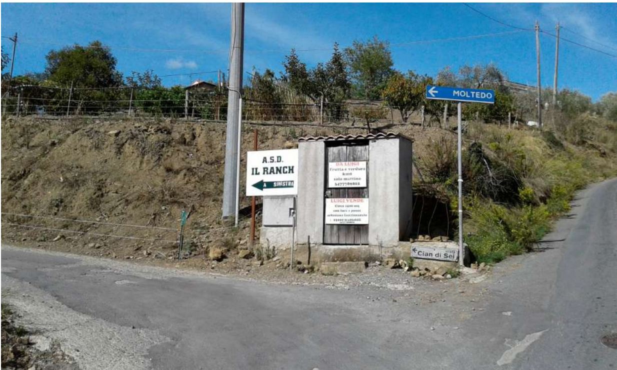
Deviazione carrabile su Via Cian di Sei o Cian Disei che diparte dalla strada per Montegrazie ed arriva a Moltedo presso gli immobili oggetto di perizia. (percorso alternativo alla Via Vittorio Emanuele II in fraz. Moltedo).