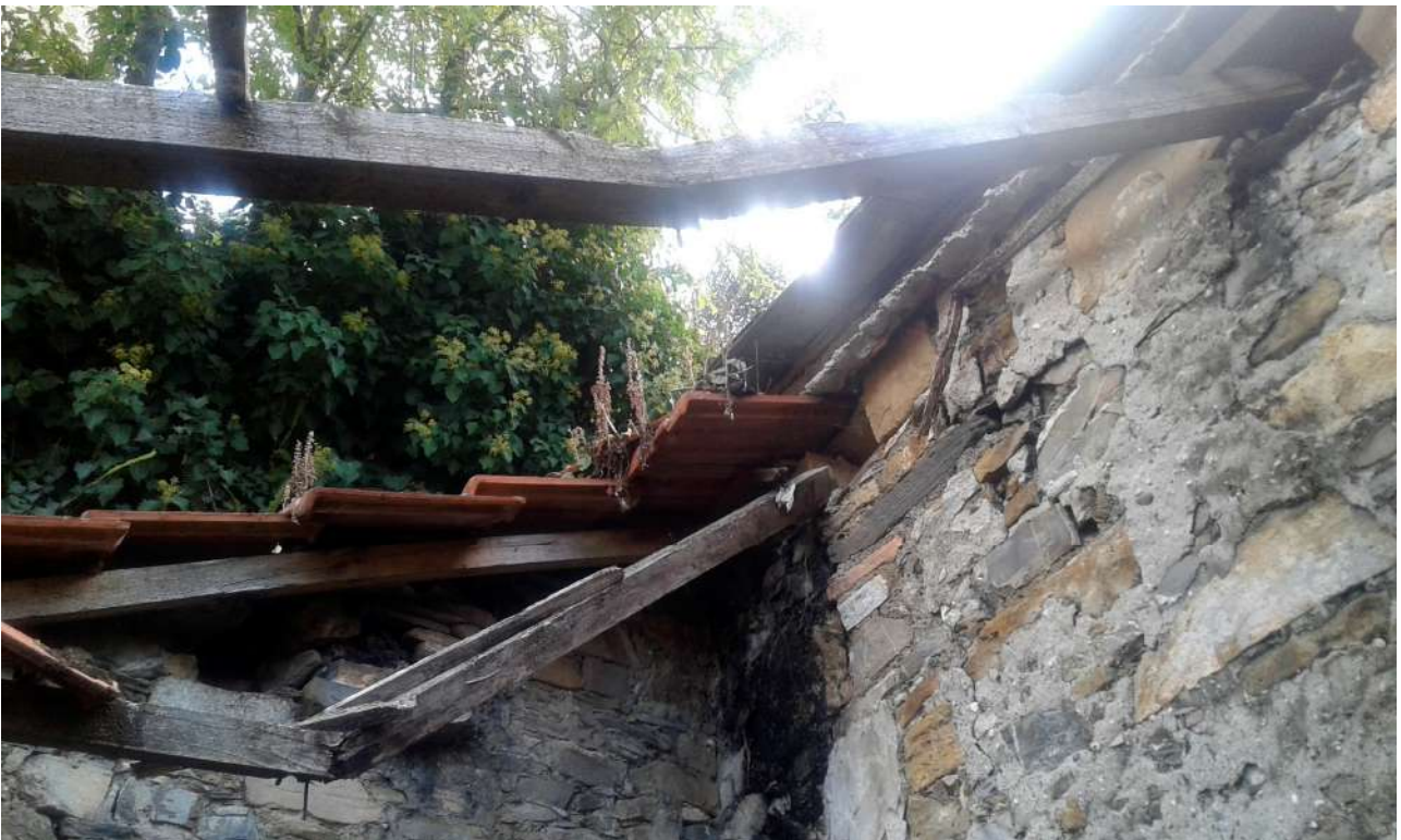
interni del piano primo del Corpo C di Perizia