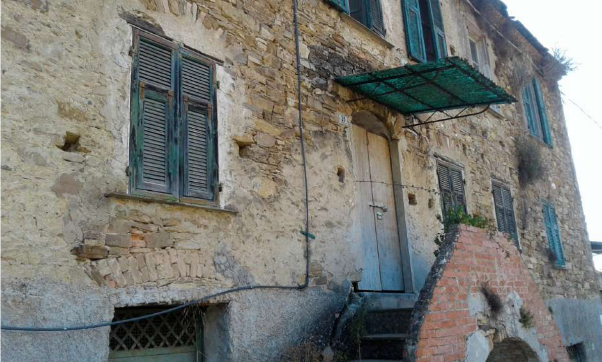
Ingresso unità del Corpo A di Perizia