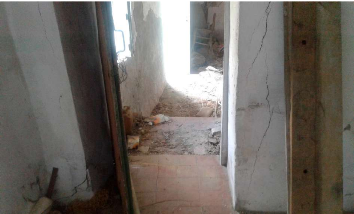
interni del piano terra del Corpo C di Perizia