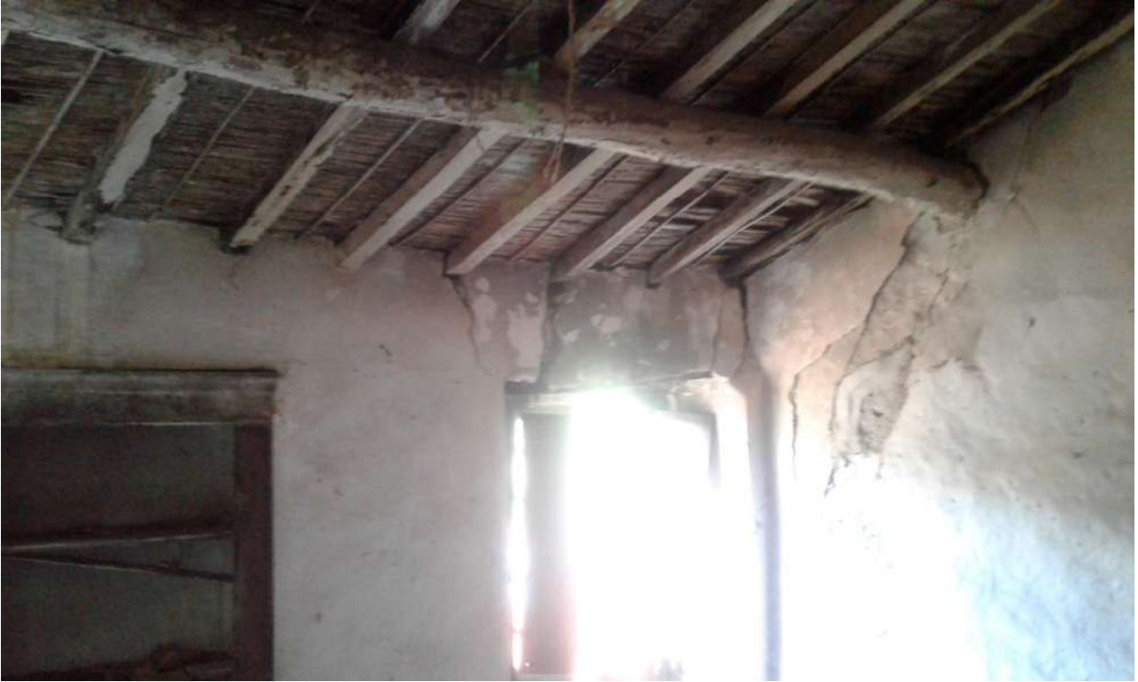
interni del piano primo del Corpo C di Perizia