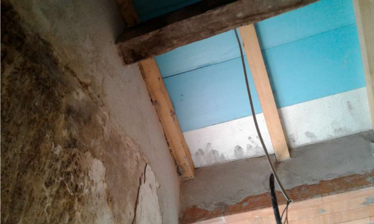
interni del Corpo A di Perizia