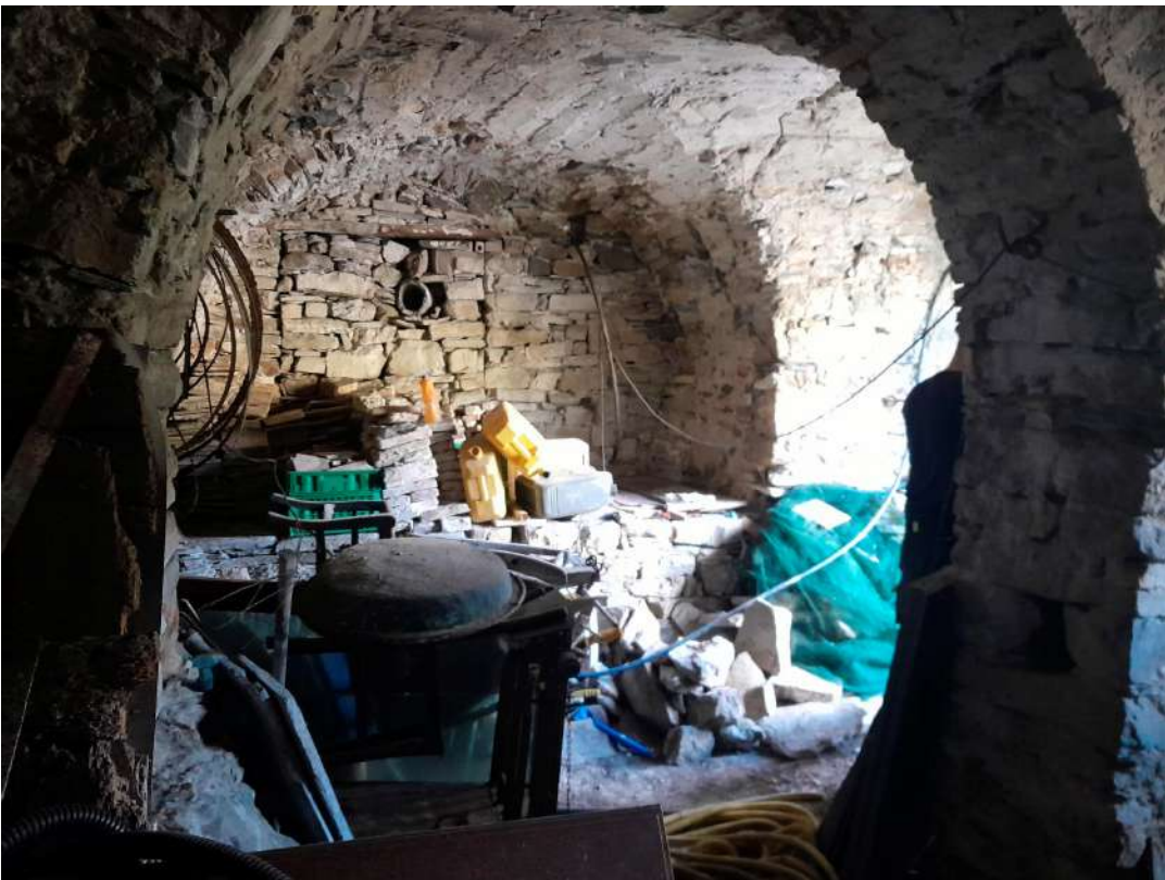
interni del Corpo A di Perizia – piano terreno catastale - magazzino