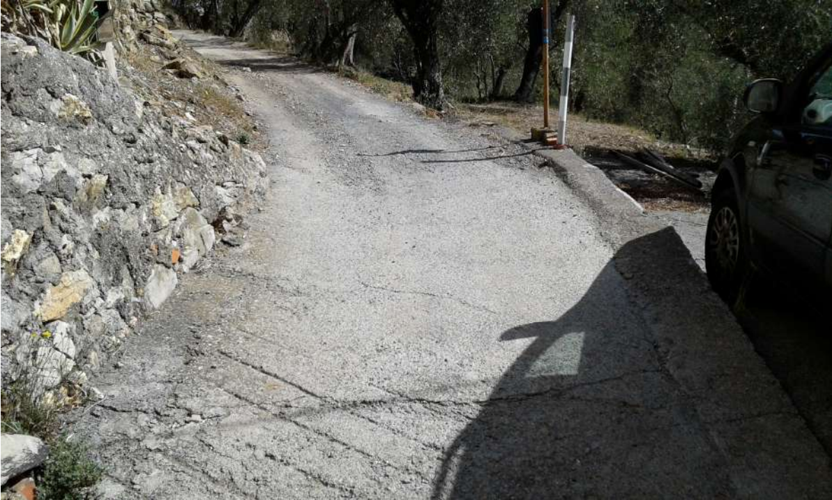
Via Cavour che prosegue verso Montegrazie, cambiando nome ad un certo punto del percorso in via Cian Disei. Strada carrabile a fondo cementato e naturale largh. min 2,10 ml circa.