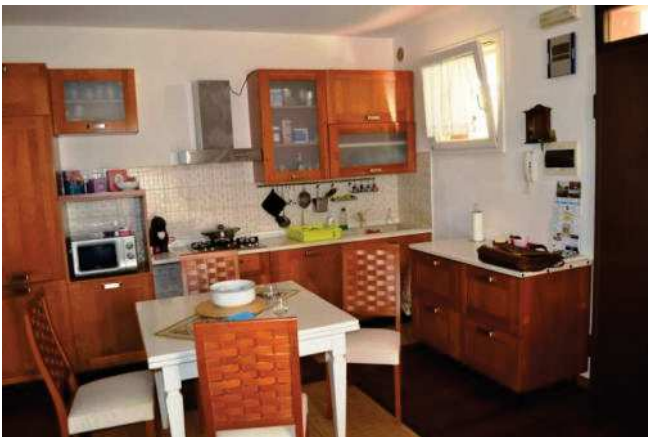
foto 10 - Vista del soggiorno dalla cucina adiacente