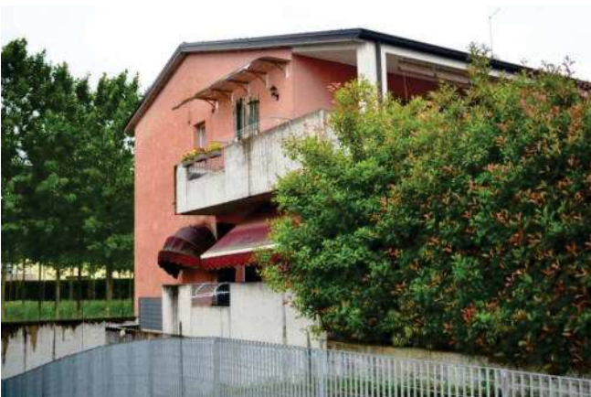
foto 7 - Scorcio dell'appartamento m.n. 614 sub 19 p.T