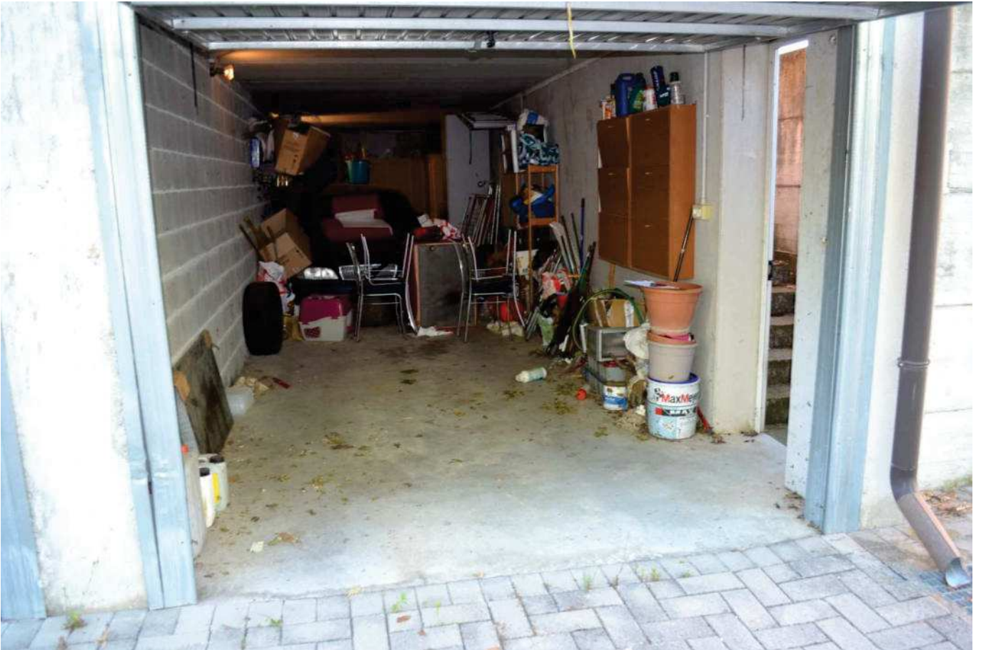
foto 17 - Appartamento in via BONINO, piano scantinato, autorimessa - vista dalla corsia di manovra