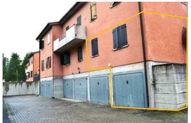
foto 8 - Scorcio dell'autorimessa m.n. 614 sub 13 a p.S