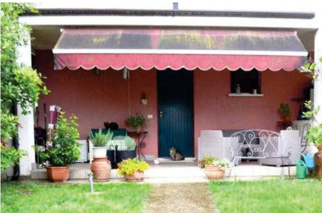
foto 11 - L'ingresso coperto col giardino esclusivo