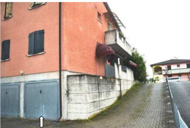
foto 19 - Scorcio dell'autorimessa con rampa esterna