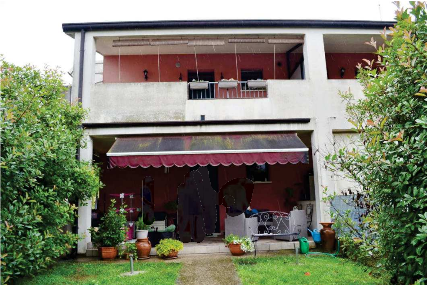
foto 4 - Scorcio del prospetto nord dell'appartamento a piano terra in via BONINO n. 7 col giardino esclusivo