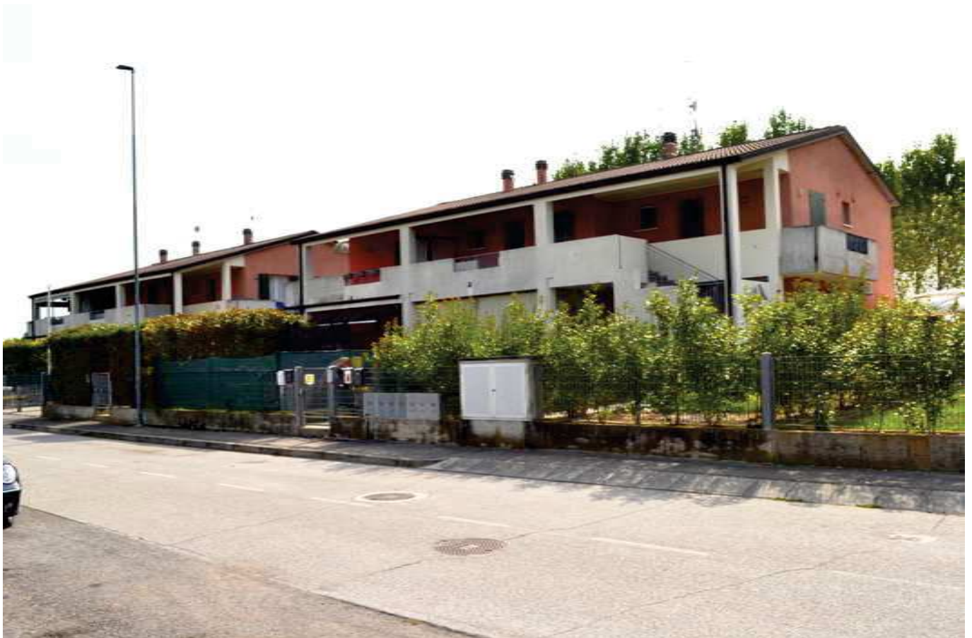
foto 3 - Prospetto nord dell'edificio in via M. BONINO n. 7/9 a Cerea, visto da nord ovest sulla strada