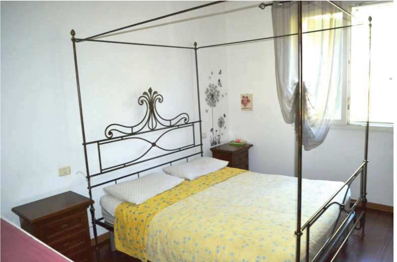
foto 13 - Appartamento in via BONINO, piano T, letto 1 con finestra a sud e con pavimento in legno