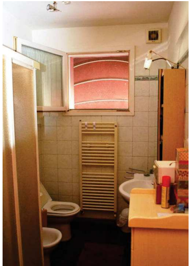
foto 16 - Vista del bagno con termo arredo