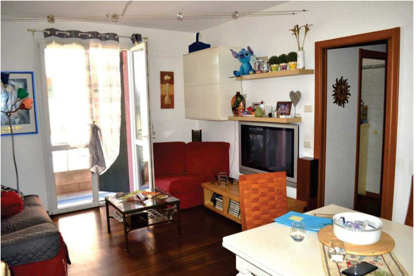
foto 9 - Appartamento in via BONINO, piano T, soggiorno - visto dalla cucina, con p/finestra sul lato est