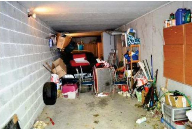
foto 18 - Vista interna dell'autorimessa e cantina