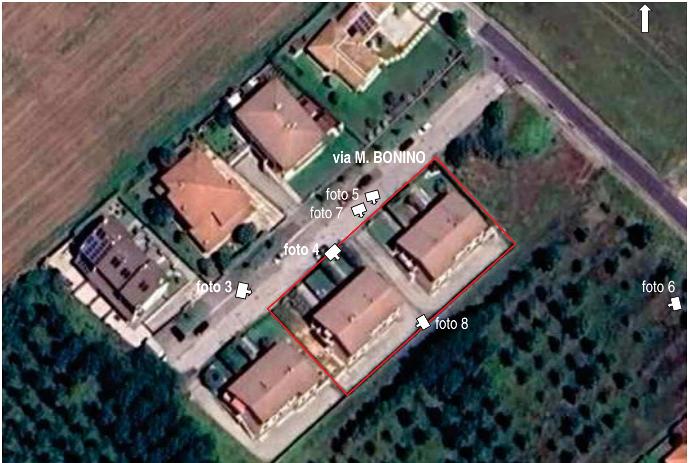
foto 2 - Aerofoto Google – coni visuali delle foto esterne – scala apx 1:1000