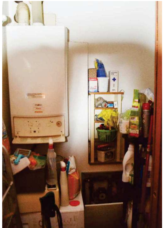
foto 12 - Ripostiglio con la caldaia autonoma