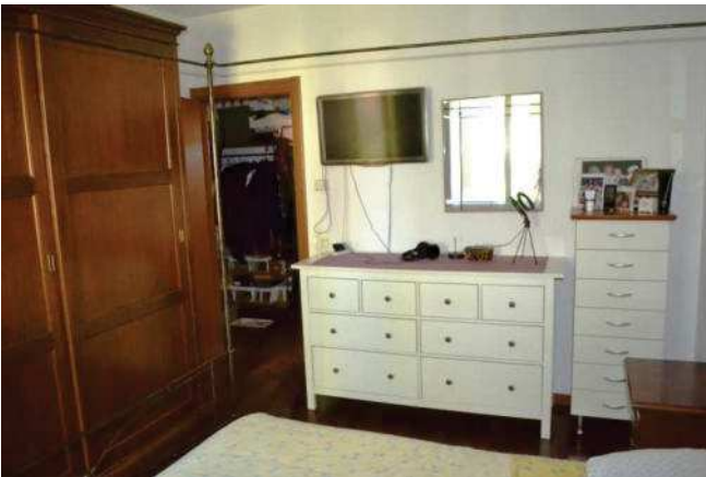
foto 14 - Vista dall'interno del letto 1