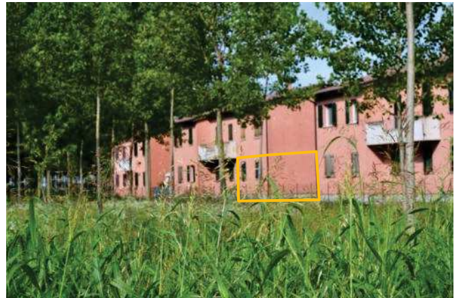
foto 6 - Prospetti sud degli edifici di via Bonino