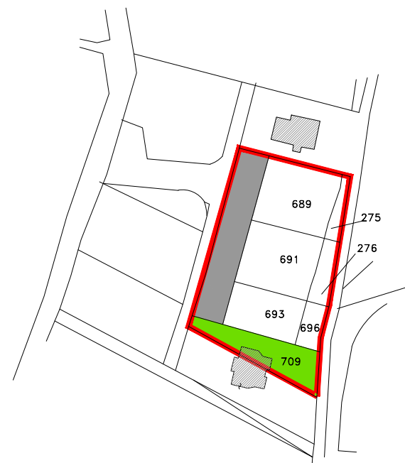
ESTRATTO MAPPA CATASTALE AL 2021

Delimitazione compendio pignorato Area ceduta al Comune Area ceduta a terzi