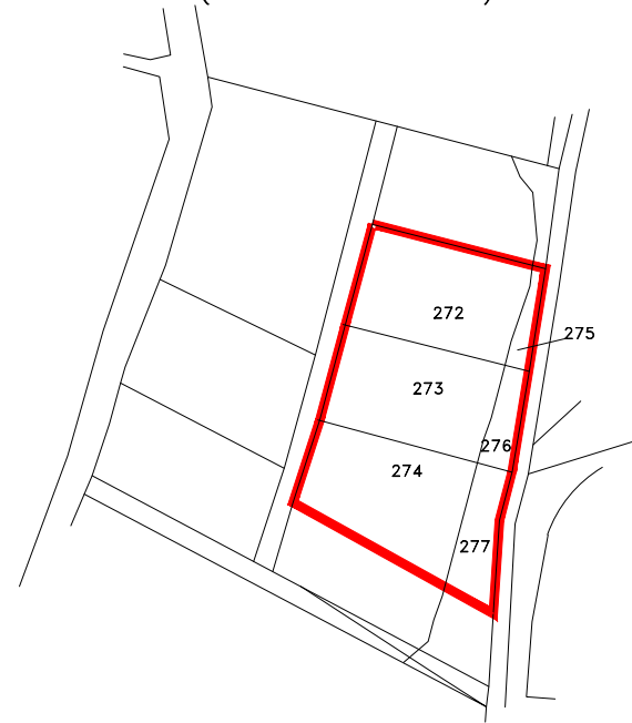
ESTRATTO MAPPA CATASTALE AL 2008 (contratto di mutuo)