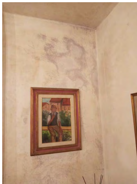
Foto 15-16 particolari della condensa in due punti angolari del salotto