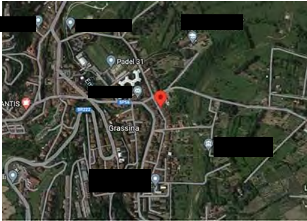
Foto 1 – Foto aerea del quartiere con l’immobile di via Botticelli