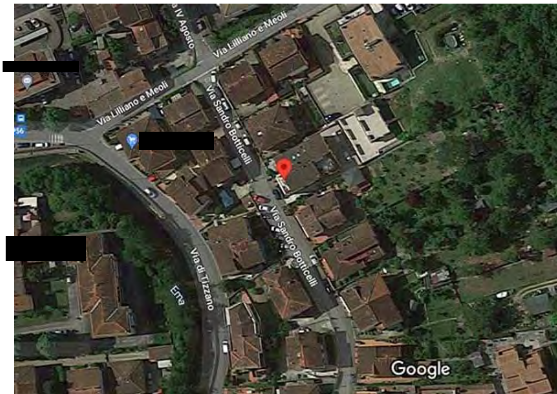
Foto 2 – Particolare copertura dell’edificio in cui si trova l’appartamento oggetto di stima