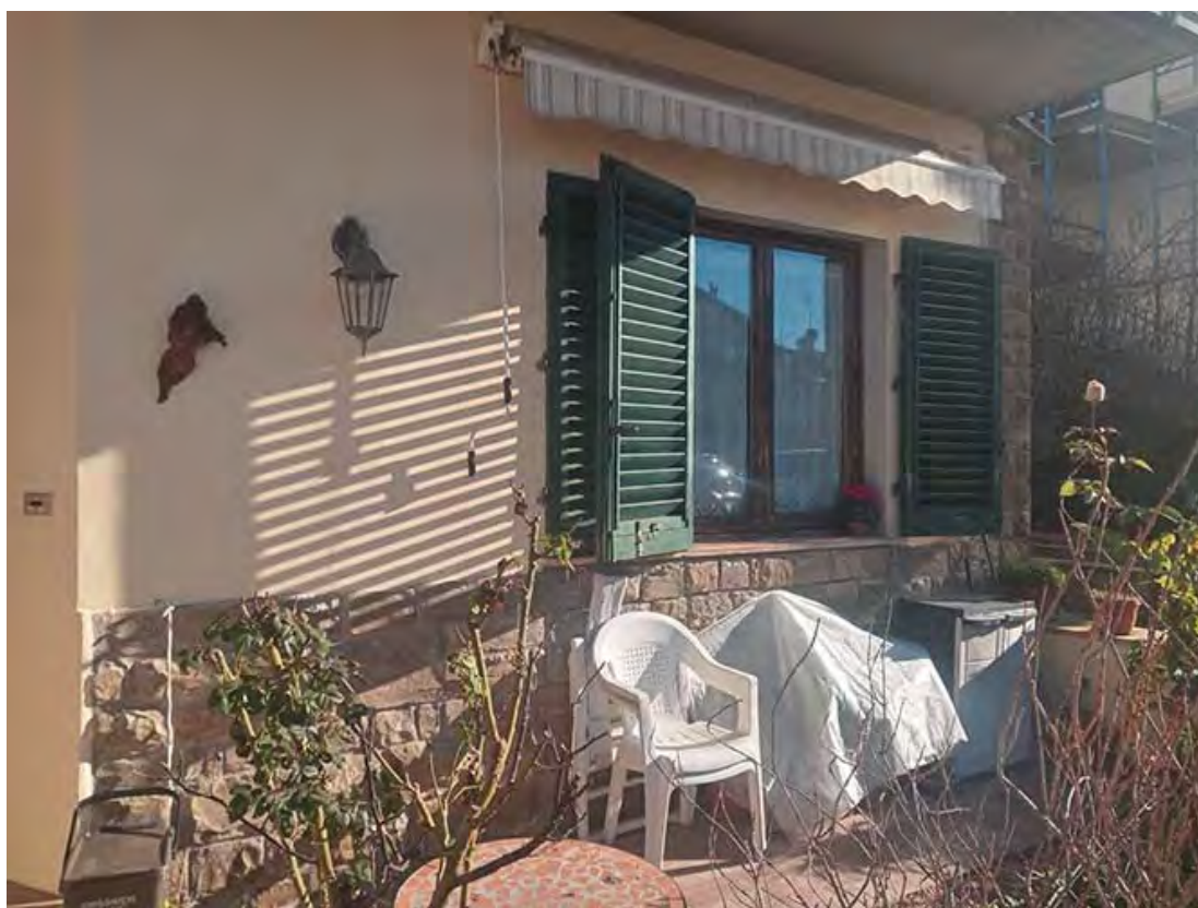
Foto 5 – Il resede di pertinenza dell'appartamento al piano terra