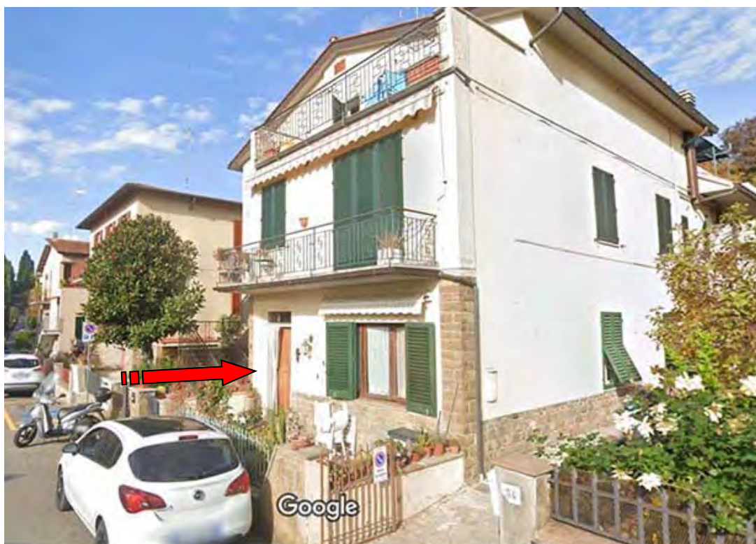
Foto 3 – Vista esterna della bifamiliare con l'appartamento oggetto di stima al p. t