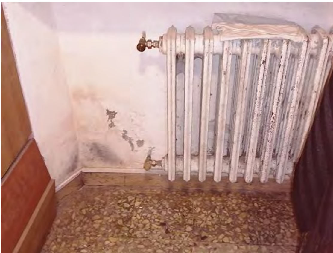
Foto 18 – Il terminale in ghisa. Si evidenziano evidenti segni di degrado dovuti a cattiva gestione dell' app.