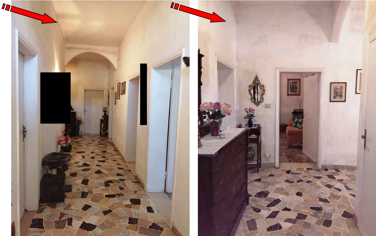
Foto 10 - 11 – Altro particolare del corridoio e disimpegno con pavimentazione in graniglia. Si notano anche in queste immagini evidenti segni di umidità da condensa nelle zone angolari e sul soffitto come indicato dalla freccia