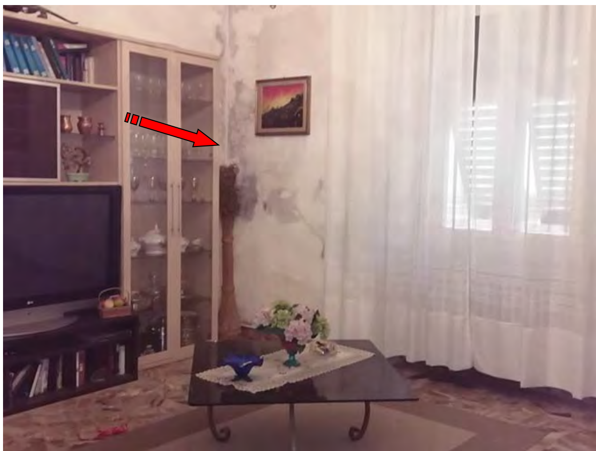
Foto 14 – il salotto con evidenti macchie di condensa angolari per cattiva conduzione degli abitanti