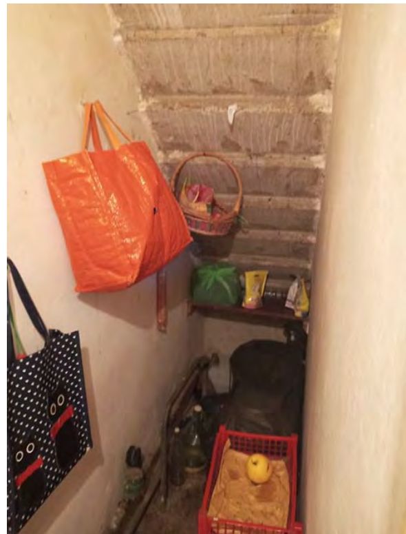
Foto 12 – Ancora muffe dovute a fenomeno di condensazione sotto la finestra. Foto 13 – il sottoscala