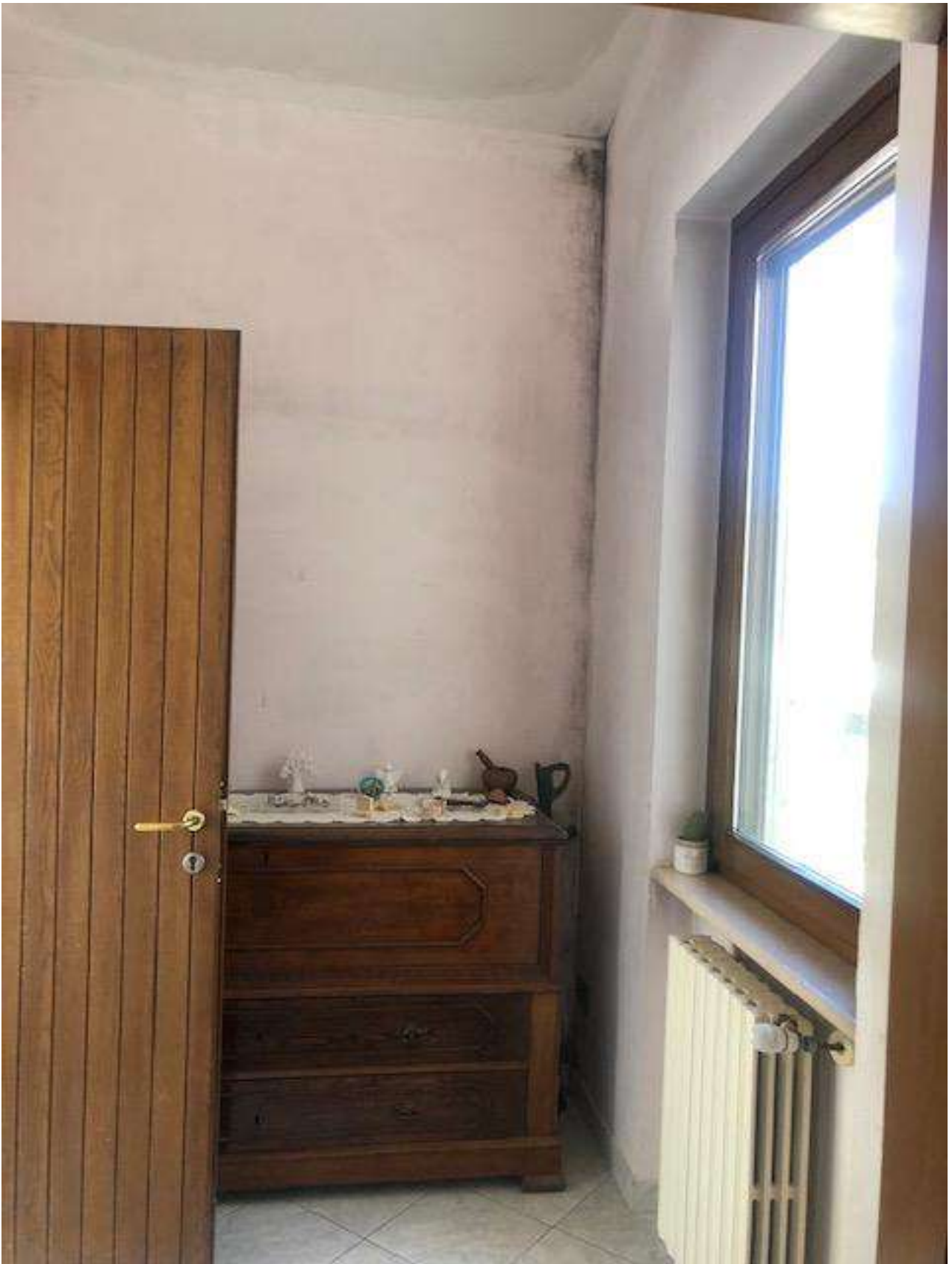
PIANO TERRA INGRESSO