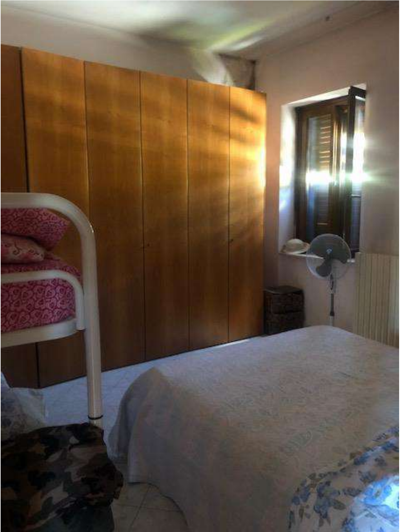
PIANO TERRA CAMERA DA LETTO