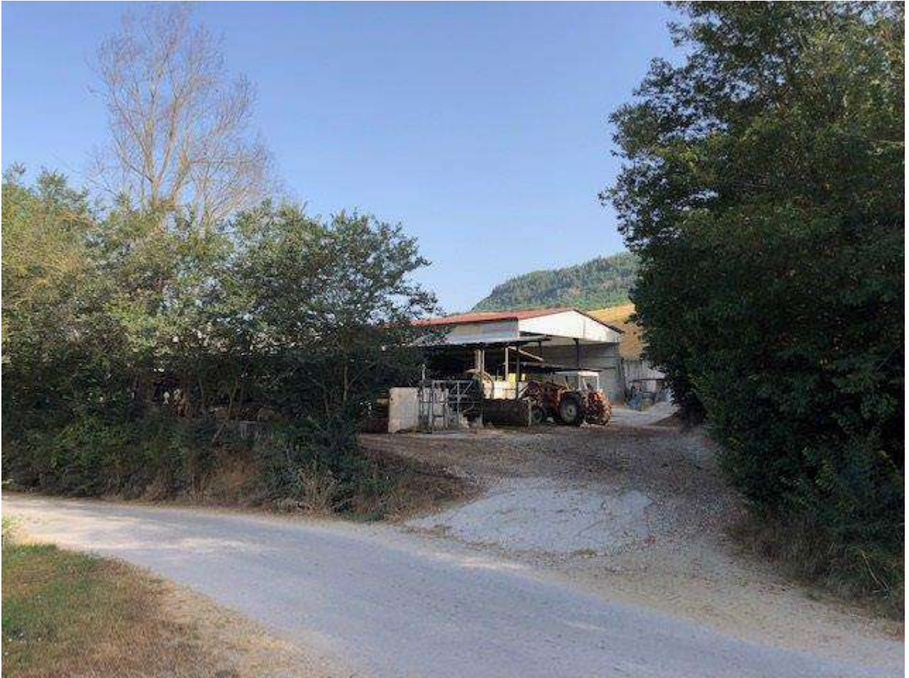
ACCESSO DALLA STRADA