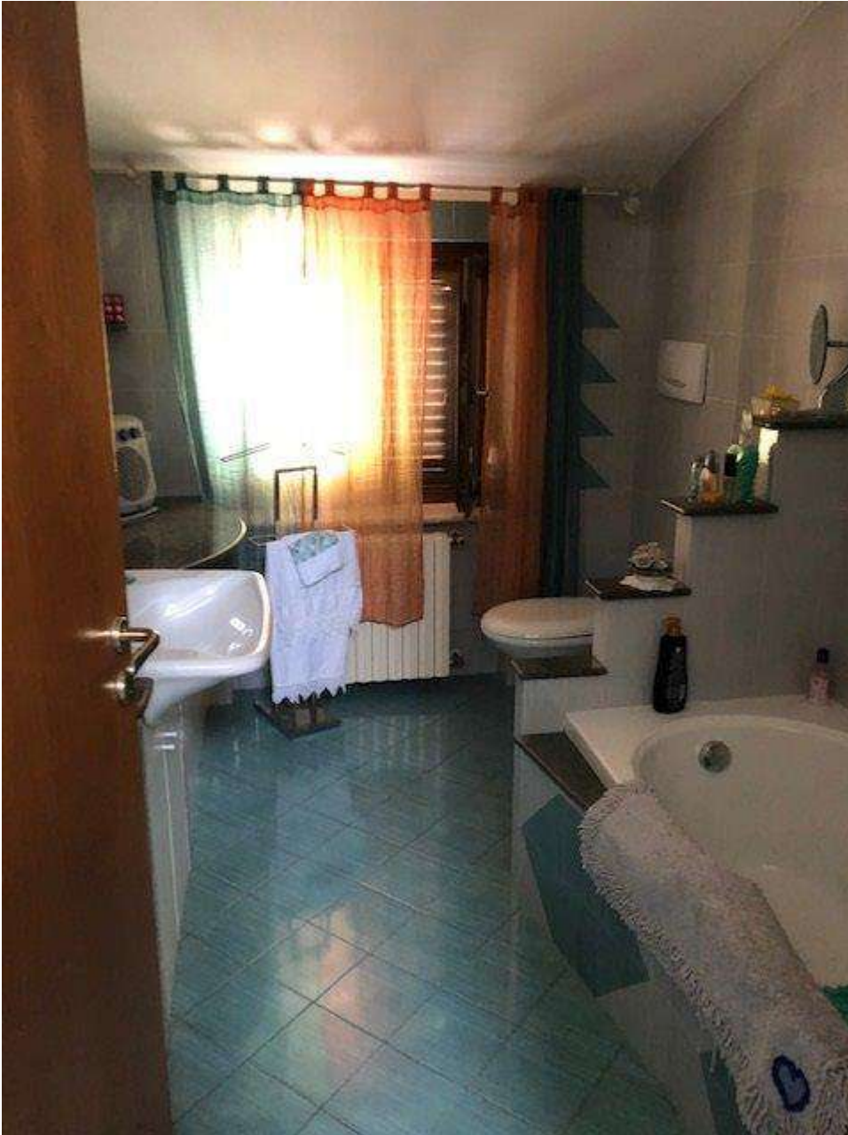
PIANO PRIMO BAGNO