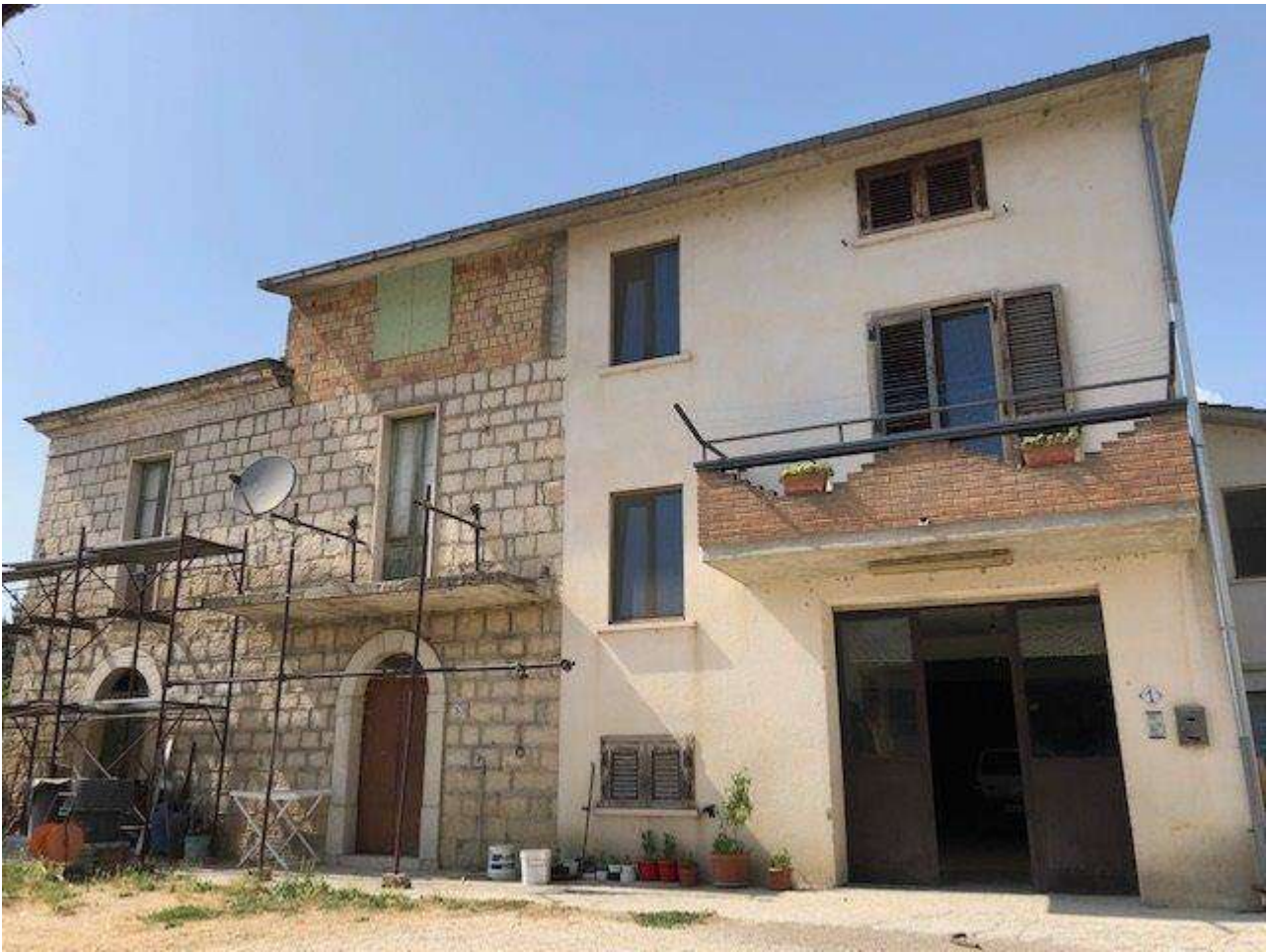
PIANO SEMINTERRATO PROSPETTO SUD