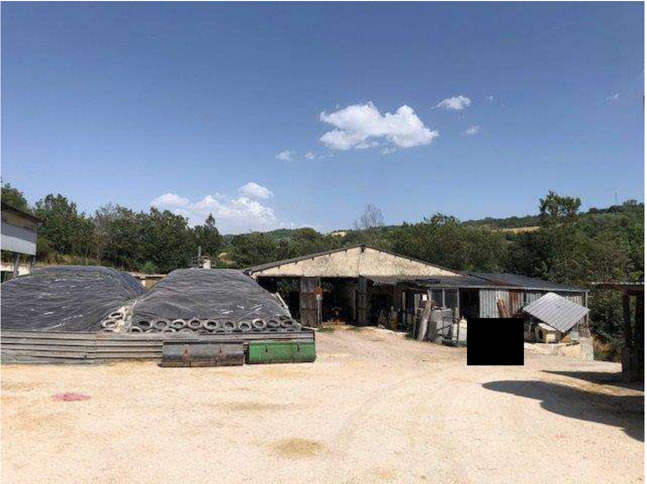
CORPO DI FABBRICA LATO OVEST