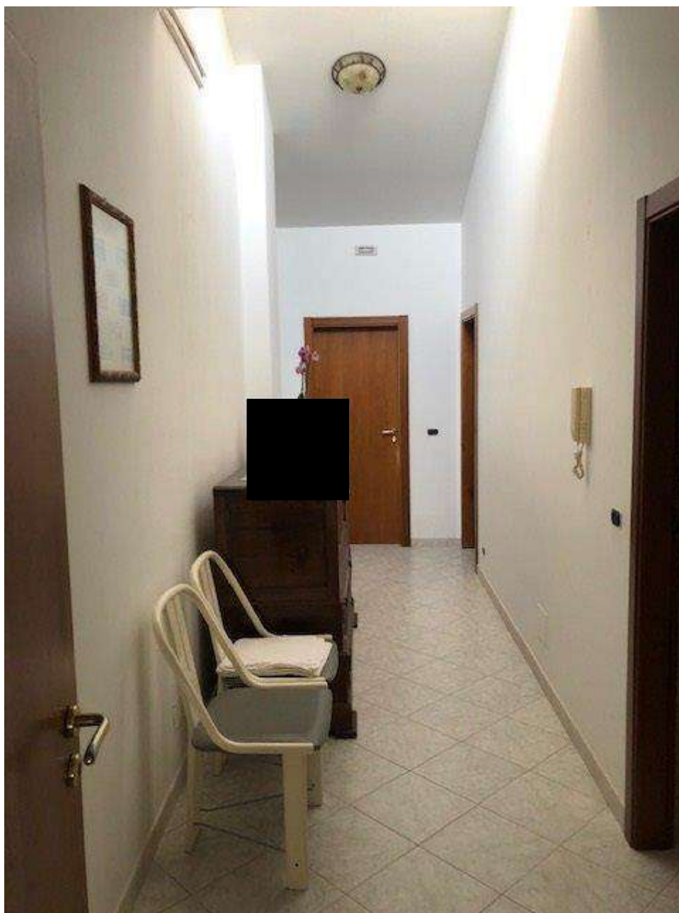
PIANO PRIMO INGRESSO