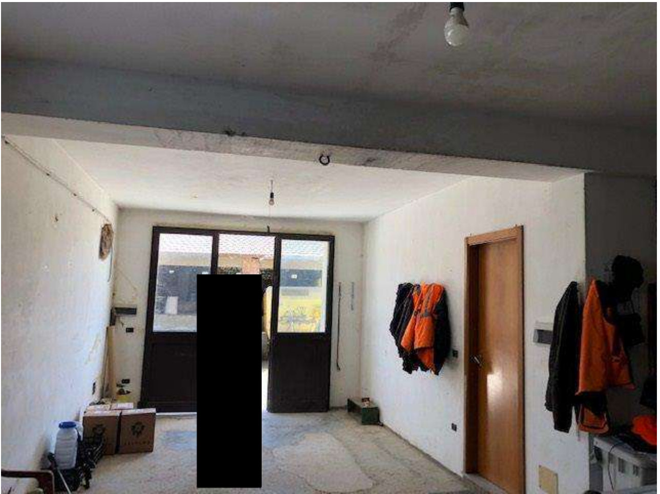
PIANO SEMINTERRATO RIMESSA