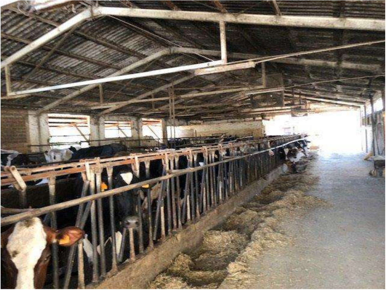
INTERNO CORPO DI FABBRICA