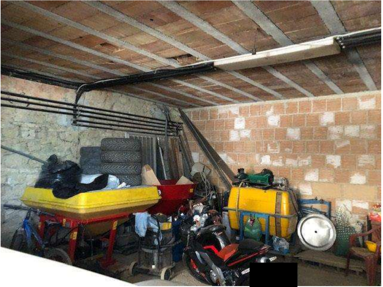
PIANO SEMINTERRATO CANTINA