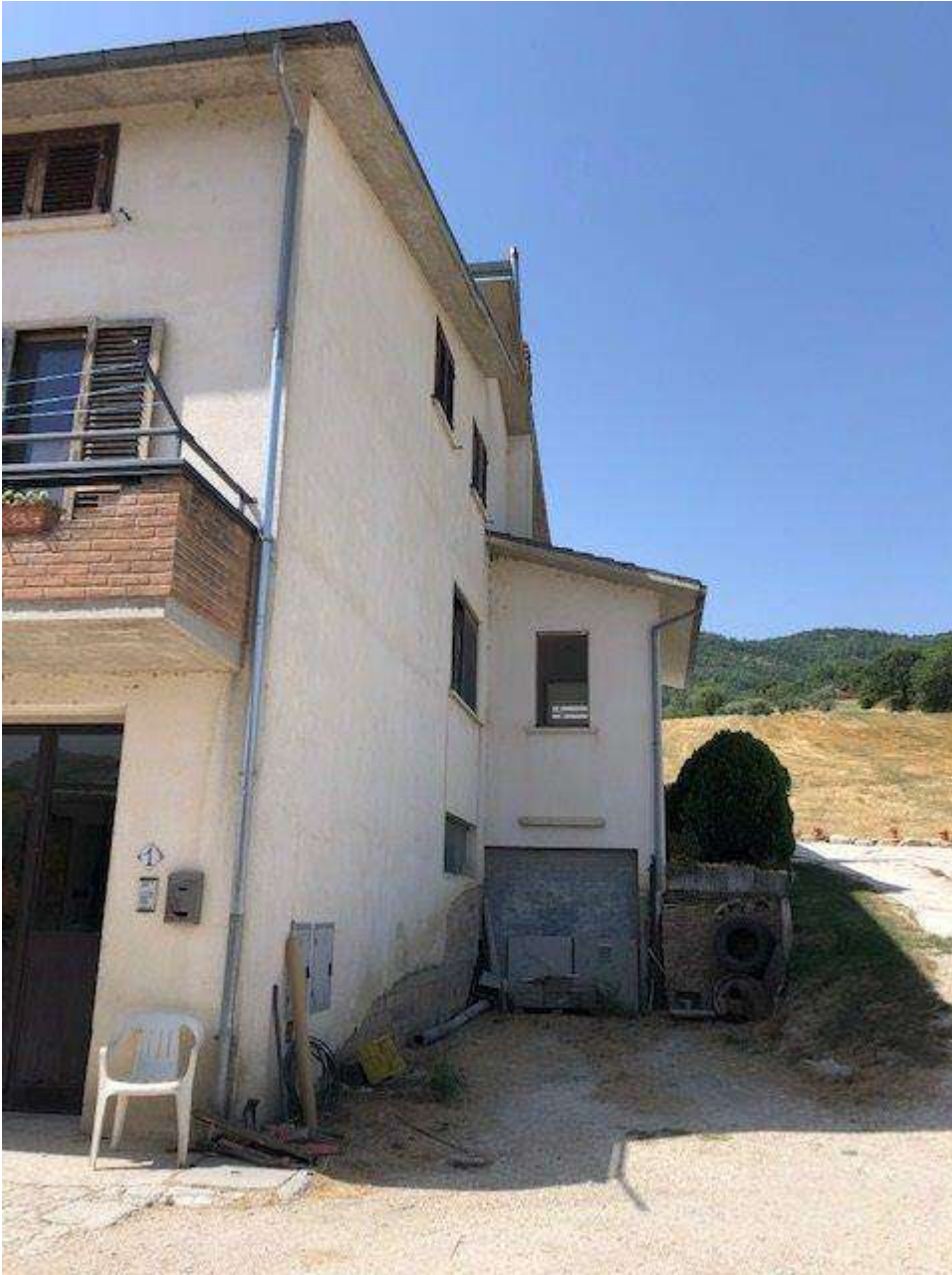
PROSPETTO LATERALE EST