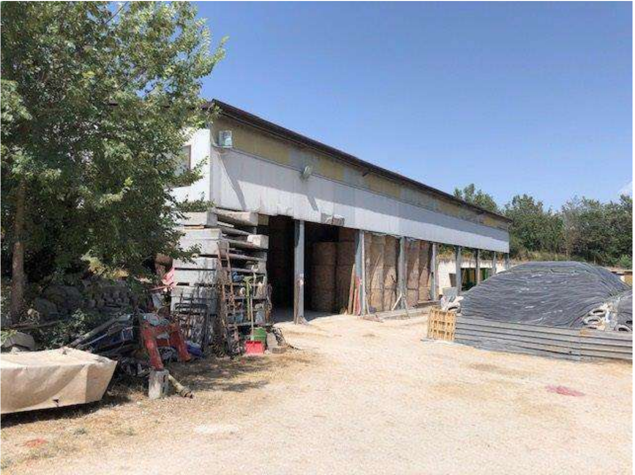
PROSPETTO LATERALE FIENILE