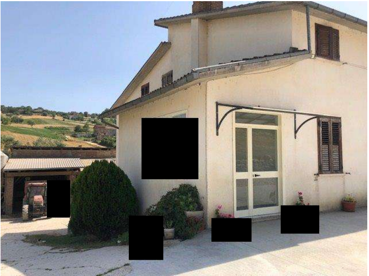
PIANO TERRA INGRESSO ABITAZIONE