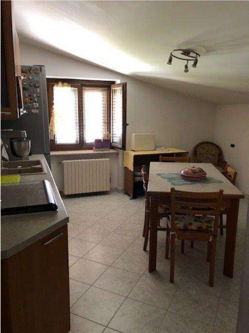
PIANO PRIMO CUCINA