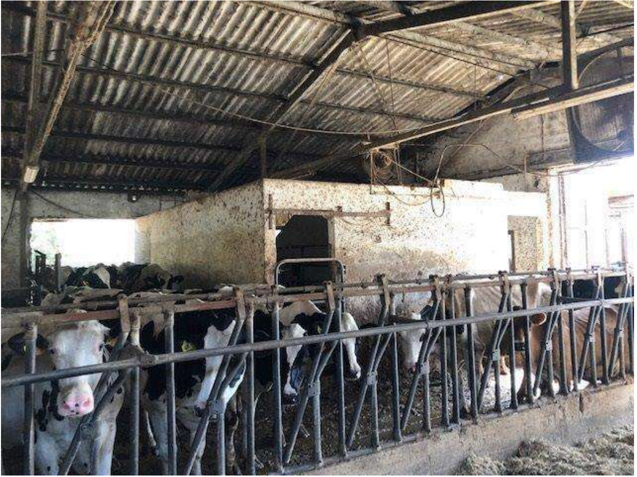
INTERNO CORPO DI FABBRICA