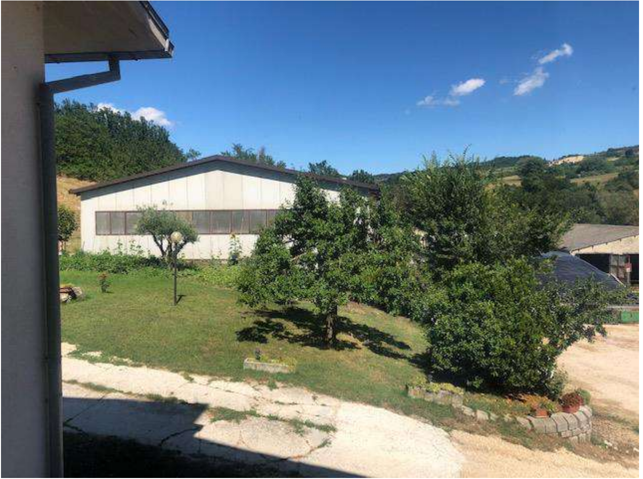
FIENILE PROSPETTO OVEST