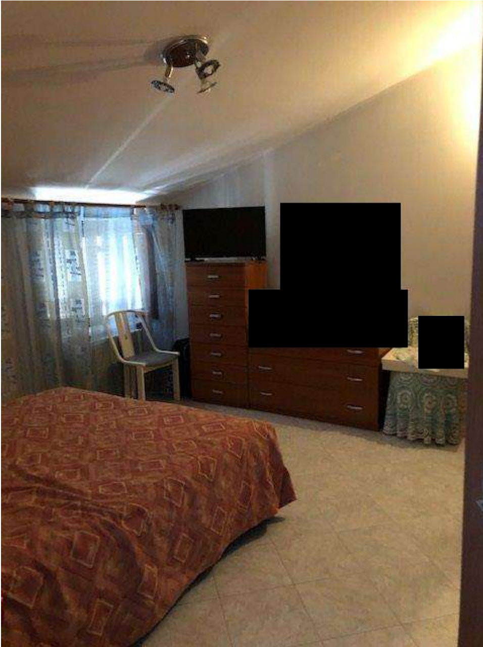
PIANO PRIMO CAMERA DA LETTO