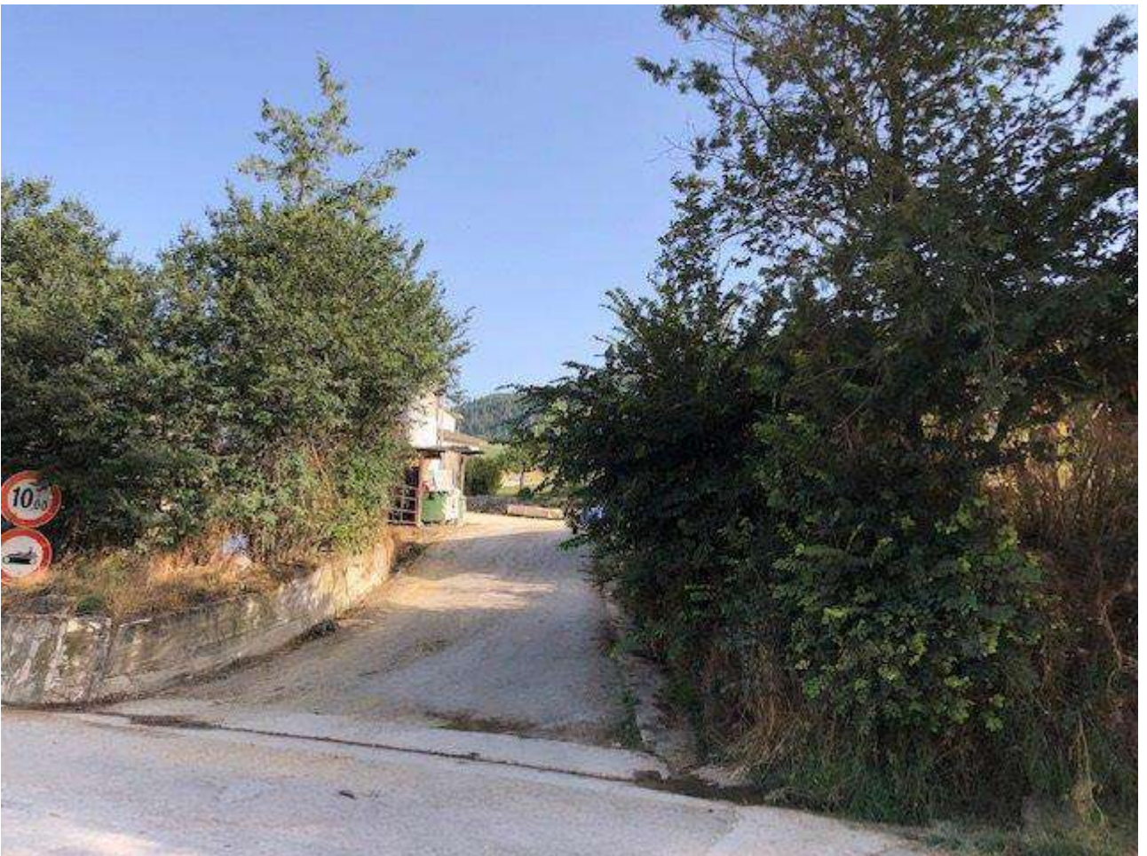
ACCESSO DALLA STRADA