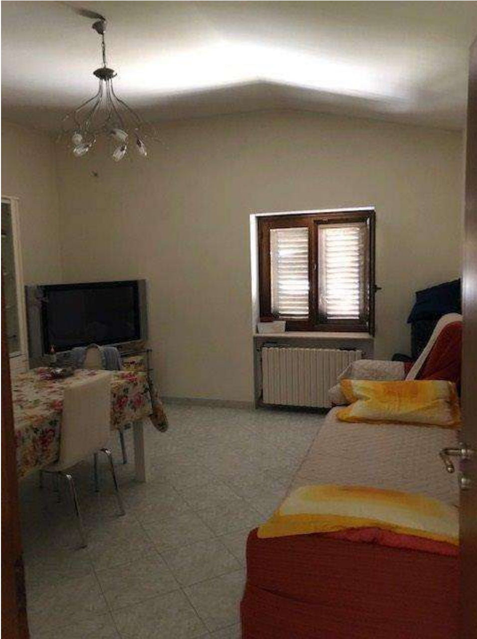
PIANO PRIMO SOGGIORNO