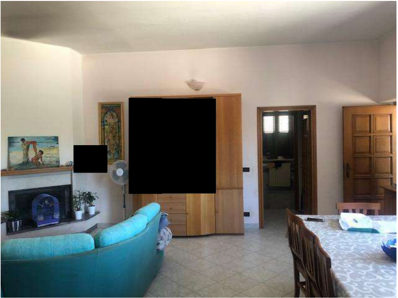
PIANO TERRA SOGGIORNO