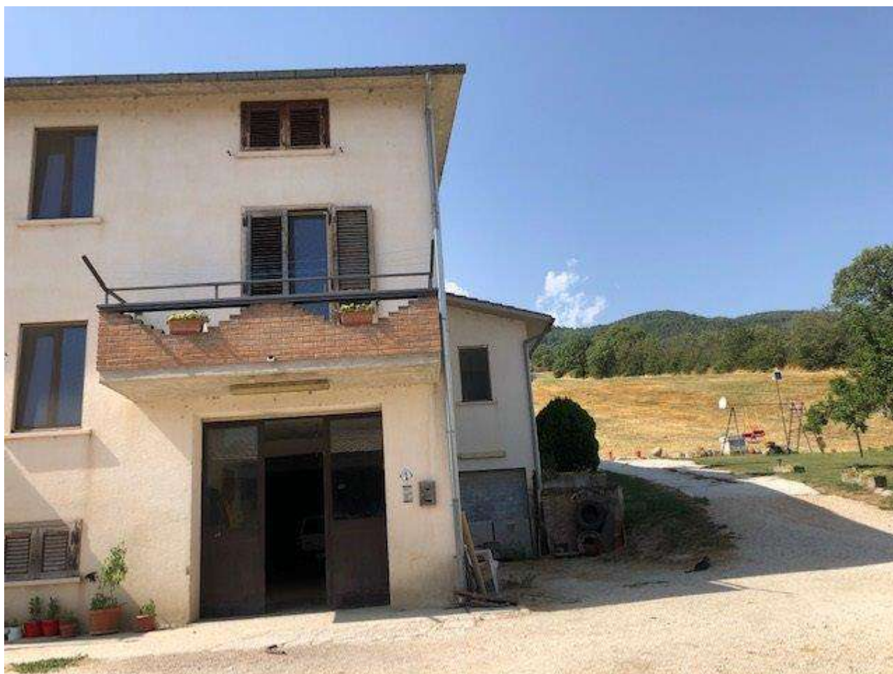
PIANO SEMINTERRATO PROSPETTO ENTRATA