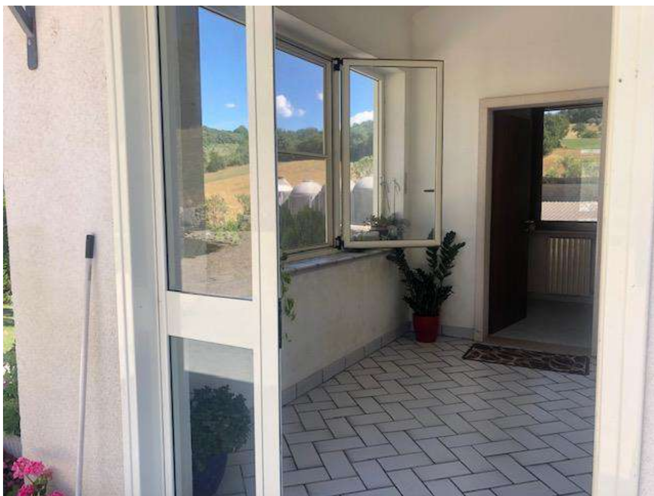
PIANO TERRA ATRIO ABITAZIONE