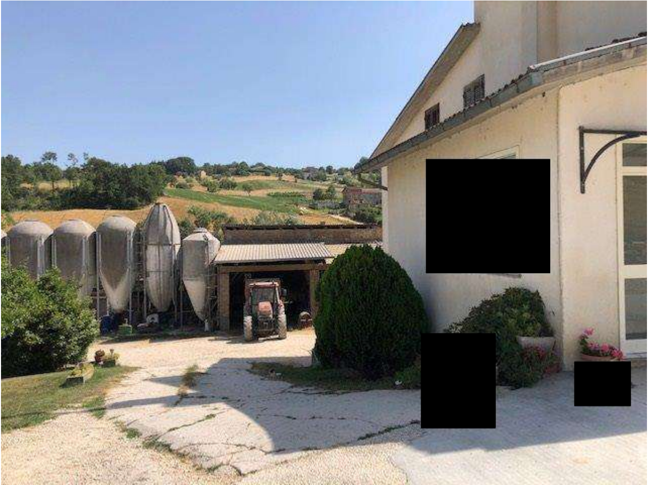
VISTA CORTE ESTERNA