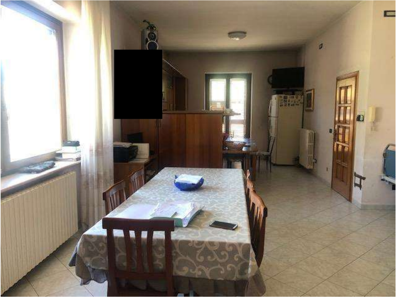
PIANO TERRA SALA DA PRANZO E CUCINA