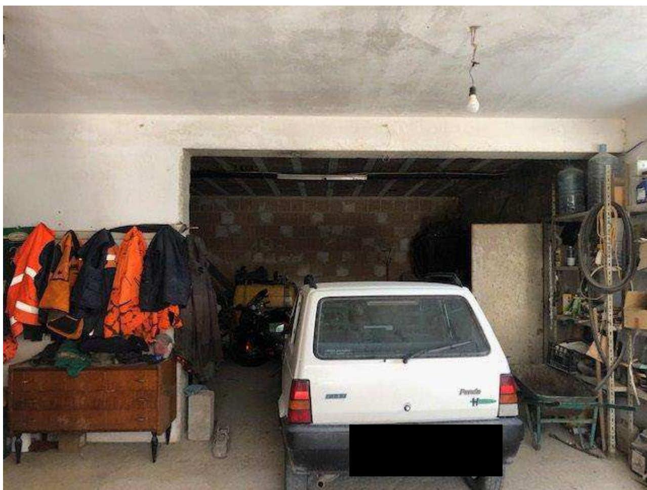
PIANO SEMINTERRATO RIMESSA