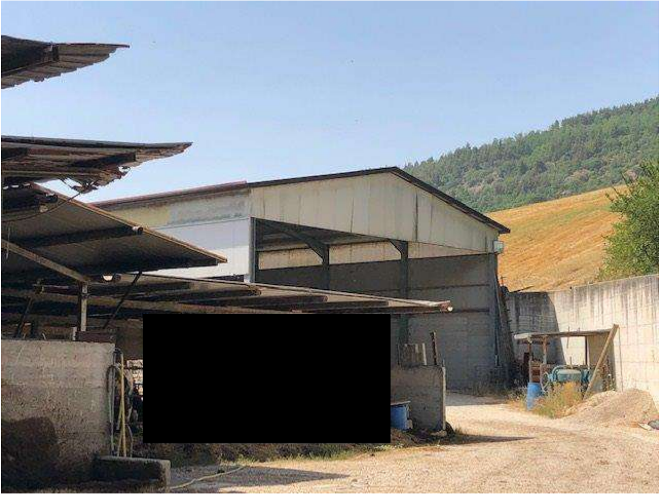
PROSPETTO EST INGRESSO FIENILE