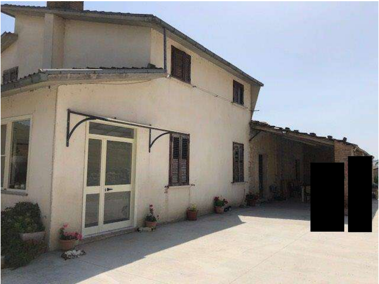
PIANO TERRA PROSPETTO NORD