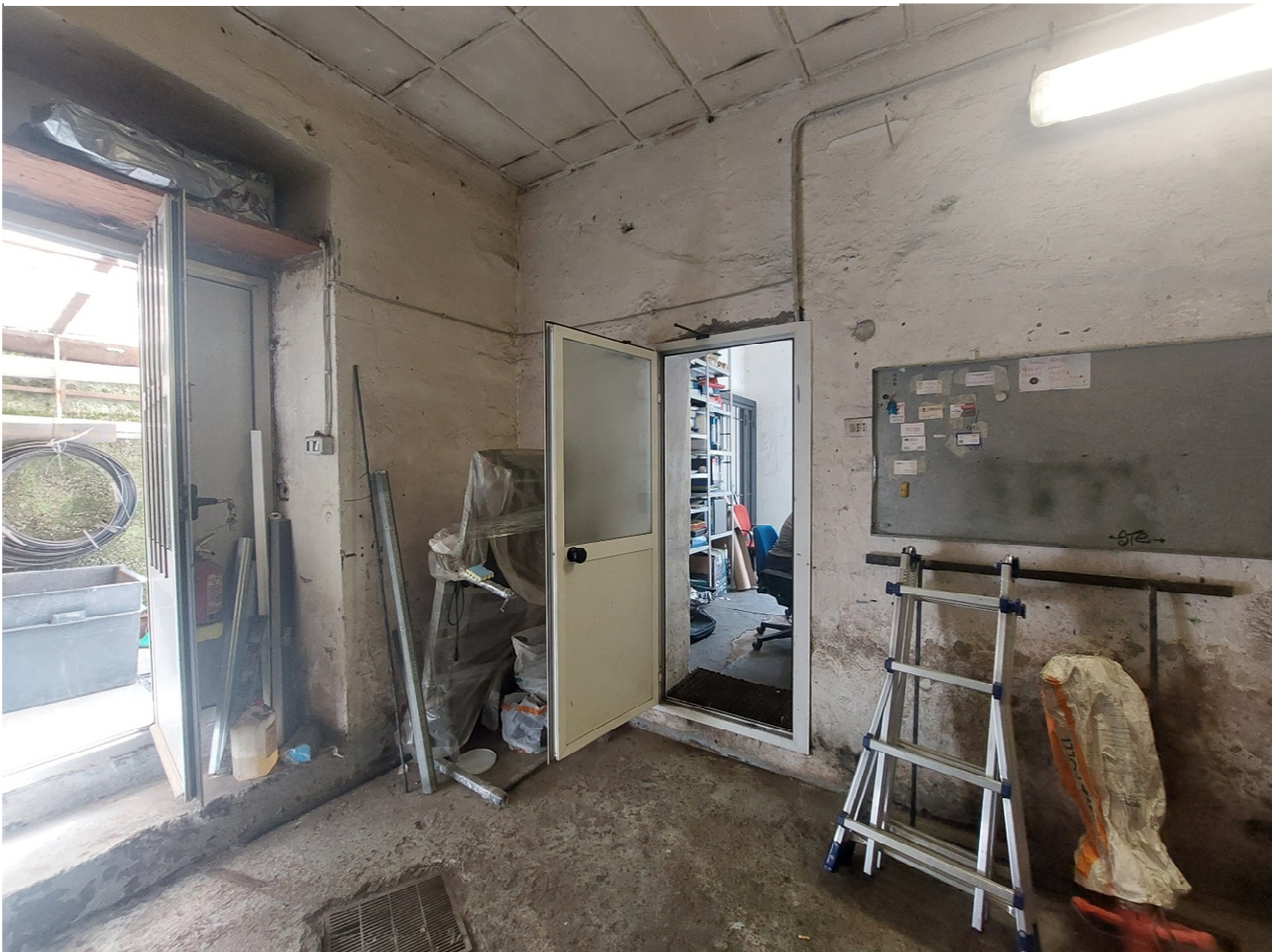
FOTO 4: vano retrobottega con porta di accesso al cortile posto a lato