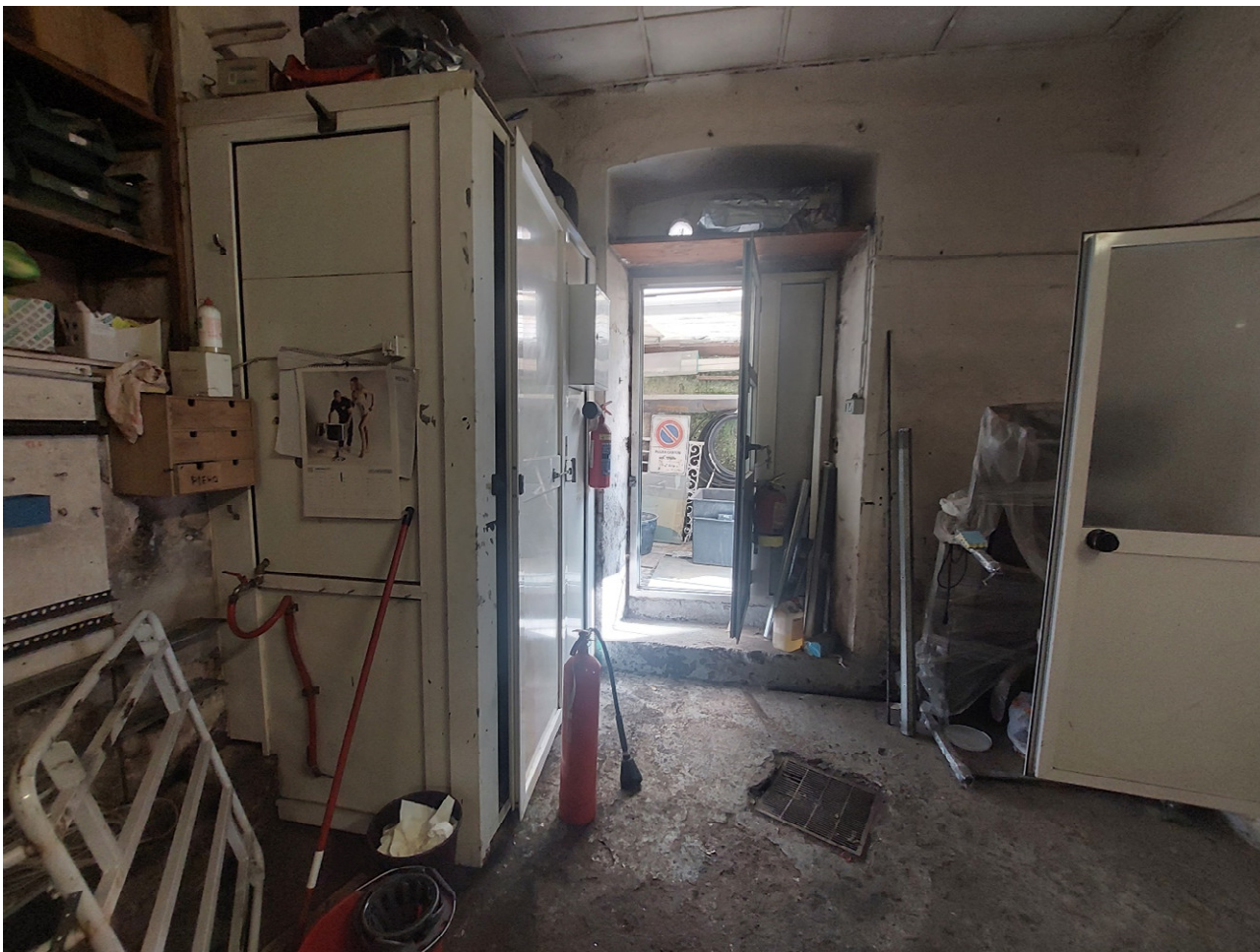
FOTO 5: vano retrobottega – vista verso la porta di accesso al cortile e il manufatto in metallo che ospita il servizio igienico