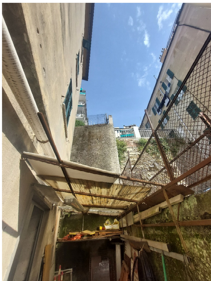
FOTO 14,15: cortile esterno: particolari della tettoia e del pavimento in grigliato