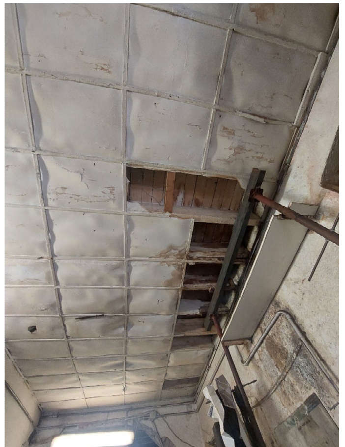
FOTO 9: particolare del controsoffitto e dell'intradosso del solaio