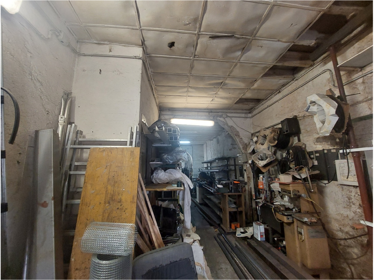
FOTO 7: vano retrobottega – vista verso il varco che mette allo stato attuale in comunicazione il civ. 94r con il civ. 88-90r, mediante la demolizione di muro di separazione.