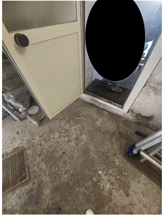
FOTO 2,3: vista del locale di ingresso e del passaggio al vano retrobottega