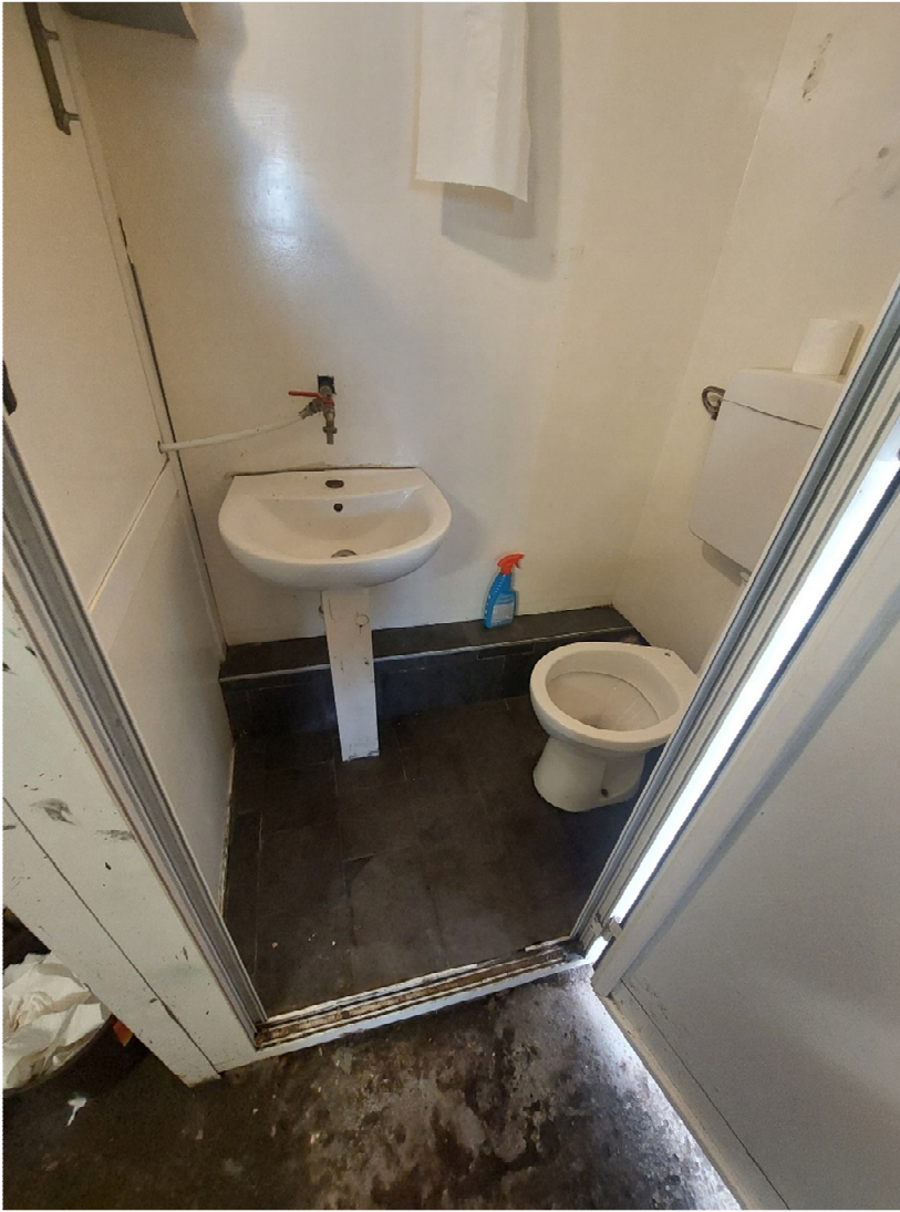
FOTO 10,11: servizio igienico e particolare dell'adduzione idrica