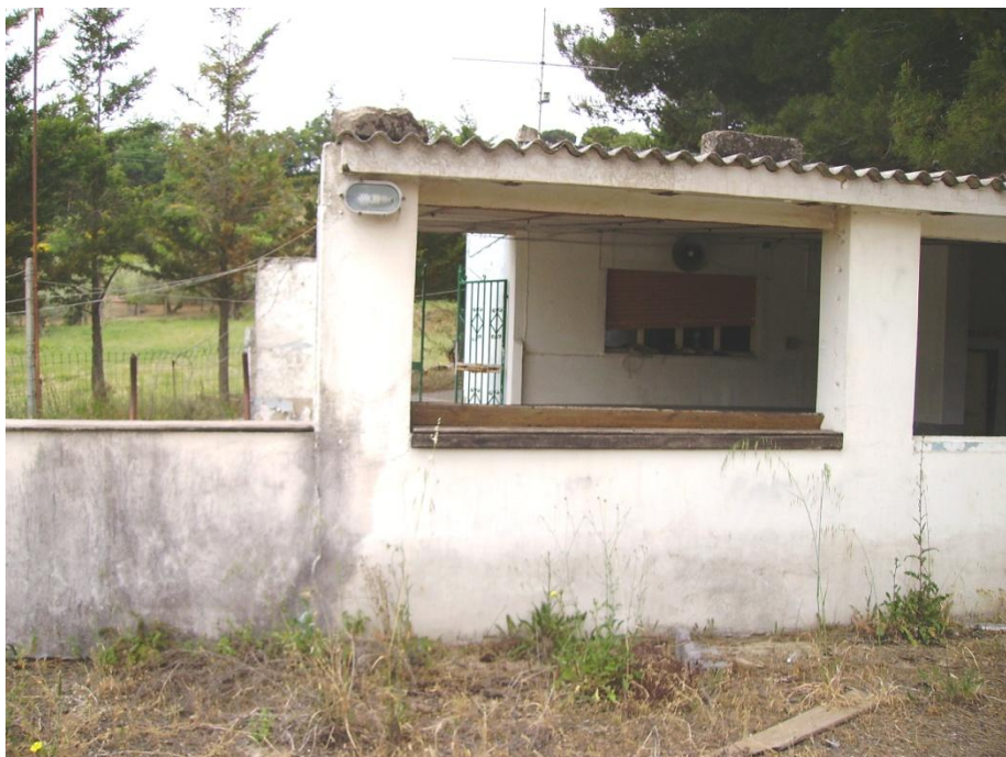
Vista esterna vano bar