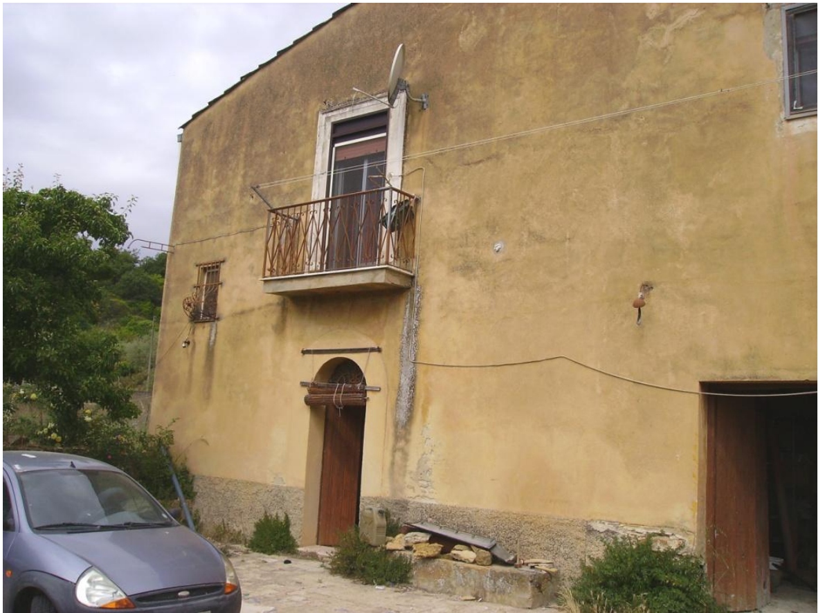
Vista di parte del magazzino part. 90/sub. 1- Fig. 178