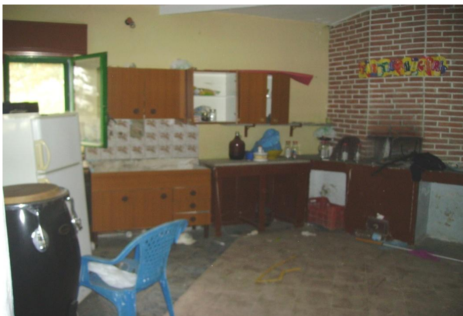
Vista interna vano bar