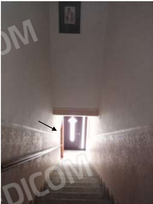
Figura 23. Vano scala con in fondo porta collegata al piano terra