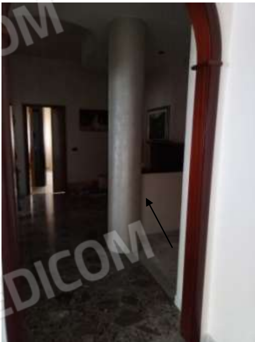
Figura 15. Interni fg.78 plla.68 sub 5