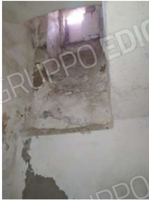
Figura 30. Interni fg78 plla68 sub7