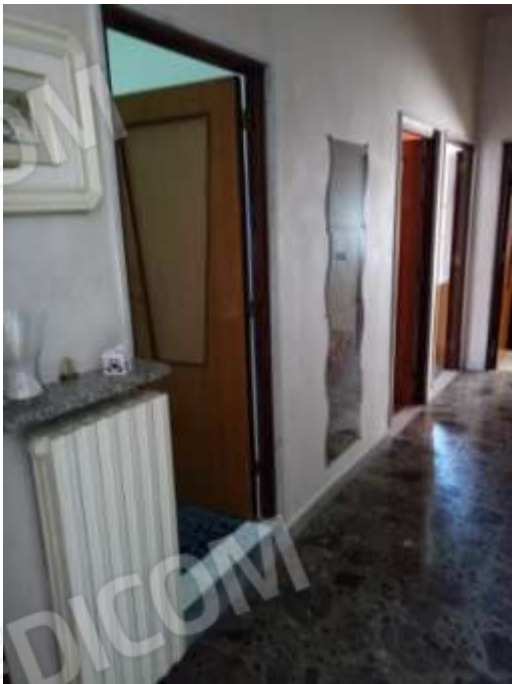
Figura 11. Interni fg.78 plla.68 sub 5