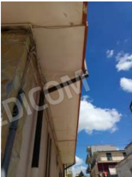
Figura 3. Particolare dello sbalzo.