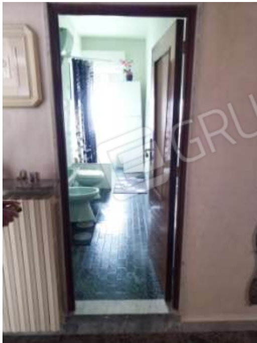
Figura 12. Interni fg.78 plla.68 sub 5