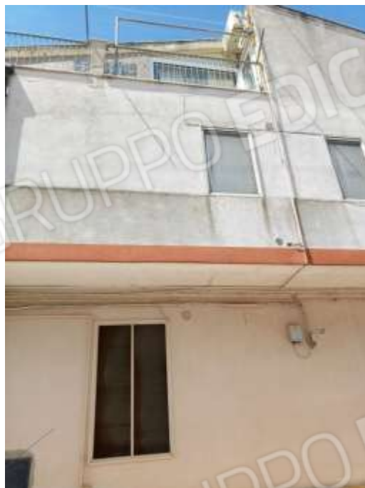
Figura 6. Particolare facciata su Via Giordano Bruno.