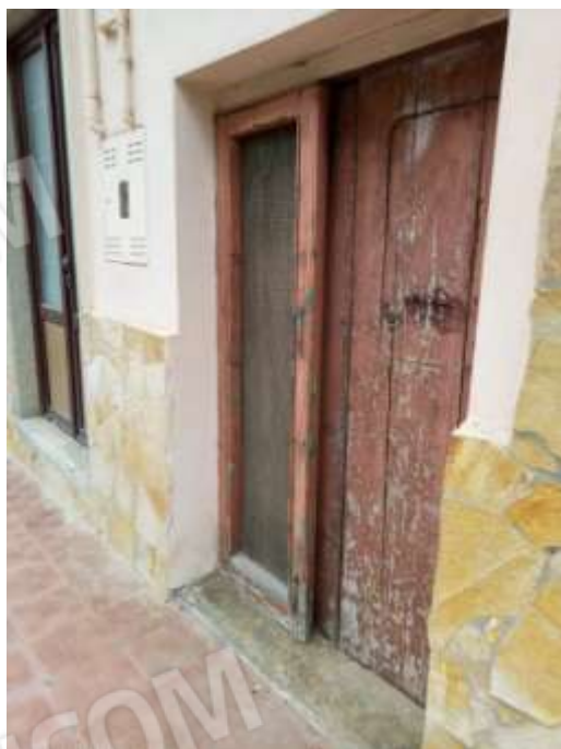
Figura 7. Particolare portoncino piano primo sottostrada.