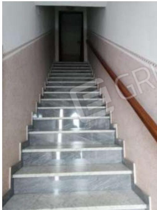
Figura 24. Vano scala