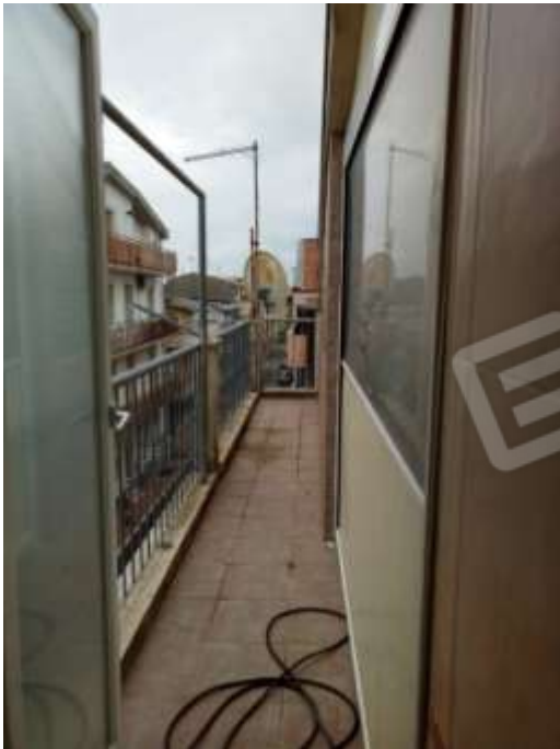
Figura 21. Balcone fg.78 plla.68 sub 5 secondo piano