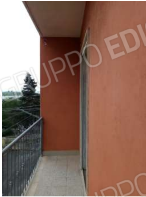
Figura 14. Balcone fg.78 plla.68 sub 5