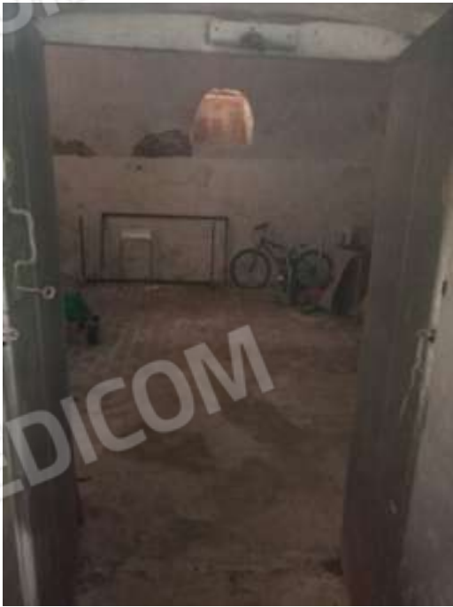
Figura 27. Interni fg78 plla68 sub7