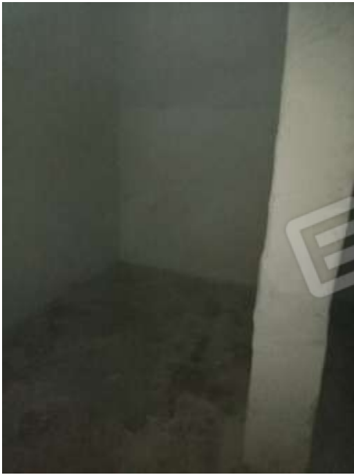
Figura 29. Interni fg78 plla68 sub7