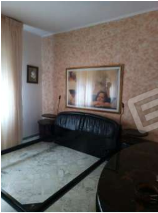
Figura 13. Interni fg.78 plla.68 sub 5