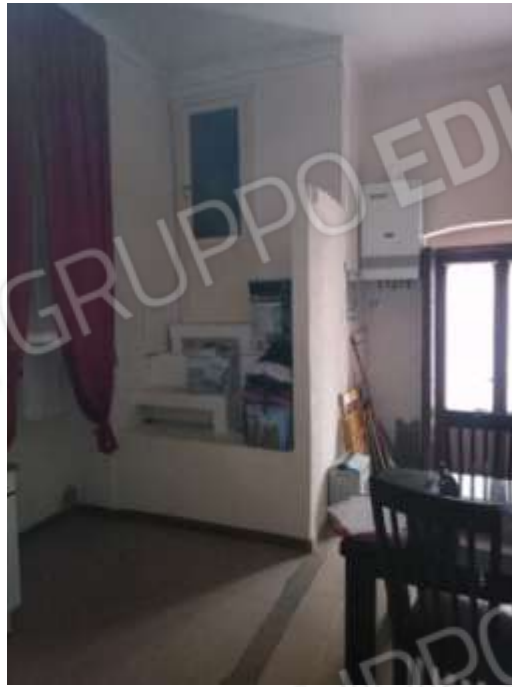
Figura 26. Interni fg78 plla68 sub7