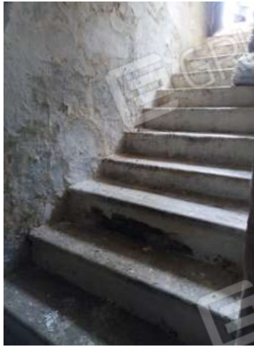
Figura 28. Interni fg78 plla68 sub7