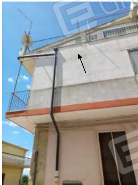
Figura 4. Particolare fessurazione tra il primo e il secondo piano.