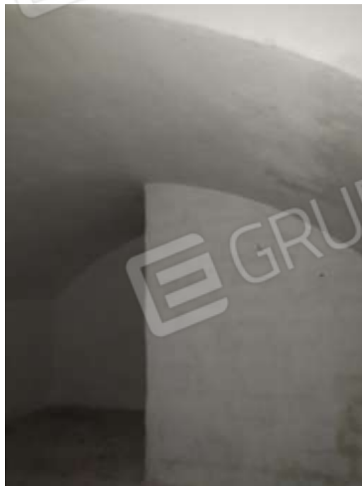
Figura 32. Interni fg78 plla68 sub7