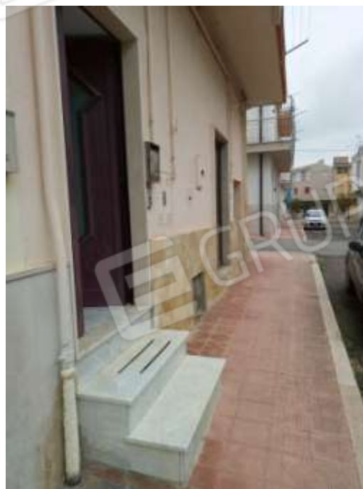
Figura 8. Ingresso immobile fg.78 p.lla 68 sub 5.