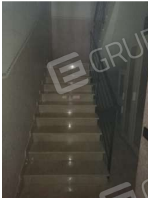
Figura 16. Interni fg.78 plla.68 sub 5