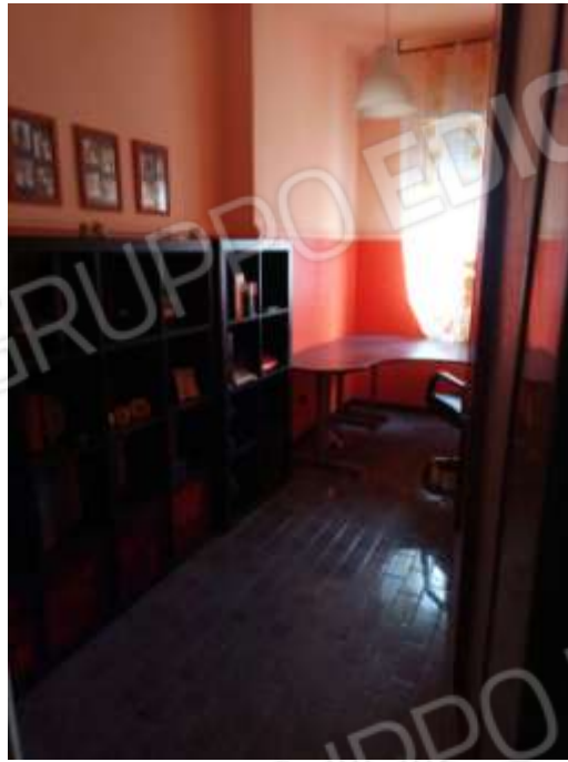
Figura 10. Interni fg.78 plla.68 sub 5