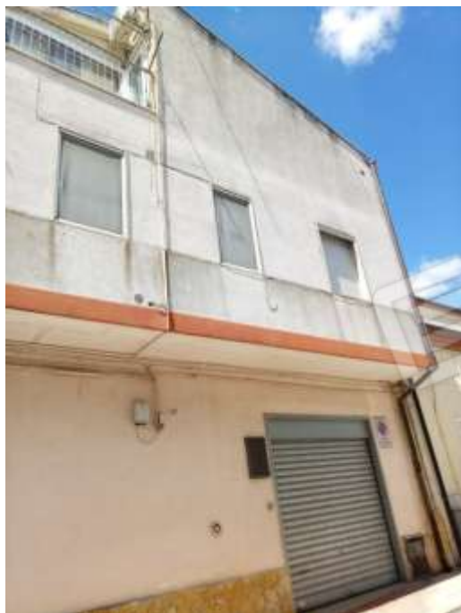
Figura 5 Particolare apertura saracinesca.