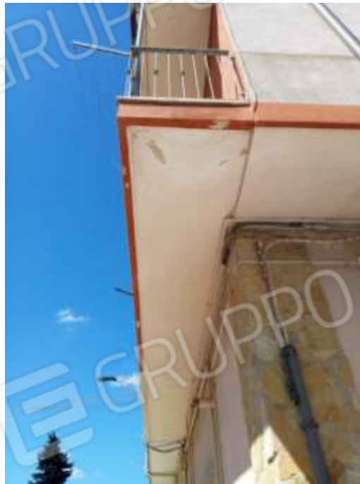
Figura 2. Particolare dello sbalzo.