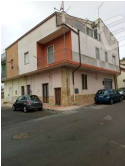
Figura 1. Esterni immobili Fg.78, plla 68 sub 5-7