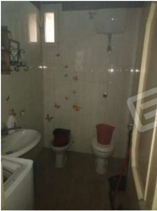
Figura 25. Interni fg78 plla68 sub7