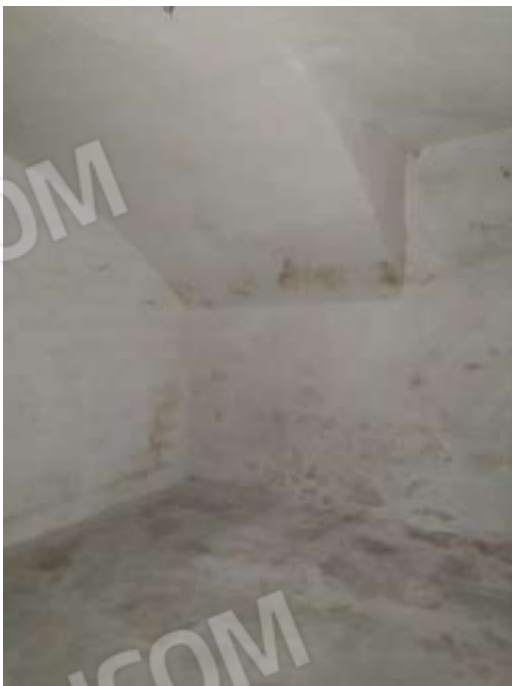
Figura 31. Interni fg78 plla68 sub7