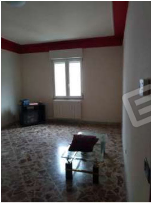
Figura 9. Interni fg.78 plla.68 sub 5