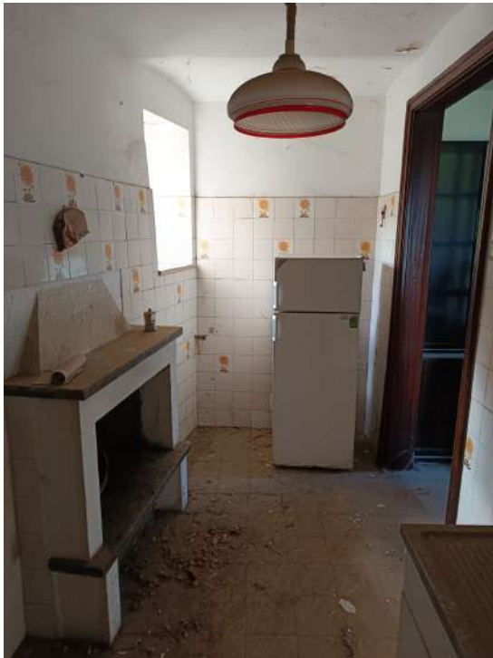
Foto n. 21-23: vista della cucina. Dettaglio del distacco tinteggiatura e infiltrazioni soffitto.