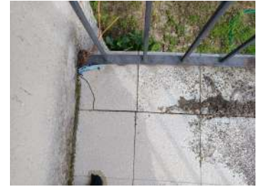
Foto n. 38-39: Dettaglio del solaio del terrazzo piano superiore.