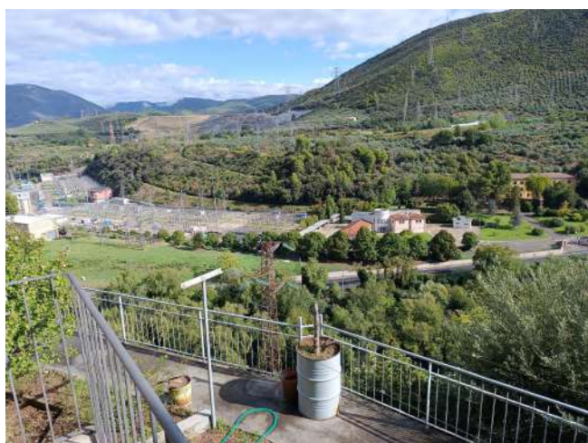
Foto n. 11-12: vista panoramica lato posteriore: valle del Nera ed "ex stabilimento di Carbuoro".