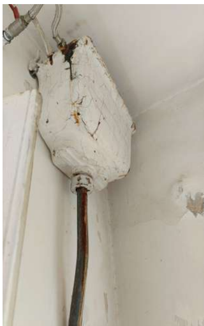
Foto n. 41-45: vista del bagno esterno. Dettaglio della predisposizione allaccio caldaia.