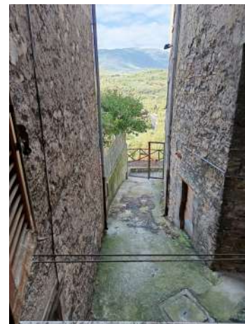
Vista della finestra del soggiorno.