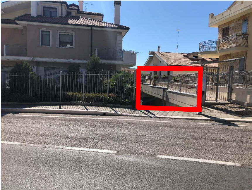
Foto n. 1: Ingresso bene oggetto di stima piano terra – Viale Aldo Moro n. 129 b