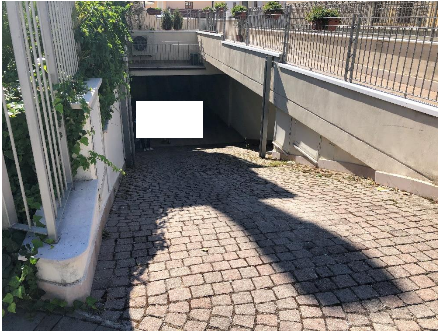
Foto n. 3: Rampa per accesso al locale autorimessa localizzato al livello meno 1