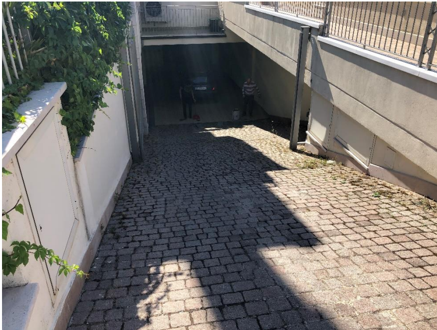
Foto n. 2: Rampa per accesso al locale autorimessa localizzato al livello meno 1