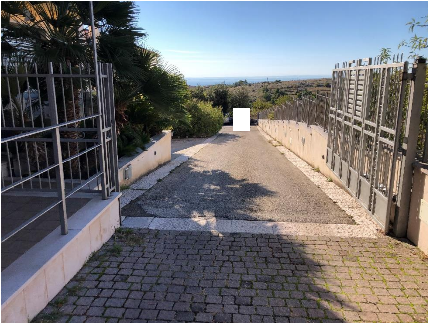
Foto n. 1: Ingresso bene oggetto di stima – Viale Aldo Moro n. 163