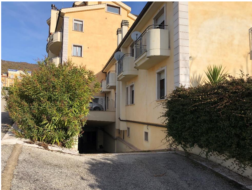
Foto n. 2: Ingresso bene oggetto di stima piano secondo sottostrada