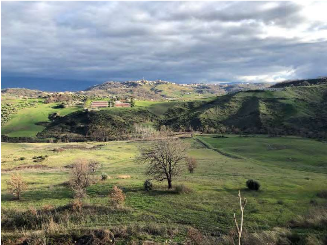
Foto 139 - San Benedetto Ullano (CS). Terreni fg.7, p.la 38-43-61-80