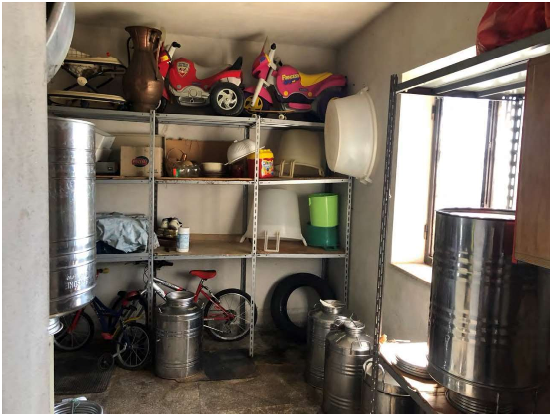
Foto 21 - Magazzino Rende, fg.50, p.IIa 809, sub.2