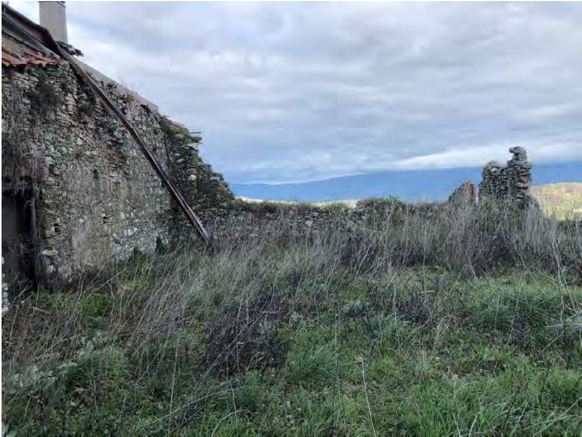
Foto 137 - San Benedetto Ullano (CS). Fabbricato diruto fg.7, p.lla 35-36