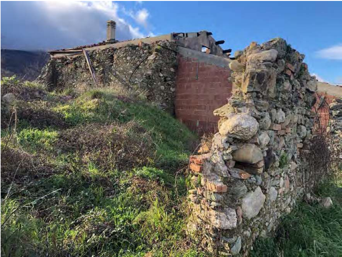
Foto 138 - San Benedetto Ullano (CS). Fabbricato diruto fg.7, p.lla 35-36