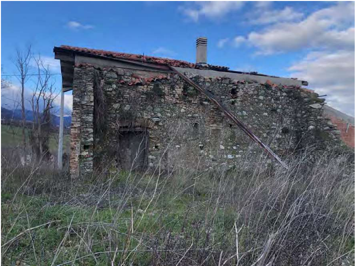
Foto 136 - San Benedetto Ullano (CS). Fabbricato diruto fg.7, p.lla 35-36