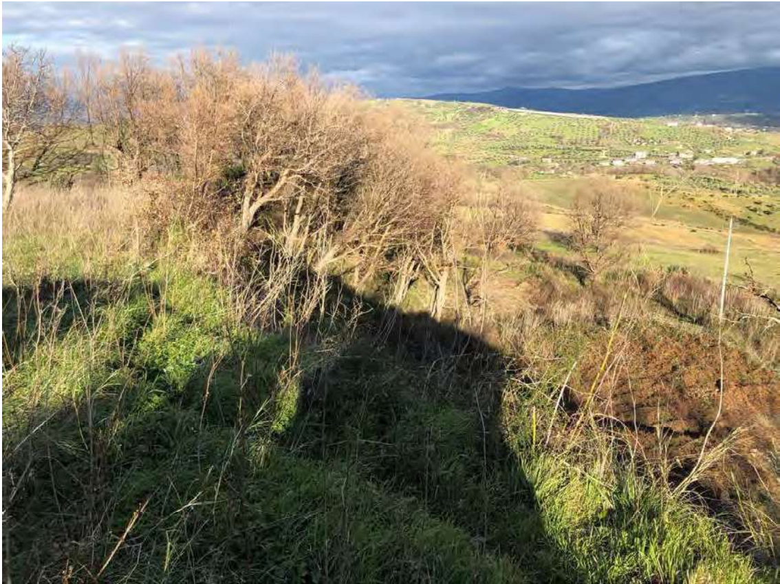
Foto 141 - San Benedetto Ullano (CS). Fabbricato diruto fg.7, p.la 38-43-80