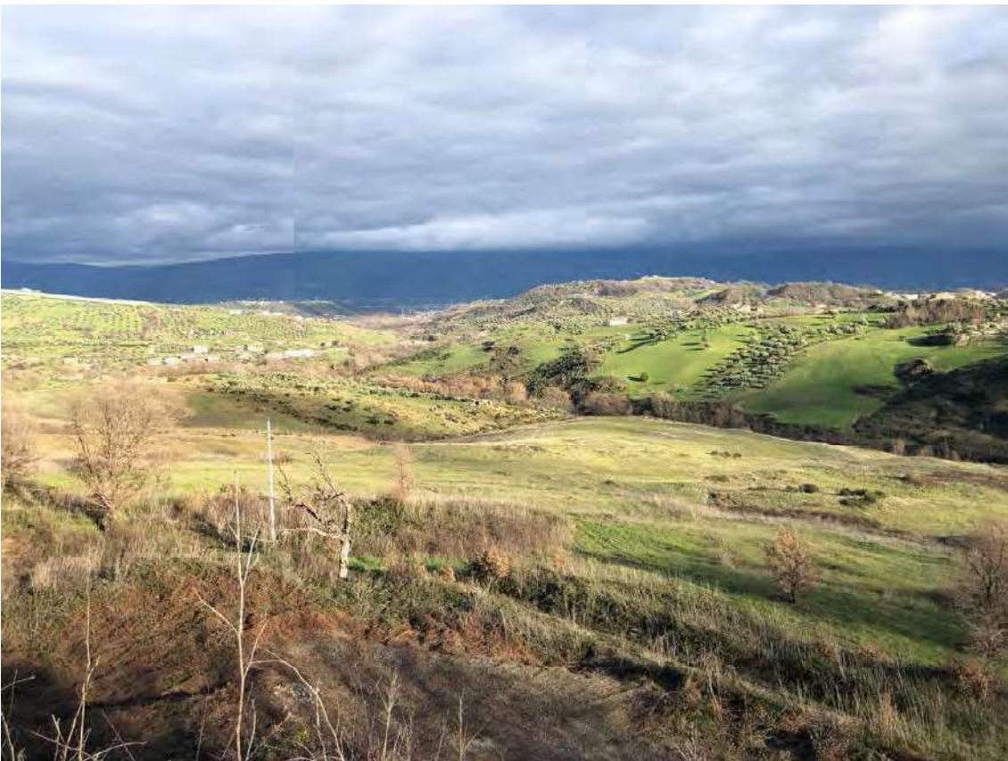
Foto 140 - San Benedetto Ullano (CS). Fabbricato diruto fg.7, p.la 38-43-80