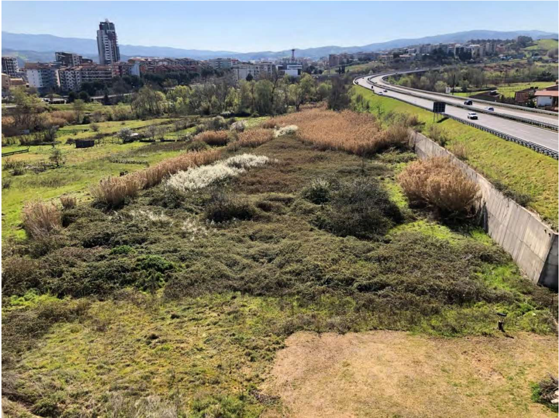
Foto 43 - Terreno Rende (CS), Via Reggio Calabria, fg.50, p.lla 1390-1391