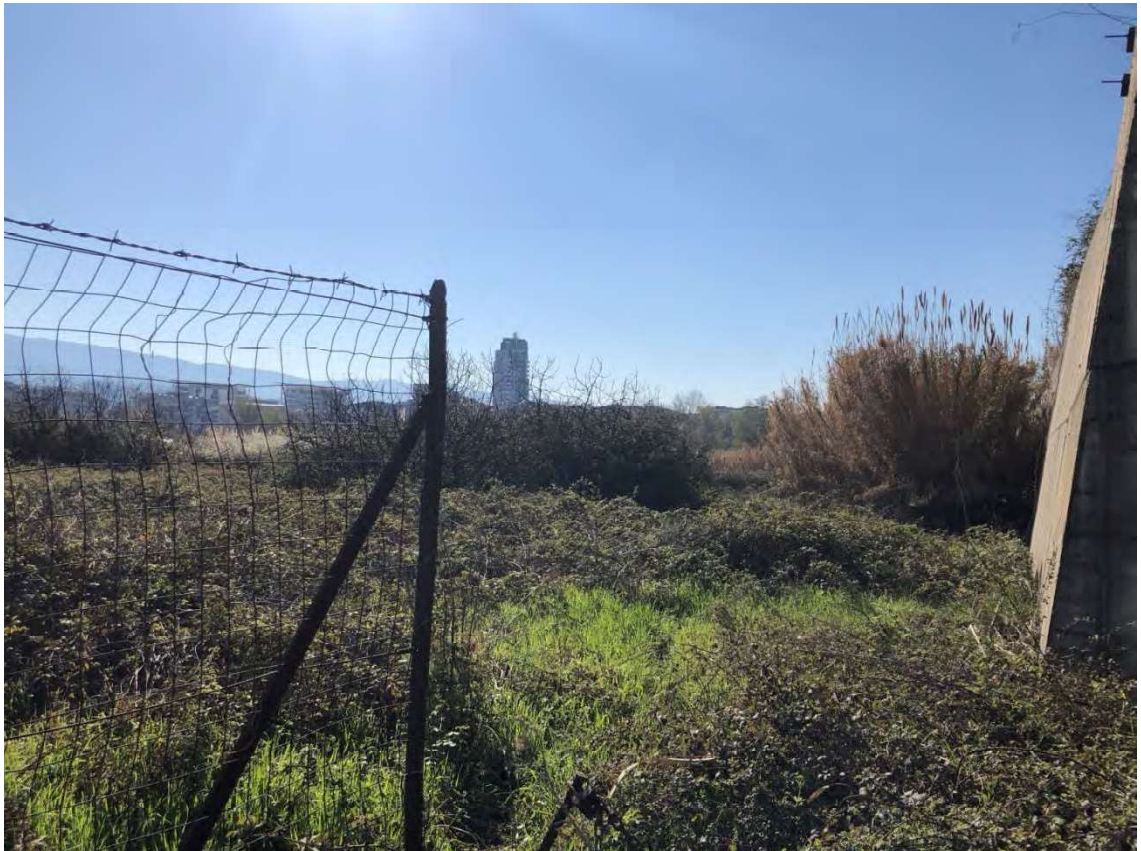
Foto 44 - Terreno Rende (CS), Via Reggio Calabria, fg.50, p.lla 1390-1391