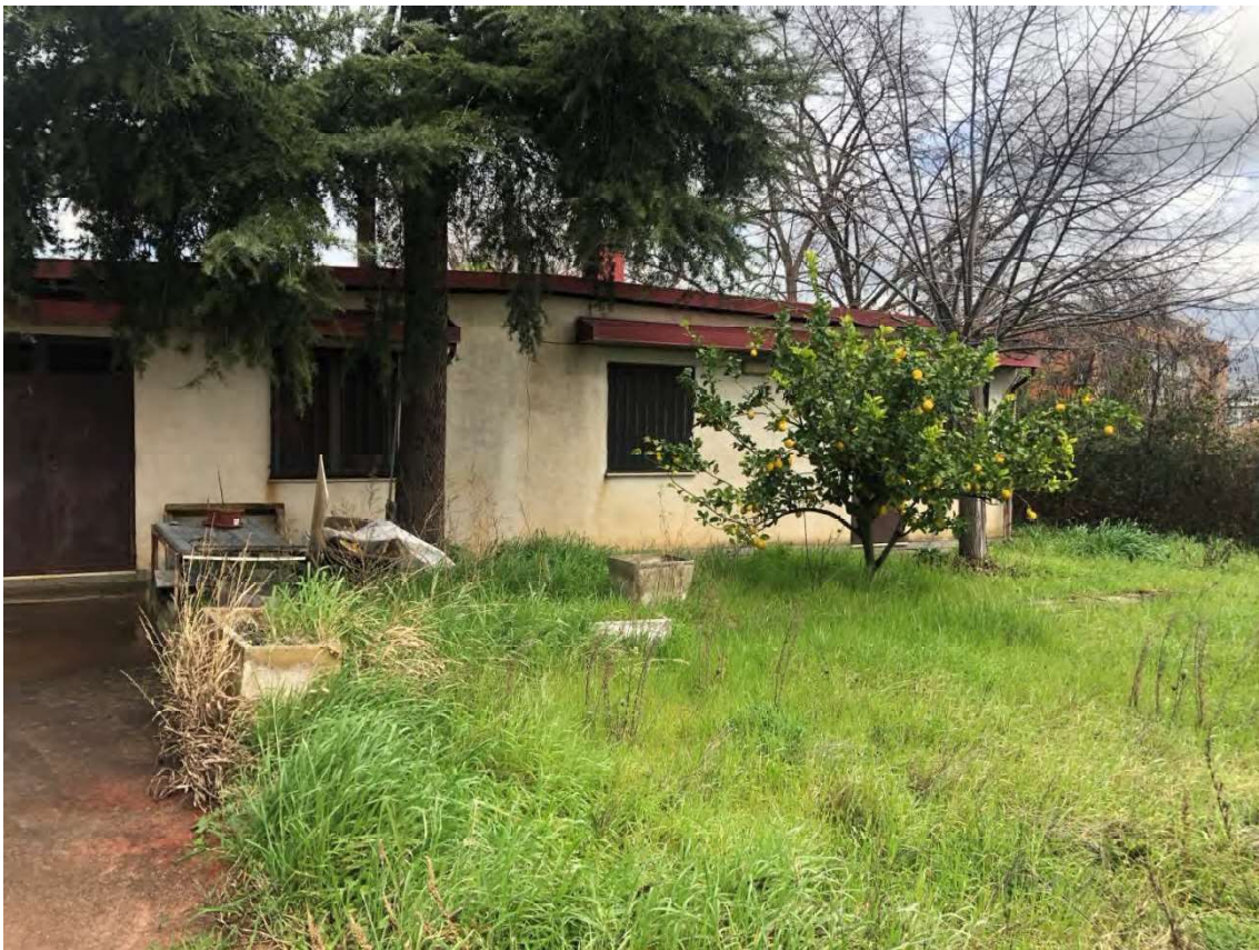
Foto 22 - Magazzino Rende, fg.50, p.IIa 809, sub.2-3