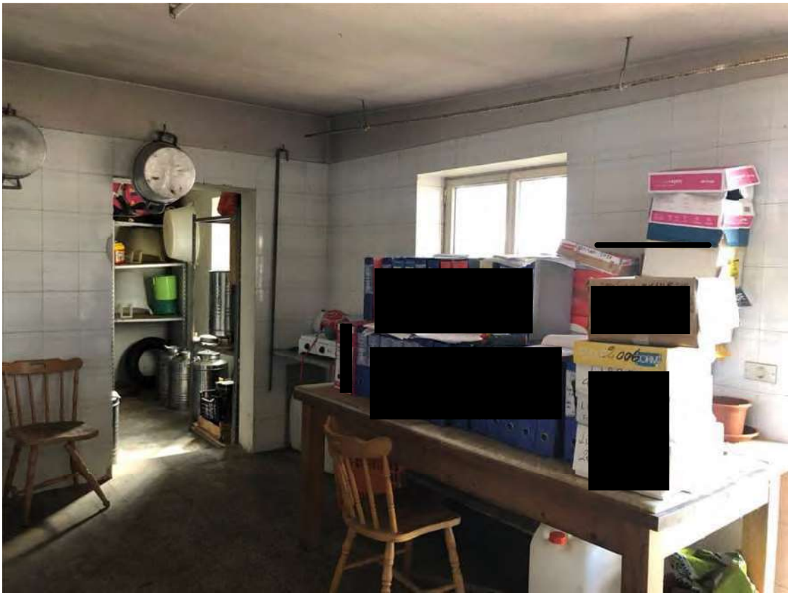
Foto 19 - Magazzino Rende, fg.50, p.IIa 809, sub.2