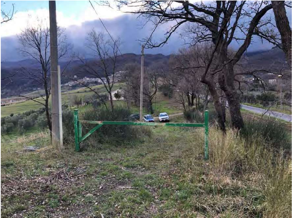
Foto 135 - San Benedetto Ullano (CS). Accesso al fonda dalla Strada Provinciale.