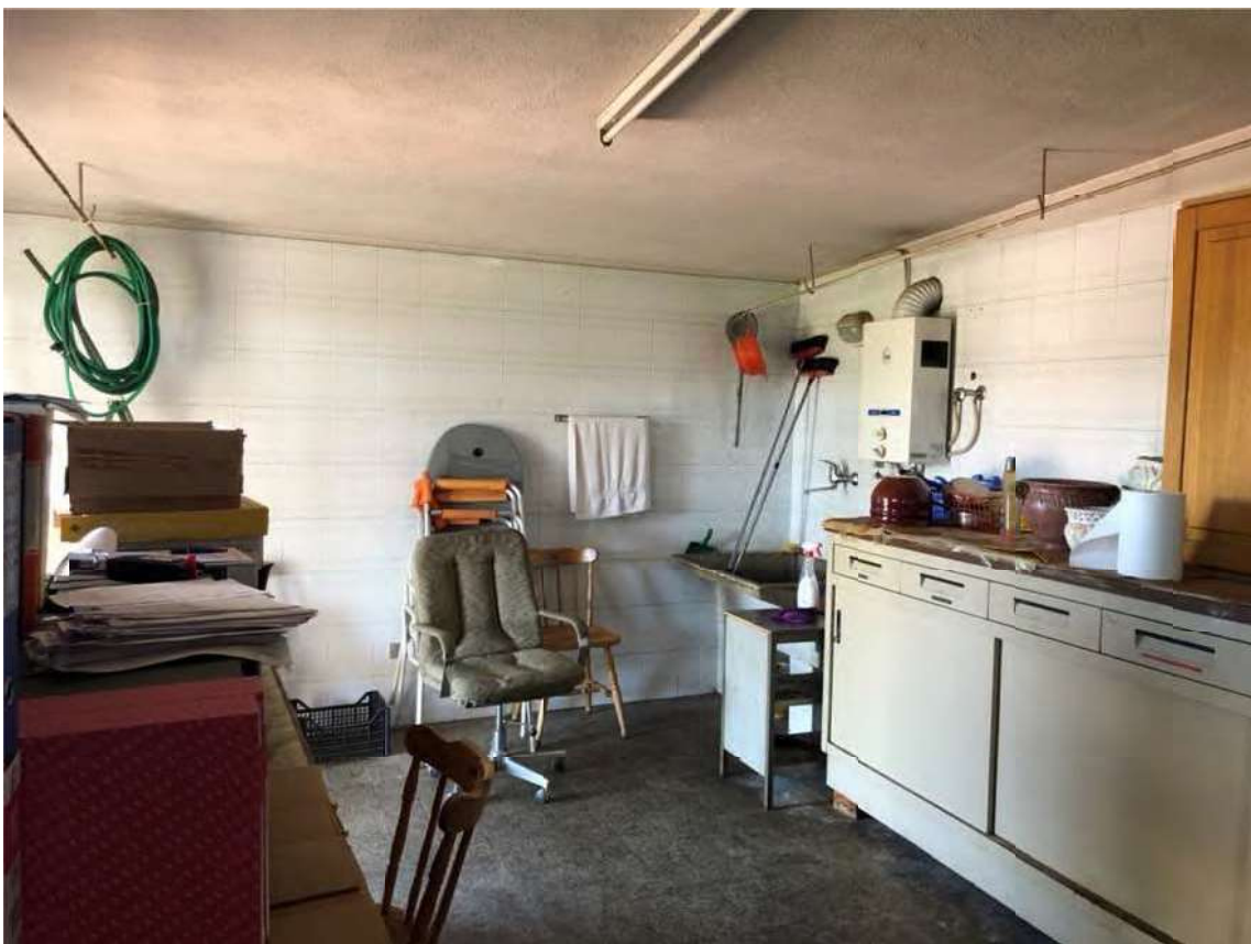
Foto 20 - Magazzino Rende, fg.50, p.IIa 809, sub.2