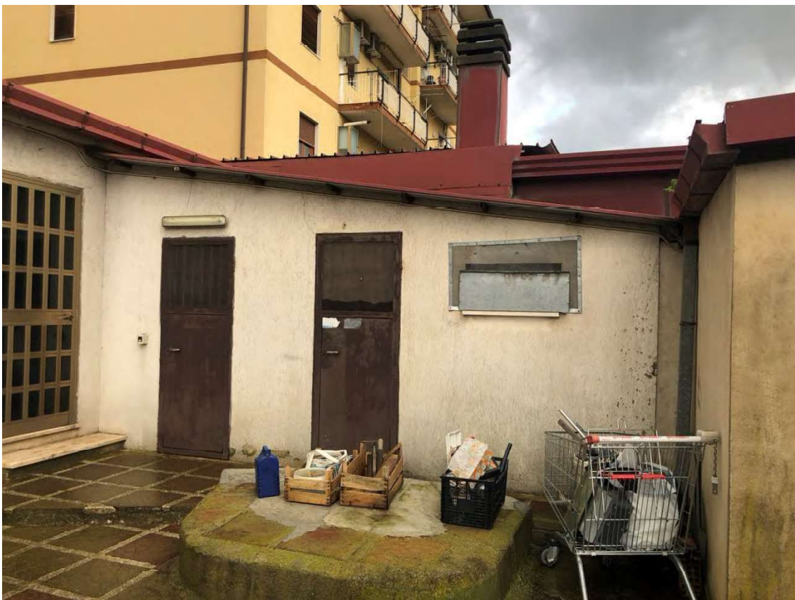
Fotto 30 - Magazzino Rende (CS), fg.50, p.IIa 53, sub.7