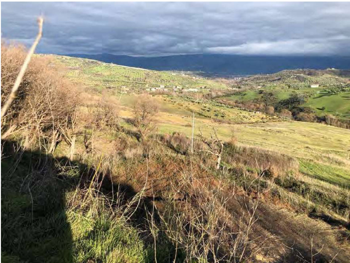
Foto 142 - San Benedetto Ullano (CS). Fabbricato diruto fg.7, p.la 38-43-80