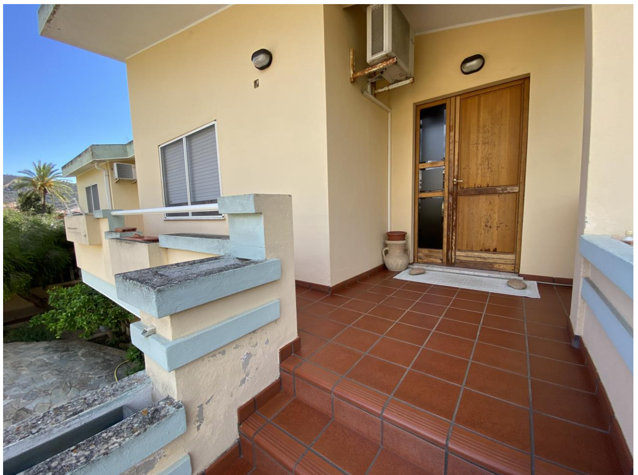
Foto 4 - Immobile A - Balcone