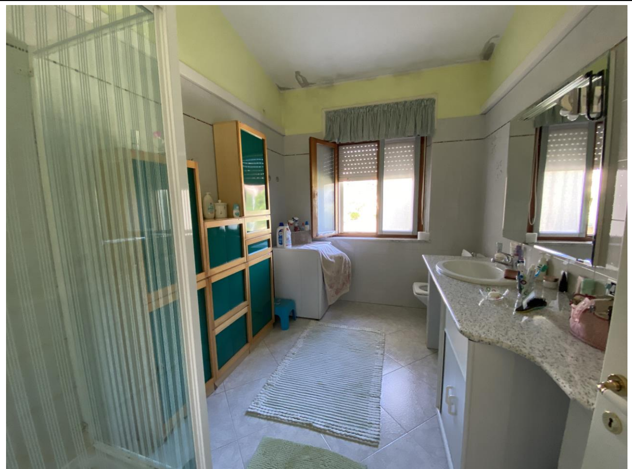
Foto 16 - Immobile A - Bagno 1