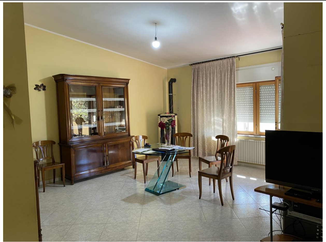
Foto 7 - Immobile A - Pranzo