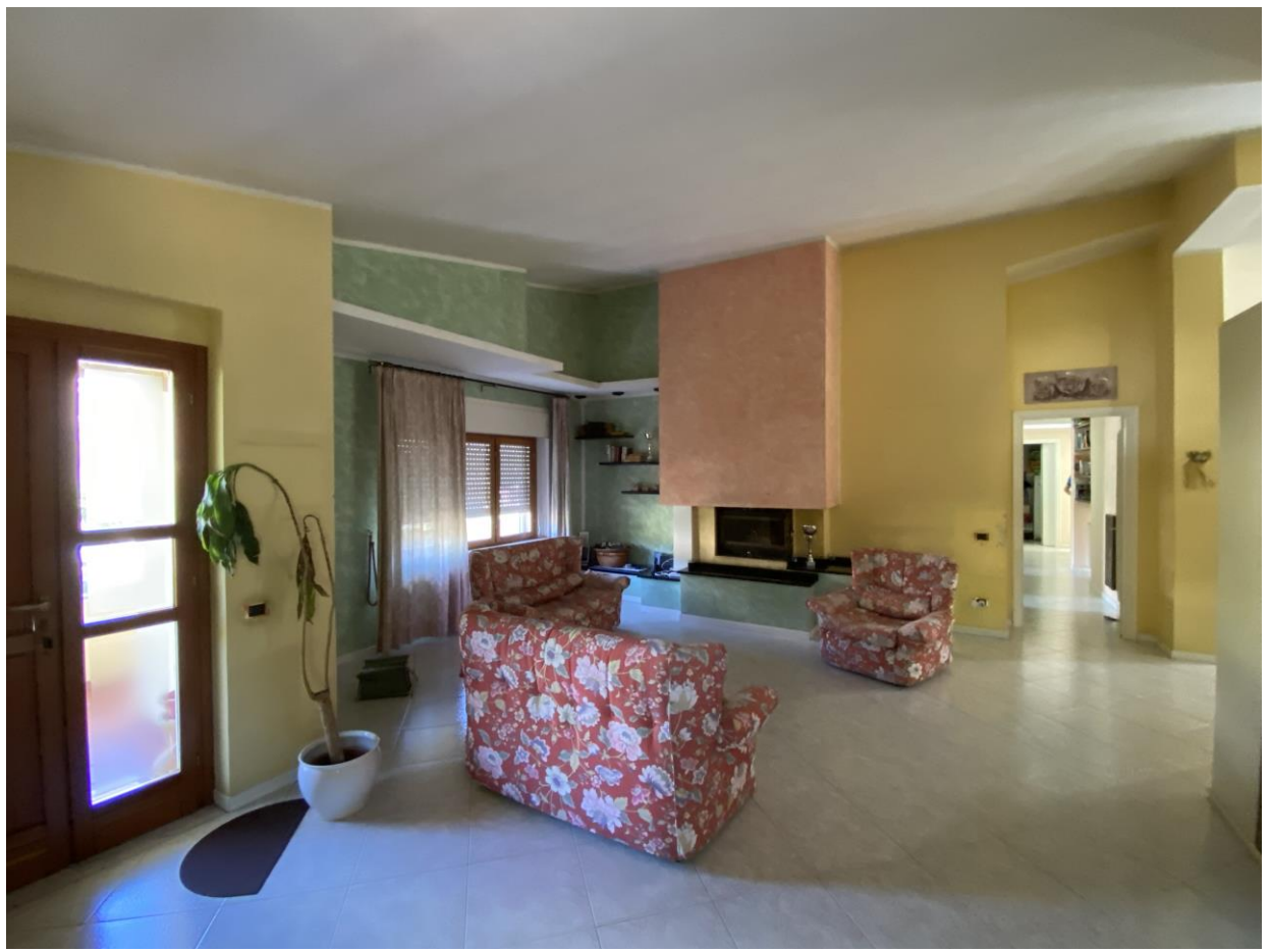
Foto 5 - Immobile A - Soggiorno