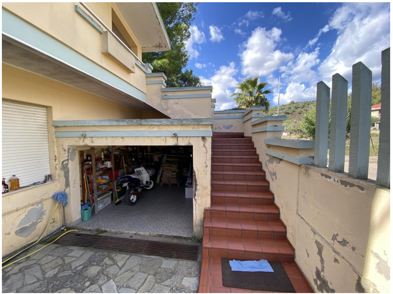
Foto 3 - Immobile A - Cortile (cantina e scala di accesso al primo piano)