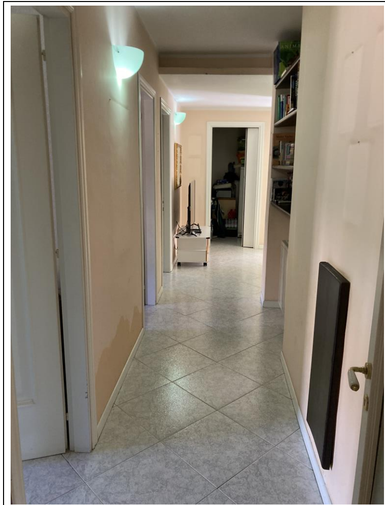
Foto 11 - Immobile A - Andito