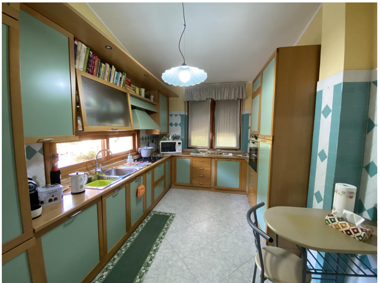
Foto 10 - Immobile A - Cucina