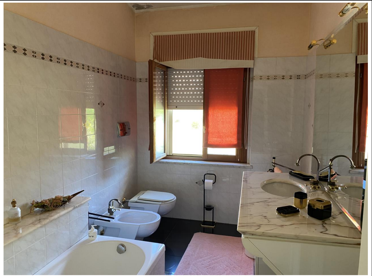
Foto 17 - Immobile A - Bagno 2