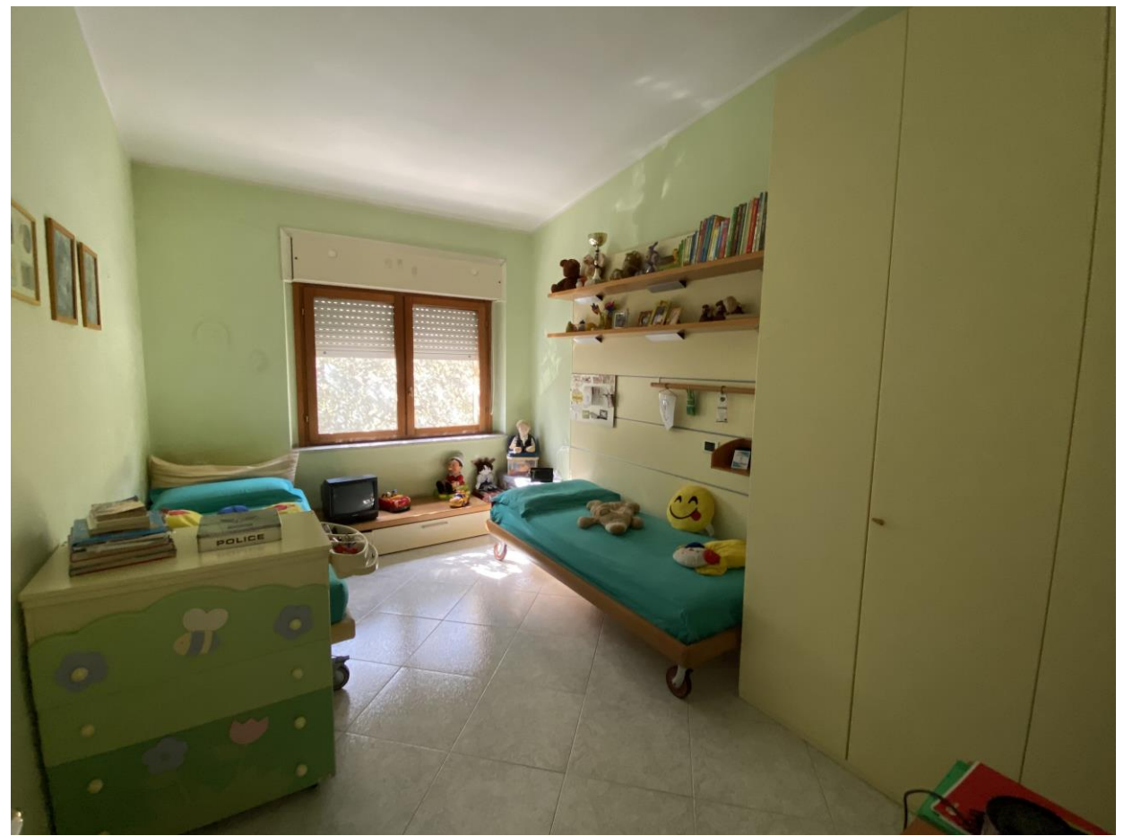
Foto 15 - Immobile A - Letto3