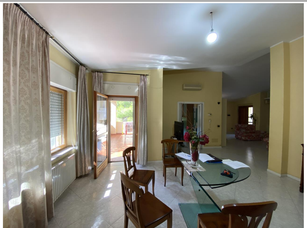
Foto 8 - Immobile A - Pranzo