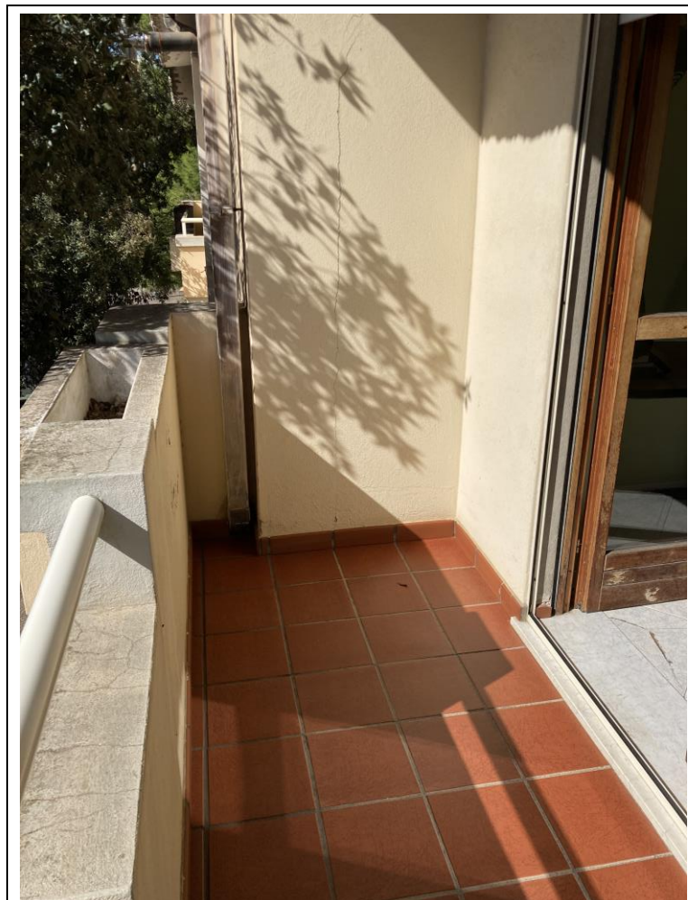
Foto 14 - Immobile A - Veranda 2