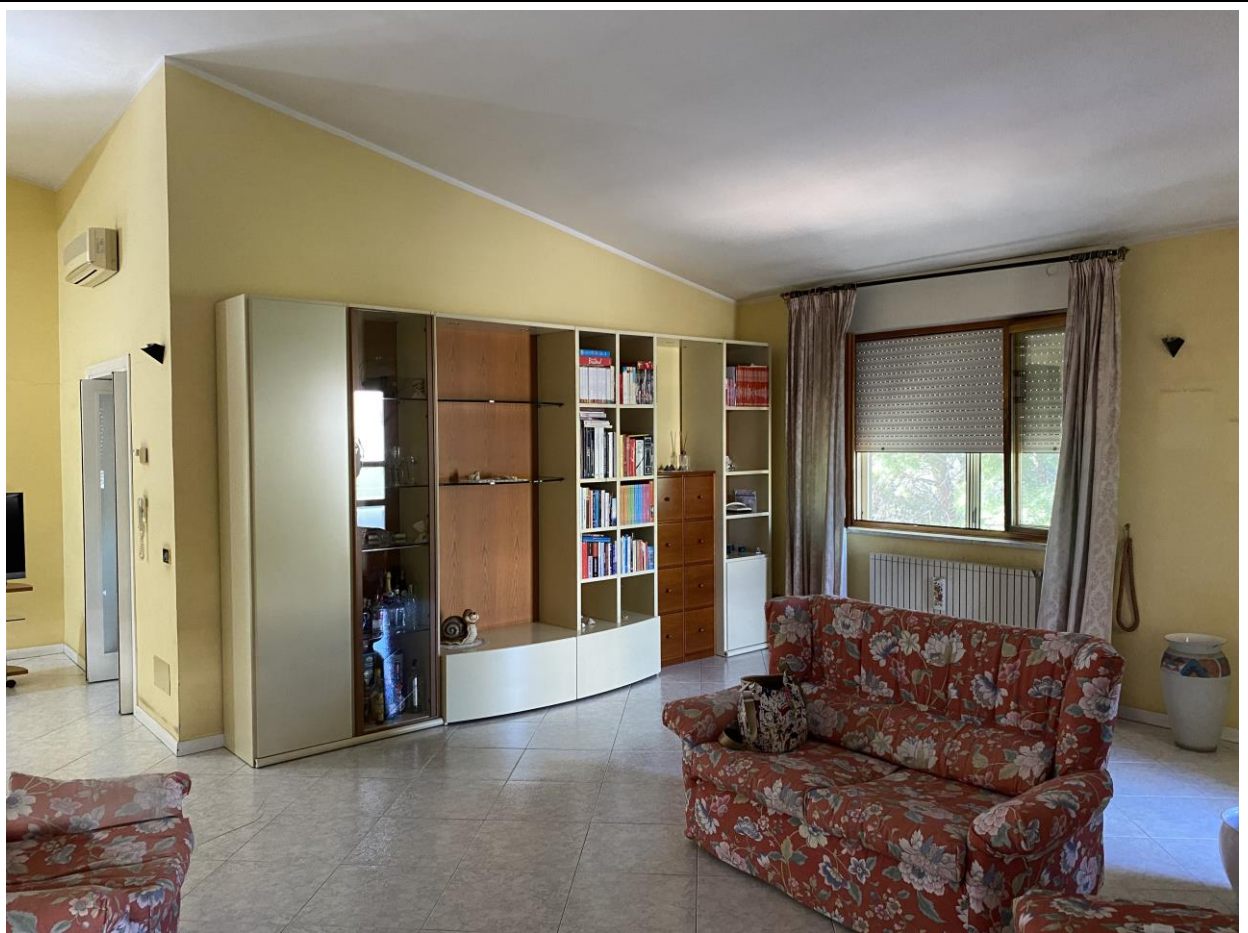
Foto 6 - Immobile A - Soggiorno