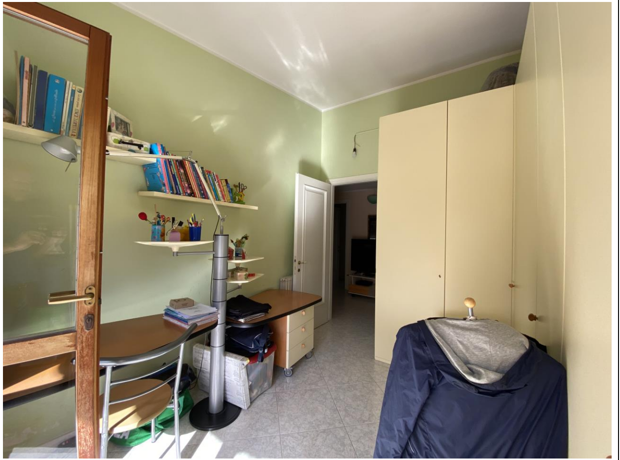
Foto 13 - Immobile A - Letto 2