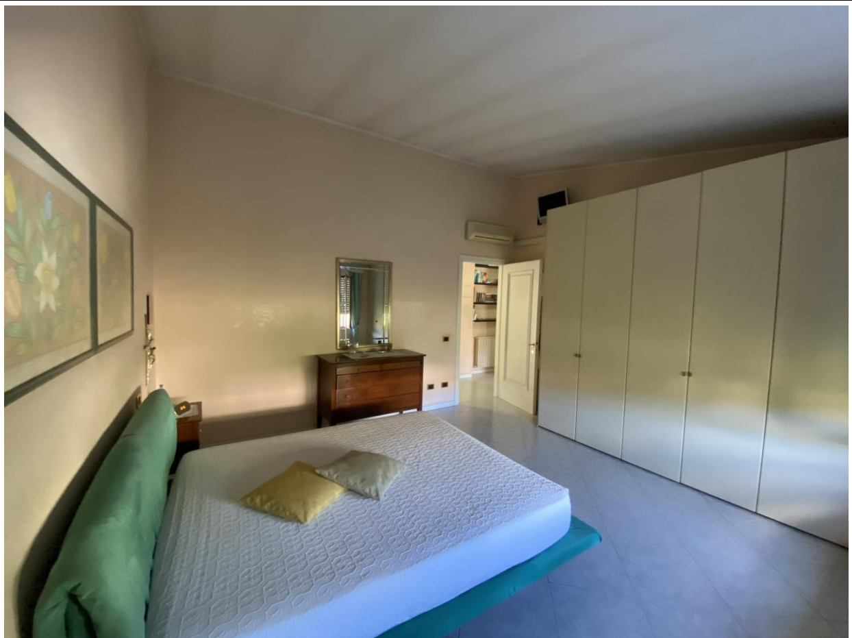
Foto 12 - Immobile A - Letto 1