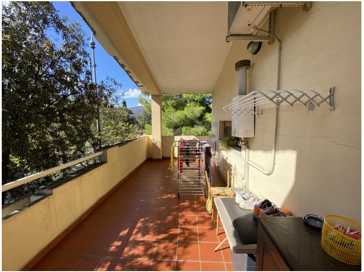
Foto 9 - Immobile A - Veranda 1