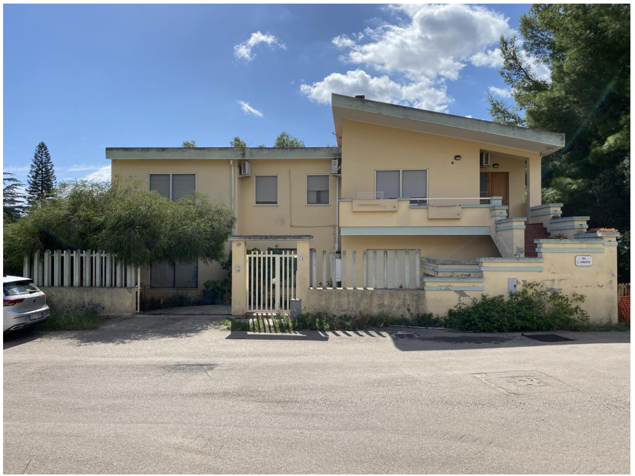
Foto 1 - Immobile A - Prospetto principale dalla via Ariosto